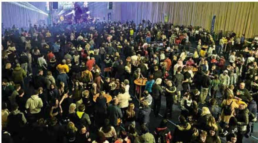
Po odpovedi vseh tekem so se organizatorji odločili, da kljub vsemu pripravijo večerno zabavo – največji slovenski apres-ski.