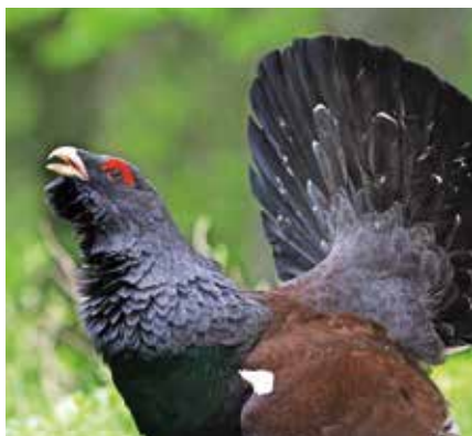
Divji petelin

Kaj lahko obiskovalci naredimo za ohranitev divjega petelina na grebenu Vitranca? Greben Vitranca obiskujemo samo poleti ali jeseni. Hodimo in smučamo samo po označeni poti. Smo čim bolj tihi. Pse vodimo na povodcu. Petelin nam bo hvaležen!