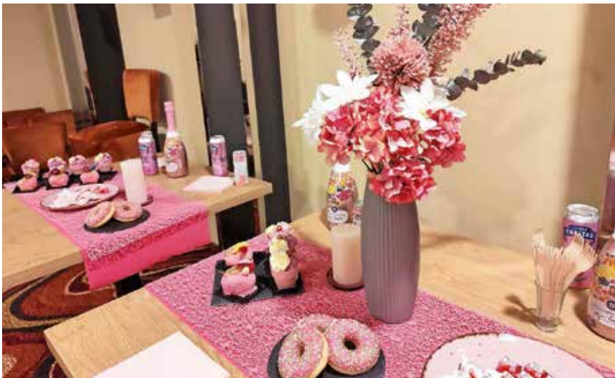
Praznično okrašene in obložene mize

stjam je bila na voljo vizažistka, ki jih je brezplačno uredila in jim svetovala pri ličenju. Gostjam je bil na voljo tudi prostor za sproščen klepet ob osvežilni pijači in sladkih prigrizkih, proti ve-