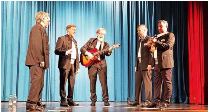
Člani klape Zvonimir z Baške na Krku

Turistično društvo Dovje - Mojstrana je tudi letos pripravilo dalmatinski večer. V goste so povabili prijatelje, člane klape Zvonimir iz Baške na Krku, ki so poskrbeli za to, da so misli zbranih v Aljaževem prosvetnem domu na Dovjem odtavale v toplejše kraje, proti morju in soncu. »Zdaj že tradicionalni glasbeni dogodek bogati kulturno delovanje našega kraja in društva. Turistično društvo si namreč prizadeva, da bi s svojim vsestranskim delovanjem in tradicionalnimi prireditvami negovalo in bogatilo našo kulturno dediščino, nas zblíževalo ter povezovalo v akcijah za razvoj kraja. Tako kot mi si tudi Baščani prizadevajo za ohranjanje tradicije in običajev. Dalmatinske, primorske in otoške klape skrbno ohranjajo starožitne melodije, v njih uživajo in jih podarjajo vsem tistim, ki jim je petje všeč,« so sporočili iz društva in dodali, da se zahvaljujejo družinam Kotnik in Višnar za nočitev in pogostitev. K. S.