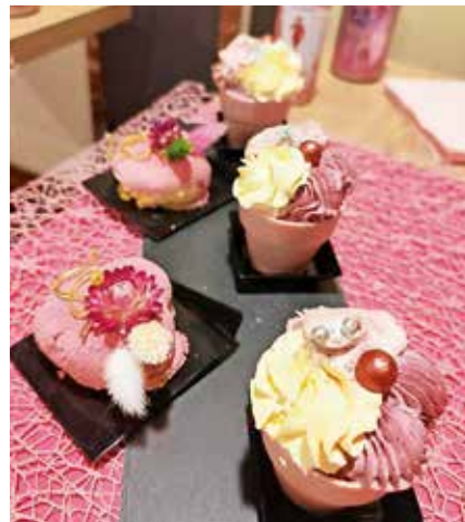
Gostjam so ponudili tudi sladke dobrote.

čeru so jim postregli še s samopostrežno večerjo, ki jo tudi sicer v Casinoku Larix organizirajo vsak petek. »Vsaki gostji igralnega salona smo na ta dan podarili tudi brezplačni igralni listič,« so še povedali gostitelji.