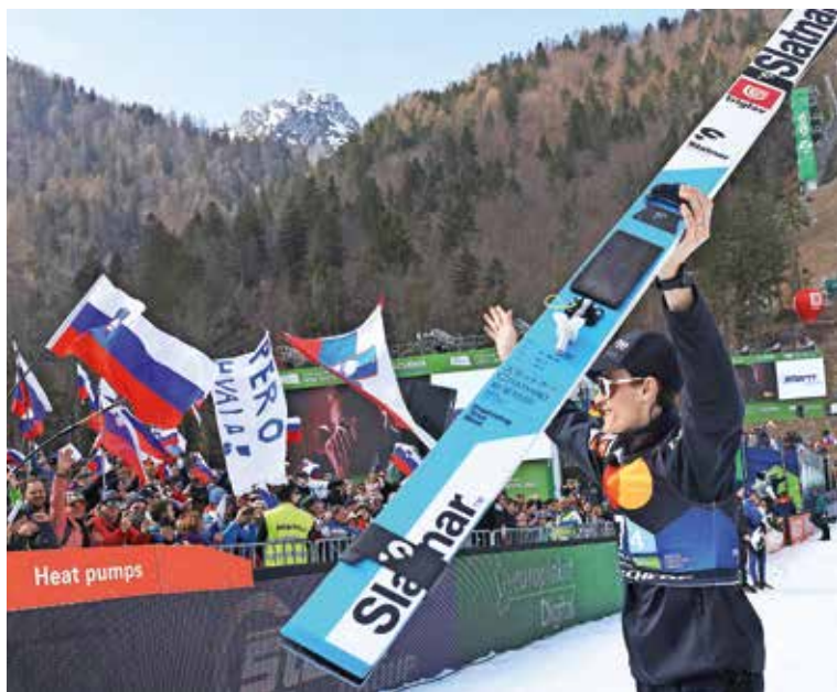
Planica je gostila številne junakinje in junake, ob 90-letnici skokov v dolini pod Poncami pa je najbolj odmevalo slovo šampiona Petra Prevca. / Foto: Gorazd Kavčič

V letošnjem letu mineva devetdeset let od prve mednarodne prireditve na prvi veliki skakalnici pod Poncami, saj je tekma z udeležbo takrat najboljših tujih skakalcev v Planici prvič potekala 25. marca 1934.