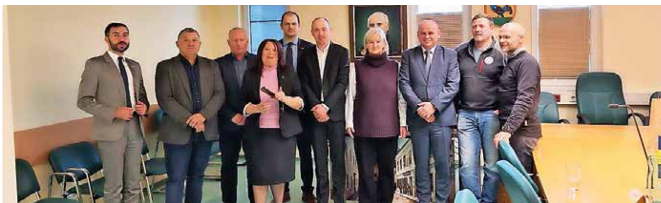
Prijazen sprejem bolgarskih gostov na sedežu Občine Kranjska Gora

ogled tekme za Pokal Vitranc, želeli pa so se seznaniti tudi s strategijo poletnega turizma v občini Kranjska Gora. Sogovorniki so se na srečanju dotaknili različnih tem, izmenjali so si predvsem informacije na področju turizma in gorskega reševanja v obeh državah. Kot so povedali, je, kljub temu da je tekma odpadla, obisk dosegel svoj namen.