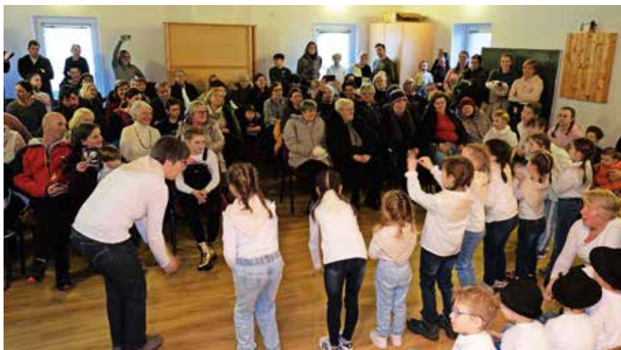
Prireditev je bila instrumentalno, pevsko in plesno obarvana.