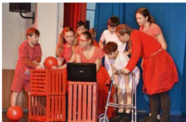
Na premieri predstave Kri