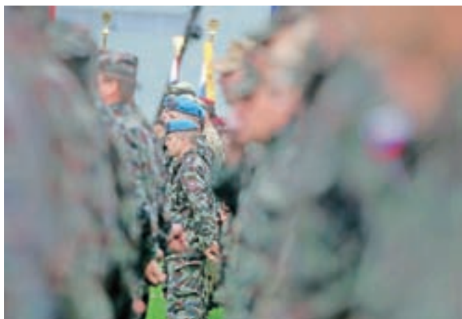
Državni zbor je potrdil novelo zakona o obrambi, ki bo izboljšala položaj vojakov po 45. letu.