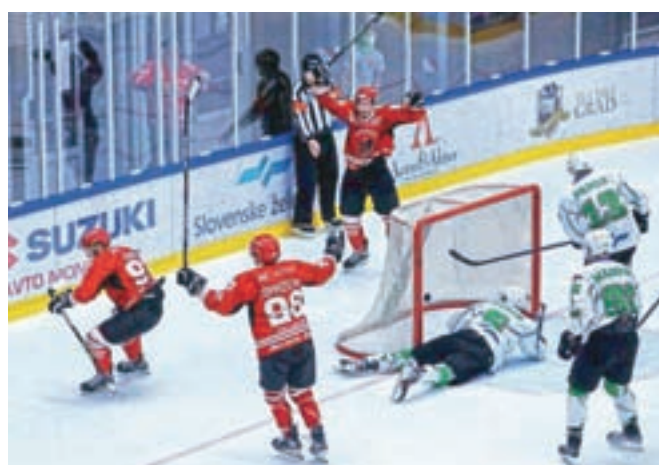
Hokejisti moštva SIJ Acroni Jesenice so proti SŽ Olimpiji slavili na obeh dosedanjih tekmah.

Kranj – Zaradi pandemije covid-19 se je zadnja sezona Alpske hokejske lige končala predčasno, tudi potek letošnjega tekmovanja pa bo drugačen, kot smo bili vajeni. Zaradi varnostnih pravil bo 16 moštev prve tri tedne igralo v štirih tako imenovanih regijskih skupinah s po štirimi udeleženci, ki bodo igrali po dve medsebojni tekmi (doma in v gosteh). V prvi skupini so Bregenzerwald, Lustenau, Kitzbühel in Feldkirch, v drugi Steel Wings Linz, KAC II, SIJ Acroni Jesenice in HK SŽ Olimpija, v tretji Pustertal, Red Bull Juniors, Wipptal Broncos in Ritten ter v četrti Asiago, Fassa, Val Gardena in Cortina Hafro.