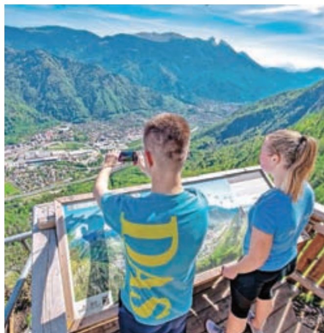
Razgledna ploščad na razgledišču Špica

V jeseniški občini so že pred časom začeli projekt Pohodništvo, v sklopu katerega želijo spodbuditi pohodništvo in poskrbeti tudi za ustrezno označitev in vzdrževanje pohodniških poti. Prav ureditev tematske poti Pot po Mežakli je bila ena največjih aktivnosti v sklopu projekta. Lani poleti so na razgledišče Špica postavili razgledno ploščad, na območje padca