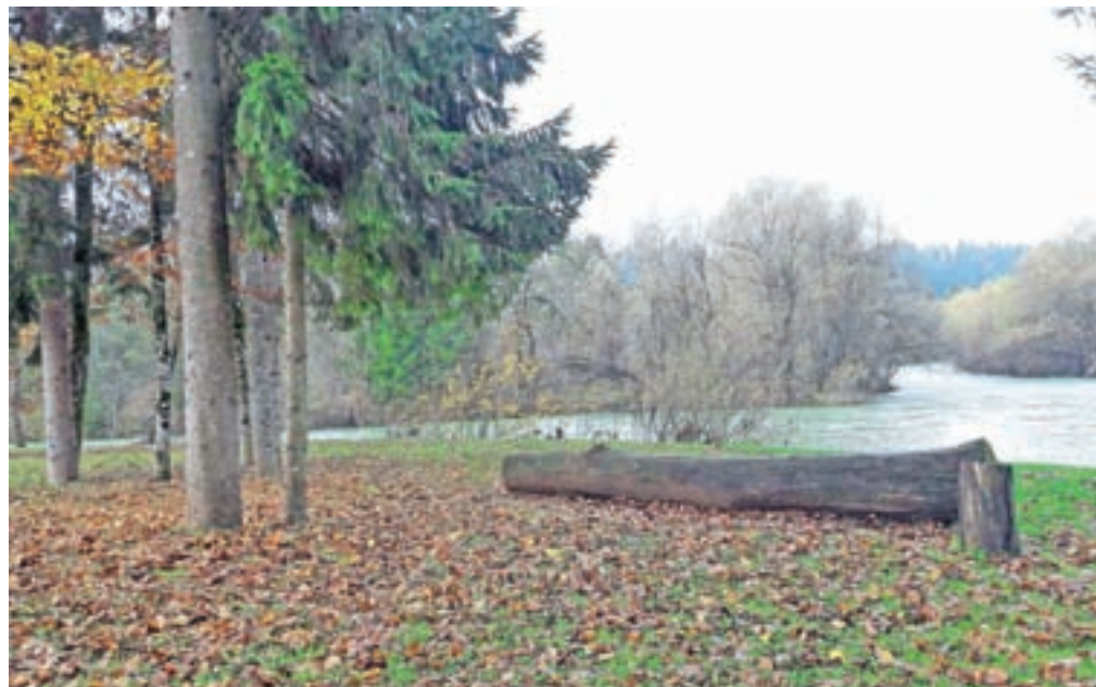
Sotočje Save Bohinjke in Save Dolinke na Lancovem pod Radovljico, kjer naj bi po načrtih investitorja uredili turistično-rekreativni center