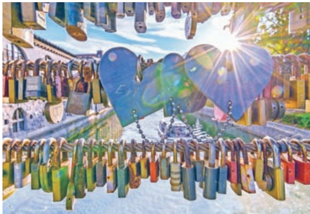
Zmagovalna fotografija t. i. mostu ljubezni čez Ljubljano

v zadnjem času prijel vzdevek most ljubezni, saj je postal kraj, kjer pari proslavijo svojo zaljubljenost s simboličnim zaklepanjem ključavnice na žičnato ograjo. »Mislim, da sem ubral povsem drugačen pristop kot drugi. Večina fotografij je združevanje ljudi v infrastrukturo prikazovala z mostovi, cestami, pristanišči, podobno kot tudi jaz s tretjevrščeno fotografijo, na zmagovalni pa sem poudaril tudi povezovanje med ljudmi na osebni ravni.« je prepričan Tarfila, ki bo za nagrajeni fotografiji prejel tudi bogati denarni nagradi, prvih dvanajst uvrščenih fotografij pa bo predstavljenih