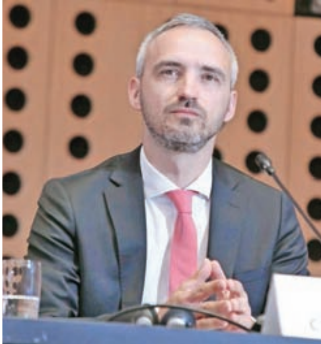
Minister Janez Cigler Kralj

Stvar odločitve vsakega posameznega doma starostnikov je, ali se bo dom zaprl, je poudaril minister in dodal, da se lahko vodstvo doma za to odloči, če oceni, da je lokalna epidemiološka situacija tako zahtevna, da je ukrep nujen. »Izjemno po-