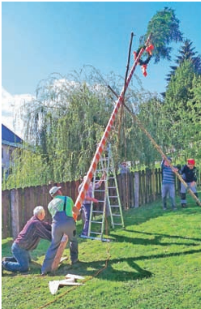
Ob obletnici vrtca so se odločili, da »slavljenču« postavijo tudi mlaj.