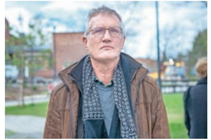
Švedski zdravnik epidemiolog Anders Tegnell, avtor švedske strategije boja proti koronavirusu