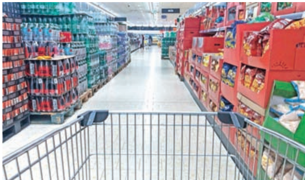
Kupci smo se na zaprte trgovine ob nedeljah navadili že spomladi, ko niso smele obratovati zaradi spopadanja z epidemijo koronavirusa.

V Levici, ki je predlagala spremembo zakona, so sledili pozivu Sindikata delavcev trgovine Slovenije v poslanci pred praznikom dela, naj trgovine ob nedeljah in na dela proste dni tudi po koncu epidemije covid-19, ki je praktično ustavila javno življenje, ostanejo zaprte. »V trgovinski dejavnosti na široko je zaposlenih okrog 115.000 ljudi, del teh jih mora delati ob nedeljah, kar pomeni, da nedelje nimajo kot prostega dneva je ne morejo preživeti s svojo družino,« je v imenu predlagateljev dejal Luka Mešec. Njihov predlog je sledil tudi volji volivcev, ki so leta 2003 na referendumu s