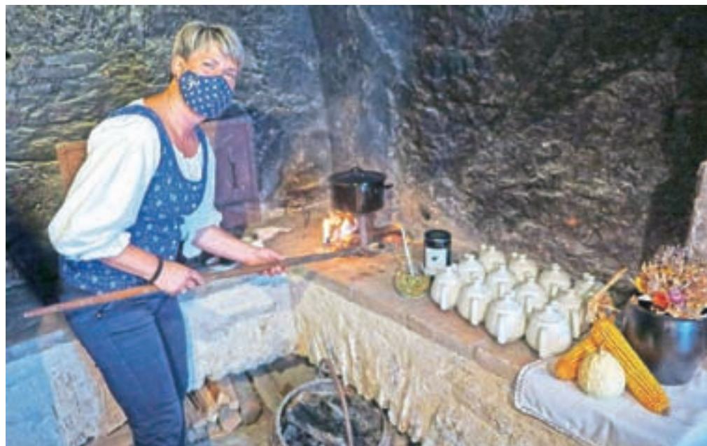
V črni kuhinji na Visokem po novem pripravljajo tudi terjakov čaj, ob katerem postrežejo domače buhteljne.