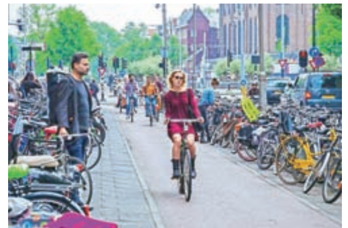
Za kontrast gladiatorskemu Tour de Franceu tale fotografija »navadnega kolesarjenja«, posneta v Amsterdamu 2. junija 2014