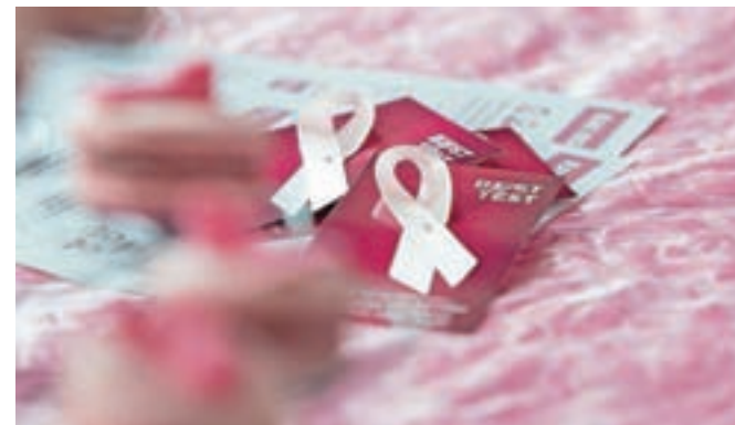
Rožnata pentlja kot simbol solidarnosti in boja proti raku dojk

Dnevnik za bolnice Nekaj mojega je novost. Namenjen je bolnicam, ki se prvič spopadajo z diagnozo raka dojk. Zasnovan je kot praktični vodnik skozi zdravljenje, hkrati pa usmerja bolnico skozi izkušnjo bolezni in iskanje globljega stika s seboj. Nastal je na pobudo