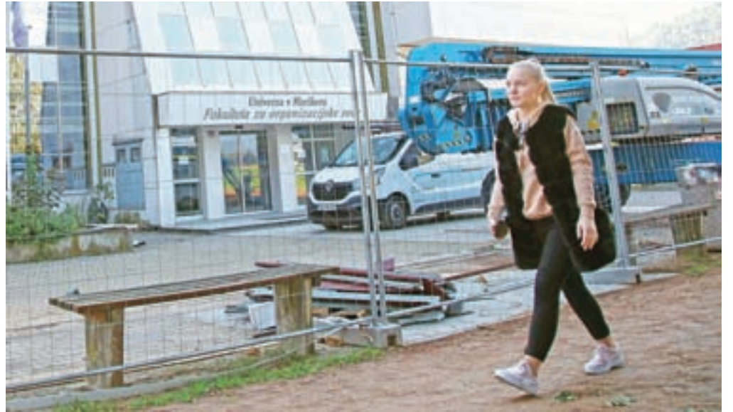
Na kranjski fakulteti za organizacijske vede so študij začeli na daljavo.

Kot so navedli na ministrstvu, je med mladimi največ zanimanja za umetniške programe in dizajn, za programe s področja športa, psihologije, zdravstva in socialne varnosti, veterine, varstvoslovja, predšolske vzgoje, izobraževalne znanosti in izobraževanja učiteljev ter informacijske in komunikacijske tehnologije. Manjši interes pa opažajo na naslednjih področjih: poslovne in upravne vede, tehnika, proizvodne tehnologije in gradbeništvo ter kmetijstvo, gozdarstvo in ribištvo. Ministrstvo je visokošolskim deležnikom sredi septembra posredovalo smernice za izvedbo študijske dejavnosti v zimskem semestru letošnjega študijskega leta, ki jih bodo sproti posodabljali glede na epidemiološke razmere v Sloveniji. Pri pripravi smernic so poleg NIJZ sodelovali tudi