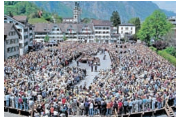
Švicarji poznajo tudi »neposredno demokracijo«, odločanje na ljudski skupščini (Landsgemeinde). Ta je bila v kantonu Glarus 7. maja 2006.