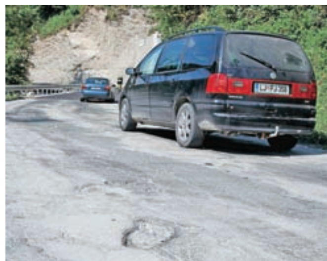
Na poškodovani regionalni cesti tik pred nedavno saniranim odsekom nad Zalim Logom predvidevajo strojno krpanje vozišča.

Zali Log – Potem ko je direkcija za infrastrukturo oz. izbrani izvajalec Gorenjska gradbena družba (GGD) pred kratkim vendarle uredil cestni odsek ob lani sanirani brežini na regionalni cesti nad Zalim Logom (blizu odcepa za Ravne), so domačini ob težko pričakovnem zaključku investicije razočarano ugotovili, da je dobrih sto metrov ceste tik pred saniranim odsekom ostalo v katastrofalnem stanju. »Vsi smo pričakovali, da bo to sanirano v sklopu gradbišča,« nas je opozoril občan, ki se vsakodnevno vozi po tej