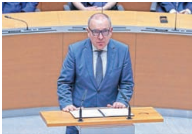
Finančni minister Andrej Šircelj je zadovoljen s proračunoma za leti 2021 in 2022 kljub načrtovanemu primanjkljaju.