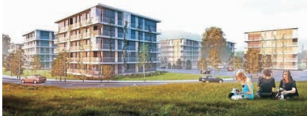
Nova soseska Ob Savi bo ponujala 187 stanovanj, graditi pa naj bi jo začeli čez dve leti.