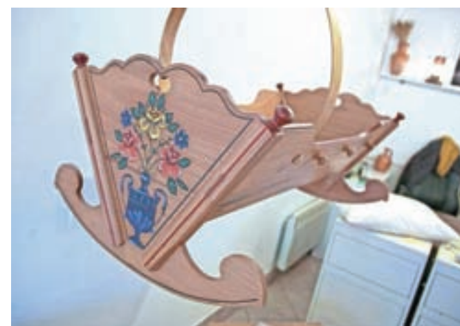
Razstavljena je tudi zibka, ki jo je izdelal za svojega prvega otroka.

ki delamo na takšen način. Izdelki pa so neuničljivi, za dvesto let.«