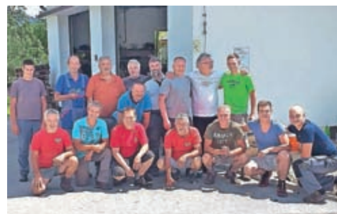
V PGD Zasip so se razveselili uporabnega dovoljenja za svoj gasilski dom.

zato februarja na Upravno enoto Radovljica vložili vso potrebno dokumentacijo. Pozitivni odgovor so dobili 20. aprila, odločba pa je postala pravnomočna 29. julija. »V tem času so na Upravni enoti Radovljica ugotovili, da bi morala biti streha doma v skladu s predpisi Občine Bled siva, zato je bilo treba komaj trinajst let staro