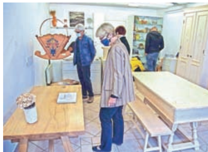
Razstava bo na ogled do 24. oktobra.

izdelki Antona Kosmača pa bodo na ogled do 24. oktobra. V njih se zrcalijo izjemna prefinjenost, lepota in uporabnost.