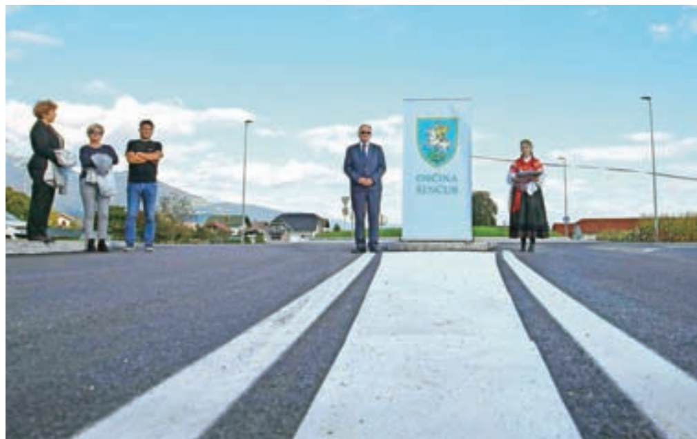
V Šenčurju so odprli obnovljeno Kranjsko cesto.