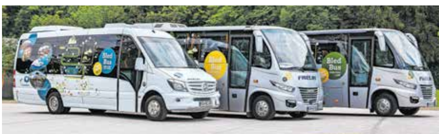
Bled Bus: poleti brezplačno po Bledu in na Pokljuko