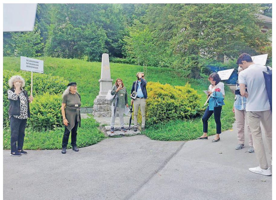
Maja bo potekalo 54. mednarodno srečanje pisateljev na Bledu v času vojne.

Slovenski PEN želi odpreti dve razpravi. Prva zadeva temo Bosna in vse svetovne »Bosne«. Bosna in Hercegovina skupaj s širšo regijo, tj. Črno goro, Severno