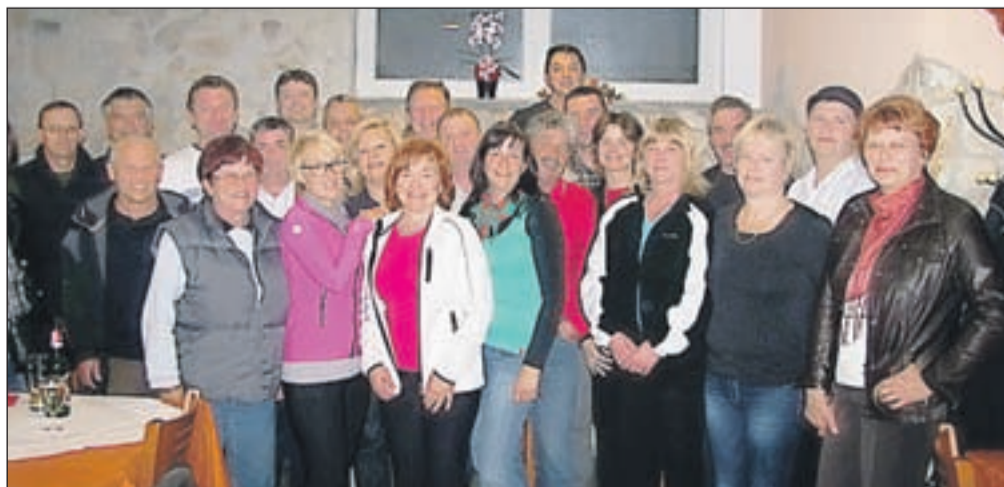
Krvodajalci z Orehka in Drulovke so zaključili krvodajalsko akcijo v tradicionalno gostoljubni domači Pizzeriji Karantanija.

Stražišču. Rdeči križ kot organizator krvodajalstva vabi prostovoljce, da se jih udeležijo v čim večjem številu.