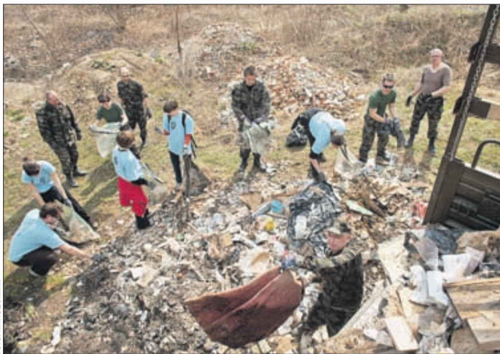
Kljub temu da je bila letos v Kranju že 11. čistilna akcija, je odpadkov še vedno veliko.