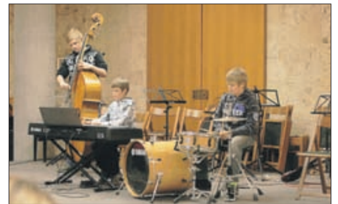
Bachova Museta za tri? Novodobni klasik-rokerji? Predvsem pa fantje iz družine Gabrijel

Sicer tradicionalni pustni koncert, ki ga vsako leto na malo drugačen način pripravijo v Glasbeni šoli Kranj, se je zaradi šolskih počitnic prelevil v Gregorjevega. V občinski avli so mladi glasbeniki »ptičke oženili« na dveh zaporednih nastopih, saj je program obsegal kar petnajst različnih točk, v katerih je nastopilo skoraj dvesto učencev. Vodja koncerta, neutrudna učiteljica klavirja Jasmina Pogachnik je s sodelavci nastop zasnovala na narodnih in ponarodelih pesmih ter na skupinskem muziciranju. Na obeh koncertih so se predstavili tudi pevski zbor, orkestra kitar in harmonik, nadobudne učiteljice pa so zbrale najmlajše v dva orkestra »črvičkov« okrog trideset malih godalcev in nekaj manj malih flavlistov. Poleg tega so zaigrali v komor-