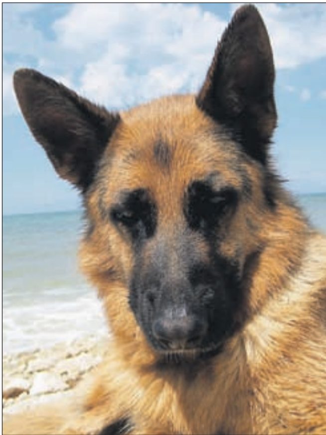
Pse obvezno cepimo proti steklini, ki je nevarna tudi človeku.

Tudi muce je treba začeti cepiti kmalu po rojstvu. Cepimo jih proti mačji kugi in rinotraheitisu. Cepljenje se začne pri osmih tednih. Naj opozorimo, da tudi muce, ki z lastniki potujejo po svetu, potrebujejo cepljenje proti steklini. Cepimo jih lahko po dopolnjenih 12 tednih, nato pa se ponavlja v letnih intervalih, podobno kot pri psih.