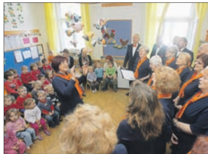
Pevski zbor Iskra Kranj je navdušil otroke iz vrtca Čira čara.