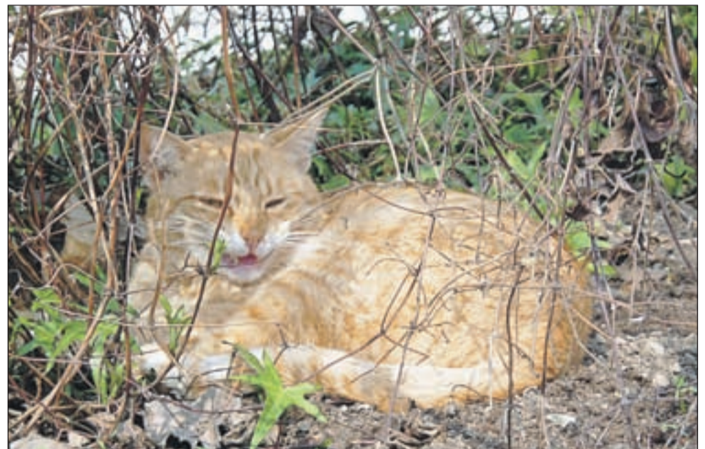
Tudi muce je potrebno zaščititi proti boleznim, če potujejo z nami po svetu, pa je cepljenje proti steklini obvezno.

Za dodatne informacije lahko pokličete na telefonske številke 041 920 064, 041 588 829 in 041 691 243.