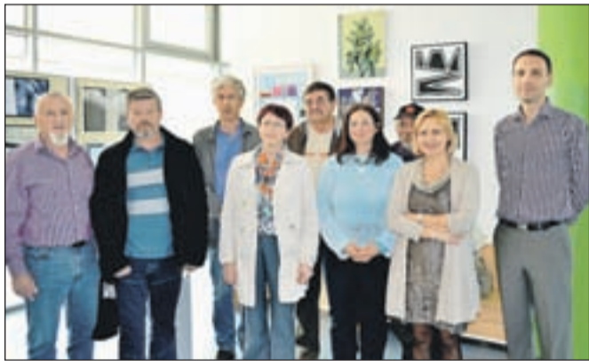
Likovniki kolonije Jasna že drugič gostujejo na Gimnaziji ESIC.