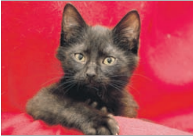
Alberto je razigran, nežen, nagajiv muc, ima rad ljudi, mačke in pse. Pokličite na številko 041/991 682.