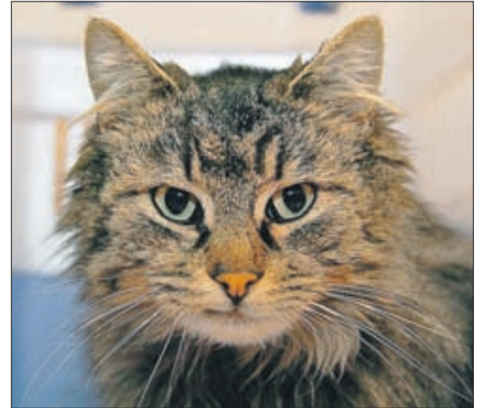
Ares je zelo prijazen in crkljiv muc. Najrajši se spravi v naročje, zvije v kepico in uživa. Ima mačji aids, a nima kliničnih znakov, zato živi normalno življenje. Bil bi dobra družba kakšni muc, ki ima tudi aids. Ocenjen mesec kotitve je marec 2011. Pokličite na številko 040/858 059.

Veterinarska ambulanta Vinko Pristov, s. p., Hraše 20 a, 4248 Lesce, mobitel: 041 691 243, faks: 05 911 28 93, www.veterinapristov.si, elektronska pošta: vinko.pristov@telemach.net