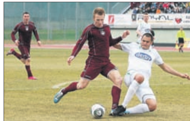
Nogometaši Triglava so v spomladanskem delu prvenstva najbolj navdušili na tekmi proti Mariboru, proti Olimpiji (na sliki) pa jim je zmanjkalo tudi nekaj sreče.