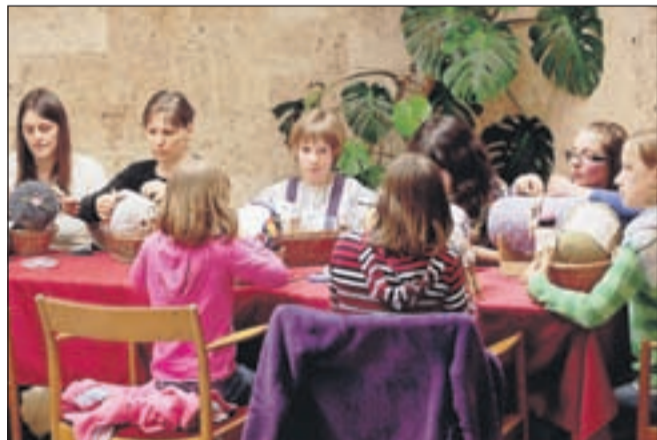
Klekljarice, od izkušenih do najmlajših, so rade volje pokazale umetnost izdelovanja čipk.