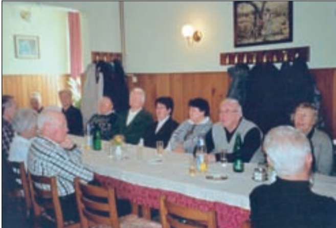
Upokojenci Elektra Gorenjske so imeli občni zbor v gostišču Pri Slavki v Podbrezjah.

mesec že bili na izletu na gradu Devin in Tržaškem krasu, aprila bodo odšli v Loški Potok in na grad Snežnik, 27. aprila bodo znova udeleženci Poti prijateljstva. Maja načrtujejo piknik, junija izlet v Porabje, avgusta bodo odšli na Lisco, septembra pa jih čaka najprej srečanje z gorenjskimi upokojenci, splavarjenje po Savi in udeležba na Festivalu za 3. življenjsko obdobje. Oktobra se bodo odpravili proti Kočevju, novembra na izlet v neznanu z martinovanjem, decembra pa bodo obiskali starejše in bolne člane društva. Ob pestrih aktivnostih vabijo vse upokojence Elektra Gorenjske in Gorenjskih elektrarn, da se jim pridružijo. Več informacij dobijo po telefonu 04/25 51 149.