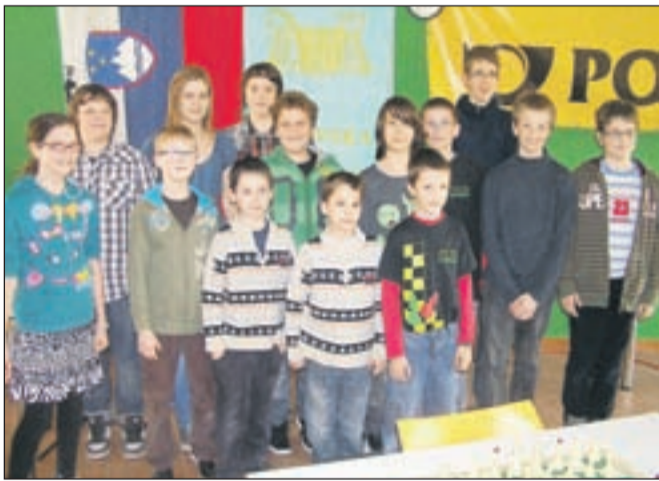
Uspešni mladi šahisti Šahovske sekcije Tomo Zupan Kranj