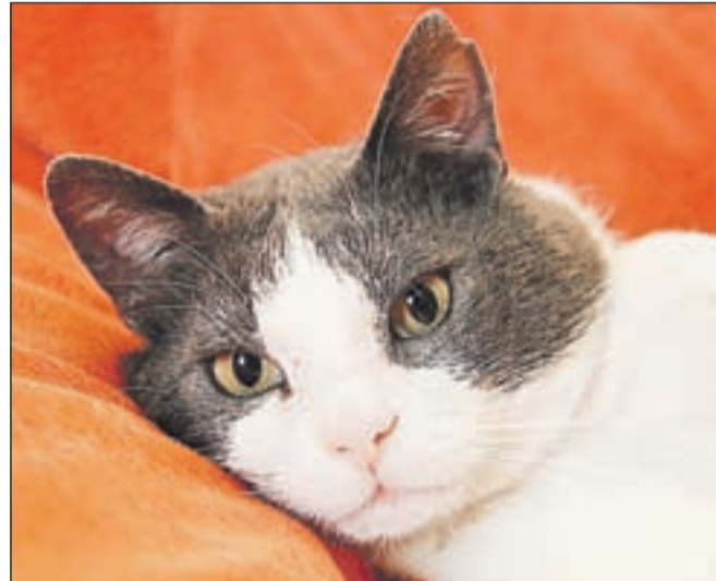
Arthur je starejši muc, ki obožuje ljudi in se rad crklja, a bi bil najbolj vesel, če bi bil edini muc v stanovanju. Pokličite na številko 040/858 059.

dem priporočamo, da o bolezni več preberejo tudi na spletu, z morebitnimi vprašanji pa se lahko obrnejo tudi neposredno na nas,« še svetuje Lahova.