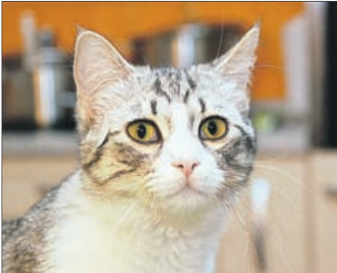
Živahna, radovedna in zelo prijetna mlada muca. Obožuje ljudi, rada ima tudi mačjo družbo. Pokličite na številko 041/991 682.