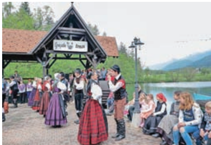
Ob jezeru so zaplesali domači folkloristi.