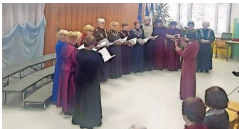
Preddvorske pevke na srečanju upokojenskih pevskih zborov Gorenjske