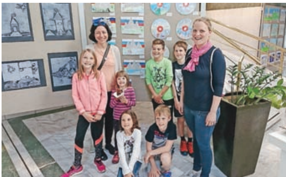
Kokrjani