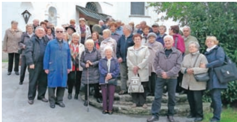
Z najstarejšimi na izletu