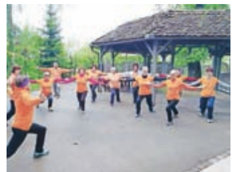
Jutranje razgibavanje članov Šole zdravja

Dan se članom Društva Šola zdravja začne v dobri družbi, živahno, veselo, nasmejana ... Vsako jutro (razen ob nedeljah in praznikih) se dobimo na dvorišču gostilne Majč, poklepetamo, se informiramo o prihajajočih dogodkih, razgibamo od glave do pete in polni sveže energije zakorakamo v nov dan. Verjetno je že kdo pomislil, le kdo razen upokojencev lahko hodi ob 7.30 na telovadbo. Jutranjih vadb se večinoma res udeležujemo upokojenci, nekateri pa pridejo pred službo ali ko imajo službo v popoldanski izmeni. Lahko se nam pridružite tudi samo ob sobotah in spoznali boste dokaj enostavne in zelo učinkovite vaje, ki jih boste