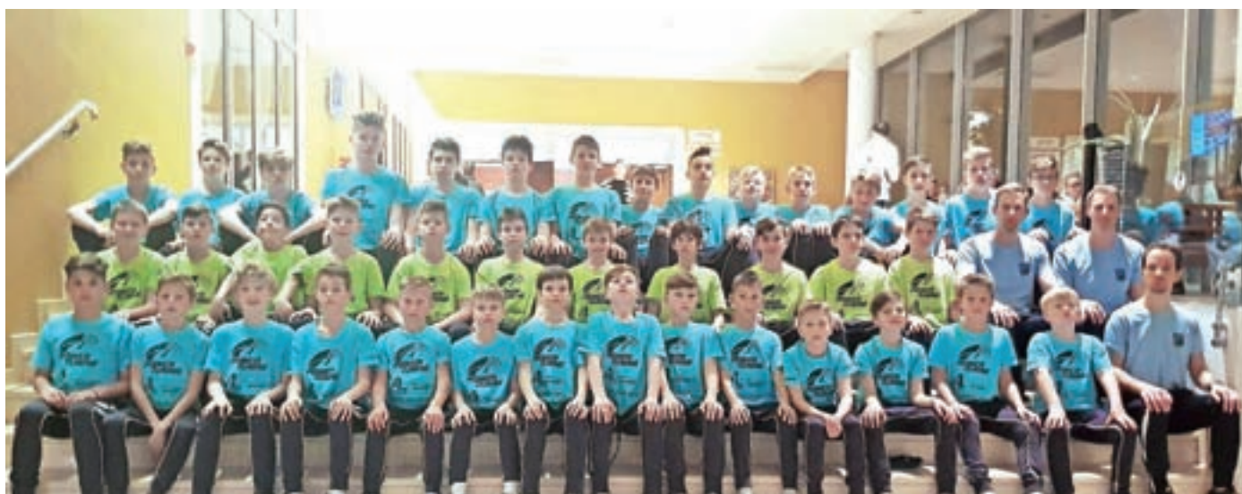
Mladi nogometaši, pripravljeni na športne izzive

Takoj po koncu nogometnega dela sezone pa nas čakata še dve najbolj tradicionalni in največji prireditvi v organizaciji ŠD Preddvor. Najprej bo v soboto, 15. junija, Srečanje nogometnih generacij NK Preddvor, teden dni kasneje, v soboto, 22. junija, pa v okviru občinskih praznovanj še Prvenstvo občine Preddvor v malem nogometu. Prijave na ta domači prestižni turnir sprejemamo do vključno srede, 19. junija. Tako igralci kot tudi vsi zvesti navijači ter ostali ljubitelji športa vabljeni, da se v čim večjem številu udeležite naših dogodkov.