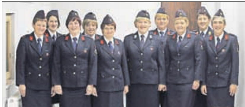
Članice Prostovoljnega gasilskega društva Križe