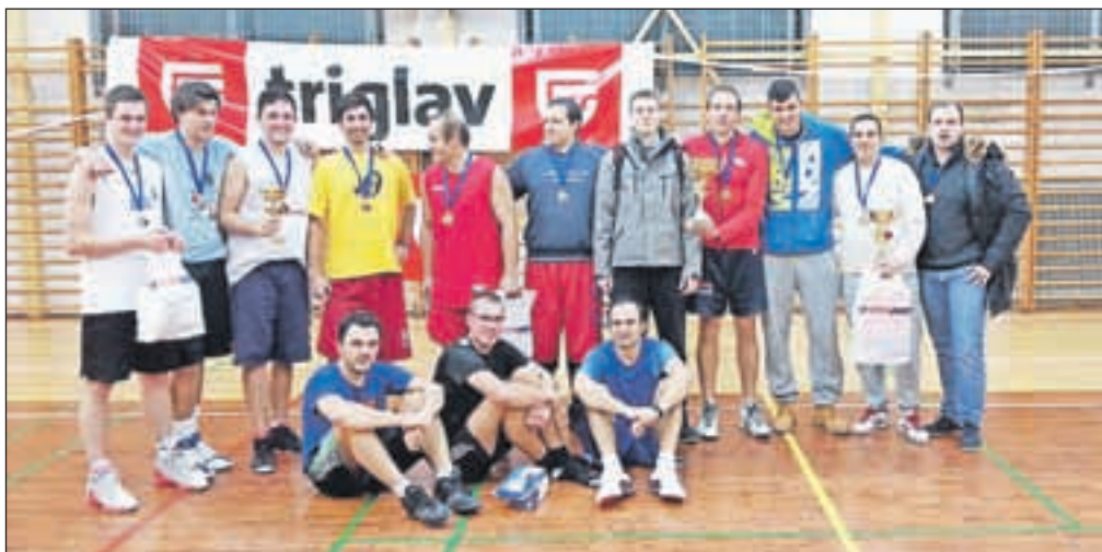
Najboljše štiri ekipe na turnirju trojk v košarki

»Ja, v tem nisem našel, za sedaj zgolj plezam in v tem še vedno uživam. Ker sem se z ženo preselil v Rakek, kjer sem odprl svoje društvo, imam željo, da bi tam postavil plezalno steno, kjer bi lahko ta šport predstavil tudi domačinom. Kot sem se že pogovarjal z njimi, bi bili nad tem zelo navdušeni, saj želijo otroke vključiti v kakšnega od športnih klubov, ki jih tam ni ravno veliko. Vendar pa je to velik projekt.«