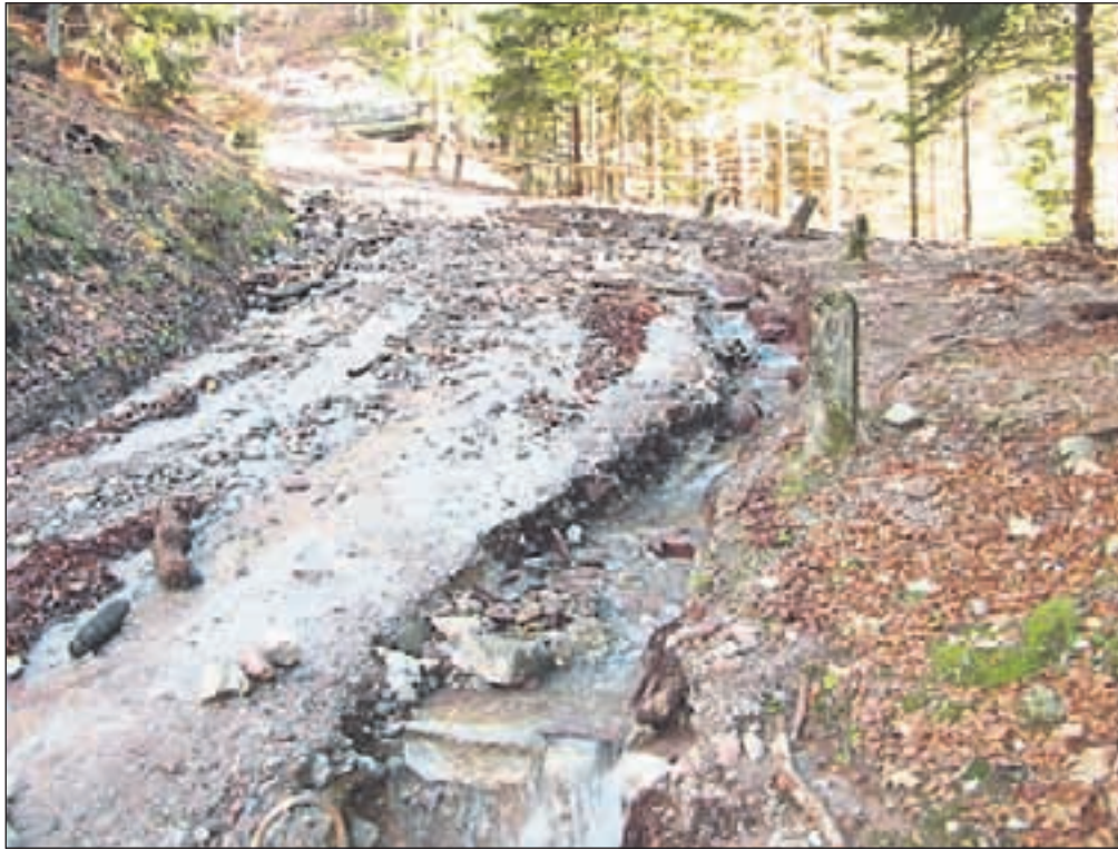
Takole je bila po novembrskih obilnih padavinah videti cesta na stari Ljubelj. Občina je že poskrbela za urgentno čiščenje in vzpostavitev prevoznosti.

Na makadamski cesti na stari Ljubelj je prišlo do zamašitve popusta, zato je hudournik udaril na cesto in odnesel okoli dvesto metrov vozišča. Občina je že poskrbela za urgentno čiščenje in vzpostavitev prevoznosti. Prav tako so naplavine že