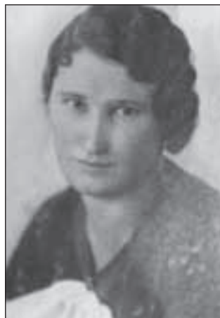
V mladih letih ...