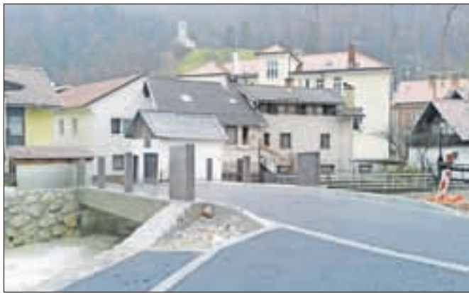
Rekonstrukcija mostu na Blejski cesti

Avgusta smo v sklopu projekta Prenova ulic v starem mestnem jedru Tržiča – II. faza začeli z rekonstrukcijo mostu na Blejski cesti. Trenutno so dela na mostu v zaključni fazi, cestišče je asfaltirano, potrebno je le še postaviti varnostno ograjo. V sklopu rekonstrukcije mostu smo izvedli tudi nadvišanje obstoječega kamnito betonskega obrežnega zidu in izboljšali poplavno varnost na tem odseku. Novembra smo asfaltirali tudi Cankarjevo cesto, in sicer od avtobusne postaje do bloka Cankarjeva cesta 12. Zgradili smo fekalno in meteorno kanalizacijo in uredili javno razsvetlavo. V sklopu projekta smo uredili tudi spodnji del hudournika Kukovica od usedalnika do izliva v prepust, ki teče v Tržiško Bistrico. Trenutno poteka še sanacija obstoječega zidu na Cankarjevi cesti. Operacija se izvaja v okviru Operativnega programa krepitve regionalnih razvojnih potencialov za obdobje 2007-2013. EU prispeva 85 odstotkov sredstev, Občina Tržič pa 15 odstotkov. M. D.