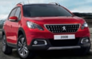
SUV PEUGEOT 2008

5 LET JAMSTVA IN VZDRŽEVANJA KASKO ZAVAROVANJE ZA 1 EUR KOMPLET ZIMSKIH PNEVMATIK