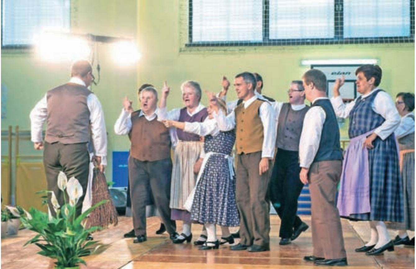
Na srečanju v Škofji Loki se je predstavila tudi skupina Jelčki.