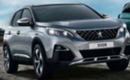
SUV PEUGEOT 3008