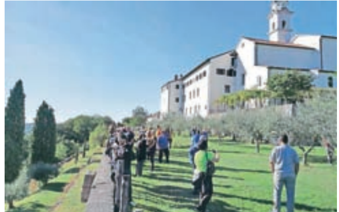
Prekrasen vrt kapucinskega samostana, ki ga obiskovalcem le redko pokažejo.

Po ogledu Vipave, Vinarskega muzeja in dvorca Lanthieri so se navdušili nad glampingom v osrčju gozda, kjer ponudnik