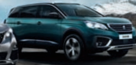
SUV PEUGEOT 5008