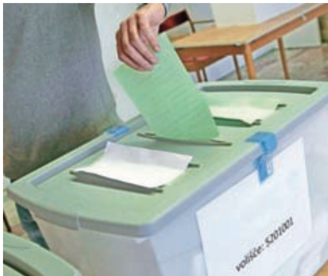
Z zadnjih lokalnih volitev leta 2014

Pred koncem minulega leta je državni zbor sprejel zakonsko novelo, ki določa stalni termin lokalnih volitev, in sicer tretjo nedeljo v novembru. Stalni termin volitev ima 15 evropskih držav, mi letos prvič volimo po tem načelu. Tokratne lokalne volitve so že sedme po vrsti. V državi se za županska mesta poteguje 688 kandidatov, od tega sto žensk; 87 je kandidatov v mestnih občinah, 601 v preostalih. Za občinske svete kandidira 22.306 kandidatov, od tega 10.198 žensk. V 27 občinah širše Gorenjske kandidira devetdeset kandidatov za župane. Kandidira 23 dosedanjih županov, v štirih obči-