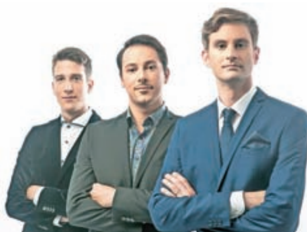
Trio Eroika Aromatika