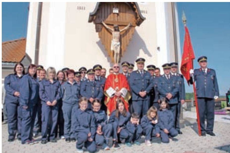
Florjanova nedelja prvič tudi na Spodnjem Brniku

in zbijanju tarče, prva tri mesta pa so osvojile ekipe PGD Cerklje. Mladina do 11 let je tekmovala v prenosu vode; slavila je ekipa PGD Cerklje 1 pred PGD Lahovče 2 in PGD Hotemaže 2. V tekmovanju za največ načrpane vode so bili najboljši PGD Hotemaže 1, PGD Cerklje 2 in PGD Hotemaže 2. Organizatorji so z mislimi že pri jubilejnem, 30. Barletovem memorialu, za katerega obljublajo, da bo nekaj posebnega.