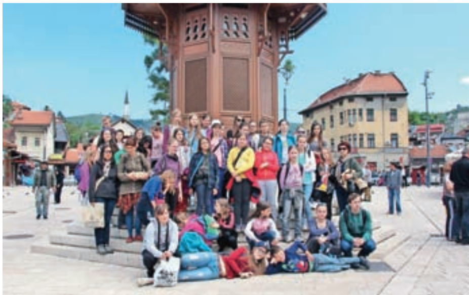
Cerkljanski učenci so se iz Bosne vrnili polni lepih spominov.