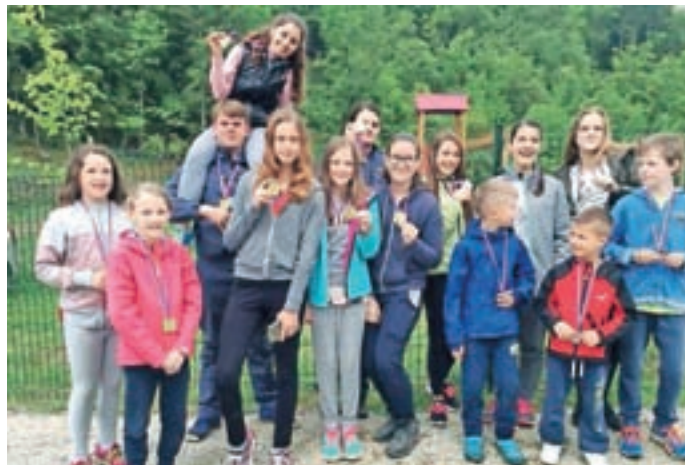
V PGD Lahovče smo ponosni na uspehe gasilske mladine.