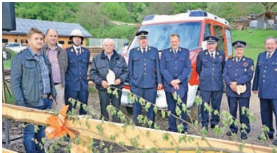
Novo gasilsko vozilo so na Štefanji Gori slovesno prevzeli v začetku maja.