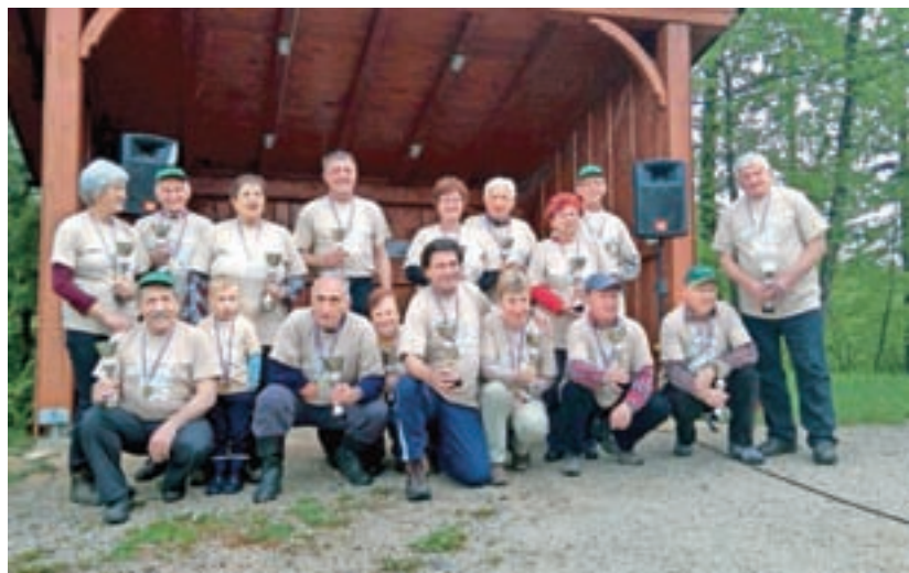
Pohodniki, ki so bili v enem letu na Štefanji gori več kot tristokrat.