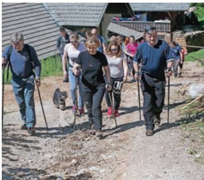
Dobrodelnega pohoda se je udeležilo okoli dvesto pohodnikov.

kovih na Zgornjem Brniku. »Ročna dela, kot so vezenje, kvačkanje, klekljanje, so bila poleg petja, plesa in igre pomemben delček v življenju naših mam in starih mam. Zato je naša skupna želja, da to kulturno dediščino ohranjamo in jo prenašamo na nove rodove,« pravijo Rožce.