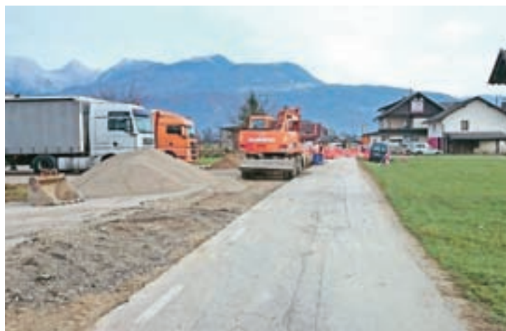
Nadaljevala se bo gradnja vodovoda na Zgornjem Brniku, in sicer proti letališču.

Nadaljevala se bo gradnja vodovoda Zgornji Brnik, v drugi fazi proti letališču. Pogodbo z najugodnejšim ponudnikom, Gorenjsko gradbeno družbo, v vrednosti 126 tisoč evrov so že podpisali. Letos je predvideno tudi dokončanje kanalizacije v naseljih Glinje in Lahovče. "V postopku je pridobivanje gradbenega dovoljenja za kanalizacijo v Ulici Josipa Lapajne v Cerkljah, sicer pa imamo trenutno v pripravi okoli deset projektov za ureditev kanalizacije in vodovoda tako sekundarnega kot primernega pomena, med drugim za Krvavsko cesto, odseke v Vopovljah, Spodnjem in Zgornjem Brniku, Zalogu ..., lotili smo se tudi visokogorskega območja," je dejal župan.