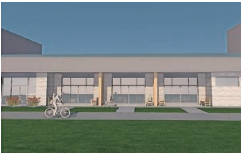
Enota za dnevno varstvo starejših