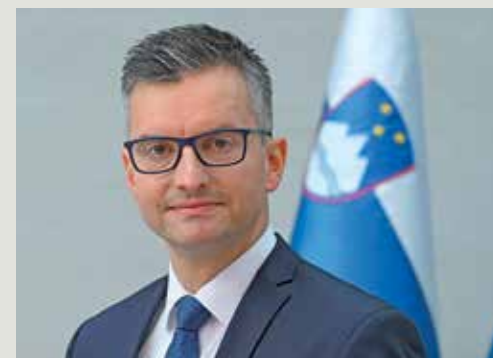
Marjan Šarec, minister za obrambo RS

general in pesnik Rudolf Maister - Vojanov, obranitelj slovenske severne meje, se je rodil 29. marca 1874 v Kamniku in umrl 26. julija 1934 na Uncu pri Rakeku. Leta 2024 tako zaznamujemo 150. obletnico njegovega rojstva in 90. obletnico njegove smrti. Kamnik ima tako še posebno čast, da njegov rojstni dan počasti kot občinski praznik. Rudolf Maister je bil v obdobju po drugi svetovni vojni prezrt in njegovega imena ni bilo zaželeno omenjati, kot to s ponosom počnemo danes. Vendar je bilo v Kamniku drugače, saj je Maister leta 1970 dobil veličasten spomenik, od leta 1995 pa njegov rojstni dan praznujemo kot občinski praznik. Zahvala gre modrim odločitvam vodilnih v Kamniku v omenjenem obdobju. Rudolf Maister ima velike zasluge za obstoj Slovenije v njenih današnjih mejah, brez kančka slabe vesti lahko trdimo, da brez njega danes države sploh ne bi imeli. Maister predstavlja najzlahtnejše, kar Slovenci premoremo. To sta naša vojaška tradicija, neločljivo prežeta z domoljubjem, in naša lepa slovenska beseda. Meč in pero sta nas ohranila skozi viharna obdobja naše zgodovine. Ni jih bilo malo. Maister je tisti, ki ne deli, temveč združuje. Je nasprotje vsem potem in stranpotem naše zgodovine ter nam zapušča bogato dediščino poguma in odločnosti, predvsem pa neizmerne ljubezni do domovine, ki je nikoli ne bi izdal in šel proti lastnemu narodu. Najmanj, kar lahko storimo, je, da mu izkažemo hvaležnost s svojo prisotnostjo ob njegovem spomeniku na praznik Občine Kamnik.