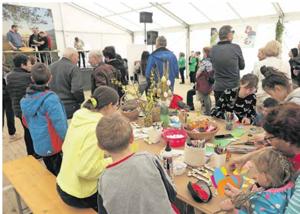
Kotiček z velikonočno delavnico

cem kaj pokazale, povedale o priznanjih in certifikatih, ki so si jih prislužile s kvačkanjem ali peko potice, domačim sirom ..., še bolj pa jih je razveselilo, če so tudi kaj prodale. Obiskovalci so lahko kupili vse od domačega kruha in potic do medu, domačih rezancev, lokalnih sirov