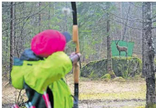
Tekmovanja se je udeležilo okrog sedemdeset lokostrelcev iz Slovenije, Hrvaške, Italije in Avstrije.

Lokostrelci tekmujejo v skupinah po štirje na tarčo. Po terenu je razvrščenih 28 tarč, ki so opremljene s številnimi in barvnimi količki, od koder se strelja na različnih razdaljah, odvisno od sloga in starostne skupine. Od belega količka streljajo najmlajši do 9. leta starosti,