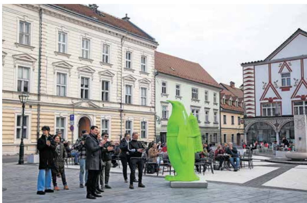
Zeleni pingvin na kamniškem Glavnem trgu