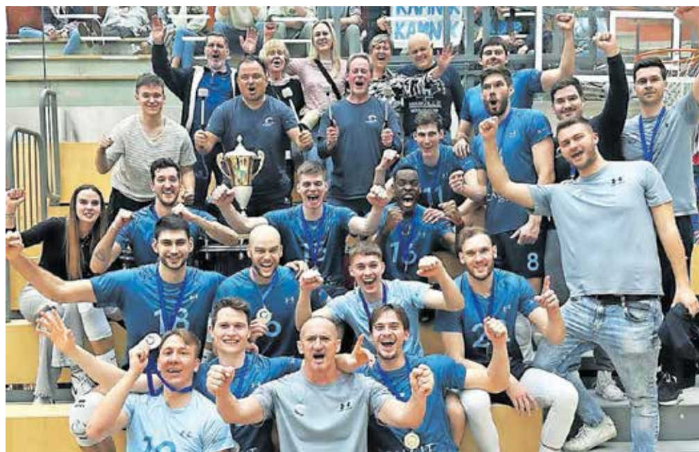
Zadovoljstvo ob prvi lovoriki kamniških odbojkarjev

»Upam, da bo to igralcem še povečalo apetite in da bomo šli v nedeljo po slovenski pokal v Koper, nato pa še po državno prvenstvo,« je še dodal izkušeni hrvaški strokovnjak na klopi Calcita Volleyja, ki si je pred zaključnim turnirjem