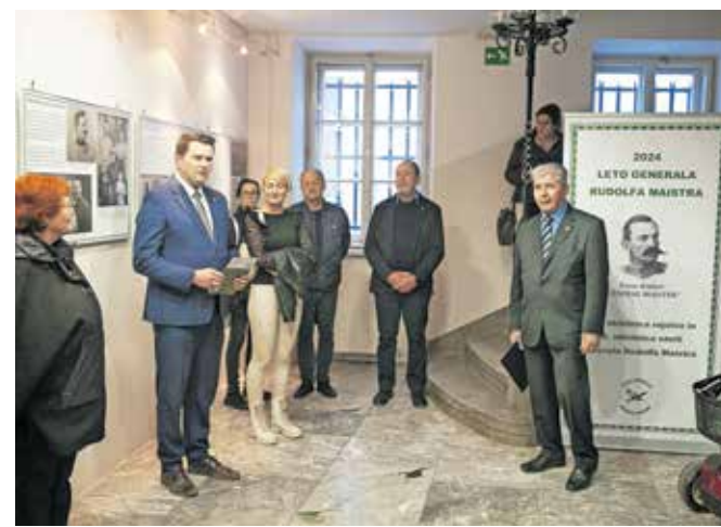
Odprtje razstave o generalu Rudolfu Maistru