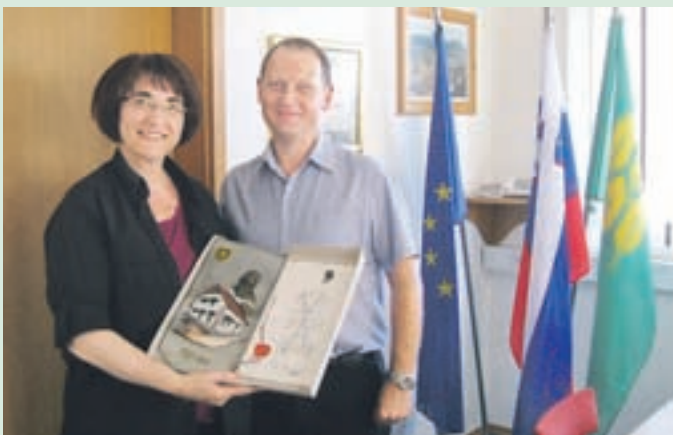
Župan z ministrico za obrambo Ljubico Jelušič