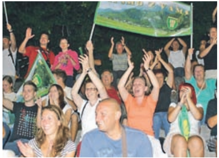
V Trziču so jih prišli spodbujati številni domačini.