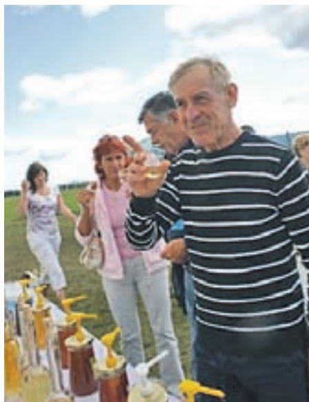
Obiskovalcem so teknile medene dobrote.