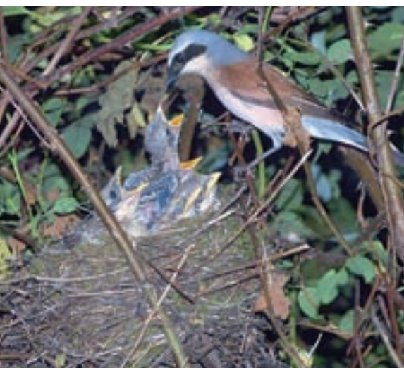
Samец prinaša hrošča mladičem v gnezdo, ki je v za srakoperja tipičnem grmu s pretežno šipkovo sestavo.

Rjavi srakoper je ptica selivka, ki prezimuje v južni in vzhodni Afriki. K nam se vrača proti koncu aprila in maja. V Sloveniji je splošno razširjen, saj je bil pri popisu za Ornitološki atlas ugotovljen v 90 odstotkih kvadrantov, kar gre seveda pripisati tudi temu, da rjavega srakoperja zlahka odkrijemo. Spada med naše najbolj razširjene ptice, čeprav ni najbolj številna vrsta, saj pri nas gnezdi okrog 20 tisoč parov (OAS, 1995).