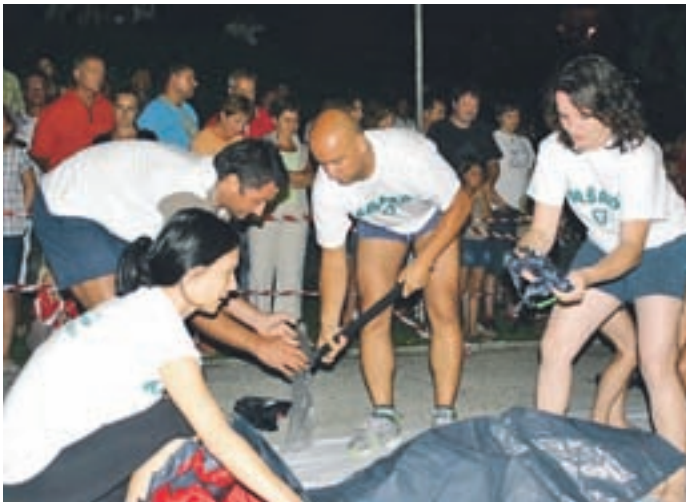
Kašarji med postavljanjem šotora.

vrstile na kopnem. Terjale so kar nekaj usklajenosti in spretnosti ekip, še več vztrajnosti, moči in tudi poguma pa je bilo potrebno na vodi, kjer so tekmovali v Ribiški košarki, Cirkusu na vodi in Poletni ljubezni, zaključili pa so z igro Rdeča nit - Halo pizza. Na poti do odličnega rezultata so ekipo Kašarjev spodbujali tudi številni navijači iz vasi pod Stolom. A. H.