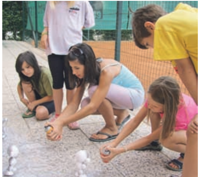
Počitniške delavnice v knjižnici je obiskalo kar 229 otrok.