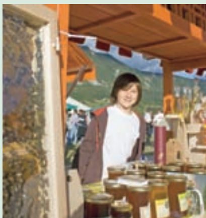
Naslovnica: Utrinek z medenega dneva