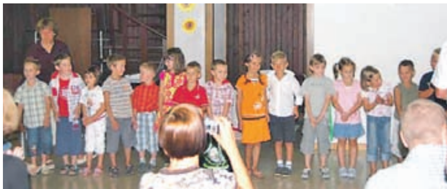
Po mnogih letih, če ne celo prvič v zgodovini šole, je v prvem razredu le en oddenek, v njem pa je 27 prvošolcev.

Za novo šolsko leto smo se začeli pripravljati že pomladi. Najprej je bil vpis v prvi razred, kjer smo se že zelo kmalu zavedeli, da vseh vpisanih ne bo zadosti za dva oddelka. Po mnogih letih, če ne prvič v zgodovini šole, imamo tako v prvem razredu le en oddenek, v njem pa 27 učenk in učencev. Vpisu v prvi razred je sledil še vpis v vrtec, kjer se je po vpisu pokazalo, da bo potrebno zagotoviti pogoje za dodatno skupino. Eno z drugim se je lepo izšlo - vpisanih otrok v vrtec ni bilo treba odklanjati. Tako imamo v vrtcu 125 otrok v eni skupini prvega starostnega in petih skupinah drugega