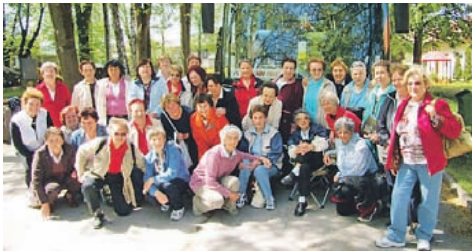
Izleti so med upokojenci zelo priljubljeni. Članice rekreacijske skupine so se letos odpravile tudi v Muzej premogovništva v Velenje.

Športniki so predvsem aktivni v maju, ko se udeležujejo različnih tekmovanj, ki jih organizira Medobčinska zveza upokojencev občin Kranjska Gora, Jesenice in Žirovnica. Tekmovali so v balinanju, streljanju z zračno puško, namiznem tenisu, tenisu, pikadu, smučanju, sankanju in smučarskih tekih. Vedno je pri vseh prisoten pravi tekmovalni duh, še bolj pa se držijo znanega reka 'Važno je sodelovati'. Poleg omenjenih tekmovanj se udeležujejo tudi