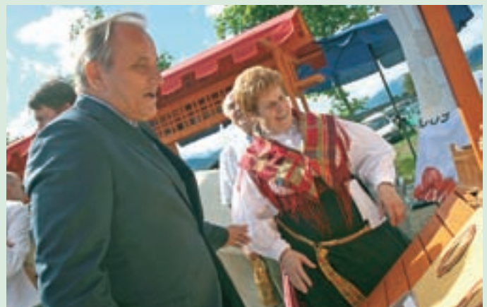
Kmetijski minister Milan Pogačnik si je ogledal tudi stojnice z dobrotami.