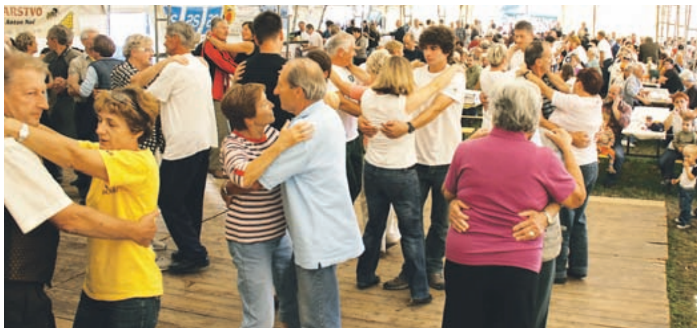
Ob zvokih Modrijanov so mnoge zasrbele pete.