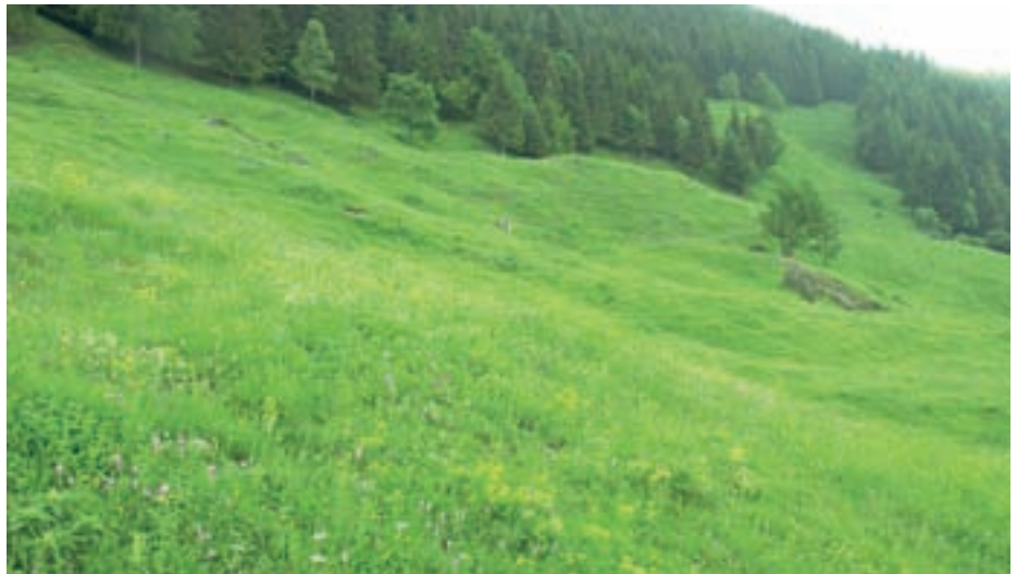
Gorski pašnik na Stari in Zabreški planini na Stolu so uporabniki po nepotrebnem osiromašili za sleherno grmovje. Tam je rjavi srakoper redno gnezdil, letos pa mu zaradi tega ni uspelo.

Število parov, ki gnezdi, in obseg življenjskega prostora v Evropi po letu 1980 stalno upada. Največji osip gnezdeče populacije so zabeležili v Angliji, Švedski, Italiji in na Danskem. V mnogih državah je današnja populacija pol manjša od nekdanje ocenjene. Vzroki za to so v spreminjanju njegovega življenjskega prostora in zastrupljanja žuželk, ki so njegova osnovna prehrana.