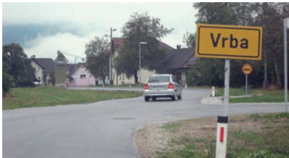
Gradnja kanalizacije Vrba-Breznica se zaključuje. Prihodnje leto bo sledila gradnja kanalizacije v Zabreznici s pomočjo evropskega denarja, saj je občini uspelo pridobiti 200 tisoč evrov iz naslova razvoja regij.

”Zelo smo zadovoljni, saj lahko občanom zagotavljamo tudi tisti del upravnih nalog, ki jih prej nismo mogli. Te so bile večinoma v pristojnosti državne policije, a jo slednja iz takšnih ali drugačnih razlogov ni mogla opravljati, denimo onesnaženje okolja, odlaganje odpadkov, zapuščenca vozila in izvrševanje občinskih odlokov, kot so odloki o varnosti cestnega prometa, javnem redu in miru, občinskih cestah ... Enostavno nismo imeli organa, ki bi to nadziral, odkrival in sankcioniral. Ugotavljam, da je najmanj problemov z mirujočim prometom, razen pred pošto in na avtobusnih postajališčih, kar pa bodo redarji tudi v prihodnje preganjali. Še naprej se pojavljajo divja odlagališča, nazadnje denimo v Piškovici, a je inšpekcija kršitelja odkrila in kaznovala.”