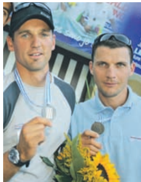
Brata Pirih sta na sprejemu na Bledu vsem ljubiteljem veslanja z veseljem pokazala bronasto medaljo.