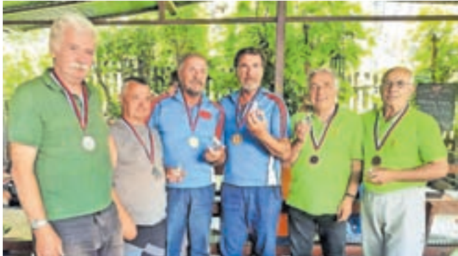
... in zmagovalni trije pari v moški konkurenci.