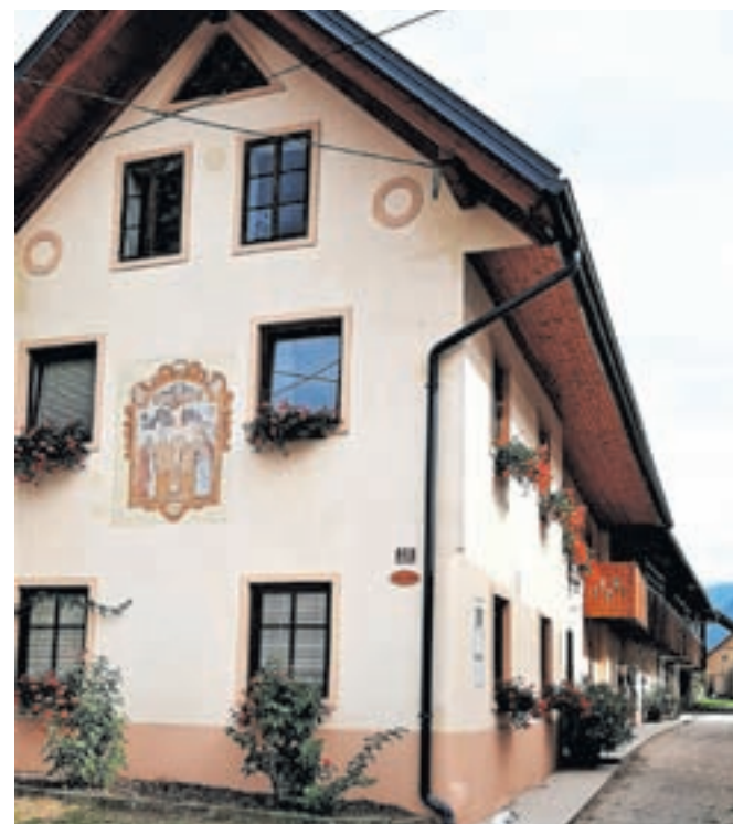
Iz lanskega izbora: ena od najlepših radovljiških hiš v starejšem okolju, v Predtrgu / FOTO: ARHIV TD RADOVLJICA