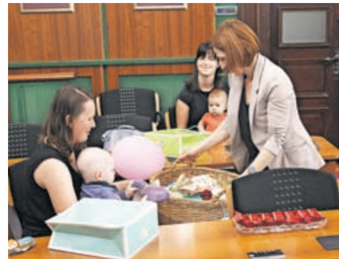
Letos so se mladi starši razveselili tudi pisanih copatk, ki so jih za novorojenčke napletle Štrikar'ce z LUR-a.

ne otroke prejeli spominsko darilo, otroško knjigo s posvetilom župana in slovensko zastavo. K obdarovanju novorojenčkov je v tem letu pristopila skupina udeleženk programa Medgeneracijskega centra Radovljica z imenom Štrikar'ce z LUR-a, ki so malčke napletle prelepe pisane copatke.