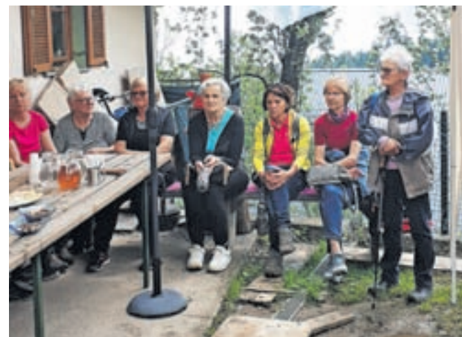
Srečanje Med narcisami na Pristavi in druženje ob obisku ekološke kmetije Pr' Lenčk