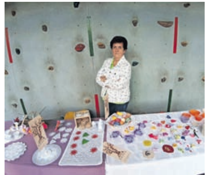
Na ogled so bili tudi izdelki sekcije za ročna dela.