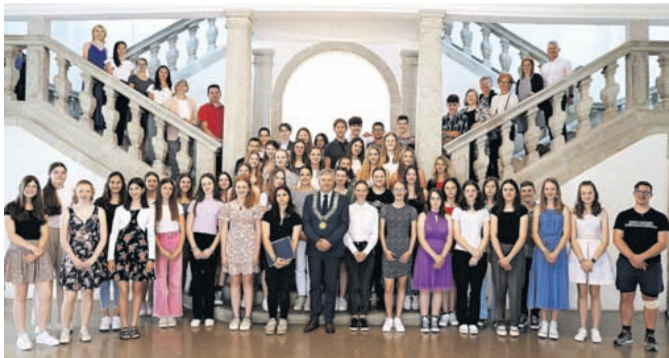
Letošnji odličnjaki na sprejemu pri županu