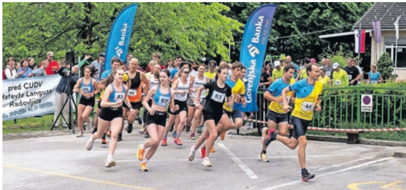
Start letošnjega teka pred Centrom za delo, usposabljanje in varstvo Radovljica