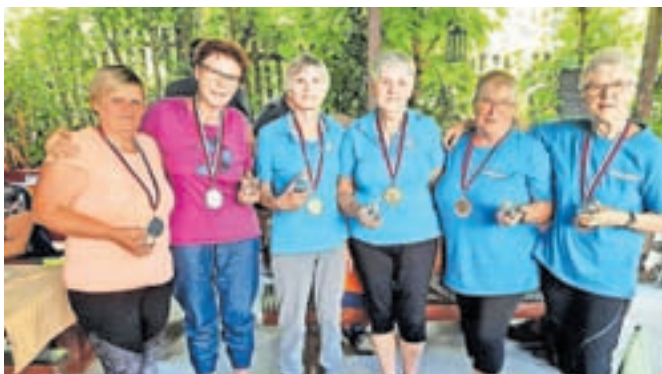
Najboljše med ženskimi ekipami...