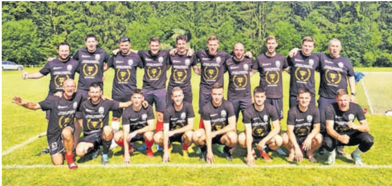
Zmagovalna ekipa Smola, letos edina brez poraza.

Ekipi sta šli v zadnje, 14. kolo točkovno poravnani. Čeprav je imela ekipa MTS Activity – KŠDB Biser boljšo razliko v golih, je bila prednost na strani ekipe Smola, saj so imeli v medsebojnih tekmah boljši izkupiček. V Radovljici se je tekma končala z rezultatom 5 : 5, na Hrušici pa je Smola zmagala s 6 : 4. Zadnje kolo je Smola opravila z odliko, saj je v Ribnem zmagala s 4 : 1. Za nameček je ekipa MTS Activity – KŠDB Biser v gosteh izgubila z ekipo Utrip z 8 : 5 in s tem še točkovno zaostala za Smolo.