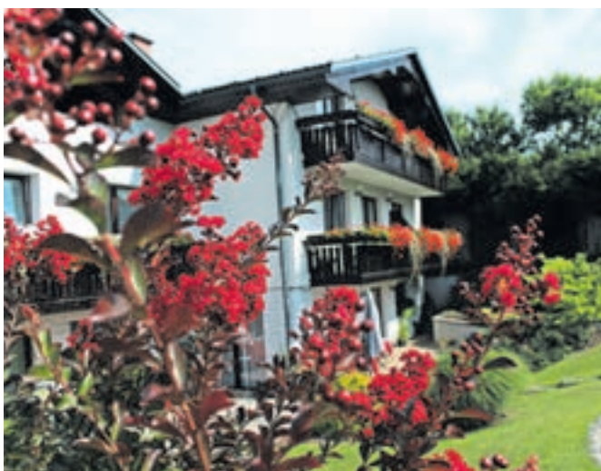
Iz lanskega izbora: ena od najlepših radovljiških hiš v sodobnem okolju, na Triglavski ulici

Društvo sicer ostaja aktivno tudi na drugih področjih. Spomladi so pripravili pustni sprevod in pustno dogajanje razširil na dni pred povorko, za prihodnje leto pa si želijo prireditve dopolniti še s plesom v maskah. Eden osrednjih poletnih dogodkov bo Prangeriada, konec leta pa bodo organizirali obisk dedka Mraza.