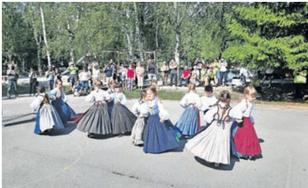
Nastop folklorne skupine iz Vrtca Lesce