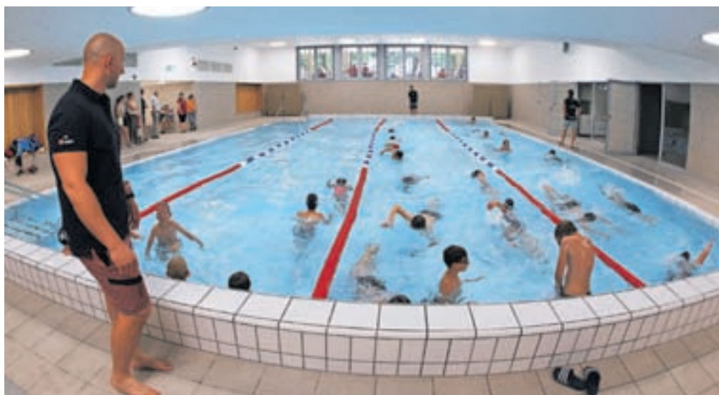
Bazen pa bo imel ogromno vlogo pri preventivni dejavnosti, saj bo v njem potekalo plavalno opismenjevanje otrok, kar jim bo tudi v odraslem obdobju omogočalo aktiven in zdrav način življenja.