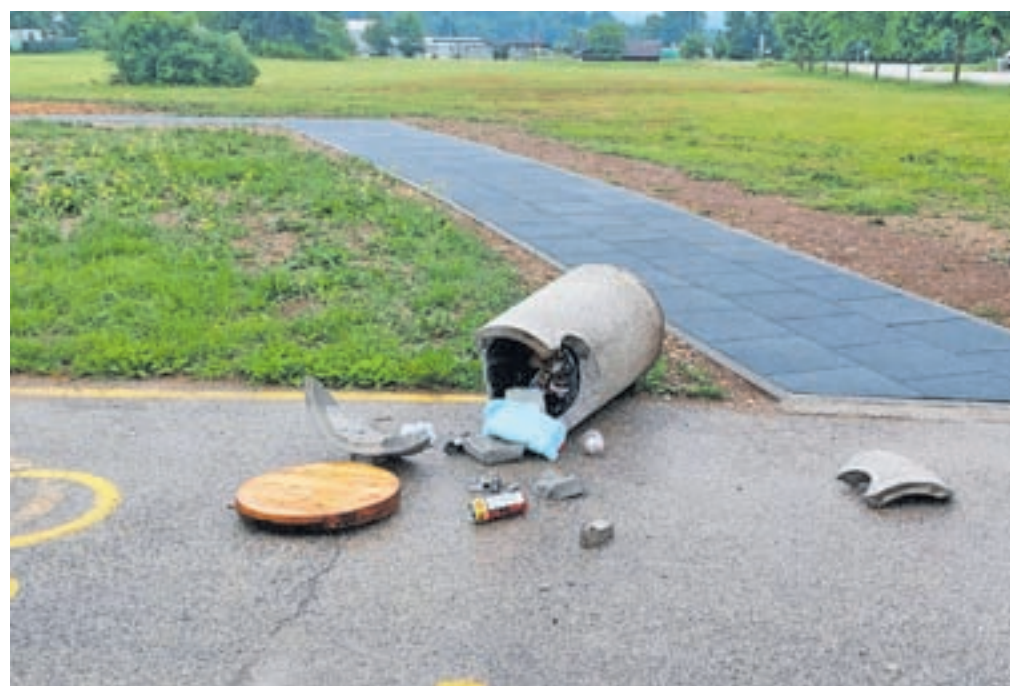
V Lescah v zadnjem obdobju opažajo še več vandalizma kot sicer.

»Občinski redarji ob svojih rednih nalogah opravljajo še dodatne nadzore in obhode na območjih, kjer se pojavlja vandalizem. Posebej se nadzori vsakodnevno opravljajo ob zaključkih popoldanskih izmen v večernem času. Z namenom preprečevanja povzročanja vandalizma in s tem tudi vznemirjanja uporabnikov rekreacijskih in otroških površin bomo nadzore nadaljevali.«