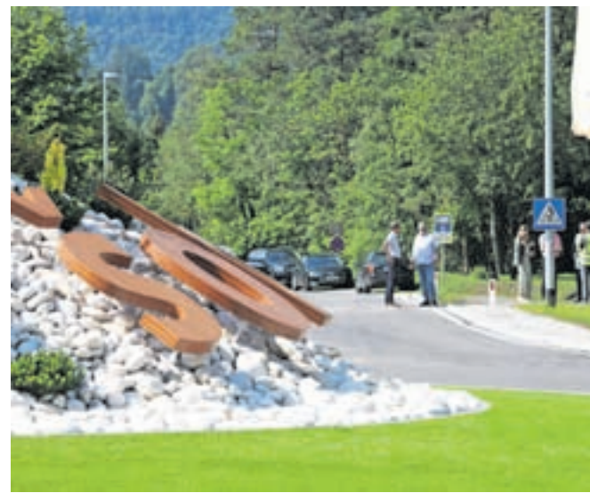
V prometni nesreči poškodovano krožišče bodo na novo uredili tako, da bo bolj skladno z naravnim okoljem.

»Prav pa je, da se sliši tudi opozorila tistih, ki želijo dobro – v korist čim manj okrnjene narave. Pred kratkim je bila v prometni nesreči poškodovana ureditev krožišča. Ob tem je vredno razmisliti in iskati boljše rešitve, če so mogoče, še posebno če se sočasno lahko najde kompromis, ki zadovoljuje večino. Tudi zato bo po popravilu sredinska ureditev krožišča izboljšana, zmanjšana in iz naravnih materialov,« pojasnjujejo in dodajajo, da so se za umetno travo odločili, ker je z njo pokrit del krožišča povezoval, česar pa travna ruša ne bi prenesla.