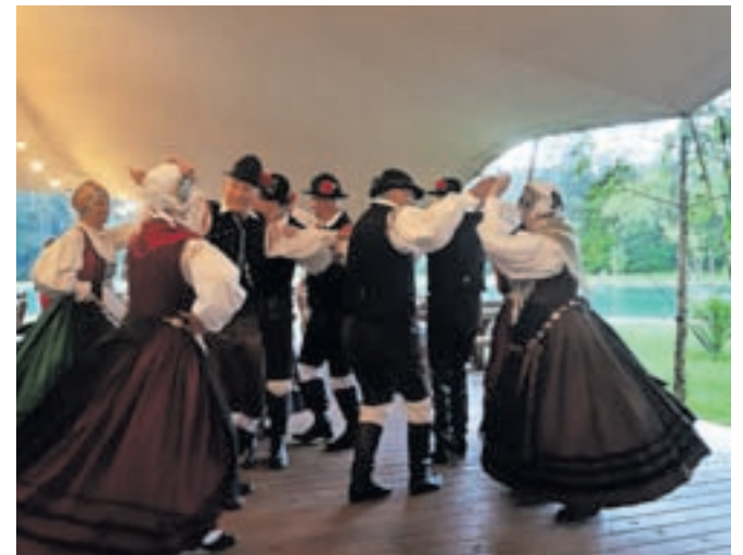
Folklorna skupina KPD Lesce

Dotatno pomoč pri izvedbi dogodka so poleg Turističnega društva Lesce prispevala še nekatera okoliška podjetja in obrtniki ter Vid Grašič, ki je poskrbel za vodenje programa. Vsem se društvo upokojencev lepo zahvaljuje.