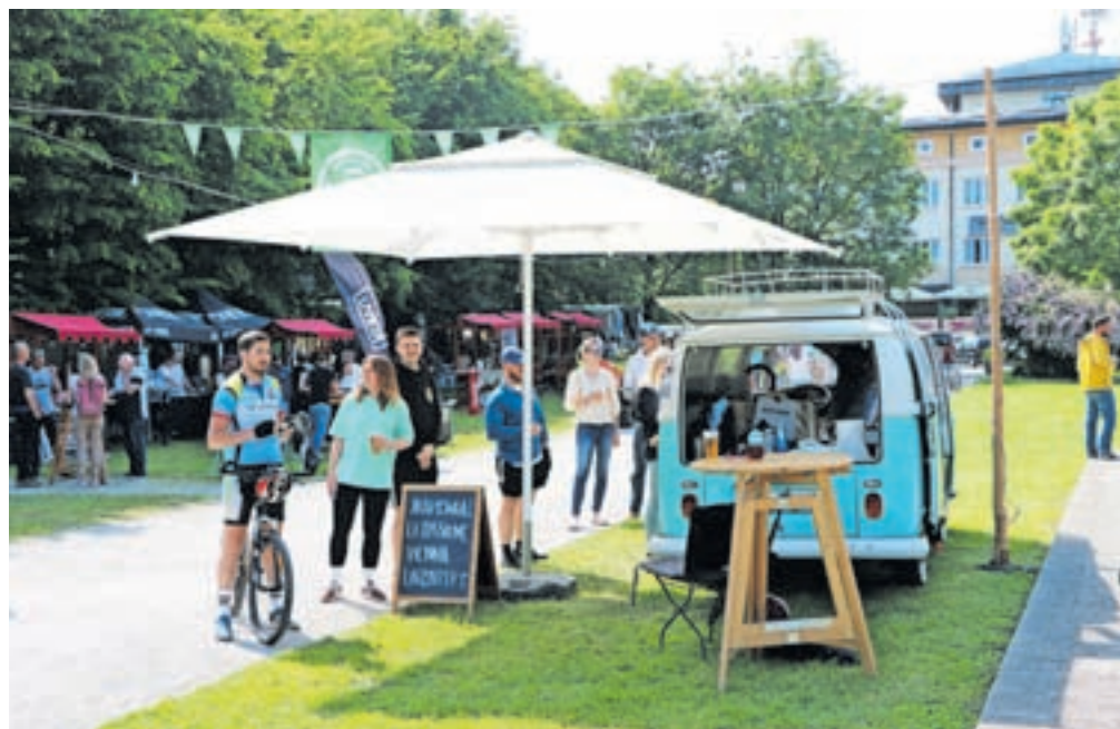
Festival je v svojo družbo vabil tudi z »domačim točenim«