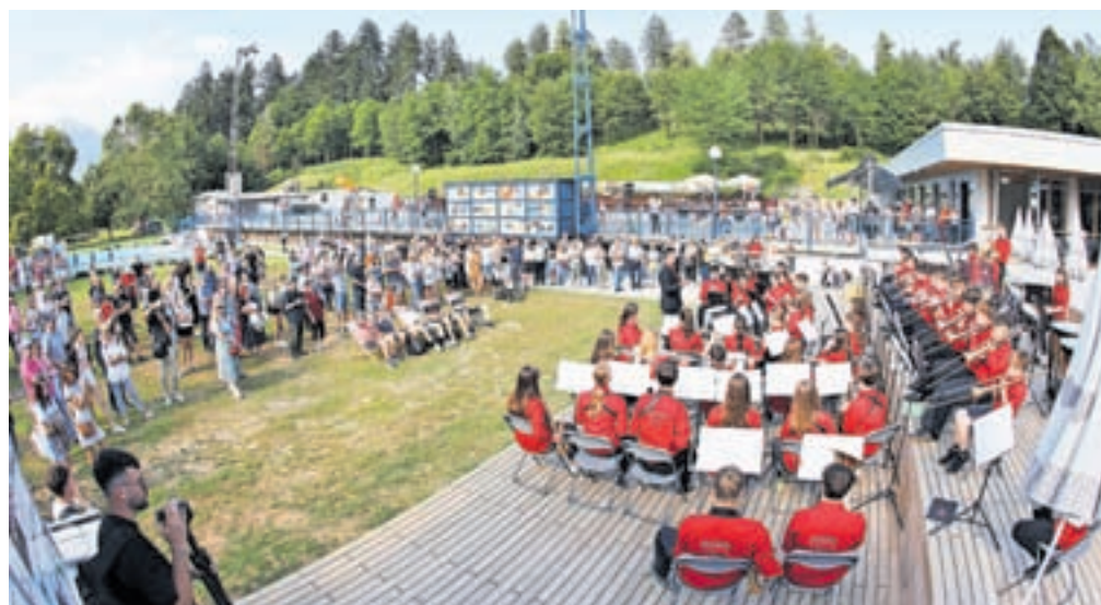
Slovesno odprtje sta z glasbenim programom dopolnila Pihalni orkester Glasbene šole Radovljica (na fotografiji na novi leseni terasi restavracije) in Pihalni orkester Lesce.