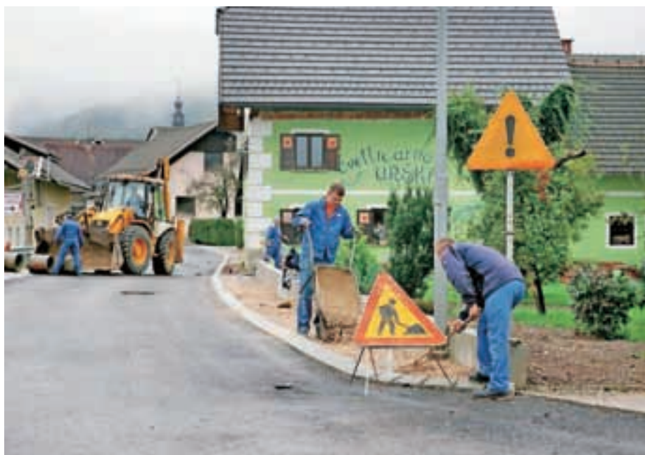
Še zadnja dela v Tupaličah

"Sedaj zbiramo podatke, tako da bomo še ta mesec začeli izdajati dopise, na katerih bodo podatki, potrebni za izračun komunalnega prispevka, torej iz baze geodetske uprave, to je NTP (neto površina objekta), in občane pozvali, da se v primeru napačnih podatkov zglasijo na občini. Na določene dneve, ki bodo sporočeni z dopisom, bomo na občini pripravljene za sprejem strank. Ker iz izkušenj vemo, da so ti podatki slabi in tudi nepravilni, pozivamo lastnike objektov, da se oglasi-jo. Kot je bila praksa že lani ob priključevanju na kanalizacijo v Preddvoru, bomo z občani nato te podatke še usklajevali, preden jim bomo izdali odločbe. Te lahko pričakujejo novembra in decembra. Prikllop pa je mogoč takoj, ko dobijo odločbo in soglasje s tehničnimi navodili upravljavca. Skrajni rok za priključitev je šest mesecev od prejete odločbe."