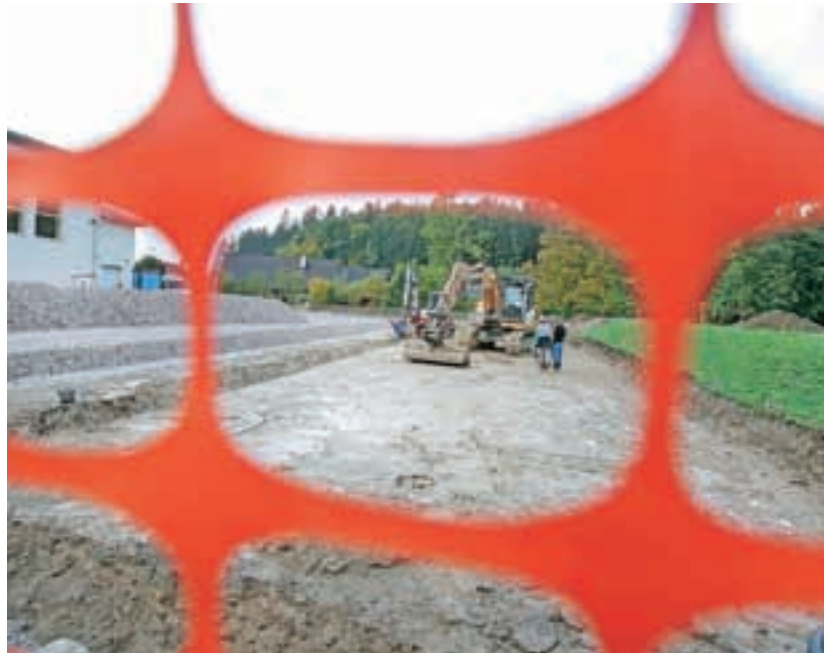
Urejajo športna igrišča pri šoli

vidimo priložnost za grad Dvor. Ta čas še potekajo pogovori z direktorico Doma starejših občanov Preddvor, direktorjem Zavoda za kulturo in projektantom, in sicer o možnih prihodnjih vsebinah tega gradu."