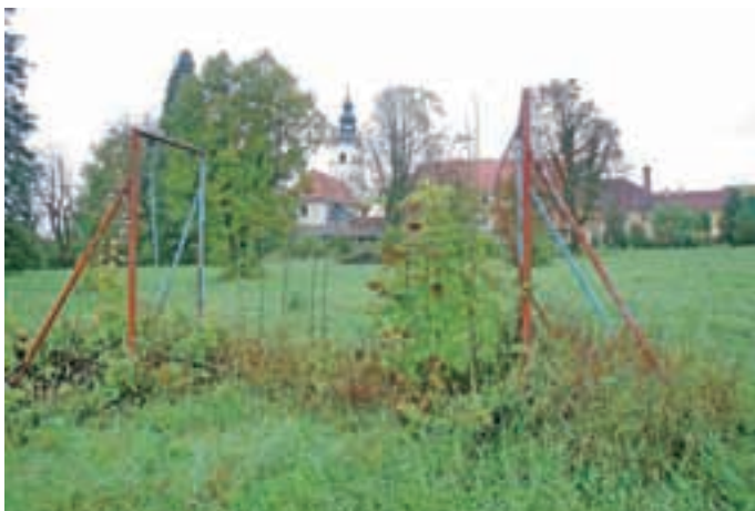
Skozi grajski park bodo speljali povezovalno pot med severnim in južnim delom Preddvora.

"Naslednja finančna perspektiva nam slabo obeta, kar zadeva financiranje infrastrukture. Kot nam pojasnjujejo, bo bolj financirala socialne dejavnosti in razvoj človeških virov. Tu