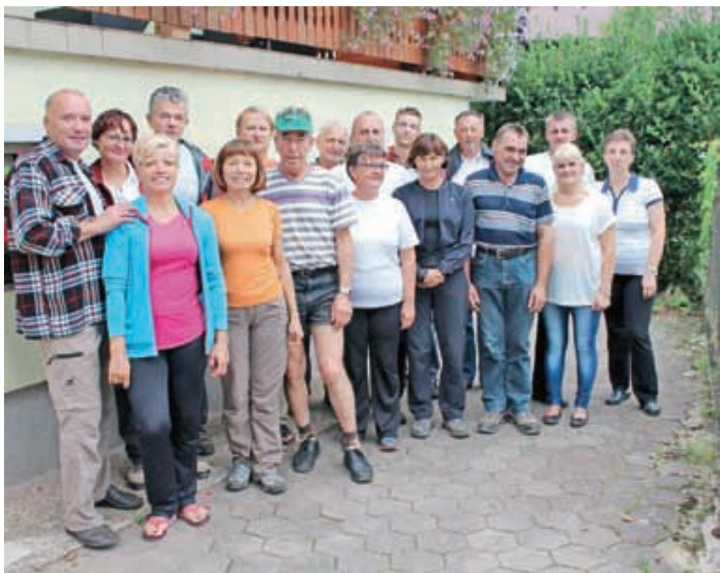
Jesenski pohodniki po stari tovarni poti