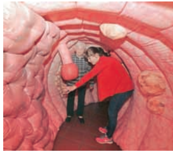
»Sprehod« skozi debelo črevo

lezni umre. Program Svit omogoča, da te oblike raka lahko dovolj zgodaj odkrijejo tudi pri ljudeh, ki še ne občutijo očitnih zdravstvenih težav. Ta teden so program predstavili v Preddvoru, kjer so obiskovalcem svetovali zdravstveni delavci, najbolj nazorno pa so si ljudje spremembe na črevesju predstavljali ob veliki napihljivi maketi debelega črevesa. Lahko so se sprehodili skozenj in si ogledali, kako se iz drobnih polipov razvijejo večji, iz njih pa usodni rak, če spremembe opazimo prepozno.