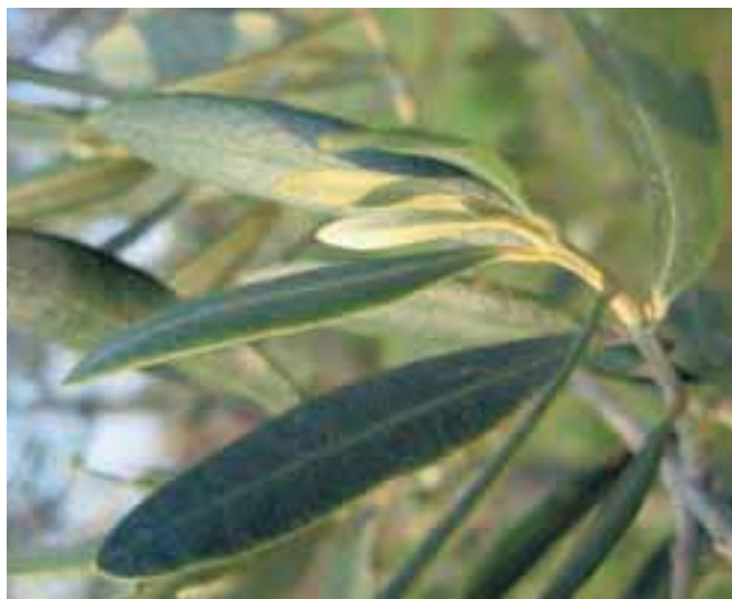
Ⓢ V Mediteranu je pomembna alergogena vrsta oljka. Z močno alergogenim cvetnim prahom oljke pridemo v stik v maju in juniju.

Sogovornica je poudarila, da bo aprila pojavljanje cvetnega prahu zaradi neugodnega vremena kasnejše, približno za deset dni od dolgoletnega povprečja: »Ohladitev s snegom je zadržala cvetenje breze, gabra in jesena, zato pričakujemo z nastopom suhega in toplega vremena močno obremenitev zraka s temi vrstami alergenega cvetnega prahu. Če se bo obdobje neugodnega vremena še na-