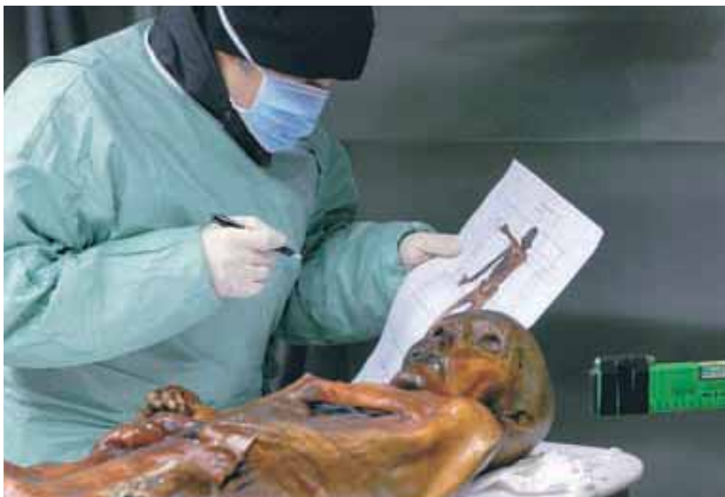
Ötzi je v dvajsetih letih raziskovalo več kot petsto strokovnjakov v sto znanstvenih skupinah iz celega sveta