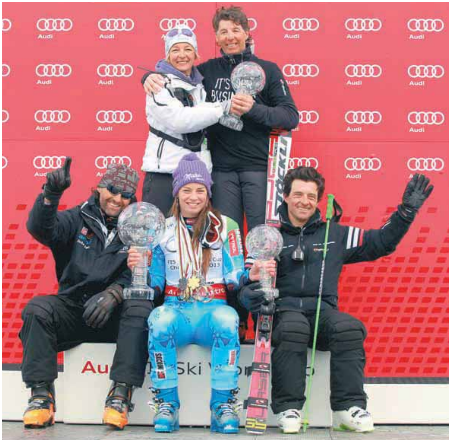
📍 Z ekipo Team to aMaze v sezoni 2012/13