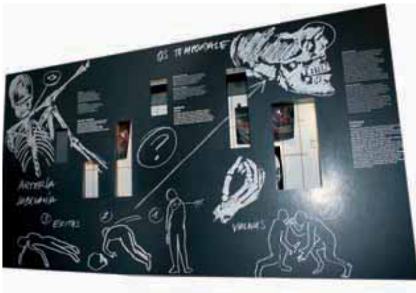
☺ Je Ötzijeva smrt prvi dokazan umor v zgodovini človeštva?

generatorja, ki dajeta elektriko celotnemu prvemu nadstropju. To pa še ni vse, bi rekli v televizijski prodaji, v primeru požara obstaja še tretja komora namenjena Ötziju, ki je v bolnišnici v Bolzanu.