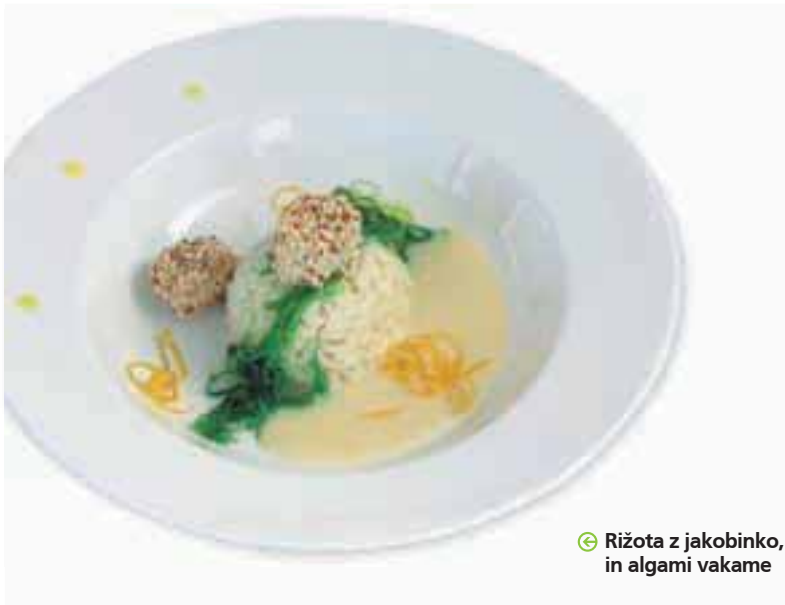
➤ Rižota z jakobinko, sezamom in algami vakame