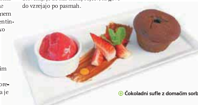
☞ Čokoladni sufle z domačim sorbetom

kimi vlakni. V vrhunski kulinariki je znanih še več pasem, v Cubisu občasno uporabljajo black angus s Škotskega in kobe z Japonskega. Tudi v Sloveniji je že kar nekaj rejcev, ki govedo vzrejajo po pasmah.