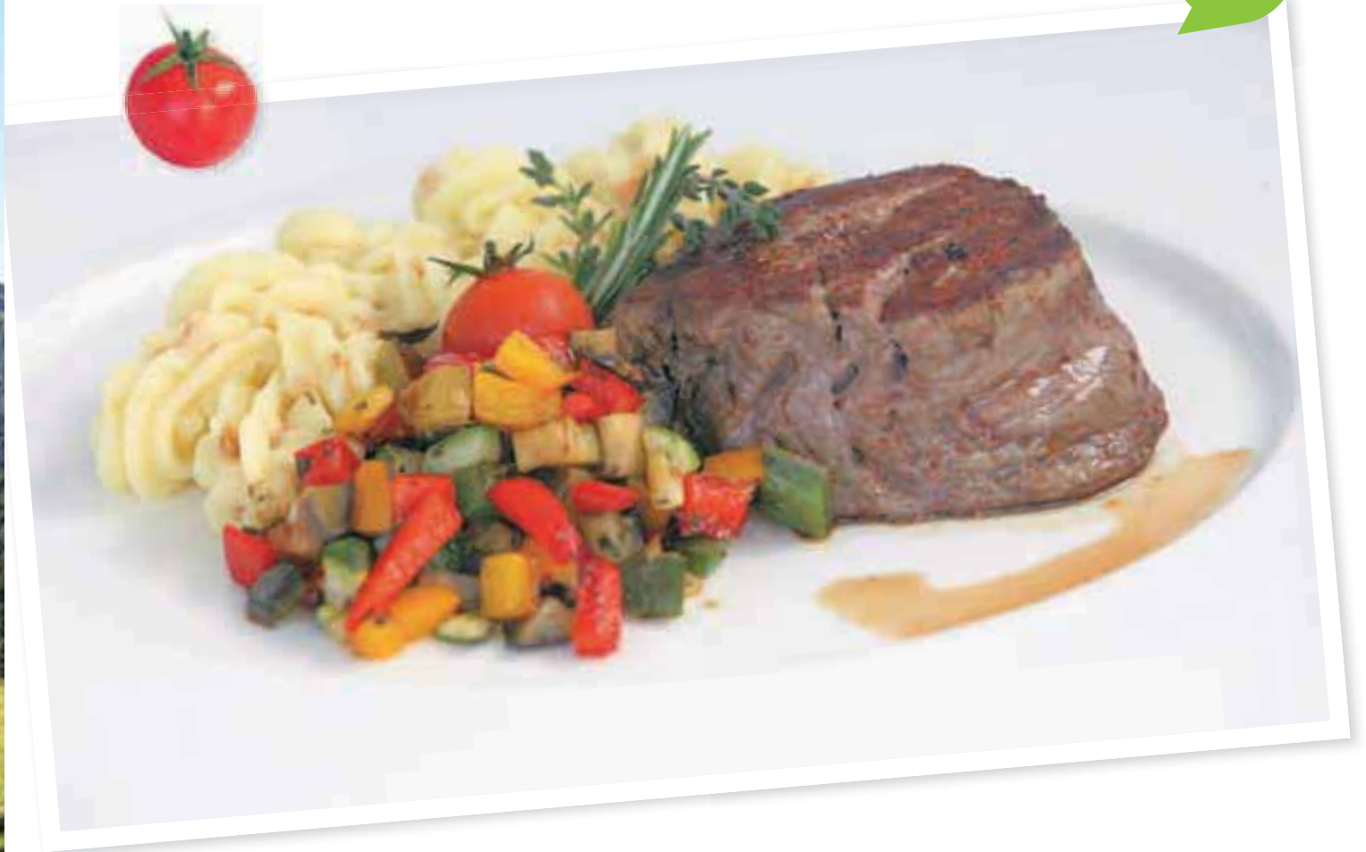
📍 Slovenski steak s prilogo

Vzemite si čas za popoldansko razvajanje v Cubisovih okusih sveta. Naj bo to v dobri družbi, lahko ob odličnem steaku slovenskega, argentinskega ali francoskega porekla. Odprite vrata v čudoviti svet kulinarčnih doživetij, vsakega gosta toplo sprejmejo.