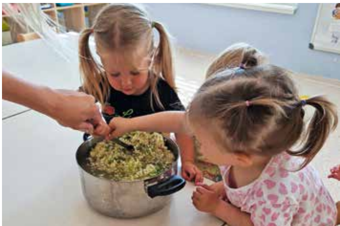
Otroška razigranost v vrtcu Pri Dobri Metki

V vrtcu Pri Dobri Metki smo polni pozitivne energije zakorakali v poletni čas. Sončni žarki so nas prebudili in otroška navihanost ter razigranost kar žarita iz nas. Z veseljem to pokažemo vsem, ki jih srečamo. Naša jutra z lepim vremenom se začnejo na igrišču, kjer si privoščimo okusen zajtrk, nato pa z radovednimi koraki hitimo raziskovat in spoznavat vse, kar nam prinese nov dan. Na začetku poletja se je sonce sramežljivo skrivalo, vendar smo ga s petjem poletnih pesmi, kot sta Sijaj, sijaj sončece in Na planincih, priklicali nazaj. Kmalu je pokazalo svojo moč, zaradi katere smo se podali v iskanje sence, kjer smo se še naprej veselo igrali. Zelo dobro se zavedamo, da je v vročih poletnih dneh pomembno piti veliko tekočine, zato smo si sami pripravili okusen bezgov sirup, ki nas odlično osveži. V sklopu projekta Varno s soncem ozaveščamo otroke in starše o škodljivih učinkih čezmerne izpostavljenosti sončnim žarkom ter jim predstavljamo ukrepe, s katerimi lahko zmanjšamo in omejimo te učinke. Skozi igro smo spoznali pomembnost nošenja pokrival in tudi sami smo si izdelali pisana pokrivala iz papirja. Ko je sonce prevroče, se skrijemo tudi pod krošnje dreves bližnjega gozda ali pa se ohladimo z vodnimi igrami. Marija Kosem Bonča