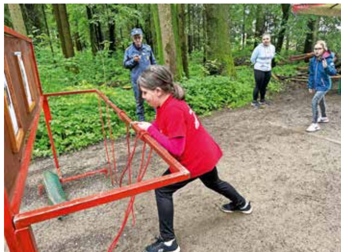
Mladi gasilci iz GZ Kokra so se v Voklem pomerili na tekmovanju v gasilski orientaciji.

»Mladi na ta način urijo gasilske veščine, pridobivajo nova znanja, preverjajo psihofizično pripravljenost, se družijo in spoznavajo med seboj, ob tem pa negujejo tudi tekmovalni duh,« je povedal Franc Draksler, predsednik GZ Kokra. Na regijsko tekmovanje sta se med pripravniki uvrstili ekipe Trboje in Šenčur, med mladinkami ekipe Prebačevo - Hrastje in Preddvor, med mladinci Šenčur in Trboje, med pionirji Trboje in Luže ter med pionirkami Trboje in Srednja vas. Na regijskem tekmovanju sta blesteli ekipe pionirk iz Srednje vasi in pionirjev iz Trboj, ki sta v svoji kategoriji osvojili prvo mesto in si tako prislužili vstopnico na državno tekmovanje, ki bo potekalo septembra.