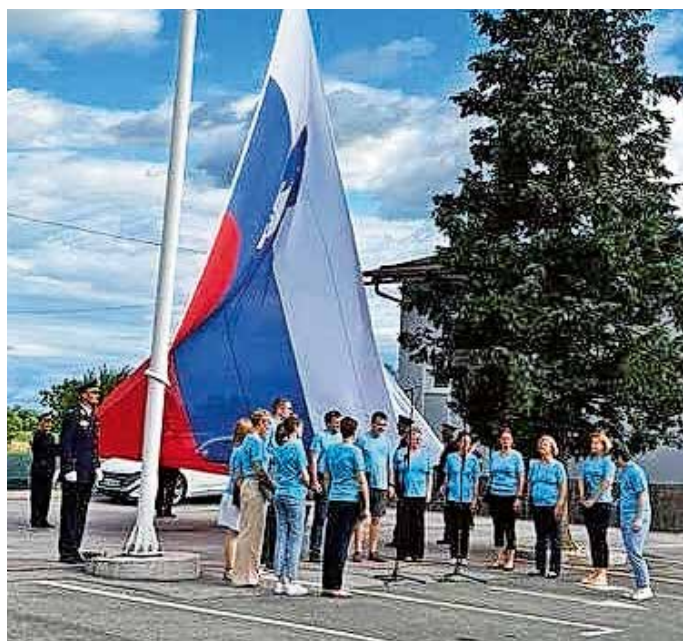
Obletnica dviga zastave v Hotemažah