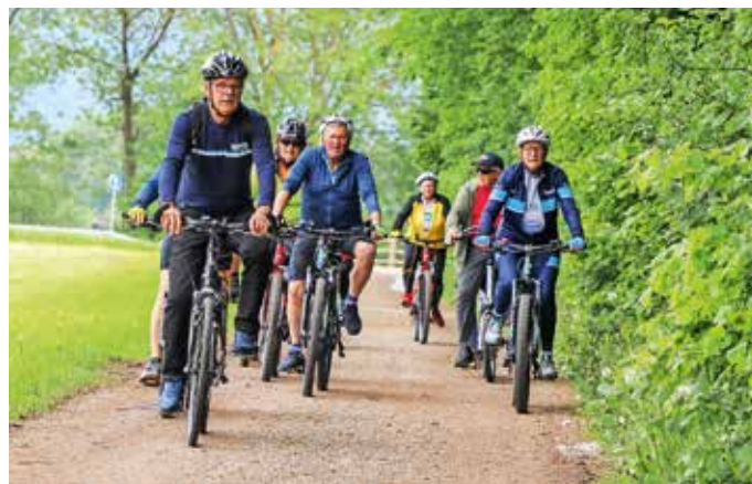
Nekateri so se odločili za skupinsko kolesarjenje

Udeležba je brezplačna, člani društva so poskrbeli tudi za brezplačno malico, poleg tega pa so izvedli nagradno žrebanje, v katerem so lahko sodelovali vsi, ki so z žigi dokazali obisk vseh kontrolnih točk. Glavno nagrado, gorsko kolo znamke