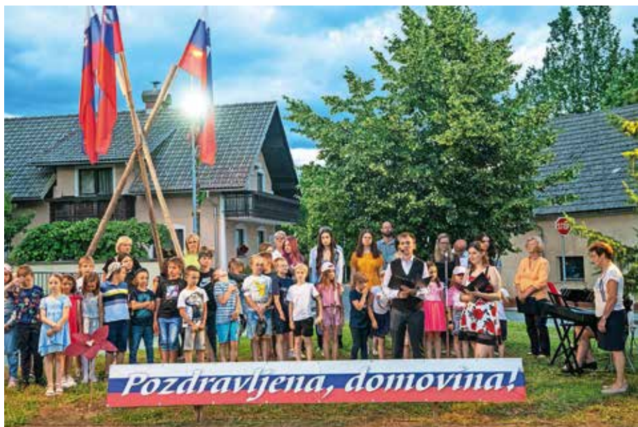
Rdeča nit prireditve ob dnevu državnosti je bila slovenska pesem. / Foto: Primož Pičulin

je, ali v Sloveniji dovolj pozornosti namenimo vzgoji za domoljubje. »Premalo je vzgoje za domoljubje, premalo je ponosa, da živimo v svoji domovini, premalo je spoštovanja svobode in neodvisnosti,« je opozorila Golobova, ob tem pa si zaželela, da današnji rodovi nikoli ne bi doživeli vojne, ki vihra v bližnjih deželah. »Bodimo hvaležni za svobodo, ki jo uživamo,« je pozvala v prepričanju, da je dolžnost vsakega posameznika, da se zaveda, kaj je dom in kaj je domovina. »In da bi tako kot skrbimo za svoj dom, skrbeli tudi za svojo domovino,« je še poudarila v svojem govoru.