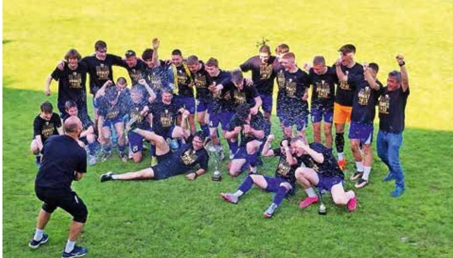
Ekipe kadetov je osvojila prvenstvo v drugi slovenski kadetski ligi.

Ekipe kadetov je zanesljivo osvojila prvenstvo v drugi slovenski kadetski ligi, kar pomeni, da bomo v športnem parku Šenčur v prihodnji sezoni spremljali najvišji državni rang tekmovanja za starejše dečke in kadete. Kadeti so v zadnjem krogu gostovali pri Dobu, ki je končal prvenstvo na drugem mestu, in remizirali z 1 : 1. Pred tem so dosegli neverjetnih 17 zaporednih zmag in so se na koncu z desetimi točkami prednosti uvrstili v prvo ligo. V prvi slovenski ligi pa bodo še naprej nastopali starejši dečki, ki so tudi tokrat presenetili in v 14-članski prvi ligi zasedli osmo mesto. Članska ekipa, ki je bila vse do zadnje-