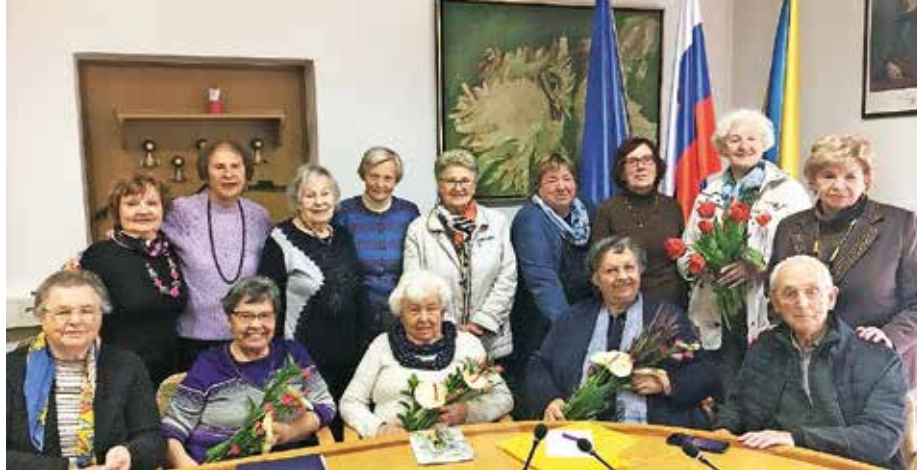
Skupina Krompirjev cvet bo naslednje leto praznovala desetletnico.

Povezani v skupini Krompirjev cvet se srečujemo vsak ponedeljek v prostorih Zadružnega doma Šenčur. Iskreno pa tokrat čestitamo skupini Koprive, ki ima domicil na Visokem in letos praznuje že desetletnico delovanja. Naša skupina, v kateri je povezanih 15 članov, bo desetletnico delovanja zaznamovala naslednje leto. Teh devet let nam je kar zbežalo, smo pa radi prihajali, se družili in uživali ob vsakem srečanju.