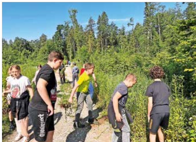
Učenci šestih razredov Osnovne šole Šenčur so se pridružili veliki slovenski akciji Očistimo Gorenjsko invazivk.

Na naših pohodih smo spoznavali tudi domače vrste rastlin in se sladkali z gozdnimi jagodami, ki nam jih je letos narava nudila v izobilju. Učenci so bili veseli, da so svojo včasih