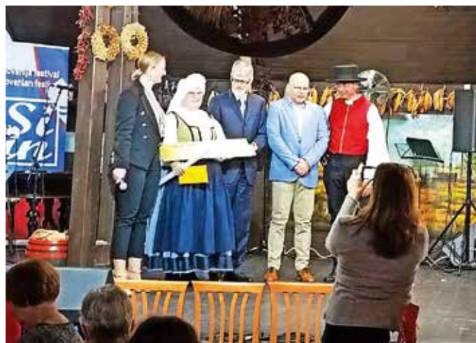
Festivala so se udeležili tudi folklorniki Folklornega društva Šenčur.

Pevski zbori so prav tako nastopili v dveh večerih. Prepevali so na ladji, ki je plula po Donavi. Oktet Deseti brat in Sorški orgličarji so slovensko kulturno izročilo predstavili v cerkvi sv. Ane. Organizator je poskrbel za voden ogled Budimpešte,