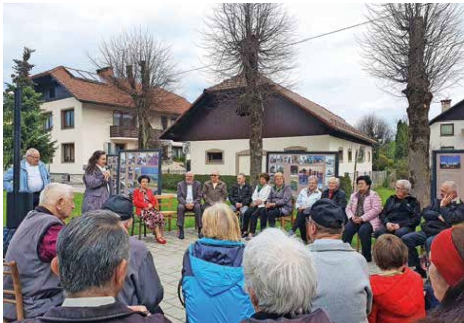
Na odprtju razstave Izgubljena in najdena kulturna dediščina Srednje vasi