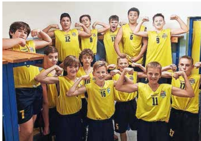
Otroci polnijo vse mlajše selekcije, ki delujejo v okviru kluba.