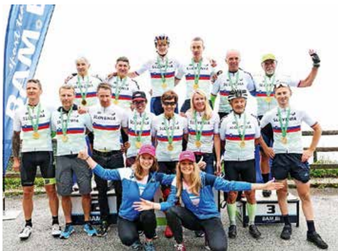
Zmagovalci 18. kolesarskega vzpona na Krvavec

Tradicionalni, že 18. kolesarski vzpon na Krvavec, ki ga organizira ŠD BAM.Bi iz Trboj, je kljub drugačnim vremenskim napovedim potekal v deževnem in meglenem vremenu. Kljub temu se je na startu zbralo 151 kolesarjev, od tega jih je 40 uspešno prevozilo mali vzpon do Ambružarja in 109 do vrha na Jezercih. V prvi vrsti rekreativno tekmovanje je štelo tudi za Pokal Slovenije in letos tudi za naslove državnih prvakov.