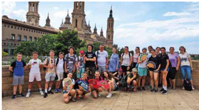
OŠ Šenčur je letos v okviru projekta Erasmus+ sodelovala z osnovno šolo CEIP Odón de Buen iz Zuere v Španiji.

V letošnjem šolskem letu smo na OŠ Šenčur v okviru projekta Erasmus+ sodelovali z osnovno šolo CEIP Odón de Buen iz Zuere v Španiji. Septembra je našo šolo obiskala skupina učiteljev s te šole, in sicer v tednu od 19. do 23. septembra. Sodelovali so pri dejavnostih na naši šoli, spoznavali, kako poteka pouk, ter izmenjevali izkušnje z učitelji. Sodelovanje smo nadaljevali v tednu od 24. do 29. maja,