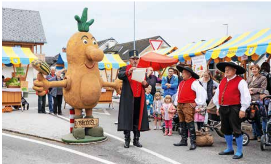
Praznik krompirja velja za eno najpomembnejših in najodmevnejših prireditev v šenčurski občini.

Po nastopu Pihalnega orkestra občine Šenčur, ki so ga letos prvič spremljale mažoretke iz Društva mažoretk Šenčur, in razglasu dekreta, za kar so tudi letos poskrbeli člani Folklornega društva Šenčur, so obiskovalci na sedmih stojnicah lahko okušali raznolike krompirjeve jedi.