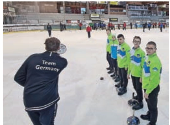
Južna Tirolska je februarja letos gostila evropsko mladinsko prvenstvo.