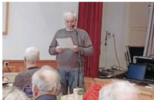
Občni zbor DU Jezersko

V okviru Občine Jezersko je zaživel projekt Prostofer zavoda Zlata mreža, kjer kot prostovoljci sodelujejo tudi naši člani. Prevoz lahko naročijo vsi tisti starejši, ki ne vozijo sami, nimajo svojcev, imajo