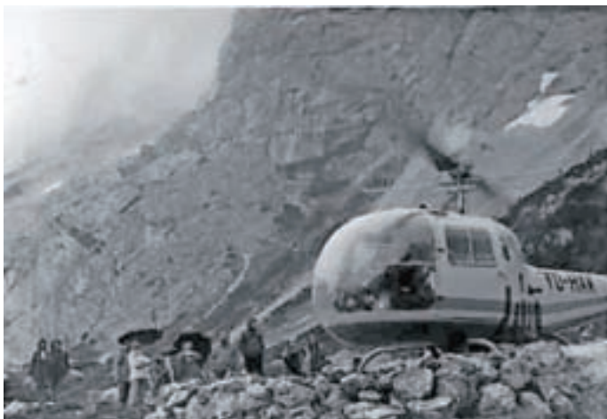
Helikopter 20. julija 1968 pri Češki koči

Vse več izkušenj in spoznanj, da samo hitra pomoč brez potrebne opreme ne zaleže veliko, je vodilo k temu, da se moramo vključiti v organizirano delo kranjske postaje GRS. Nekako počasno dogovarjanje je prehitela tragedija Nizozemcev v Kočni leta 1986. Takrat bi bila naša pomoč uspešnejša – če bi