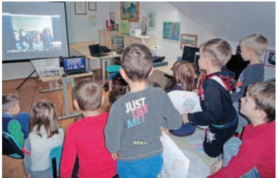
Video klic v Litvo

Namen projekta je, da otroke motiviramo in jih navajamo na rahljanje stereotipov, predsodkov in nestrpnosti do tujcev. S tem bomo soustvarjali večje