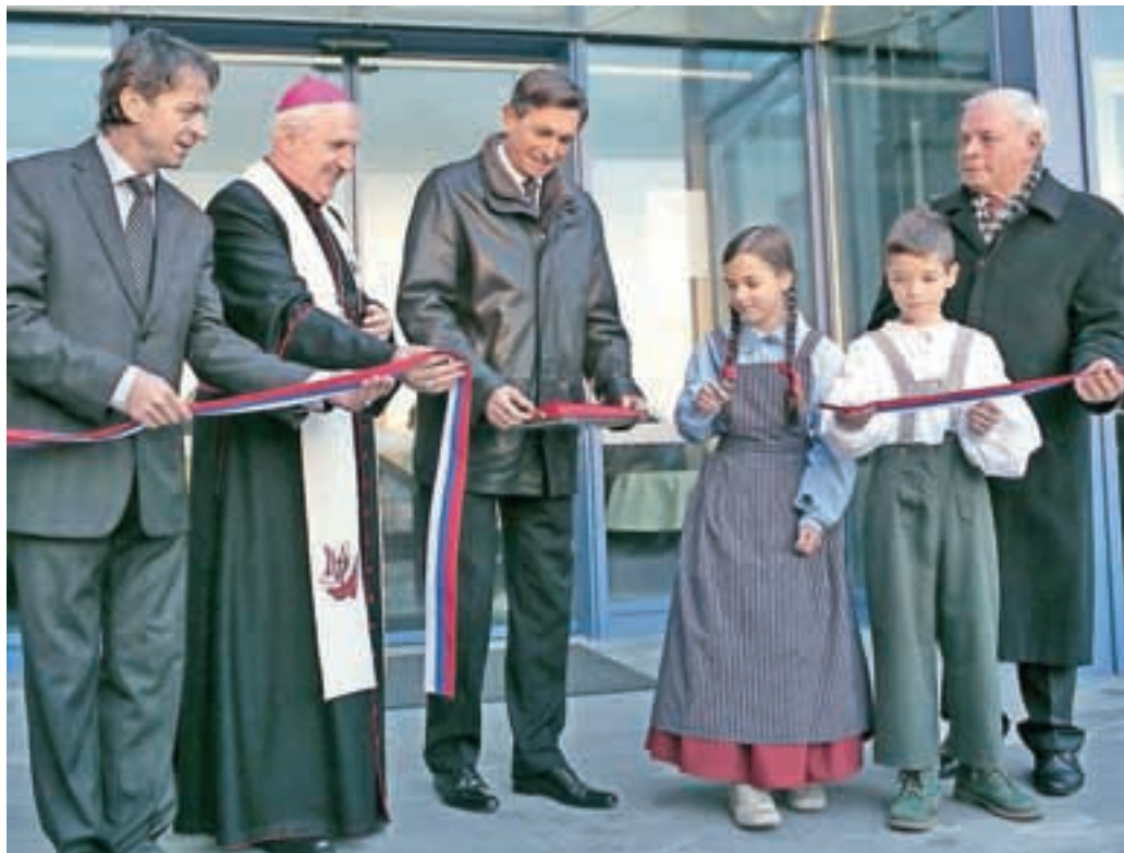
Predsednik republike Borut Pahor je v duhu medgeneracijskega sodelovanja trak prerezal s pomočjo dveh mladih članov iz cerkljanske otroške folklorne skupine.

Dom Taber so zgradili na 1,2 hektarja velikem zemljišču. Zavod Taber, ki je v 100-odstotni občinski lasti, je za nakup zemljišča, gradnjo in opremo odštél 11,6 milijona evrov, pri čemer je pridobil tudi