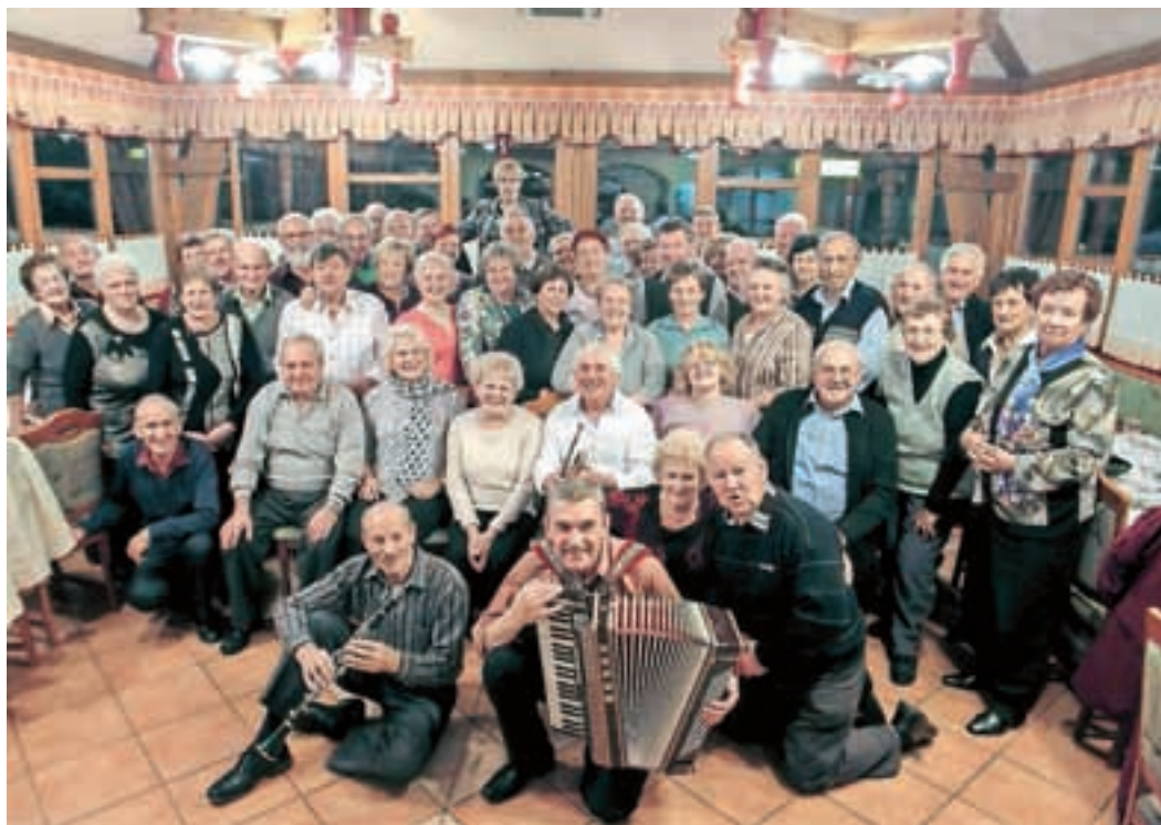
Udeleženci srečanja sedemdesetletnikov s partnerji