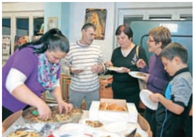
Različni migranti, ki živijo v lokalnem okolju. Predstavili so svoje zgodbe, svoje domovine, tudi kakšne njihove kulinarične dobrote.

bilo tudi nekaj fotografij, ki jih je na različnih mejah posnel fotograf Gorenjskega glasa Matic Zorman in so bile na voljo za odkup; izkupiček bo namenjen za migrantske družine v stiski. Projekt Vsi smo migranti, ki je potekal v več krajih, je razpisalo ministrstvo za notranje zadeve, njegovo izvedbo pa so zaupali Društvu Pina iz Kopra in Mirovnemu inštitutu.