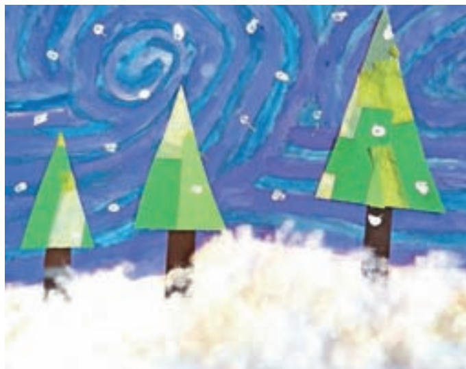
Luka, 3. c

Nekaj toplega, to je tam, kjer se dobro počutimo.