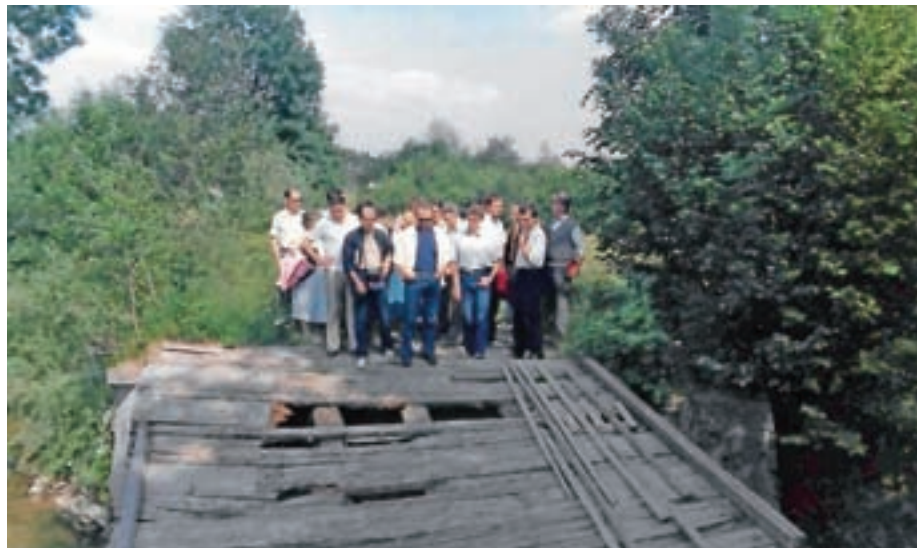
Tako je bila videti cesta Mlaka–Bobovek.

Kljub vsem očitkom se je nekaj stvari v zadnjih treh letih vendarle naredilo. Energetska sanacija in obnova mrljiških vežic, ureditev in priprava prostora za raztros pepela, ki je sedaj pripravljen in se na njem lahko raztrese pepel pokojnih. Polaganje infrastrukturnih vodov na Mlaki (plin, optika, cevi za javno razsvetlavo, postavitve luči), asfaltiranje dela Mlaške ceste in Štefetove ulice, kjer je bil še makadam, ter sanacija mosta pri Oretnekovi jami. Na Mlaki smo zagotovili, da se je postavilo nekaj luči in položilo cevi za javno razsvetlavo. Izgradnja kanalizacijskega omrežja, obnova vodovoda,