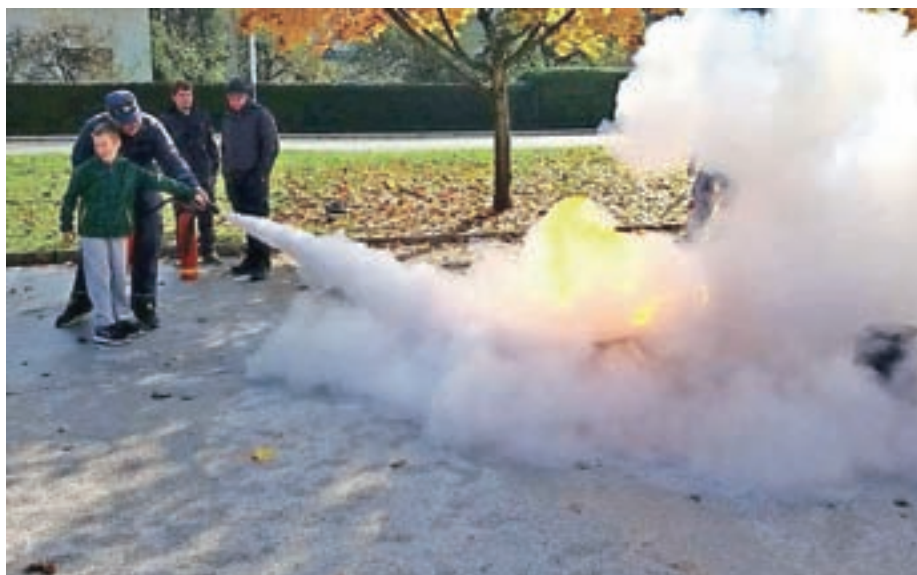
Prikaz gašenja kuhinjskega požara