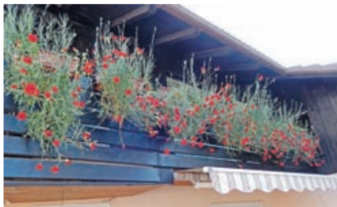
Najlepši gorenjski nagelj, ki ga je vzgojila krajanka Fani Lončar.

Komisija za ocenjevanje urejenosti hiš in vrtov pri Turističnem društvu (TD) Kokrica je tudi v letu 2016 nadaljevala dolgoletno tradicijo in skrbno spremljala stanje na tem področju.