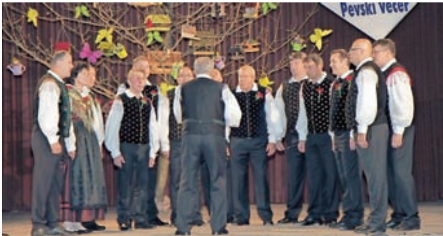
Letos smo pripravili že dvajseti Pevski večer na Kokrici.

Tudi v prihajajočem obdobju imamo plan izvesti pevski večer in nadaljevati s podoknicami. Dela je veliko, vendar verjamemo, da bomo z načrtnim delom in dobro voljo dosegli