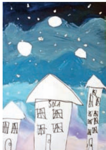
Maša, 2. c

tno vam bo, dobro se boste počutili, otroci vam bodo hvaležni.