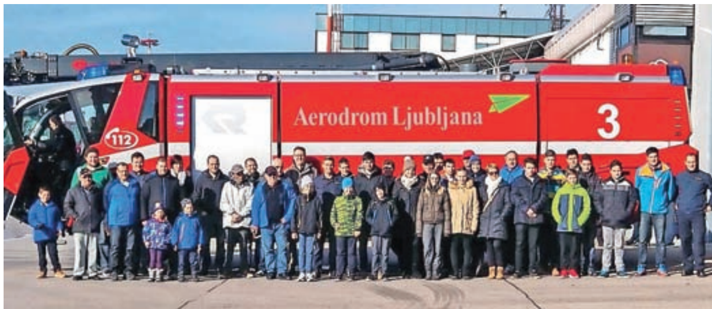
Obisk gasilske enote Brnik

Proti koncu gre še ena jesen, ki pa smo jo kokriški gasilci po poletnem oddihu preživel kar delovno.