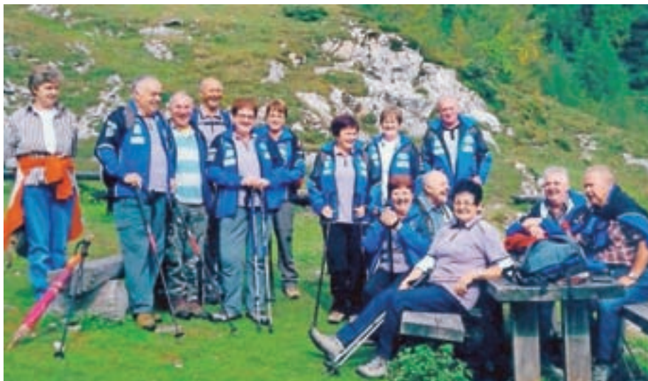
Imeli smo pohode, izlete in druženja, ki nam bodo vsem ostali v lepem spominu.

Z voščilnico smo se spomnili tudi jubilarntov, ki so praznovali okrogle obletnice – 80, 85, 90 in več let. V oktobru smo jih povabili v brunarico Štern. Povabilu se je odzvalo 93 članov, kar je zelo pohvalno. Nagovoril jih je tudi pred-