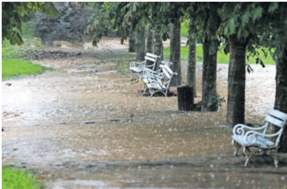
Voda se je prek kostanjevega drevoreda razlivala proti Begunjam.