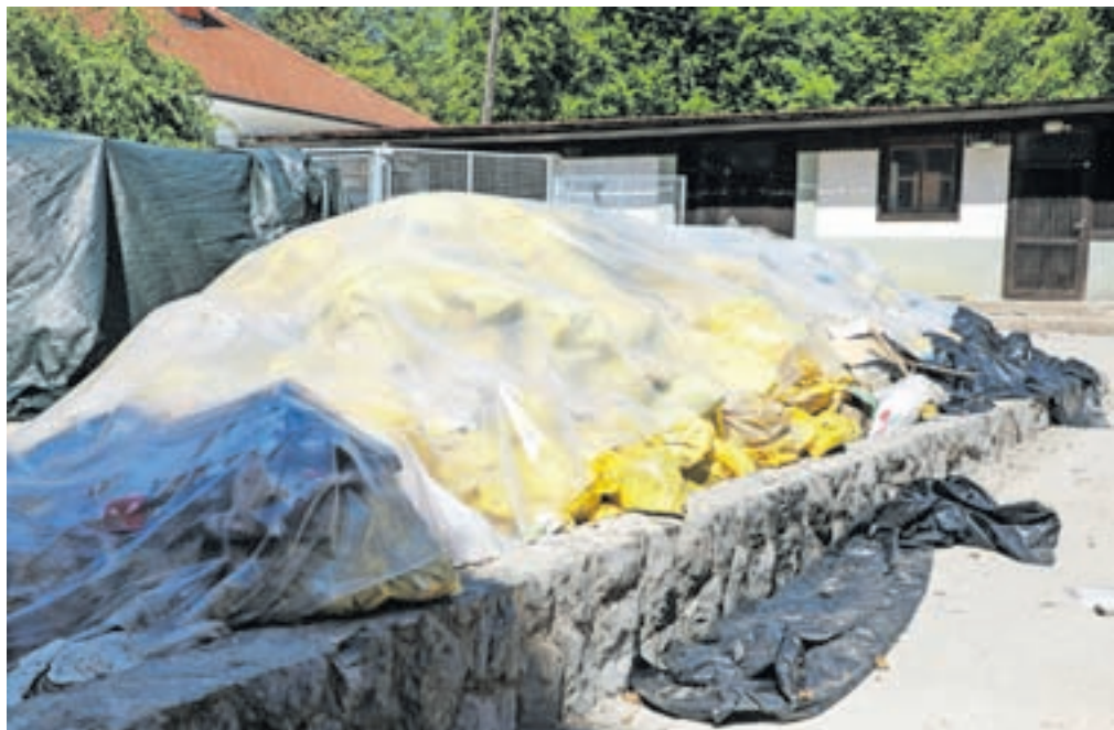
Uničeni arhiv Psihiatrične bolnišnice Begunje

Prijava škode, povzročene ob naravnih nesrečah, poteka na podlagi poziva Uprave Republike Slovenije za zaščito in reševanje (URSZR). Trenutno poziv še ni objavljen, ko pa bo, bodo občane takoj obvestili na spletni strani občine oziroma v medijih, so še sporočili z občinske uprave.