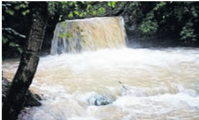
Na Brezjah ne pomnijo, da bi bil slap Peračica kdaj tako vodnat, kot je bil v času nedavnega neurja.