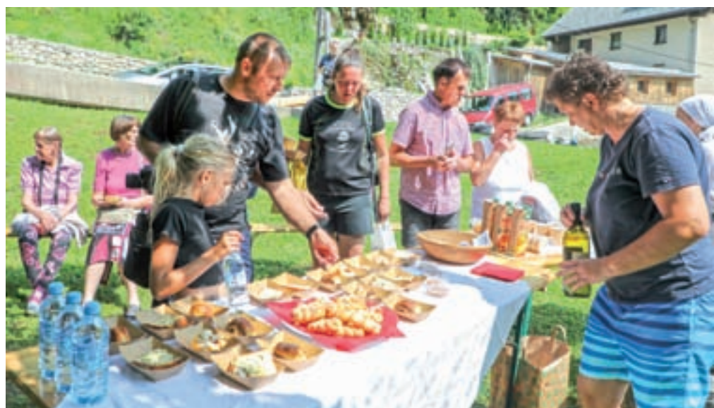
Nageljnov sejem je pritegnil lepo število obiskovalcev, ki so se z veseljem posladkali s kroparskimi dobrotami.