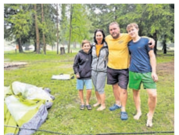
»Bili smo v šotoru in voda je bila vsepovsod. Bilo je grozno,« so dogajanje opisali člani družine Voracek iz Češke.