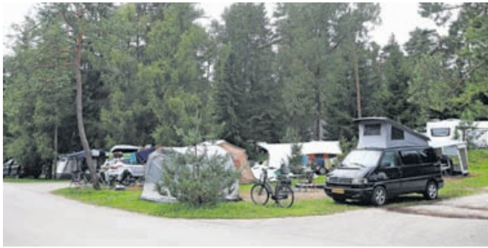
Turistični delavci upajo, da bo sezona odslej vendarle normalno potekala naprej in da bo turizem lahko izkoristil še teh nekaj tednov poletja.

Zavod za turizem pa bo enega od odpovedanih julijskih koncertov na Linhartovem trgu organiziral v torek, 29. avgusta; nastopil bo glasbenik Pedro Makay, načrtujejo pa tudi vsej še eno kino predstavo na prostem. Kdaj in kje bodo predvajali film, je odvisno od vremena.