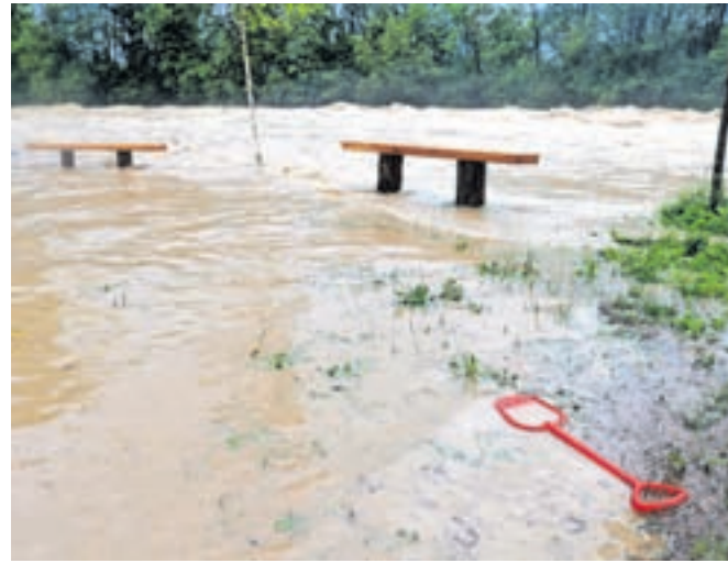
Sava Dolinka je prestopila bregove in poplavlila spodnji del kampa Šobec.

»Bilo je grozno, bilo nas je strah. Bili smo v šotoru in voda je bila vsepovsod. Najprej smo z lopato skopali jarek okoli šotora. Potem smo šli v avto, ker je voda v šotoru še vedno naraščala.