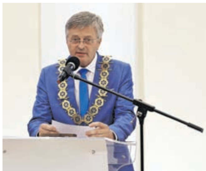
Župan je v svojem nagovoru spomnil na trenutno največje projekte v občini.

V PGD Radovljica se je včlanil pred več kot petdesetimi