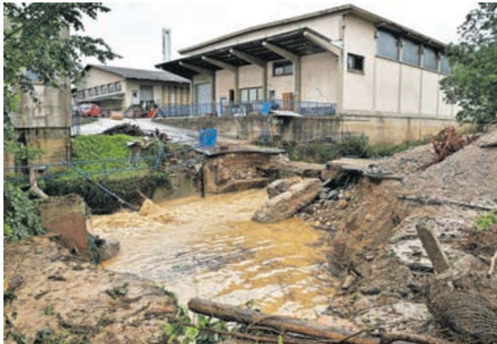
Voda je odnesla tudi most znotraj območja podjetja Elan.

Kot dodajajo na občinski upravi, je urejanje vodotokov izključno v pristojnosti Ministrstva za naravne vire in prostor, Direkcije Repu-