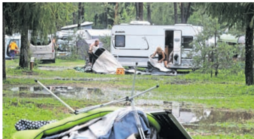
Zjutraj so gostje, ki so noč preživel na suhem v restavraciji kampa, prišli pogledat razdejanje, ki ga je povzročila narasla reka.

Strajnar pravi, da so bili vsi zelo hvaležni za skrb in pomoč. »Ko so odhajali, so se nam iskreno zahvaljevali in nam nato od doma pošiljali pisma z izrazi hvaležnosti. Bila je res huda, a po drugi strani tudi lepa izkušnja.« Kot pravi, so se vsi skupaj šele v naslednjih dneh zavedeli, kako dobro so jo odnesli v primerjavi z mnogimi drugod po državi. »Res dobro, da so pristojni še pravočasno sprejeli odločitev za evakuacijo, tako da se ni nikomur nič zgodilo. In komaj teden dni po ujmi tam, kjer je bilo poplavljen, že stojijo novi šotori.«