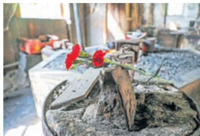
Kot veli tradicija, so nageljni krasili vigenjce.