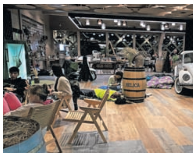
Ko je reka začela poplavljeni, so kampiste s spodnjega dela kampa preselili na varno. Približno 25 jih je noč preživel v Mini klubu, okoli 250 pa v restavraciji Šobec.