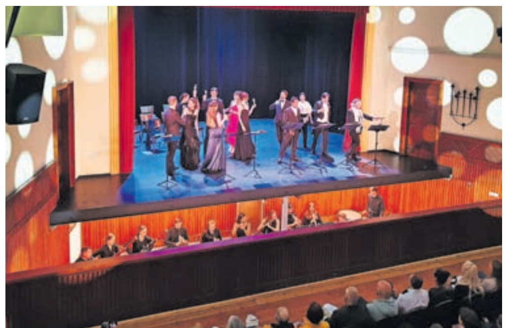
Z operno predstavo Traviata so v Kulturnem domu v Kropi po več desetletjih ponovno obudili orkestrsko jamo.

»S koncertno izvedbo opere Traviata smo zadovoljni, v prvi vrsti tudi zato, da se je kroparska dvorana ponovno izkazala kot zelo dober koncertni prostor. To je lahko spoznala javnost, navdušeni