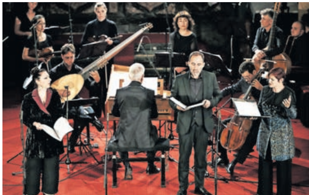
Scarlattijev oratorij Judita je izvedel Festivalski baročni orkester.