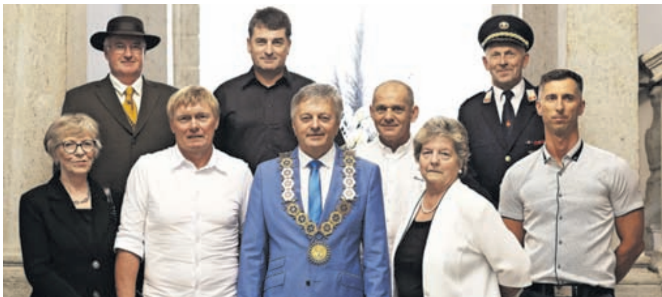
Letošnji nagrajenci z županom Cirilom Globočnikom