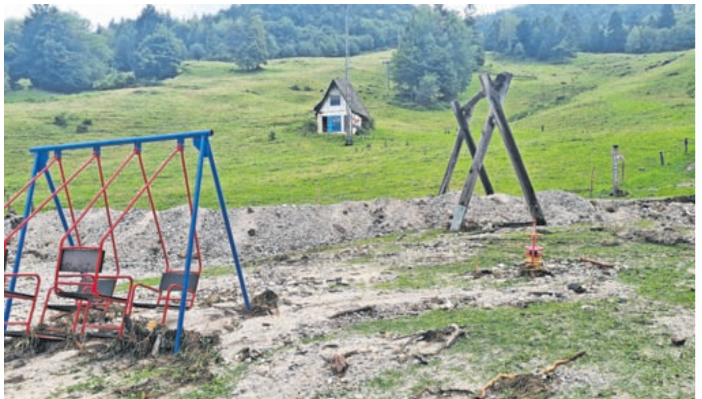
Uničeno otroško igrišče v Krpinu, od koder se je narasla Blatnica razlivala proti graščini Katzenstein.

tek popoldan opravili gasilci, začeli čistiti poplavljenе prostore. »Delalo se je ves dan, zadnji so odšli opolnoči. Civilna zaščita nam je poslala