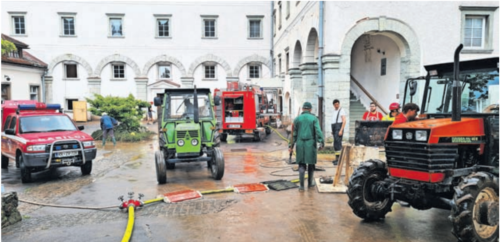
Gasilci, zaposleni in drugi prostovoljci so takoj, ko se je voda umaknila, začeli odpravljati posledice ujme.