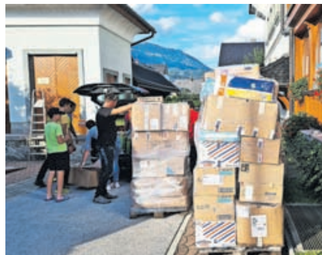
Razvrščene in zapakirane potrebščine so naložili v kombije in na tovornjake, ki so zbrano odpeljali na Koroško.

bi na Koroško odpeljal nekaj najnujnejših potrebščin, so namreč v dveh dneh zbrali