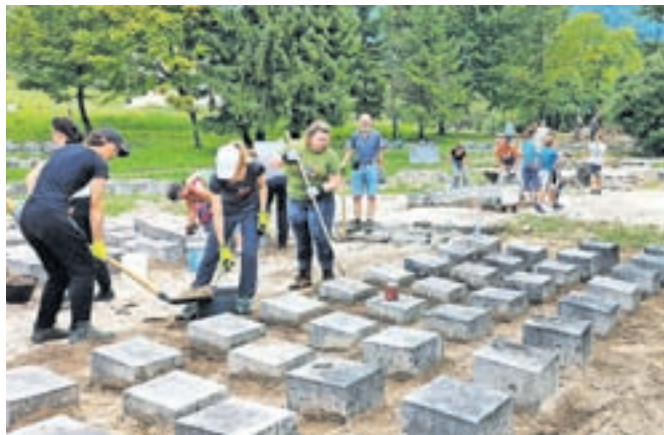
Prostovoljci so s poplavljenega grobišča talcev odstranjevali naplavine, ki jih je tam odložila narasla in rušilna Blatnica.

naplavine in mu vrnilo prvotno podobo. Grobišče z grobovi 457 talcev in 18 borcev druge svetovne vojne v severovzhodnem delu parka je v letih 1952–1953 zasnoval arhitekt Edvard Ravnikar (1907–1993). Na kamnite nagrobnike v obliki prisekanih kvadrov so vklesani podatki o pokopanih talcih in borcih.