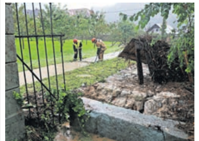
Narasla voda je poplavlila tudi vrt in graščino Katzenstein, kjer ima prostore Psihiatrična bolnišnica Begunje.