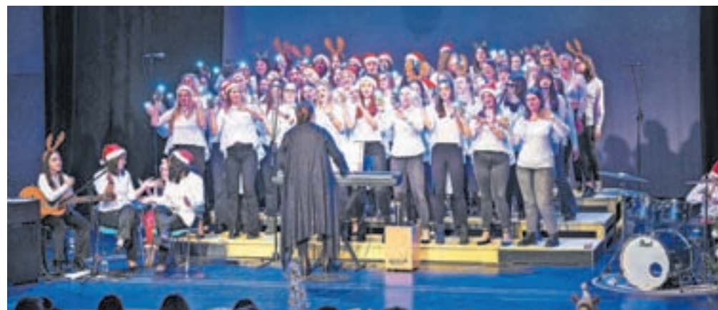
Pevski zbor Letim jeseniške srednje šole letos praznuje desetletnico. Na gledališkem odru se je zvrstilo kar osemdeset nastopajočih.