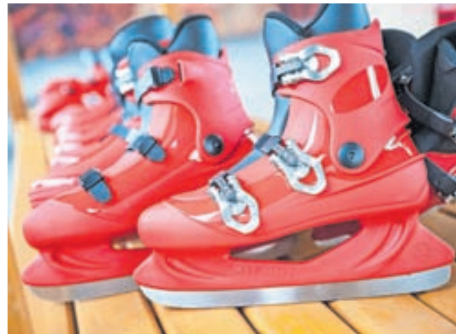
Drسالke si je mogoče izposoditi brezplačno.

dom, kar povečuje varnost obiskovalcev, predvsem otrok in starejših,« so zapisali v TD Gorje, kjer so podobni dršališči uredili tudi v Gorjah in na Bledu. Jeseniško dršališče je ob delavnikih odprto med 16. in