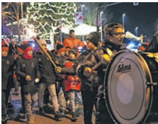
Tradicionalni spreved športnikov skozi Jesenice