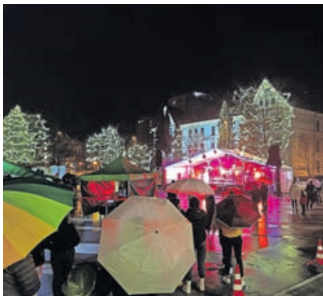
Deževno silvestrovanje na Čufarjevem trgu