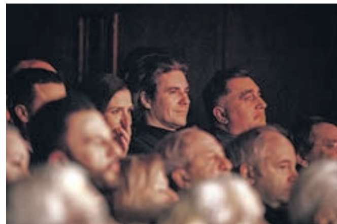
Med gosti v dvorani je bil tudi minister za delo, družino, socialne zadeve in enake možnosti Luka Mesec.