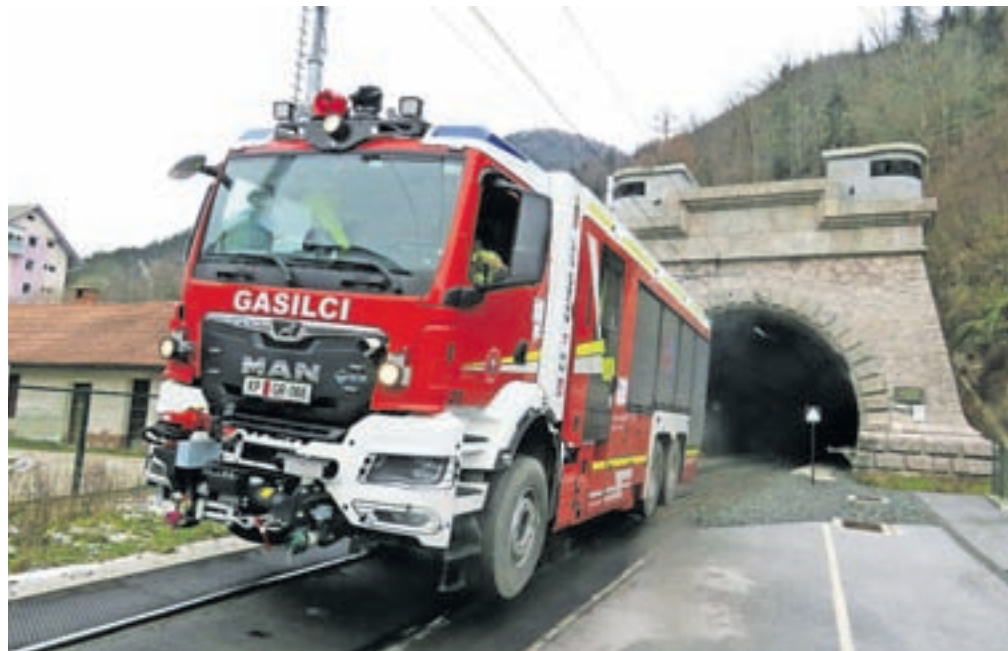
Dvopotni specialni gasilski avtomobil znamke MAN je izdelan v Nemčiji in nadgrajen v Sloveniji. Dolg je 12 metrov, tehta pa 26 ton. Zasnovan je za šestčlansko posadko