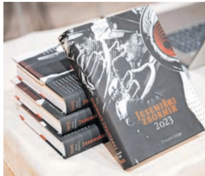
Jeseniški zbornik je mogoče dobiti v Gornjesavskem muzeju Jesenice po ceni 25 evrov.

Borštinar Dovgan, družini Višnar, dveh jeseniških fotografih ... Del vsebine je posvečen jeseniškemu športu, Jeseniškemu sokolu, s prispevkom o prvih Slovincih, ki so preplezali mogočno steno El Capitana, sega na področje alpinizma.