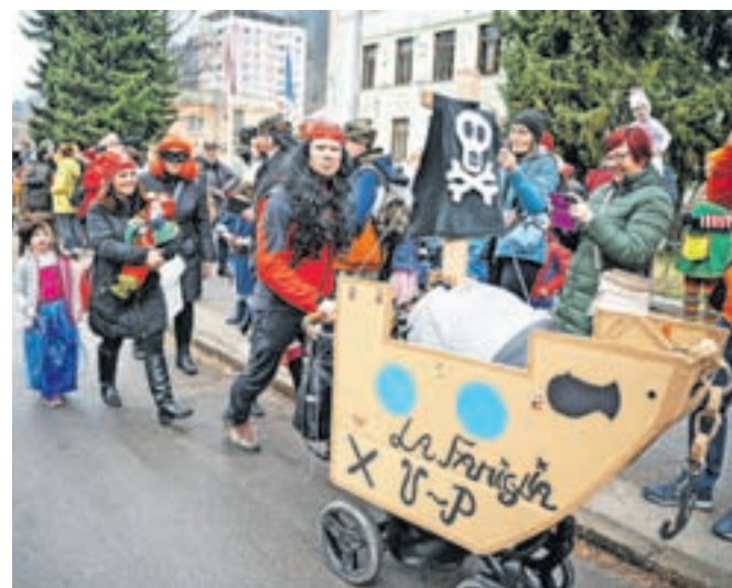
Lani so se Hruščani v pustni povorki skozi Jesenice sprehodili kot Cirkus.

»Obljubljamo, da bo Hruščanski karneval pester in divji, tako kot so bila divja osemdeseta leta, ki jih bomo letos obudili! Osemdeseta leta, 'ko se je dogajal ful' in 'Slovenija bo spet za žur!'. Predstavili vam bomo glasbo, šport, modo ...« napovedujejo. Manjkal ne bo niti legendarni Podarim dobim, ki bo nagradil najboljše pustne maske. Poskrbljeno bo za hrano in pijačo ter nepozabno pustovanje s skupino Arrow in Koranti iz Rogoznice. Na pustni torek pa bo sledilo pustno rajanje za otroke in še en tradicionalni dogodek – sežig pusta.