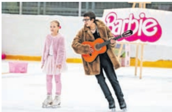
Čeprav je moških v umetnostnem drsanju manj, ima jeseniški drsalni klub vseeno svojega 'Kena'.