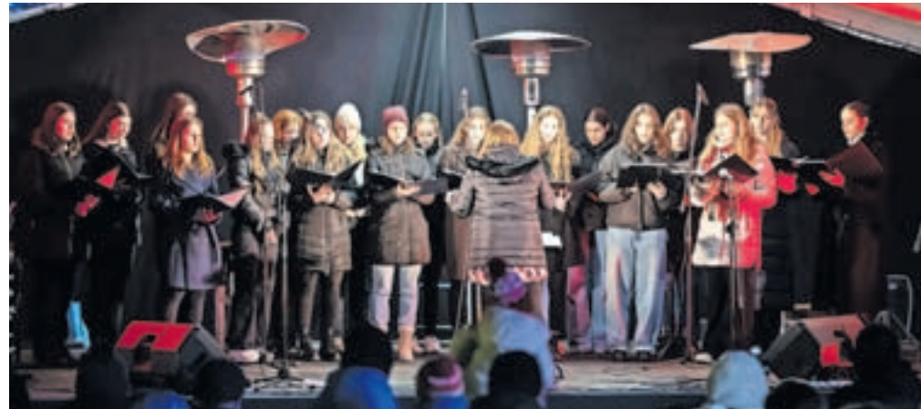
Božična pravljica jeseniških gimnazijk je postregla z nekaterimi največjimi prazničnimi uspešnicami.

Ob koncu leta so svoje glasbene talente pokazali dijaki Gimnazije Jesenice ter Srednje šole Jesenice. Oboji so namreč pripravili svoj božično-novoletni koncert.