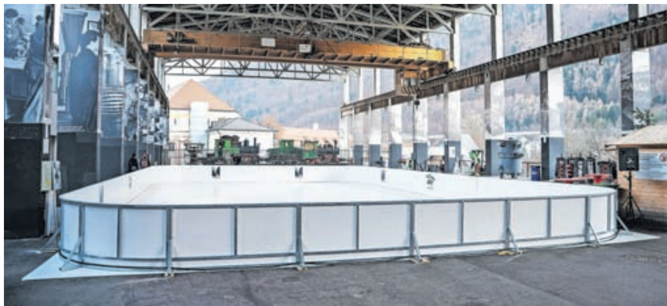
Dršališče je urejeno v muzeju na prostem na Stari Savi.

jo. Na dršališču je prepovedano igranje hokeja, prav tako ni dovoljen vstop s čevlji na plastično površino, so povedali na Zavodu za šport Jesenice.