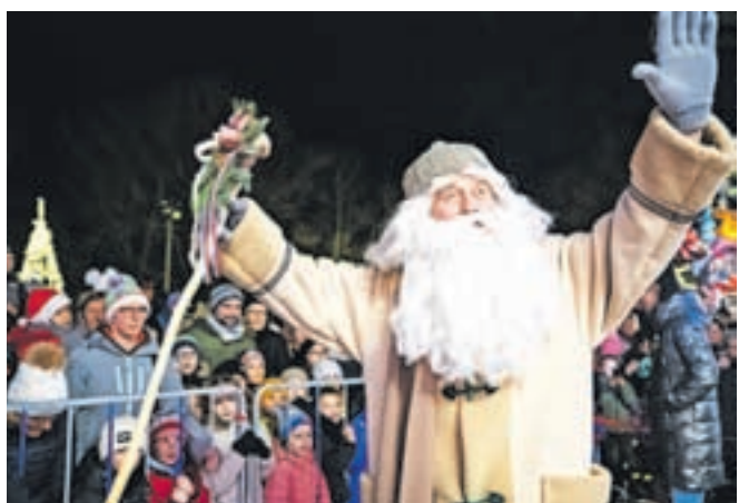
Med najmlajše je prišel dedek Mraz.