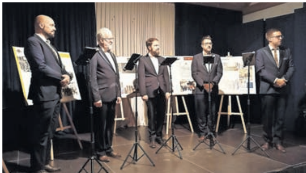
Nastop Kvinteta Vintgar