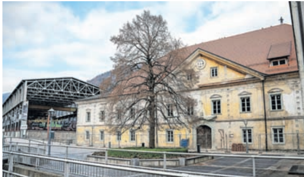
Celovita obnova Ruardove graščine presega finančne zmogljivosti občinskega proračuna, zato brez javnih sredstev ne bo šlo.

Občina Jesenice je v začetku julija prejela odločbo, v kateri je bilo zapisano, da je ministrstvo za kulturo zavrnilo sofinanciranje več kot 500 let stare Ruardove graščine. Prijava na Javni razpis za izbor kulturnih projektov na področju nepremične kulturne dediščine in kulturnih projektov iz programa sanacije najbolj ogroženih in najpomembnejših kulturnih spomenikov v letih 2023 in 2024 je bila torej neuspešna, in kot so pojasnili na občini, jim je za prejem sredstev zmanjkala zgolj ena točka. »Predstavniki ministrstva so svojo odločitev utemeljili, da smo z vlogo dosegli zgolj 19 točk, glede na vrednost razpoložljivih in zaprosenih sredstev pa so bili izbrani tisti projekti, ki so dosegli 20 ali več točk,« so pojasnili z občine in dodali, da so se po pregledu celotne dokumentacije odločili za tožbeni zahtevek za odpravo izpodbijane odločbe ter vrnitev upravnemu organu v nov postopek. Sodba je potrdila, da projekt obnove graščine izpolnjuje pogoje za pridobitev dodatnih točk in za pridobitev financiranja.