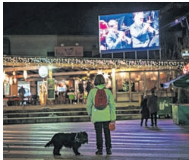
Prenos koncerta na prikazovalniku na Trgu Toneta Čufarja