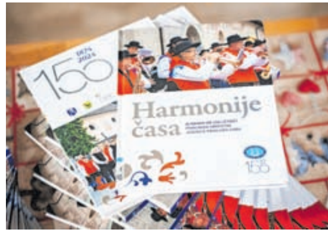
Kronistka orkestra in urednica Štefanija Muhar je predstavila almanah Harmonije časa, izdan ob 150-letnici orkestra.