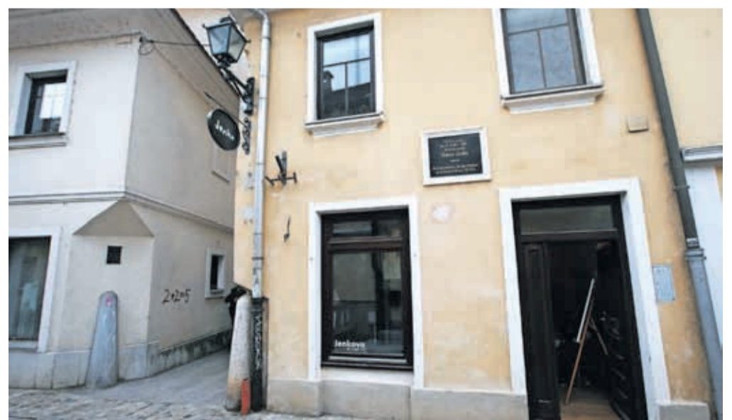
Jenkovo rezidenco, del nastajajočega razpršenega hotela, so odprli v hiši v središču Kranja, v kateri je nekaj časa prebival pesnik Simon Jenko.