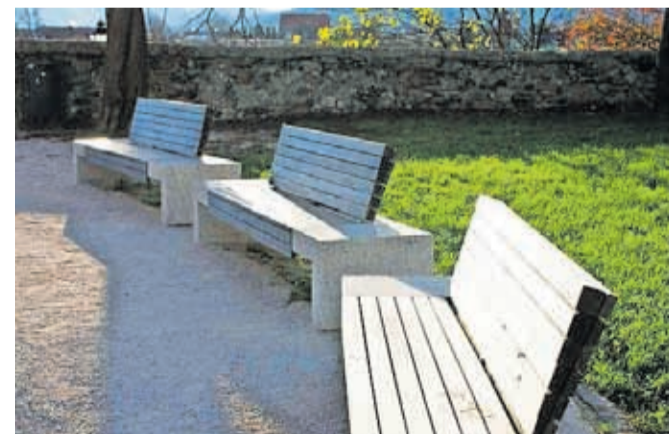
Klopi na Pungertu

za podnebno nevtralnost in občinski program varstva okolja. Vprašalnik bo aktiven do 31. maja. Spletna oblika je dostopna na spletni strani MOK (na naslovnici oz. v rubriki Ankete) ali prek QR kode (na sliki) za mobilne naprave. Na voljo so tudi tiskani izvodi vprašalnika v Mestni knjižnici Kranj, sprejemni pisarni MOK in Layerjevi hiši. V tem primeru naj sodelujoči izpolnjeni vprašalnik vrnejo na isto mesto, kjer so ga prevzeli, ali pa ga pošljejo po pošti na naslov: Mestna občina Kranj, Slovenski trg 1, 4000 Kranj, s pripisom »Podnebno nevtralen Kranj«. Za sodelovanje se občanom v mestni upravi že vnaprej zahvaljujejo.