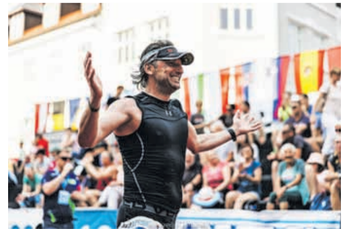
Lani so gledalci napolnili tribuno in okolico proge ter navijali za ultramaratonce.

Nagradni sklad za zmagovalce je letos bistveno višji, saj bosta zmagovalka in zmagovalec 12-urnega teka prejela po tisoč evrov ter prijavnino za partnersko ultratekmo v Braziliji. Poleg tega bo najboljši tekač prejel še poseb-