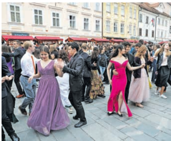
Maturantska četvorka na Glavnem trgu v Kranju