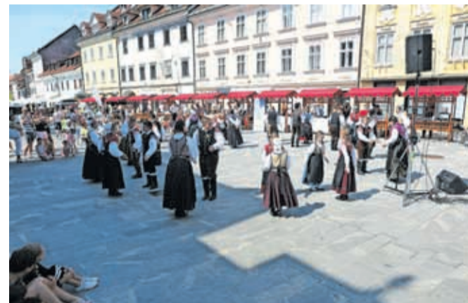
Utrinek s Pozdrava poletju leta 2021

krajšega sporeda z vseh področij kulturno-umetniškega ustvarjanja. Hkrati bo na panojih in stojnicah potekal tudi sejem nevladnih organizacij, kjer bo prostor za promocijo kulturnih društev in drugih nevladnih organizacij, promocijsko gradivo lahko oddate tudi na skupno stojnico ZKD Kranj. Rok za oddajo prijavnice in s tem potrditve udeležbe je četrtek, 9. junij, na elektronski naslov zkd.kranj@gmail.com.