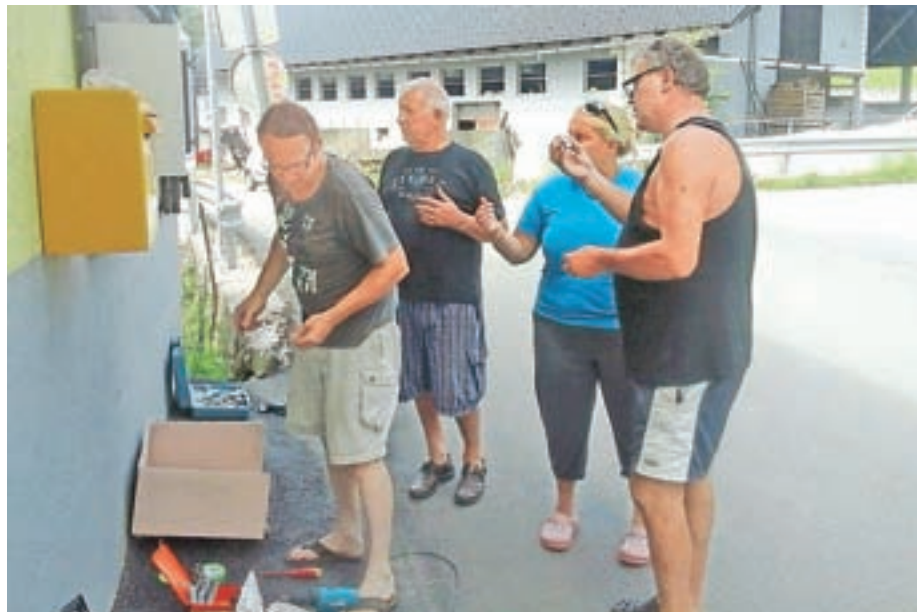
Namestili so defibrilator.

Pobudo za nabavo te naprave so dali bašljanski prostovoljci iz krajevnega odbora Rdečega križa Bela - Bašelj, podprl jo je tudi krajevni odbor Bašelj. Začeli smo akcijo zbiranja denarja, poslali smo prošnje za donatorstvo, po domovih pa začeli zbirati prostovoljne prispevke. Odziv nas je pozitivno presenetil in v mesecu dni smo zbrali dovolj denarja. Po izboru najugodnejšega ponudnika (od petih prijavljenih), smo se odločili za defibrilator AED CD plus, ki je tudi kompatibilen z večino drugih, ki delujejo v širšem kranjskem območju. Ker je strošek nakupa povezan tudi z dodatnimi ukrepi (informiranje, označevanje, servisiranje in izvajanje tečajev za prve posredovalce iz temeljnih postopkov oživljanja z uporabo AED kot tudi za splošne predstavitve laikom – posameznim vaščanom in osebam, ki so za to znanje zainteresirane), smo na podlagi prošenj dobili tudi finančno pomoč Občine Preddvor (župan) in večinske občinske stranke PLS (Povezane lokalne skupnosti).