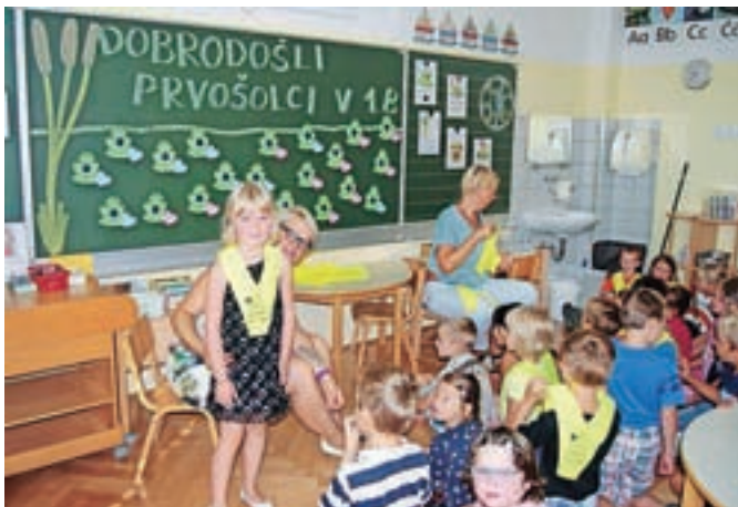
Prvošolce so opremili z rumenimi rutkami, da bodo vidni v prometu.