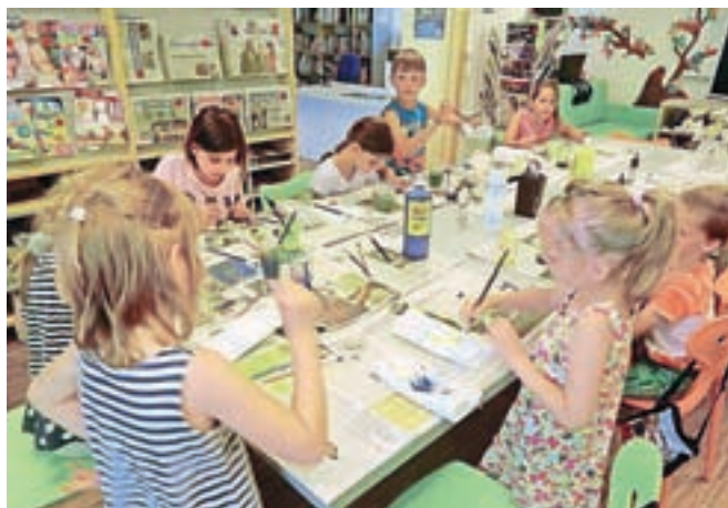
Zanimive ustvarjalne delavnice

Med letošnjimi poletnimi počitnicami je bilo v TIC-u zopet pestro. Otroci so se udeležili zanimivih in zabavnih ustvarjalnih delavnic, na katerih so vsako sredo v juliju in avgustu nastajale umetnine vseh vrst. Na devetih delavnicah so izpod spretnih prstkov nastale ogrlice iz testenin, minion, lačni morski psi in ljubke morske deklice. Izdelali smo še kamnite žabice, prikupne pisane želvice, mehke plišaste igračke, strašne krokodile in zabavne naprstne lutke. Udeležba je bila različna, odvisna od vremena in dopustniških dni. Povprečno se je delavnic udeležilo po osem otrok, največji obisk pa je imela delavnica izdelovanja lačnih morskih psov iz plastenk, ki se jo je udeležilo 15 ustvarjalcev. Včasih so se otrokom na delavnici pridružili tudi starši. Izbira materiala je bila ekološko usmerjena. Zbirali smo plastenke, kartonaste tulce blago in volno in nabrano spremenili v nekaj lepega in uporabnega, pri ustvarjanju smo uporabili tudi naravni material.