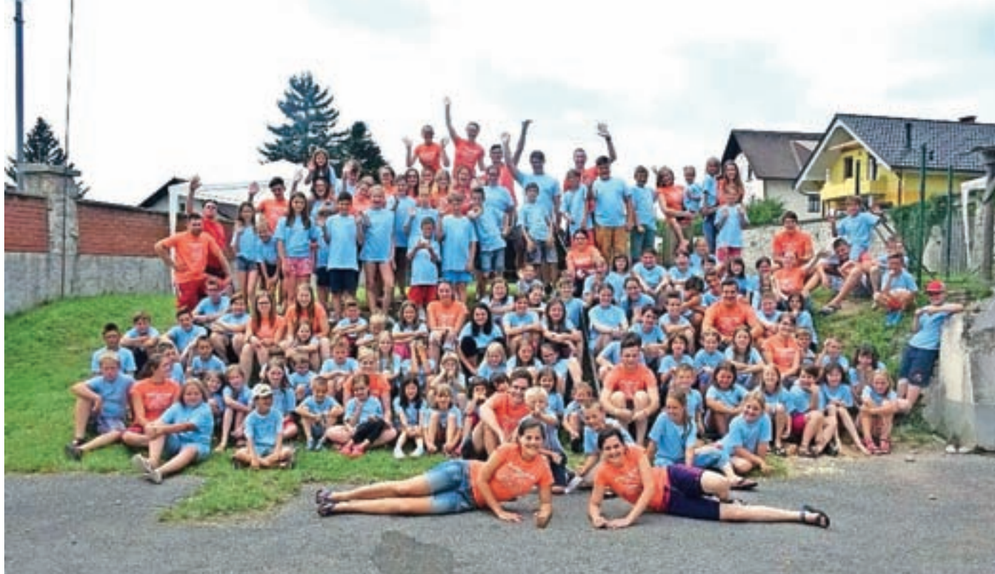
Udeleženci oratorija v Preddvoru