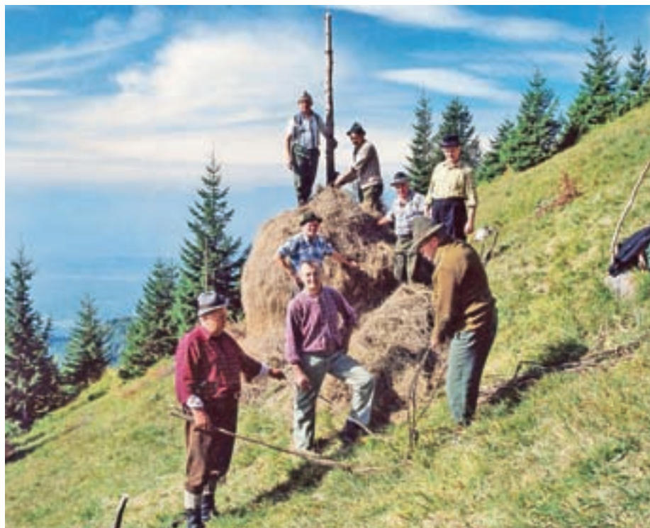
Snarji na Zaplati

Zaplata in Preddvor že več kot 850 let živita v sožitju. V listini vetrinjskega