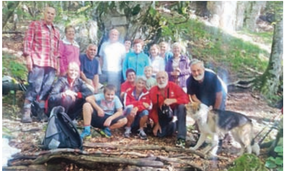
Pohodniki k bolnišnici Košuta

"Pred vsakim pohodom, se pravi trikrat letno, se odpravim do bolnišnice, da pregledam urejenost poti. Okoli bolnišnice počistim veje in pograbilim listje s strehe. Na grobišču poberem sveče in jih odnesem v dolino. Pred kratkim smo