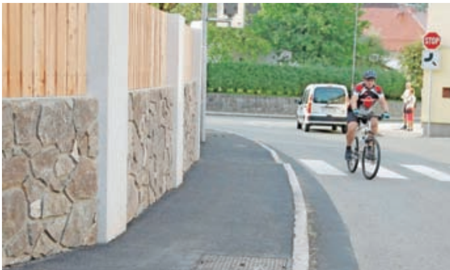
S pločnikom varnejši v središču Preddvora