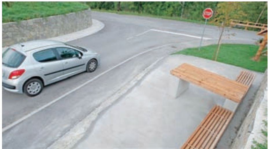
Središča vasi dobivajo končno podobo, na sliki Bašelj.