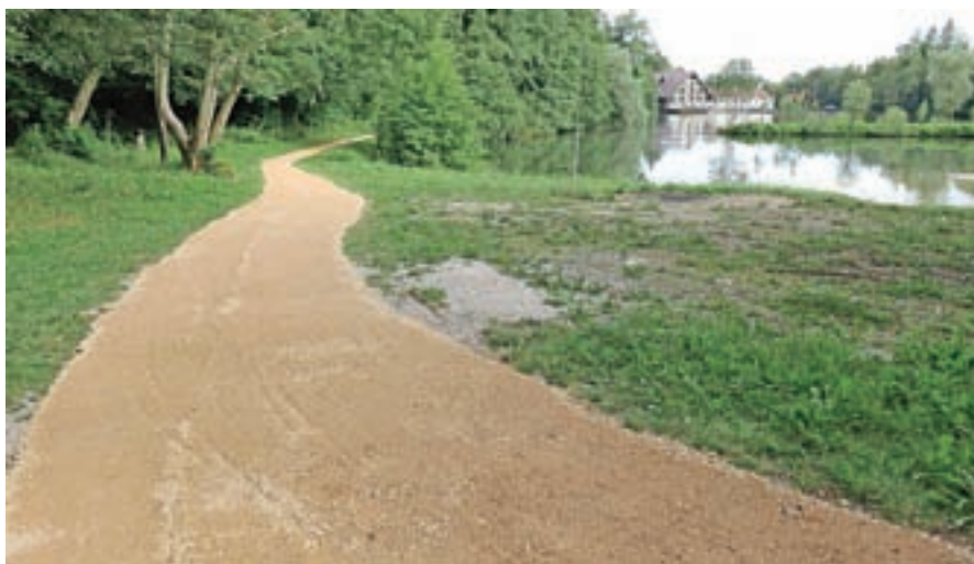
Na novo nasut del poti ob jezeru

Občina Preddvor je letos pridobila soglasje lastnikov zemljišč ob jezeru Črnava in čez poletje je Zavod za turizem Preddvor že uredil del okolice jezerske obale. Zamenjali so koše za smeti, na novo je nasut del sprehajalne poti na severnem delu obale jezera, obnovljena sta mostička čez potok Bistrico in čez jez, delajo še nove klopce in tako bo za številne obiskovalce, ki se tako radi sprehodijo v tem prekrasnem naravnem okolju, poskrbljeno, da bodo prihajali še raje in še večkrat, saj je sprehod ob jezeru zanimiv prav v vseh letnih časih za vse generacije obiskovalcev.