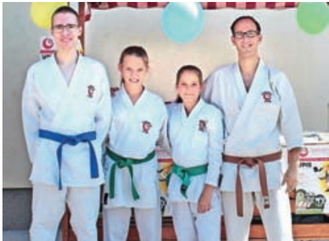
Stojnica Karate kluba Cerklje in del ekipe na Festu po rokovem