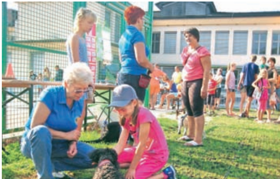
Program za otroke in ljubitelje psov je pritegnil veliko obiskovalcev.

Z bogatim celodnevним programom je dodobra popestril zadnjo soboto v avgustu.