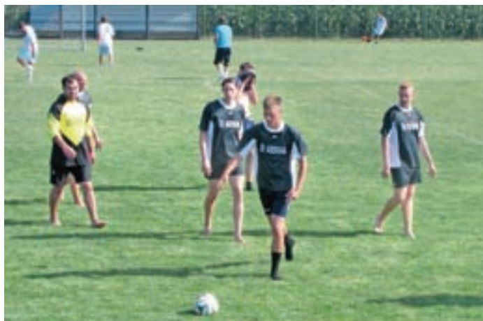
Na turnirju bosih nog je sodeloval tudi ŠD Adergas.

Nogometni klub Velesovo ob občinskem prazniku vsako leto organizira turnir Bose noge. Letos je turnir še posebej začinila prva članska tekma v 3. SNL-center.