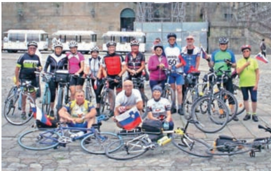
Skupinska slika pred katedralo sv. Jakoba na koncu poti

S kolesom smo prevozili 880 kilometrov dolgo pot do Santiaga de Compostele v Španiji.