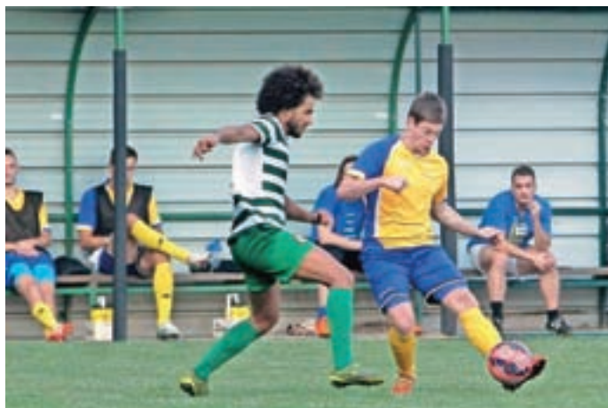
S tekme tretje slovenske lige med Velesovim in ljubljansko Irirjo 1911

Nogometni praznik je prvi dan odprla selekcija U-9 NK Velesovo v tekmi proti NK Kranj, na kateri je bilo v ospredju igranje nogometa, in ne rezultat. V popoldanskem času so imeli turnir U-11, na katerem pa je po odpuvedu nekaterih ekip nastopil samo NK Šenčur, tako da je bila nato odigrana le medsebojna tekma z