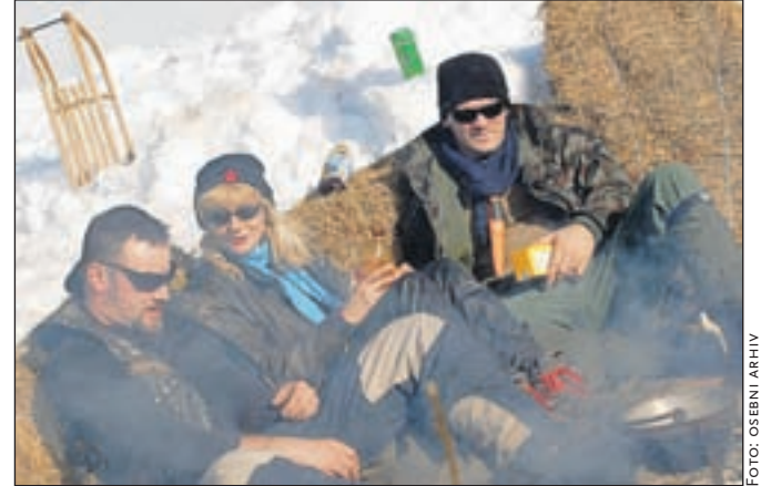
Na srečanju smo našli 27 motoristov in eno motoristko.