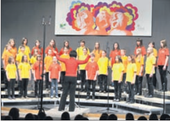
Mladinski pevski zbor OŠ Davorina Jenka Cerklje na Gorenjskem