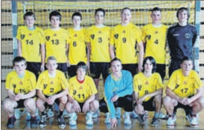
Ekipa kadetov RK Cerklje

"V sredini maja rokometaši zaključujemo nadvse uspešno sezono, ki pa je bila tudi zelo naporna. Naši fantje vse od septembra trenirajo tudi po petkrat na teden, med vikendi pa tekmujejo, a naporno delo se je izplačalo. Najbolj uspešna je bila letošnja sezona za naše kadete, ki so se pod vodstvom trenerja Matije Mušiča uvrstili med šestnajst najboljših ekip v Sloveniji in bodo sredi maja igrali za uvrstitev med mesti 13. in 16. To nam ni uspelo še nikdar doslej in za tako majhen klub, kot je naš, je to izreden uspeh. Gre za rezultat načrtnega dela z mladimi in na to ekipo smo zares ponosni," je zadovoljen predsednik Rokometnega kluba Cerklje Bojan Korbar , ki je vesel tako uspešnega podmladka. Tudi člani si bodo sezono zapomnili kot zelo uspešno, saj so si že štiri kroge pred koncem tekmovanja zagotovili obstanek v 1. b moški državni rokometni ligi, v kateri so letos nastopali prvo sezono. Veliko optimizma po športni plati v klubu vzbujajo tudi ekipa mlajših dečkov. Po besedah njihovega trenerja Jožeta Cudermana gre za izredno nadarjeno generacijo, kakršne v Cerkljah še ni bilo. "Igralce imamo, ne vemo pa, kako dolgo bomo še zdržali. Posluha gospodarstva za šport na Gorenjskem ni, in če za nas ne bi imel posluha župan Franc Čebulj, ne bi mogli več igrati," je vsem za podporo hvaležen Korbar, igralci pa sporočajo, da bi si v prihodnje želeli še bolj bučne podpore s tribun. J. P.