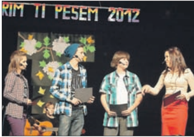
Mladi voditelji so s svojimi komentarji popestrili že tako bogat program.

bo tako preživljanje odmorov prijaznejše in koristnejše. Hodnike bi radi olepšali tudi s cvetličnimi koriti in panoji za razstave in obeštila, z vitrinami, kjer bi bila shranjena priznanja, pokali in drugi dosežki naših učencev," je načrte šole po uspelem koncertu predstavila ravnateljica. Svoje nastope so tudi letos ovekovečili s kamero, posnetek celotne prireditve, ki ga je pripravil Vido Frantar, je na voljo v osnovni šoli.