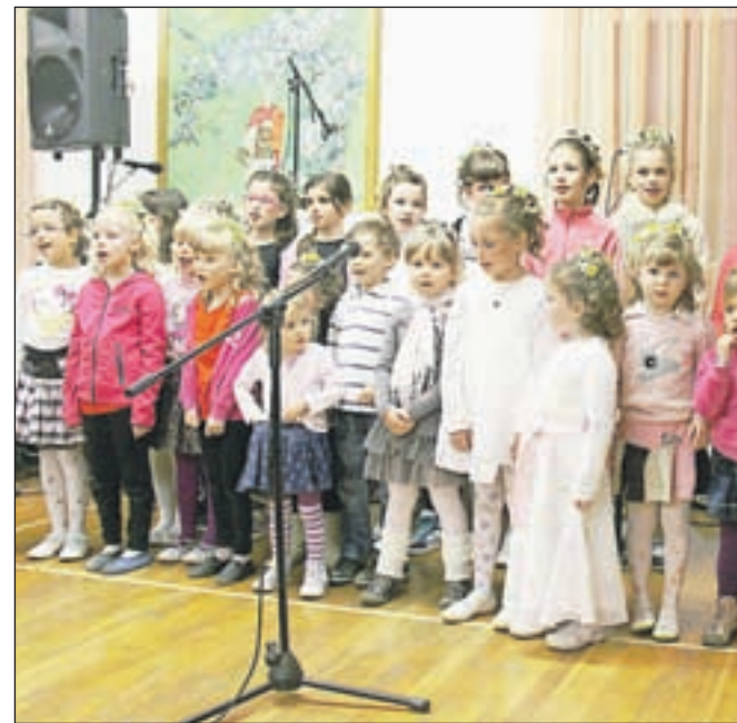
Otroci so nas navdušili s pesmicami in plesom.

Tudi letos je bila v Lahovčah tradicionalna prijetna proslava ob materinskem dnevu. Sobota, 24. marca, je bila za okolico in naše mame velik dan. Dopoldne smo vsi prispevali k čistejšemu okolju, v poznih popoldanskih urah pa so stekle še zadnje priprave na večerno prireditev ob materinskem dnevu. Nastopajoči so bili tako kot vsako leto nad vse lepo urejeni, za pričeske je znova poskrbela vaška frizerka, ne samo otroci, tudi gasilski dom je bil lepo okrašen. Otroci so nas navdušili s pesmicami, deklaracijami in plesom, na koncu pa je sledil tudi skeč. Dvorana je kar pokala po šivih in vsi, ki smo kakorkoli prispevali, da je še en materinski dan uspel, smo bili zelo zadovoljni. N. R.