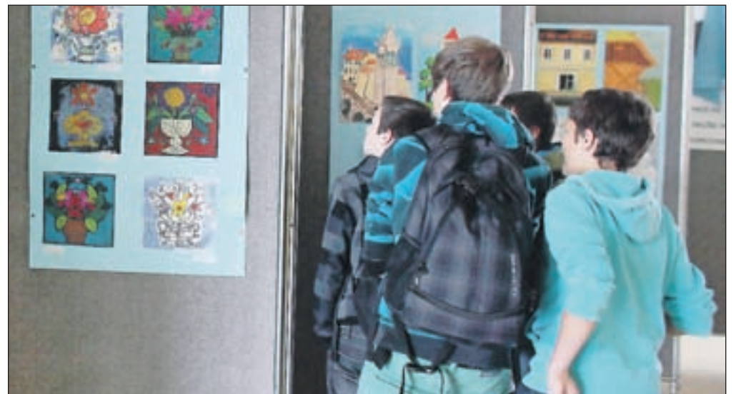
Razstava likovnih del na šolskem hodniku