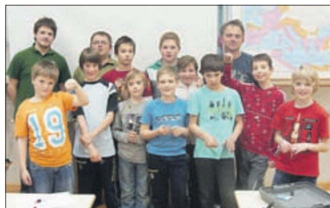
Udeleženci ribiškega krožka

Ribiški krožek je namenjen otrokom cerkljanske osnovne šole od 4. razreda dalje, pa tudi vsem drugim, ki jih zanima ribolov ter kakovostno preživljanje prostega časa v naravi. Srečanja ob lepem vremenu potekajo na brežinah ribnikov, v primeru dež-