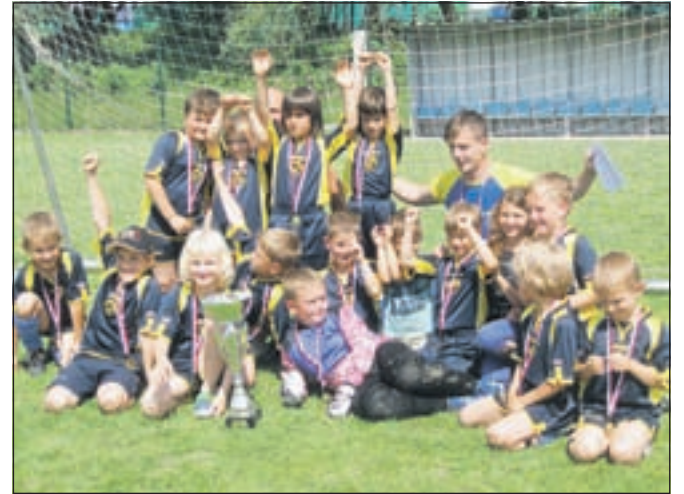
Uspehov na tekmovanjih se veselijo tudi najmlajši nogometaši.

ligo, treningi pa so potekali v Športni dvorani Cerklje, Zalogu in Kranju. Organizirali smo zimske priprave, ki se jih je udeležilo skoraj sedemdeset članov kluba. Dobili smo pozitiven odziv, saj so se otroci štiri dni športno družili, dvakrat na dan trenirali, odigrali prijateljske tekme in se učili timskega dela. Trenutno smo na polovici spomladanskega dela sezone, zato o rezultatih še ni moč govoriti, je pa že znano, da so vse ekipe tehnično in številčno napredovale. Žal smo sredi sezone iz ligaškega sistema izpisali ekipo mladincev, zaradi nezadostnega števila igralcev, saj ni bilo več moč nastopati na tekamah. Igralci, ki so ostali, danes pridno trenirajo in igrajo v Šenčurju, kjer se kalijo v višji ligi. V Šenčurju imamo že dve sezoni nekaj domačih mladinskih igralcev, na katere računamo, da nam bodo v prihodnje okrepili člansko ekipo, ki ima trenutno še vse odprte možnosti za morebitno visoko uvrstitev na lestvici. Dobro dela