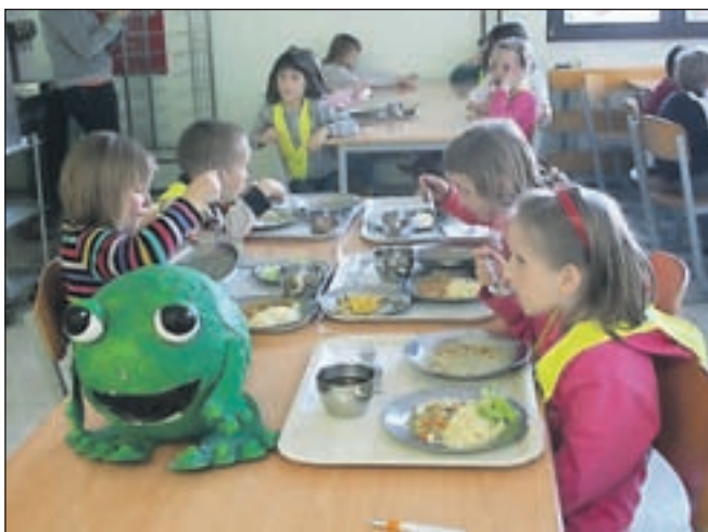
Otroci so jedli, da se je kuharicam in učiteljem kar smejalo.

Po opravljenih domačih nalogah smo se v krogu zbrali na hodniku in poročali o naših uspehih, občutjih, spoznanjih, odločitvah ... Od 177 otrok nas je 164 jedlo solato, običajno pa le dobra tretjina. Otroci, posebno pa