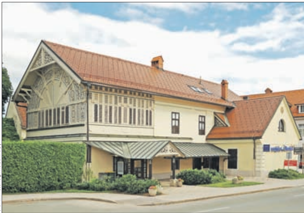
Med priljubljene točke ogledov sodi tudi Hribarjeva hiša v središču Cerklj.