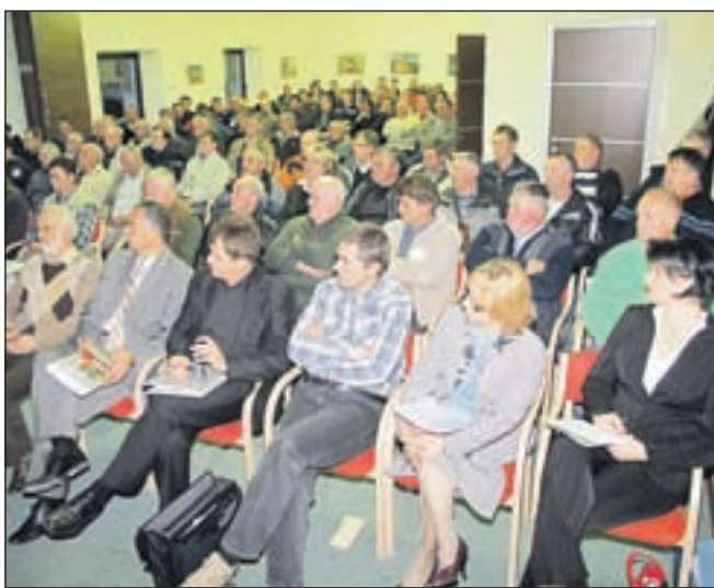
Na občnem zboru Kmetijske zadruge Cerklje

čin Cerklje in Šenčur je bilo kasneje ustanovljenih več zadržnikov. Nekatere med njimi so usahnile, druge so se medsebojno združevale. Proces združevanja so se tako stekli v zadrugi Cerklje in Šenčur, ti dve pa sta se združili v Kmetijsko zadrugo Cerklje, ki ima danes 733 zadržnikov. V zadnjem obdobju je Kmetijska zadruga Cerklje, ki skupaj s svojimi predhodnicami obeležuje 120-letno tradicijo, veliko vlagala v povečanje poslovnih prostorov, zlasti trgovin. Pokriva celotno občino Cerklje, skoraj celotno občino Šenčur ter občini Komenda in Moravče.