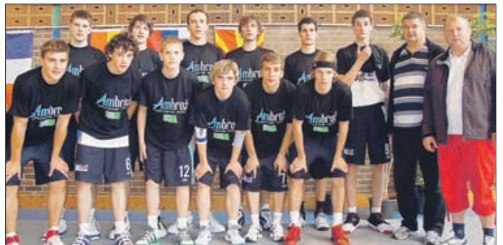
V Franciji bo maja nastopila tudi mladinska ekipa košarkarjev iz Športnega društva Krvavec.

Cerklje - Turnir, imenovan Henri Seux, ima dolgo tradicijo, saj je bil prvič organiziran leta 1983. Pod okriljem evropske košarkarske organizacije FIBA ga organizira tamkajšnji košarkarski klub Ardres. Letos (potekal bo od 24. do 30. maja) bo že trideseti po vrsti in naša ekipa Europcar Krvavec se ga bo udeležila desetič. Na turnir v Francijo nas je pripeljala želja po igranju košarke in druženju z evropskimi vrstniki. Košarkarski prijatelji so nas nato povabili v angleški Eastbourne in irski Moyculen, Tralee in Oranmoor. Pa v poljski, Wroclav in Gdansk, ter litvanski mesti Kaunas in Marijampole. Vabijo nas tudi v Romunijo (Targo Mures), v Bolgarijo (CSKA Sofija) ter v Skopje, Beograd Trebinje in na Martinique na tamkajšnje degustacijo ruma. Na turnirju v Ardresu bo letos sodelovalo kar trideset ekip iz različnih držav. Lanski zmagovalac turnirja je bila ekipa Pas de Calais. Še leta poprej pa ekipe Ile de France, Kaunas iz Litve, hrvaški Dubrovnik, nacionalna elitna ekipa ZDA in Beograd iz Srbije.