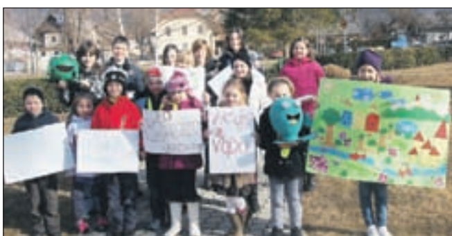
Učenci so s svojimi žabicami in plakati ropotali po vasi.