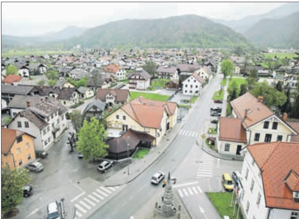
Cerklje z okolico se letos potegujejo za naziv najlepšega manjšega mesta v Evropi.