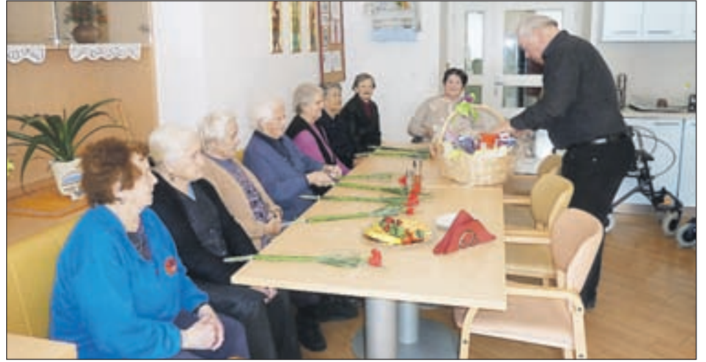
Župan na obisku v Domu starejših občanov Preddvor