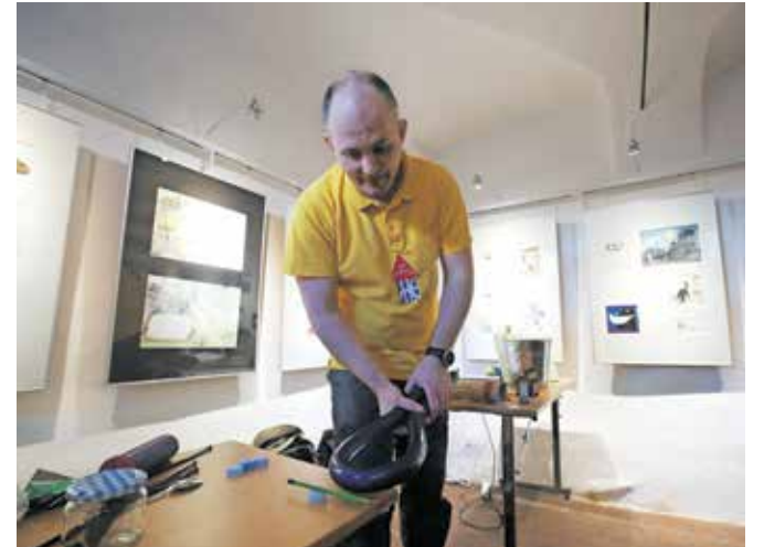
Na odprtju razstave so mladi obiskovalci z navdušenjem sodelovali na delavnici o elektriki, s katero je v Radovljici sodelovala Hiša eksperimentov.