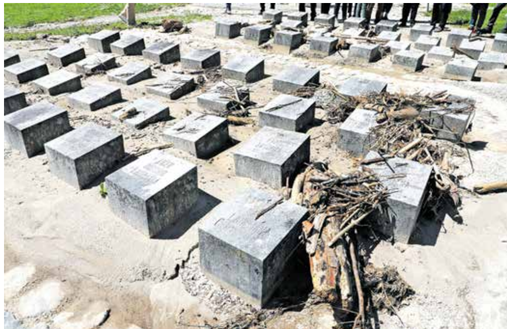
V proračun so z rebalansom vključena tudi sredstva, ki jih je občina pridobila za obnovo v vodni ujmi poškodovanega grobišča talcev na vrtu graščine Katzenstein v Begunjah.

Spremembe pri odhodkih so posledica prilagajanja dinamiki izvajanja investicij, pridobljenim nepovratnim sredstvom ter višjim materialnim stroškom, stroškom energentov in plač. »Med večjimi spremembami je vključitev sredstev za prenos zgrajene komunalne opreme zemljišč za stanovanjsko gradnjo. Povečujejo se sredstva za dozidavo Vrtca Radovljica z razvojno ambulanto ter dozidavo in prenovo kuhinje vrtca, za šolske prevoze in investicijsko vzdrževanje šol. Povečujejo se tudi sredstva za dokončanje obnove kulturnega doma v Kropi, v proračun je na novo vključena obnova grobišča talcev v Begunjah. Več bo sredstev za odpravo posledic škode na gospodarski javni infrastrukturi zaradi naravne nesreče v preteklem letu. Dodatna sredstva bodo namenjena dokončanju prve faze projekta komunalne infrastrukture v Kamni Gorici, to je izgradnja kanalizacije, vodovoda in obnovi javnih površin, ter pripravi projektno dokumentacije za drugo