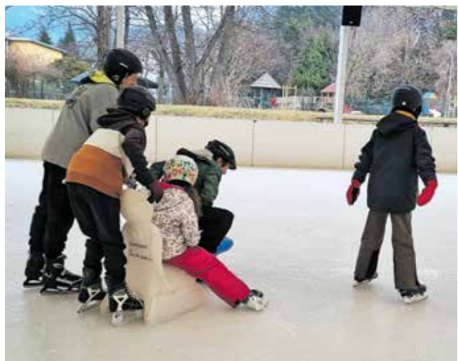
Otroci so uživali na drsanju v radovljiškem športnem parku in plavanju v Vodnem parku Bohinj.

»Otroški smeh ter zadovoljni, veseli in nasmejani obrazi so največja nagrada in spodbuda, da bomo zimske aktivnosti organizirali tudi prihodnje leto.«