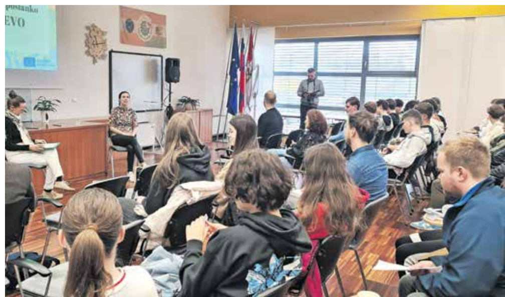
Mladi iz Ekonomske gimnazije in srednje šole Radovljica ter udeleženci Pumo+ / v pogovoru s poslanko Evropskega parlamenta Ireno Jovevo

Joveva, ki je otroštvo in mladost preživela na Jesenicah, pred študijem politologije pa zaključila ekonomsko gimnazijo v Radovljici, jim je povedala, da so jo politična in družbena vprašanja zelo zanimala že v otroštvu. Ogovorila je, da je v Evropskem parlamentu med mlajšimi, da pa je najmlajša poslanka