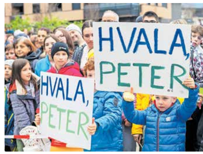
Posebej navdušeni nad športnim junakom so bili najmlajši, ki so ga v velikem številu prišli pozdravit na Vurnikov trg.