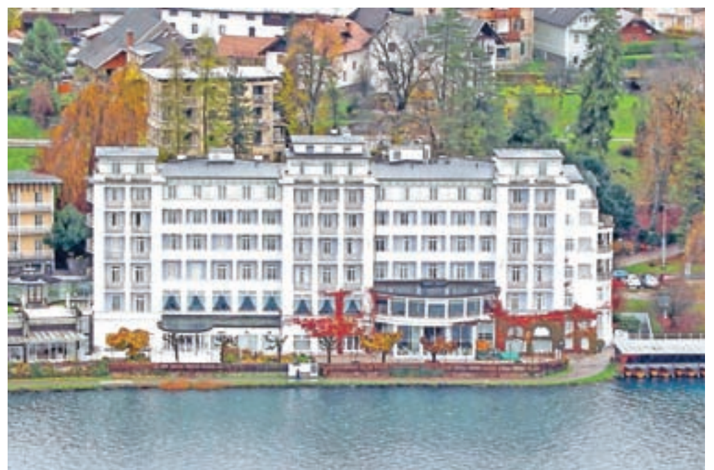
Enega najboljših hotelov na Slovenskem Grand hotel Toplice je leta 1931 postavila znamenita blejska hotelirka iz družine Vovkovih Julia Molnar.

Iz parka se lahko po pešpoti nad Grajskim kopališčem povzpemo na grad, kjer nas obvezno pričakalepo obnovljen grajski park. »Vsa grajska vzpetina je izjemno arheološko najdišče. Doslej najlepša znana najdba je broška v obliki pava iz šestega stoletja, ki se je je oprijelo ime rajska ptica in predstavlja perzijski simbol večnega življenja.« Bled se v pisnih virih prvič omenja leta 1004, grad pa 1011. »Sicer je bil v potrepih večkrat porušen, a so ga vedno obnovili ter je tako danes ena najstarejših in najlepše ohranjenih tovrstnih stavb na Slovenskem, ki stoji na daleč najmarkantnejši poziciji z najlepšim razgledom na skoraj 130 metrov visoki skali nad jezerom.« Blejska posest je bila le leto manj kot osem stoletij v nepretrgani lasti južnotirolskih škofov iz Briksna, ki so posest upravljali prek zakupnikov. »Med