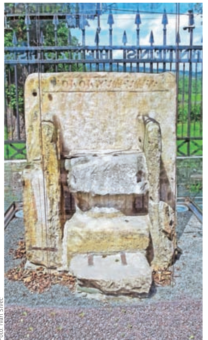
Vojvodski prestol pri Gospe Sveti (Maria Saal)