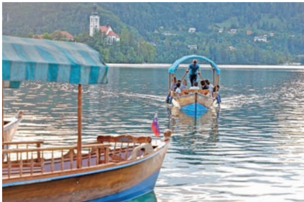
Pletne so že stoletja prepoznani simbol Bleda, s katerimi so prve romarje na otok vozili že v dvanajstem stoletju.

Bled se v pisnih virih prvič omenja leta 1004, grad pa 1011. »Sicer je bil v potresih večkrat porušen, a so ga vedno obnovili ter je tako danes ena najstarejših in najlepše ohranjenih tovrstnih stavb na Slovenskem, ki stoji na daleč najmarkantnejši poziciji z najlepšim razgledom na skoraj 130 metrov visoki skali nad jezerom.«