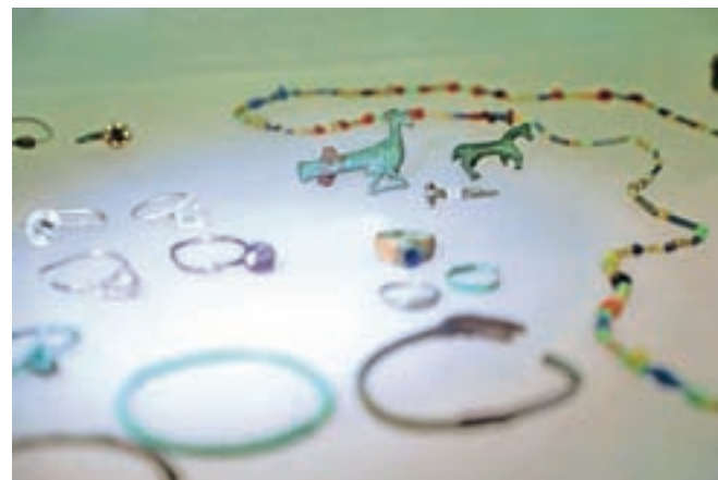
Vsa grajska vzpetina je izjemno arheološko najdišče. Doslej najlepša znana najdba je broška v obliki pava iz šestega stoletja.

institucije ustavnega sodišča in avtor ustave prve avstrijske republike, katere kopijo uporabljamo vse postkomunistične dežele. Na blejskem pokopališču je spominska plošča njegovi materi.«