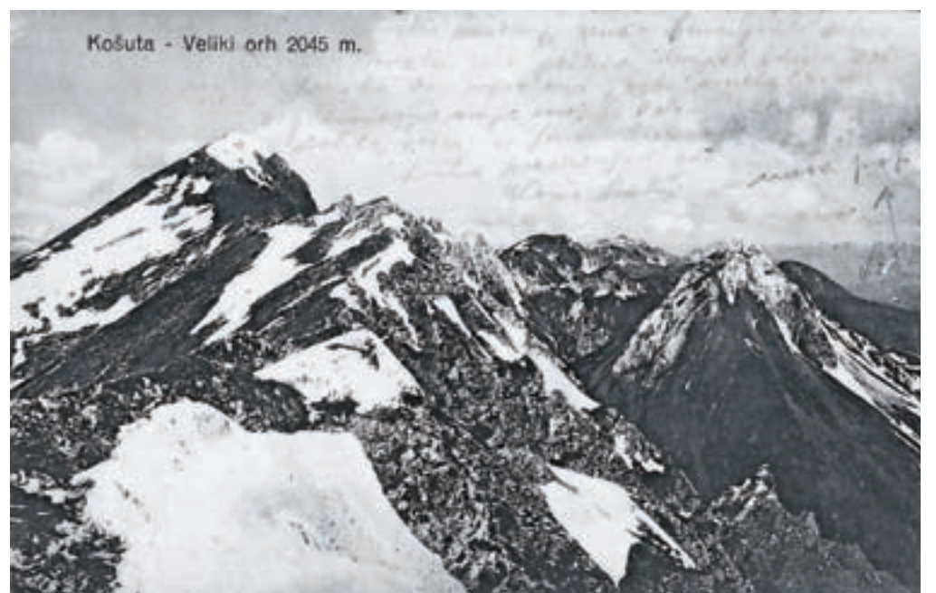
Stara razglednica grebena Košute, kjer je prikazan Veliki vrh. Zadaj se vidi tudi Ljubeljska Baba.

– Iz Begunj je bila markirana pot čez Kališče mimo turistovske kočice v Završnici do Begunjščice