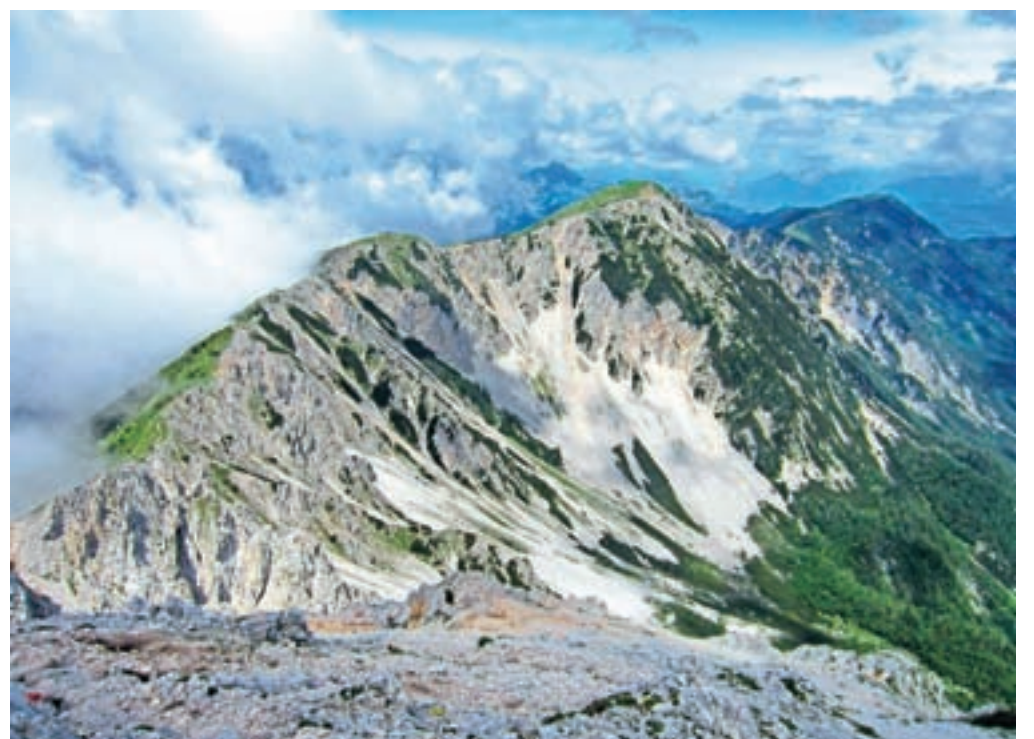
Če na vrhu Stola pogledamo proti zahodu, se pokaže greben proti Vajnežu in Struški.