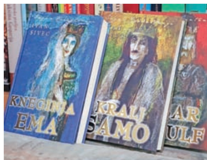
Trije deli sage o Karantaniji