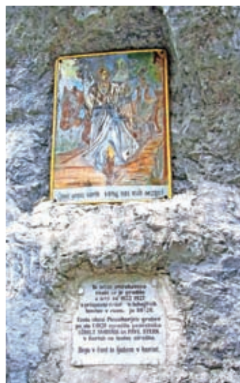
Plošča na skali ob cesti skozi Korške peči priča, da so morali Korčani za svojo cesto plačati tudi sami.