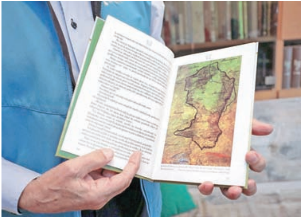
V knjigi je zemljevid ozemlja nekdanje Karantanije od juga Poljske do današnje osrednje Slovenije.

lobiral pri nekdanji sošolki, ki je prav tako delala v Slovenskem etnografskem muzeju. Ko me je le sprejel, sva se pogovarjala kar štiri ure, saj je spoznal, da že kar nekaj vem o tej temi, o prehrani Karantancev, njihovi delavnosti, običajnem življenju. Prešinilo me je, da tudi slovenska ljudska pesem izhaja iz Karantanije. Poslušajte: »Prišla bo pomlad, učakal bi jo rad, da bi zdrav, vesel lepe pesmi pel ...« To je nekdo spesnil, ker je komaj čakal na pomlad. Včasih je veljalo, če si preživel zimo, boš živel še eno leto.