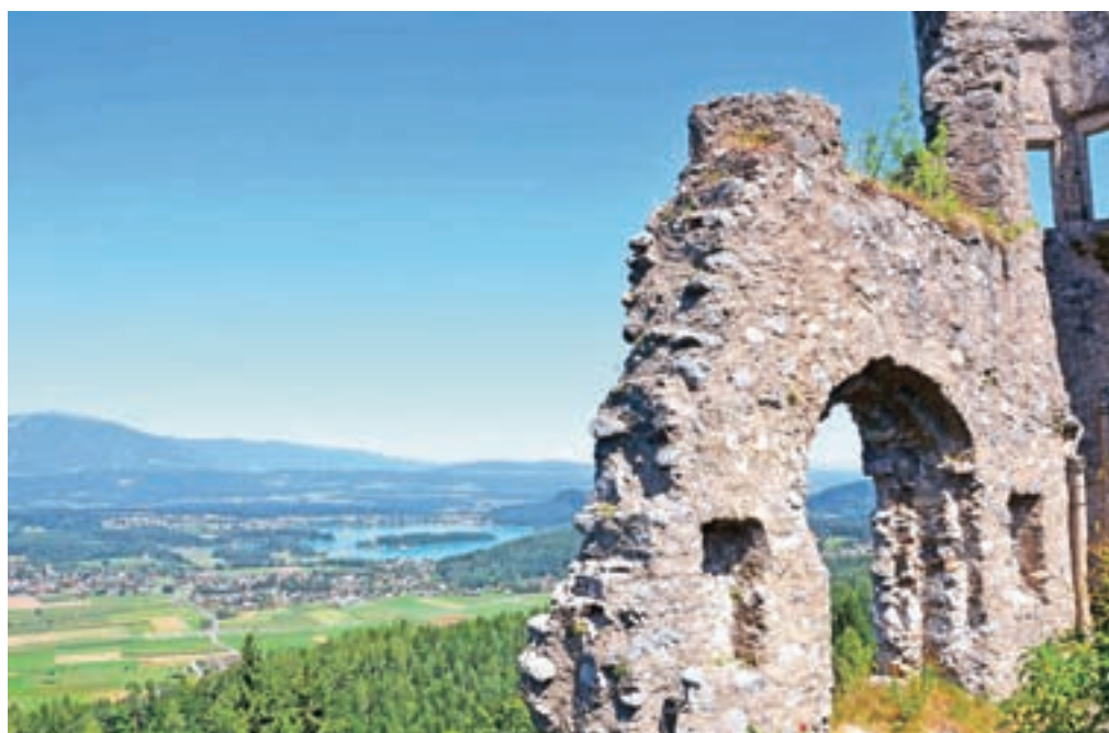
N mav čriez jizaro – Baško jezero je poleti priljubljeno pri kopalcih; pogled s Starega gradu nad Ločami.