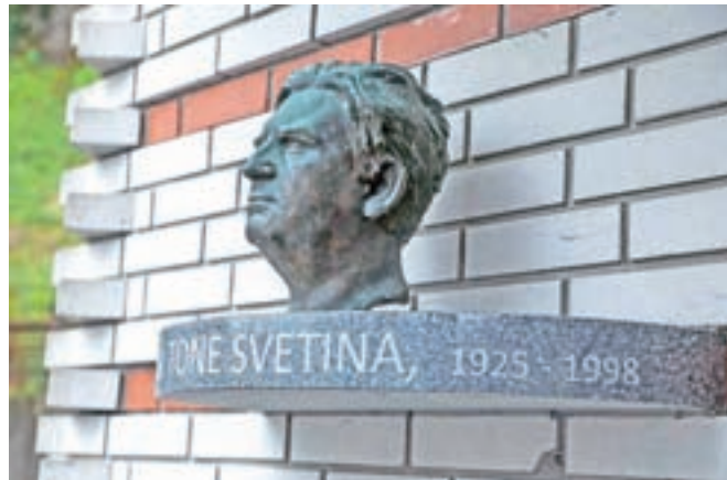
Na Mlinem je živel in delal pisatelj in kipar Tone Svetina, na katerega spominja doprsni kip na pročelju tamkajšnje trgovine.