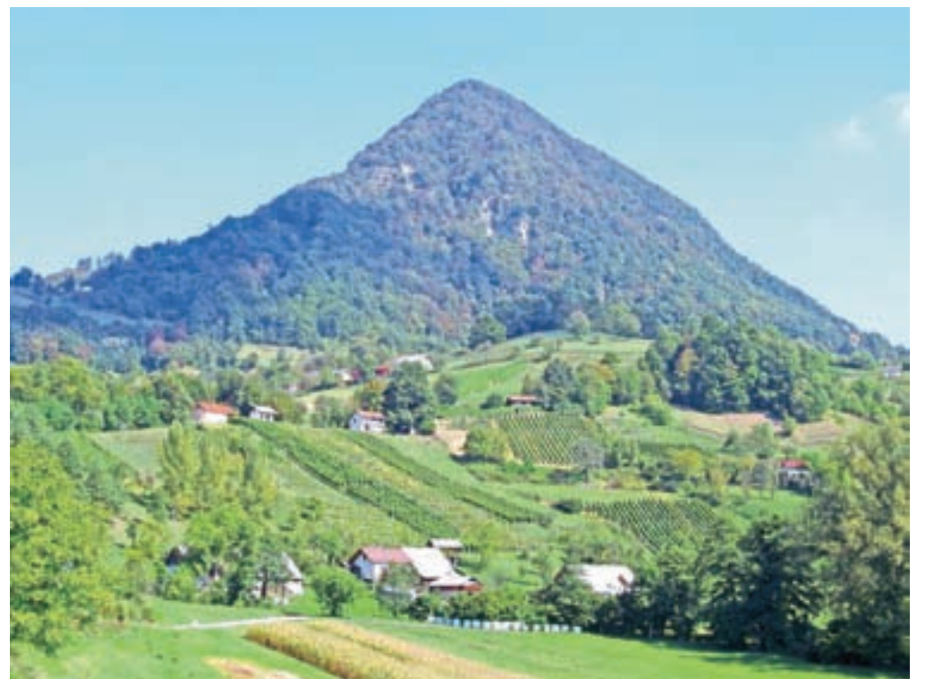
Donačka ali Rogaška gora, imenovana tudi Vzhodni Triglav, kjer poteka prva urejena planinska pot v Sloveniji in s tem tudi v Karavankah

Presenetilo me je dejstvo, da v knjižici, ki jo hrani Slovenski planinski muzej, ni kjer ni nobenega opisa poti za Peco, čeprav sem prepričana, da so bile na to mogočno goro, kjer spi kralj Matjaž, prve poti precej hitro markirane.