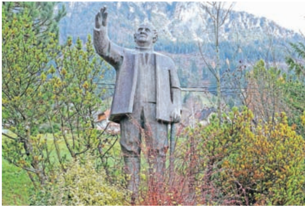
Spomenik v čast Jakobu Aljažu stoji na desni strani glavne ceste proti Kranjski Gori na križišču Mojstrana - Dovje. Ogled ne vzame veliko časa, a obiskovalcu podari spomin na enega najbolj klenih Slovencev.

Aljaž je bil dušni pastir in vodnik v boljše, naprednejše čase. Bil je med načrtovalci dovškega vodovoda, Voga hrani dokument gasilskega društva, da so vodovod blagoslovili leta 1924. Spodbujal je tudi sajenje sadnih dreves. Kar doma je imel posojilnico