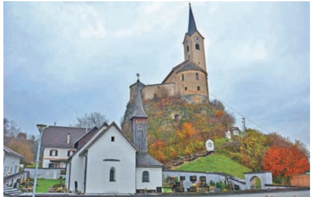
Cerkev svetega Lovrenca kraljuje visoko nad vasjo Kamen v Podjuni. Njeni temelji segajo verjetno že v 11. stoletje.

Ko je Albuin zagledal okamenelo deklo Lupo, je uvidel svoj zločin in se skesal. Zjokal se je in prelil veliko solz, da je oslepel. Liharda mu je tedaj že odpustila, prosila ga je le, da naredi pokoro. Slep je odšel na romanje v Oglej, Rim, Santiago de Compostela in v Jeruzalem, ob vrnitvi pa je umrl v Mohlichah (Möchling), čisto blizu doma, kjer je pokopan v tamkajšnji cerkvi. Njegova vdova Liharda je po tistem skrbel za otroke, služila Bogu in pomagala revežem, katerim je njen grad postal pribežališče. Slomšek je o njej zapisal: »Bila je usmiljena mati Slovencev, kateri so ob krajih Drave živeli, in tudi po svoji smerti jih pozabila nij, kajti je sporočila, naj se vsako leto na dan njene smerti ubogim gosti naredite, ki se na Kamenu pri božjem opravilu snidejo.«