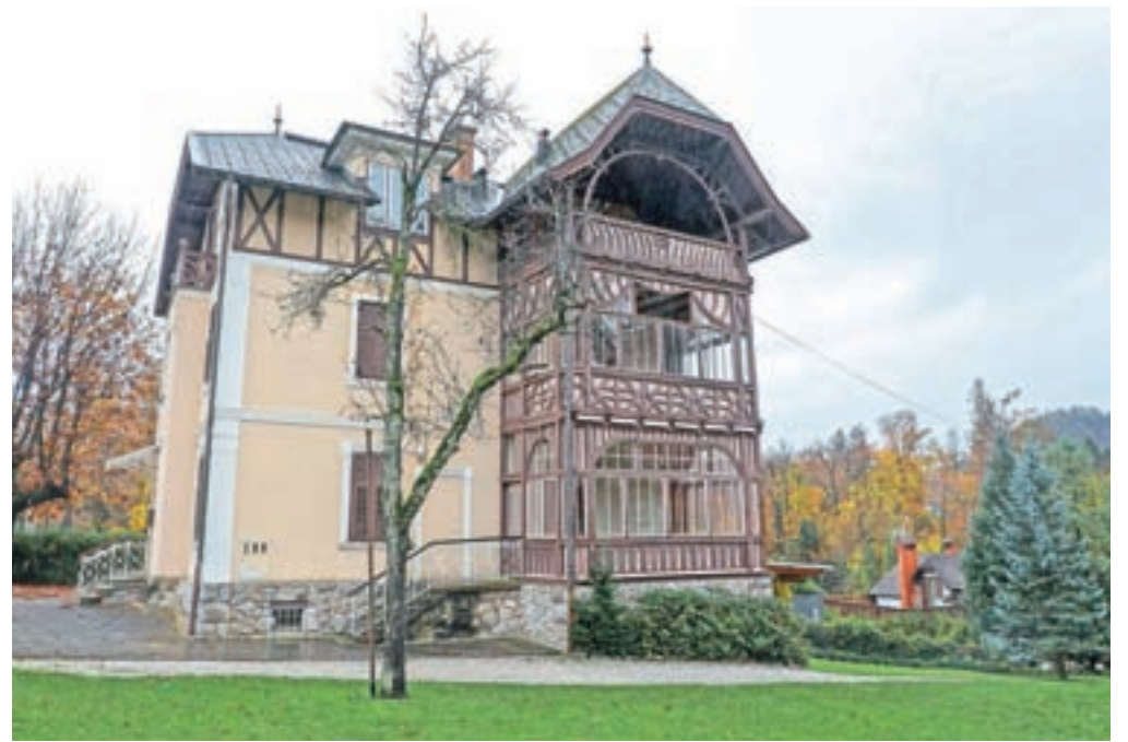
Vila dr. Josipa Plemlja