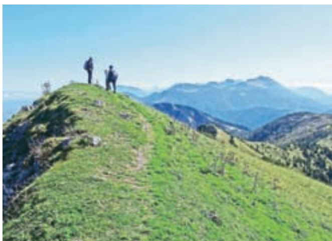
Pogled na vrh Dovške Babe, v ozadju kot karavana greben Karavank

m.) in Uršlje gore (1699 m n. m.), potem se pa prek Vitanjško-Konjiških hribov začne spuščati proti jugu do Boča (978 m n. m.), Donačke gore (884 m n. m.) in prek Maclja do Ivanščice (1061 m n. m.) na Hrvaškem.