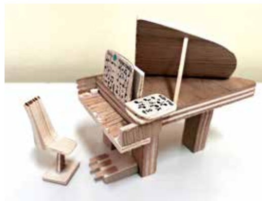
Klavir iz odpadnih kosov lesa, Eva Fras, 6. b

Nekega dne je poplavilo razred 3. b. Nekaj dni smo se selili iz učilnice v učilnico. Potem pa smo našli novo učilnico – preselili smo se v telovadnico v vrtcu. Postalni smo šolarji v vrtcu. V vrtcu nam je dobro – učimo se in se igramo. Na začetku smo imeli majhno belo tablo, a zdaj smo dobili veliko