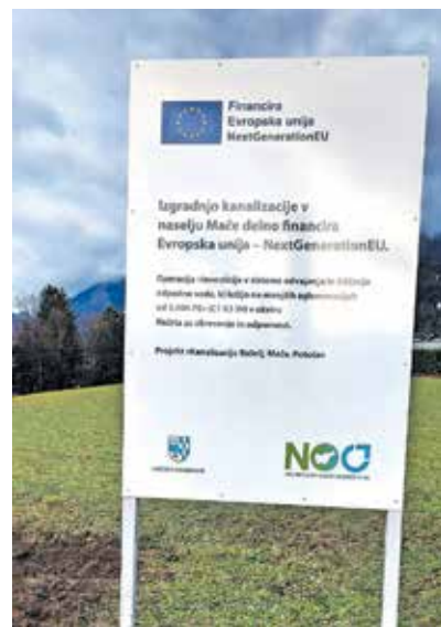
Občina Preddvor, Dvorski trg 10, 4206 Preddvor