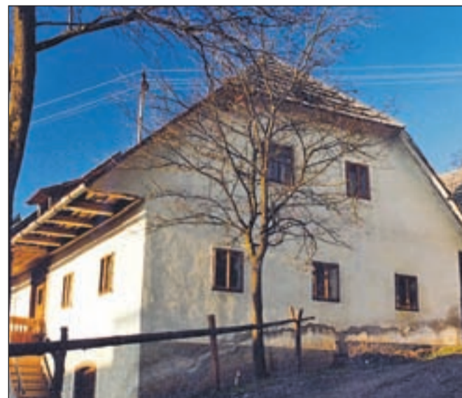
Staro hišo so podrli ...