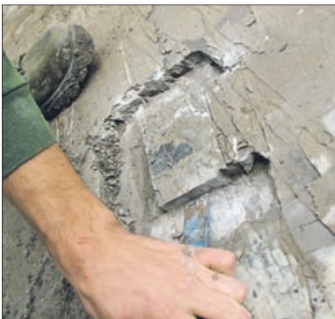
Ena od mnogih pomembnih najdb, ki sta jih Tomaž in Jure našla v kamniških gorah.