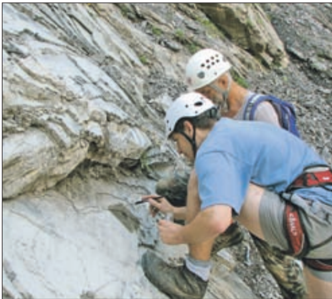
Ponavadi je potrebno precej dela, preden fosil izluščijo iz kamnine.