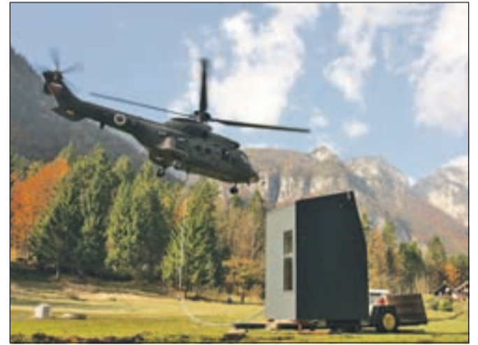
Bivak so pod Grintovec prepeljali s helikopterjem Slovenske vojske.