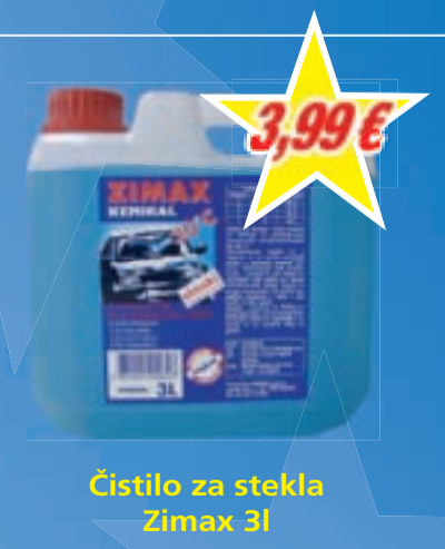
Čistilo za stekla Zimax 3I

PE Kamnik: 01/830 83 50 PE Lesce: 04/530 22 00