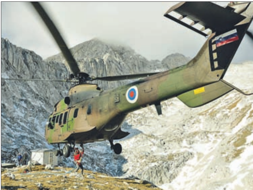
Razmere za delo nad 2000 metrih so bile zelo zahtevne.