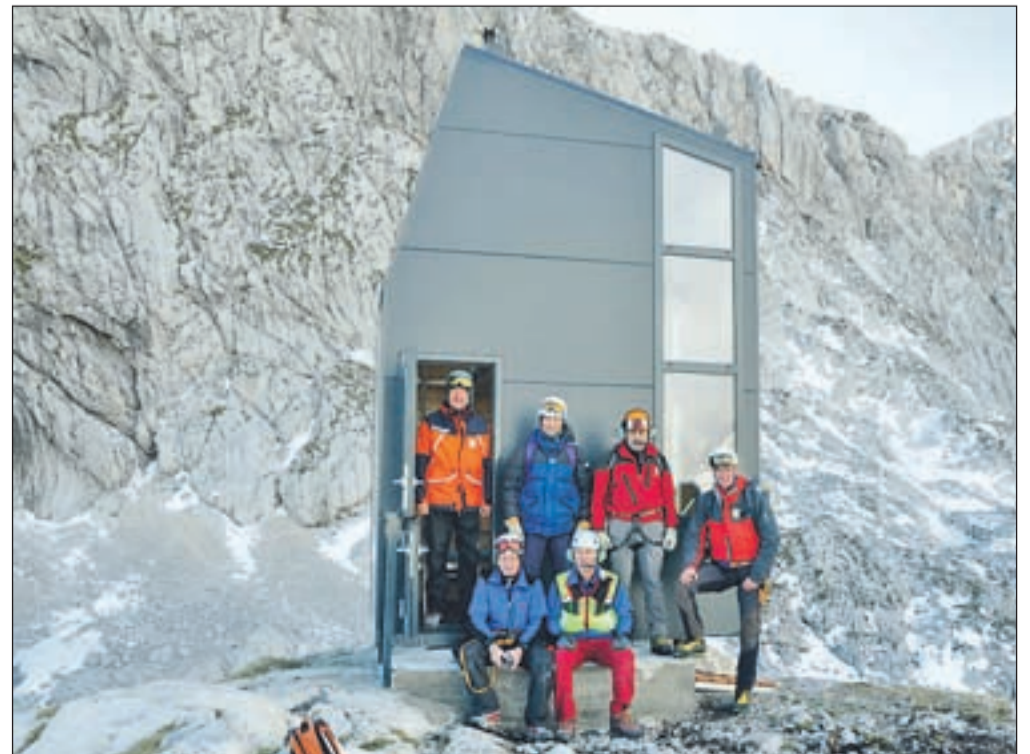
Člani GRS Kamnik po uspešno zaključeni akciji.