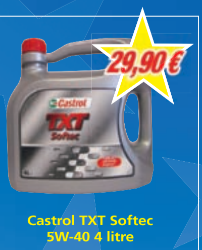
Castrol TXT Softec 5W-40 4 litre