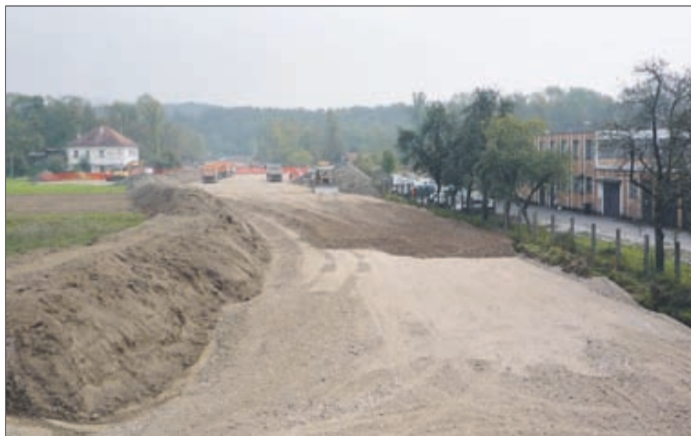
Delavci so zgradili že polovico nasipov

ga po svoji strokovni plati najbolje obvlada. Združeno znanje daje investitorju tudi večja jamstva za uspešnost projekta. Ne nazadnje to od njih zahtevajo tudi vse težji in ostrejši pogoji pridobivanja novih del in vse večji pritisk na cene, ki so zaradi krize, v kateri se je znašlo tudi naše gospodarstvo, vsak dan realno nižje. Prepričani so, da bodo s svojimi dolgoletnimi operativnimi izkušnjami na teh področjih s partnerji izvedli objekt kvalitetno in v skupno zadovoljstvo končali dela v zastavljenih rokih.