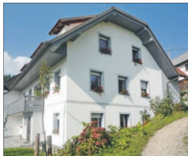
... in na njenem mestu v istih dimenzijah in ob upoštevanju vseh prednosti stare zgradili novo hišo.