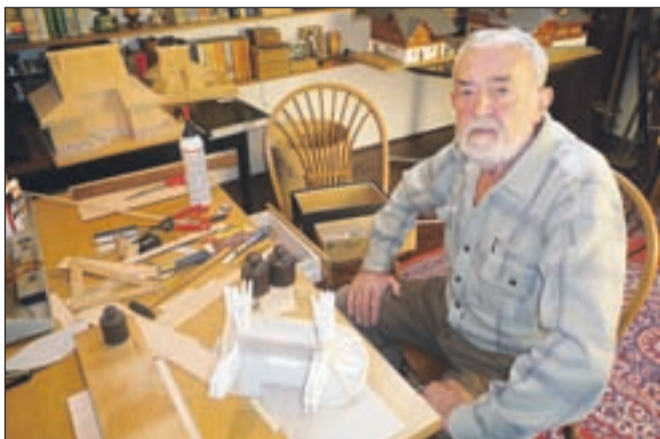
V jesenskih dneh se iz vestnega zbiratelja spremeni v navdušenega izdelovalca maket.