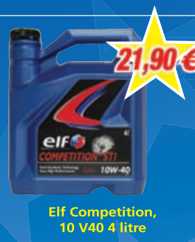
Elf Competition, 10 V40 4 litre