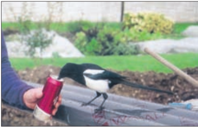
Sraka se v svojem domu in ob domačinih zelo dobro počuti, zato bi ji Tunjičani radi izbrali primerno ime.

Veliko zanimanja in navdušenja v zadnjih dneh po Tunjicah povzroča sraka, ki ne bi bila v tem okolju prav nič nenavadnega, če ne bi svojih novih sovaščanov ogovarjala in z njimi popila tudi kakšno pivo. "Sraka se je pred dvema tednoma pojavila od neznano kod, za svoje novo prebivališče pa si je izbrala nenaseljeno hišo na naslovu Tunjiška Mlaka 9f. Prav nič prijazna ni, saj svoje sosede ogovarja, pravzaprav zelo razločno zmerja z besedami, kot so 'koza', 'pusti me', 'pojdi stran' in podobno. Popije vse, kar ji damo, tudi pivo, moramo pa paziti na svoje stvari, saj je že ukradla denar in nekaj drugih predmetov. Očitno se pri nas dobro počuti, sploh zdaj, ko se ji je pridružil tudi partner, ki ga že uči besed," je tunjiško zanimivost opisal Valentin Zobavnik. Nad govorečo srako, ki se prav nič ne boji radovednežev in človeške družbe, so navdušeni predvsem otroci, imena pa ji še niso dali, zato zbirajo predloge. J. P.