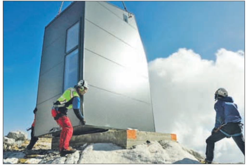
Bivak so položili na betonirane temelje, na mesto, kjer je stal že stari.