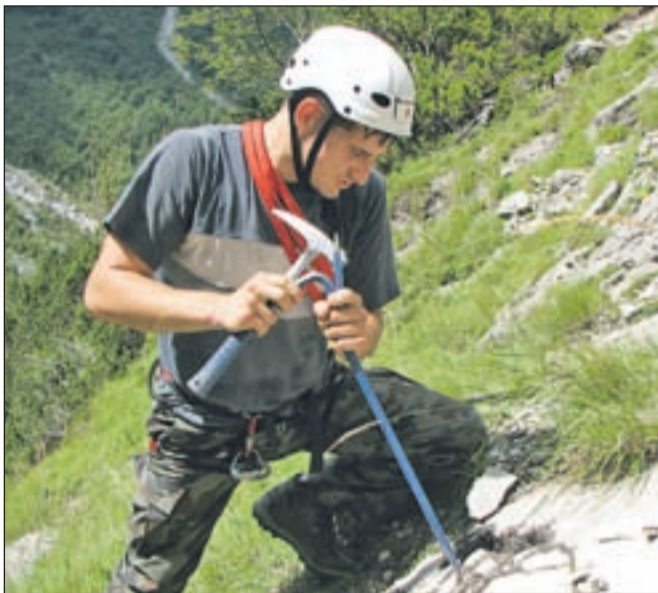
Iskanje fosilov v Kamniško-Savinjskih Alpah je zaradi razgibanega terena zelo zahtevno.