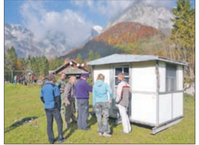
Stari bivak je po 36 letih svoje odslužil, a si kamniški planinci želijo, da konča v muzeju.

Kaj bodo s starim bivakom, se še niso odločili, menijo pa, da si zaradi svoje zgodovine zasluži mesto v kakšnem muzeju. Novi bivak, vreden 20 tisoč evrov, so kamniški gorski reševalci kupili s pomočjo donatorjev, a vsega denarja še niso uspeli zbrati. Vsi, ki jim želite pri tem pomagati, lahko svoja sredstva nakažete na transakcijski račun 02312-0035354472, sklic 2100.