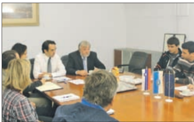
Predstavniki občine in športnih klubov se bodo na naslednjem delovnem sestanku zbrali že novembra.