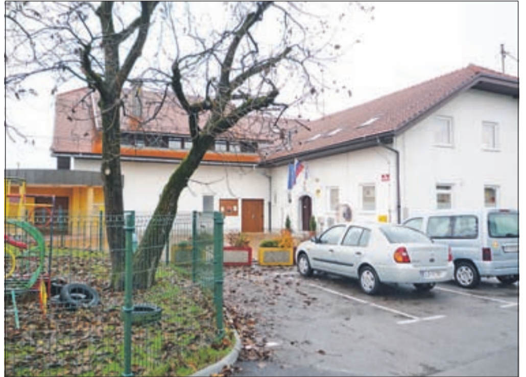
Krajevni dom v Šmarci bo kmalu bogatejši za sodobno knjižnico.

"Občina Kamnik je skupaj s krajevno skupnostjo v zadnjih dveh letih temeljito prenovila in tudi povečala krajevni dom v Šmarci, v katerem so zdaj kulturna dvorana in prostori krajevne skupnosti, prostori vrtca Sonček in PGD Šmarca, občinska družbena stanovanja, pred stavbo pa športna ploščad, prenovljeno otroško igrišče in nova parkirišča. V zadnji fazi prenovitve doma