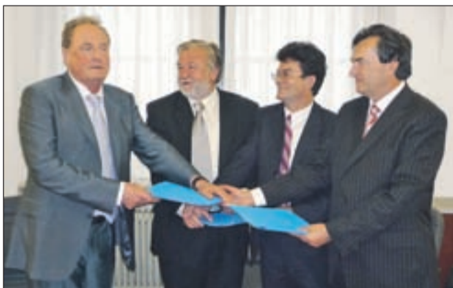
Kamniški župan s predstavniki podjetij SCT, CPL in Vegrad pri podpisu pogodbe za gradnjo povezovalne ceste

Cestno podjetje Ljubljana, d. d., izvaja objekt skupaj s