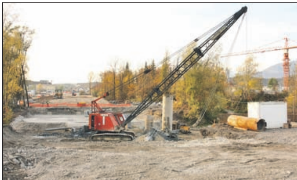
Povezovalna cesta treh mostov je eden največjih projektov v občini Kamnik v zadnjih dvajsetih letih.

partnerjema SCT, d. d., in Vegrad, d. d. Gradnja vključuje izgradnjo trase ceste s kolesarskimi stezami, pločniki z javno razsvetljavo, semaforizirano križišče z Ljubljansko cesto, krožno križišče in z novo predvidenimi komunalnimi vodi. Gradnja objekta je zahtevna in predstavlja veliko usklajevanja med investitorji, sodelavci in partnerji na projektu, ker se pogoji dela stalno spreminjajo in vse to vnaša v delo vedno nove okoliščine. Cestno podjetje Ljubljana, d. d., je podjetje z dolgoletnimi izkušnjami na področju