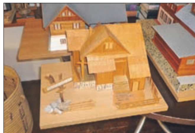
Maketa planinske kočice na Veliki planini