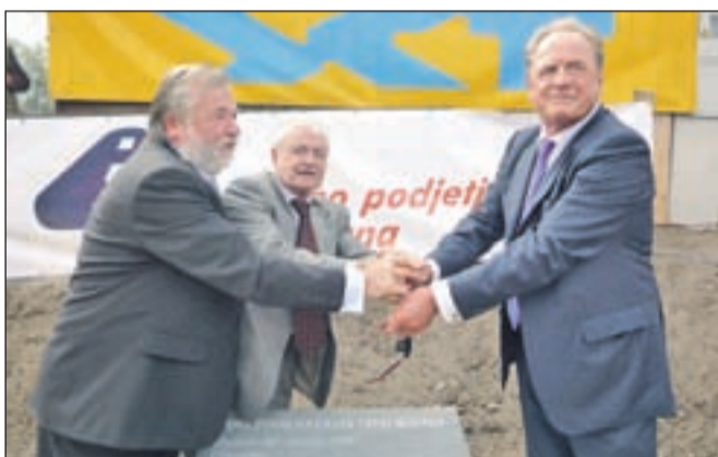
Položitev temeljnega kamna za gradnjo ceste