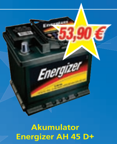
Akumulator Energizer AH 45 D+