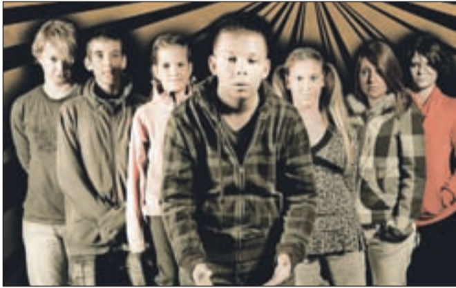
Predstava Danti - Dan bo na ogled v petek, 13. novembra, ob 19. uri v Domu kulture Kamnik.

"Predstava je nastala na osnovi teksta irske avtorice, vendar sva s Tanjo veliko besedila spremenili in ga postavili v naše okolje in naš čas. Govori o najstnikih, o njihovih problemih, ki jih morajo reševati sami, saj starši nimajo nobene vloge pri njihovi vzgoji. Glavni junak je deček petnajstih let, duševno zostal, srečen v svojem svetu kamenčkov, ki ga grobost in nasilje najstniškega sveta izrineta z življenjskega prostora,"