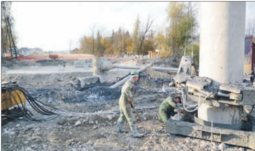
Gradnja Povezovalne ceste treh mostov bo zaključena septembra 2010.