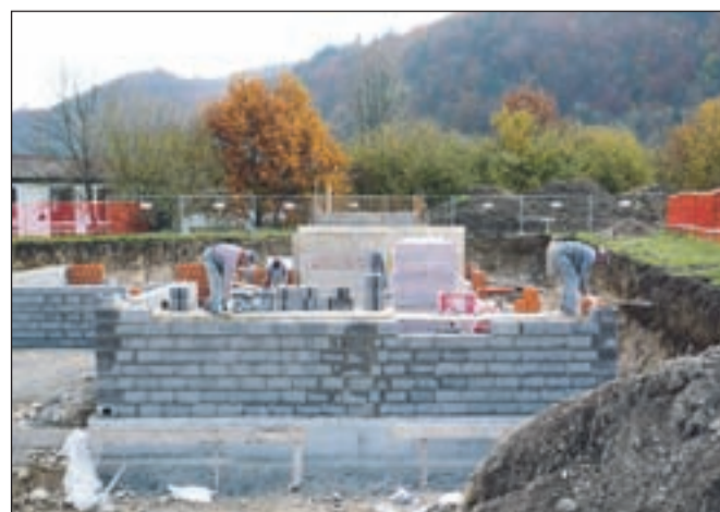
V oskrbovana stanovanja se bodo starejši lahko vselili že prihodnje jesen.

Z domom starejših občanov smo že podpisali pismo o nameri o tovrstnem