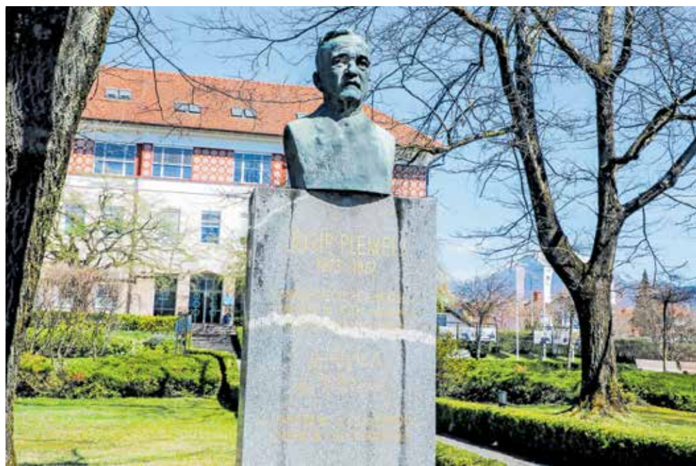
V njegovem rojstnem kraju Bled nanj spominja doprski spomenik v parku pred gostinsko šolo.