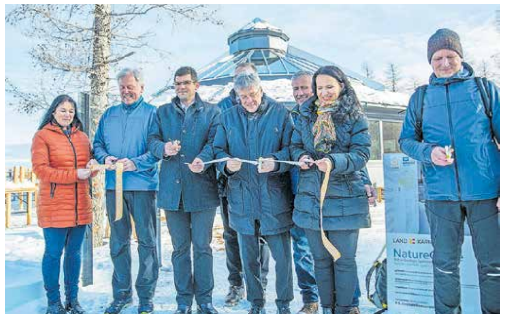
Slovesno odprtje panoramske restavracije, v kateri je tudi Center za obiskovalce Geoparka Karavanke GEO.DOM, januarja 2023