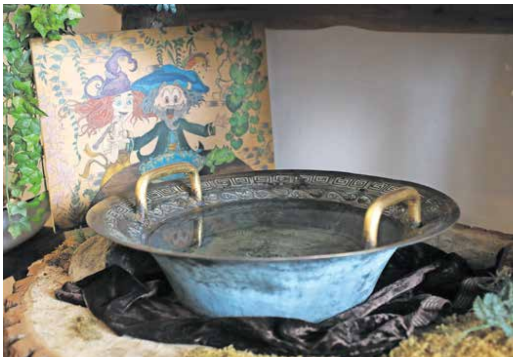
Z interaktivnimi točkami poskušajo muzejske vsebine čim bolj približati tudi otrokom. Na fotografiji je tako imenovani zmajev vrelec, ki ga je mogoče »prebuditi« z drgnjenjem ročajev posode z mokrimi rokami.

Zbirko še naprej dopolnjujejo, čeprav muzejski prostori že počasi postajajo tesni. »A za kakšen poseben predmet se vedno najde kotiček, kamor ga lahko postavimo,« zaključuje Ana Plešec.