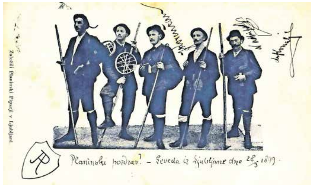
Člani Planinskih piparjev, ki so dali idejo za ustanovitev Slovenskega planinskega društva / Foto: arhiv Gorenjskega muzeja

Z vrha se oglasimo še v Prešernovi koči, nato pa sestopimo po markirani poti, ki pelje proti Celovski koči. Sestopamo po trdem, zbitem melišču, ki ni ravno najprijetnejše, markirana pot pa poteka po zagruščnem terenu, ki tudi ni v pretirani užitek.