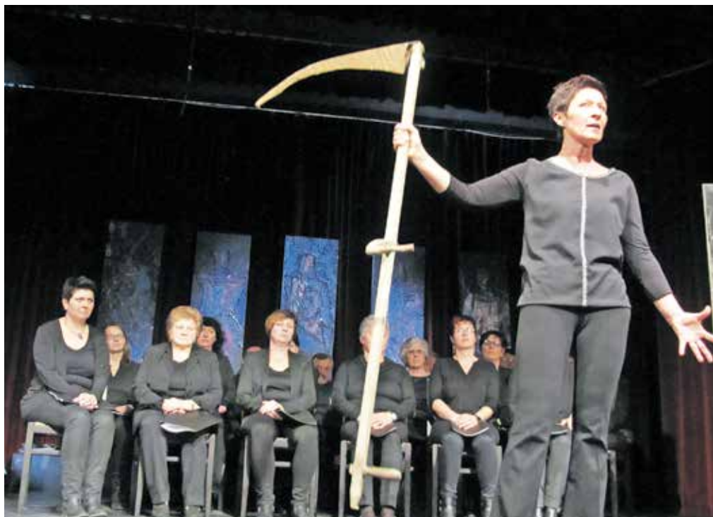
Eden od prizorov pasijona, ki so ga leta 2017 uprizorili v Železni Kapli

iskati v dejstvu, da v baročni dobi vera in kultura nista bili ločeni, ampak zelo tesno povezani. Zato so bila besedila v jezikovnem pogledu nadvse lepo napisana in oblikovana ter strnjena v najlepše verzne oblike in rime. Tako posredovana jezikovna, kulturna dobrina je vernikom nudila duhovno misel, plemenitila njihov okus in kultivirala slovenski jezik. Cerkevni pisci so mislili tudi na to, da mora besedila razumeti prebivalstvo v različnih dolinah, krajih in vaseh, v katerih so govorili nekoliko različna narečja. V tem se skriva prizadevanje za knjižni jezik, čeprav takrat to ni bilo tako jasno zamišljeno kakor danes. Hoteli pa so zapisovati besede, ki so jih vsi razumeli. Pasijonska besedila so prvovrsten zaklad kulturne dediščine in vrednota, ki jo lahko občudujemo še danes in jo doživljamo kot duhovno in literarno lepoto.«