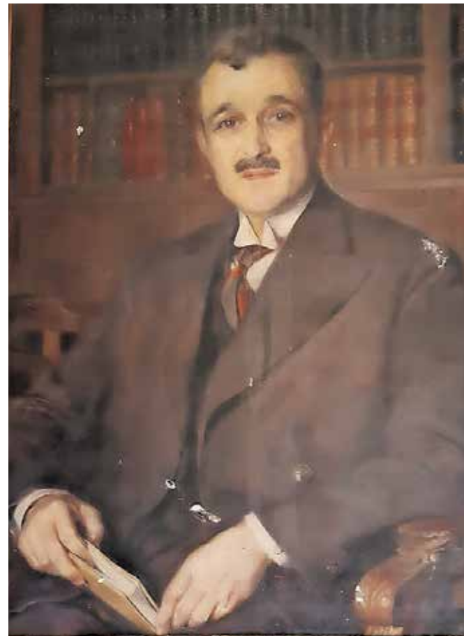
Josip Plemelj