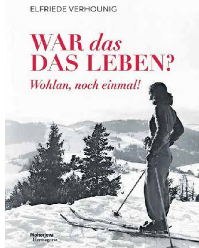
Naslovnica knjige War das das Leben? (Je bilo to življenje?)