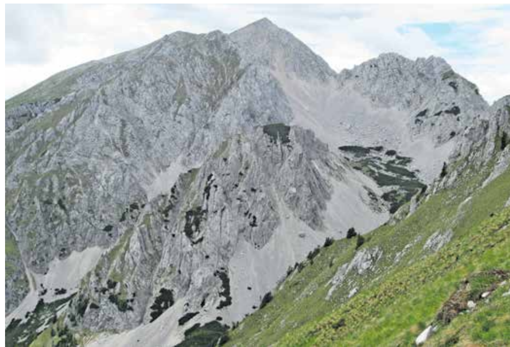
Pogled na Stol s poti na Zelenico. Dobro je vidna dolina, po kateri sestopamo, če se vračamo v Medvedji dol.

Pri večjem balvanu se desno odcepi pot proti Zelenici, mi pa gremo v smeri Celovške koče/Klagenfurt Hütte. Prečimo melišče in se po grapi