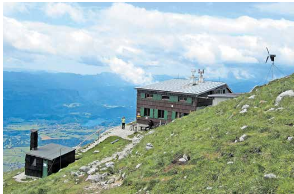
Prešernova koča na Stolu

Začetek poti je najtežji, a se po težavnosti ne da primerjati z ekstremnimi feratami, saj so nam v pomoč skobe, po katerih napredujemo kot po lestvi. Višje