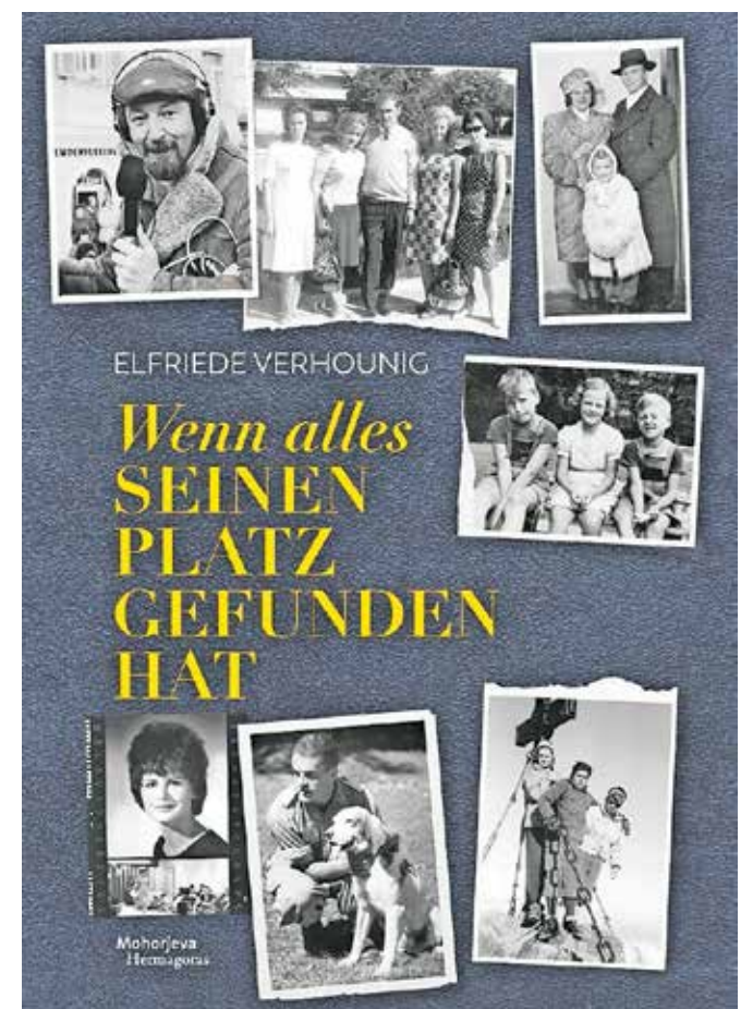
Naslovnica knjige Wenn alles seinen Platz gefunden hat (Ko je vse na svojem mestu)

V uvodu k drugi knjigi avtorica citira logoterapevta Viktorja E. Frankla: »Človek vidi samo strnišče minljivosti – ne vidi pa polnega skednja preteklosti. V preteklosti namreč ni nič nenaдомestljivo izgubljen. Nasprotno: vse je na varnem, nič ni izgubljen.« Tudi njo so te besede spremljale pri pisanju obeh knjig.