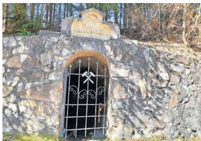
Eden od ohranjenih vhodov v rov nekdanjega rudnika svinca