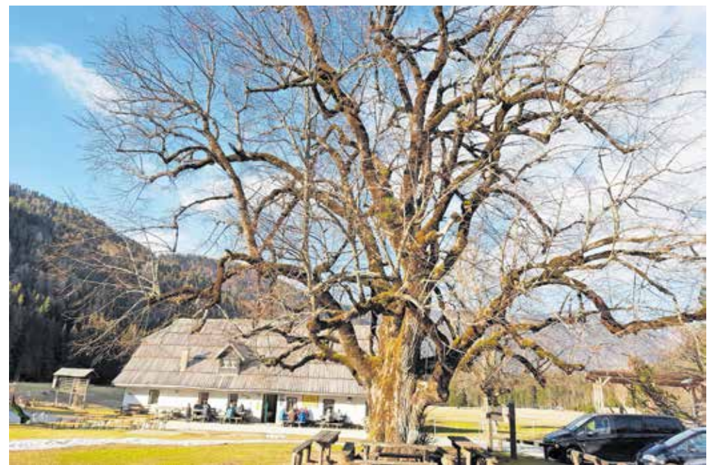
Skoraj štiristo let stara in zaščitena Podnarjeva lipo pred Podnarjevo domačijo, v kateri je daleč naokoli znana domača gostilna. Ko bo lipo ozelenela, bo prava lepota.

– Märchenwiese po nemško, pravi biser pa je majhno ledeniško Jezerce z ne preveč posrečenim nemškim imenom Meerauge. Legenda pravi, da je povezano z Blejskim jezerom. V dolini ob pobočju so posejane številne do-