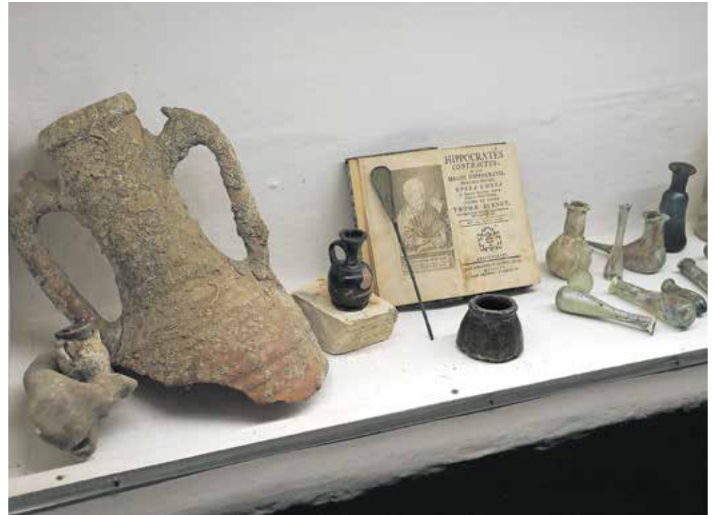
Predstavljena je tudi medicina starih narodov ter učenjaki stare Grčije in Rima, ki so postavili temelje sodobne zahodne medicine.

Prav zato so pripravili poseben interaktivni program za otroke in družine. »Glede