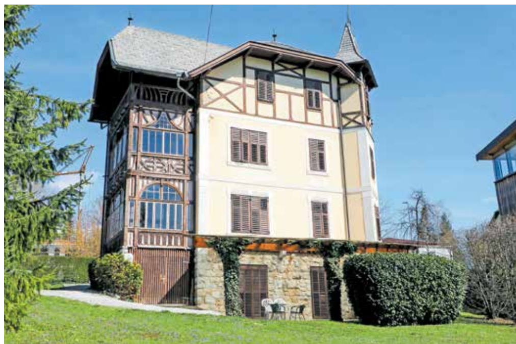
Plemljeva vila na Bledu