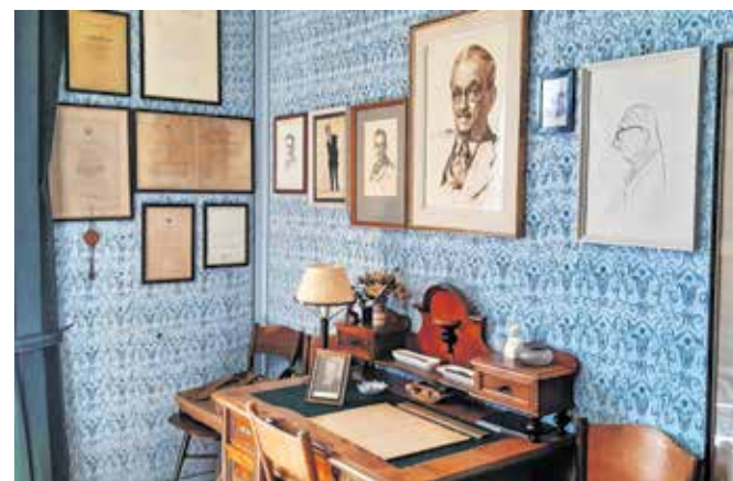
Spominska soba v Plemljevi vili