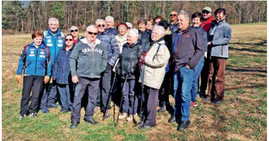
Pohod po Preddvoru in okolici / Foto: Silva Jerše

Drugi izlet bo v petek, 16. junija, na katerem bomo obiskali Slovenske gorice. Tudi tu imajo bogato naravno in kulturno dediščino ter izročila starih navad in običajev. Mislim, da je to