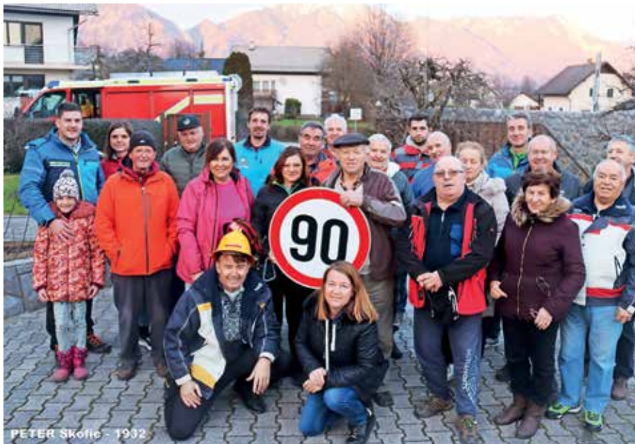
Praznovanje Petrove 90-letnice na njegovem vrtu

V omari ima skrbno shranjeno in zloščeno že tretjo paradno uniformo. Pred meseci bi jo že