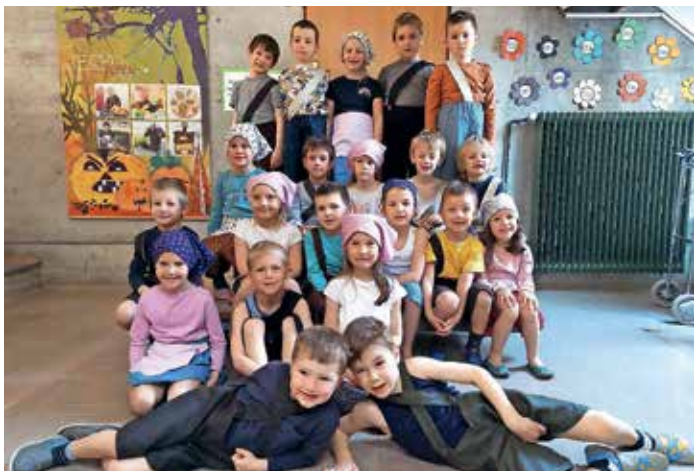
V vrtcu na Kokrici so spoznavali, kako so se otroci igrali nekoč.