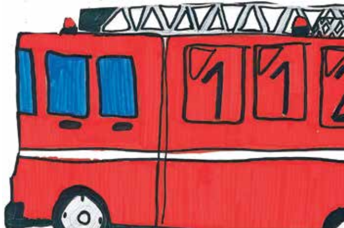
Gasilski avto, Tanja, 3. č

Vsa leta se trudimo, da uvajamo nekaj novega. Poskušamo izkoristiti podeželsko okolje, ki otrokom in zaposlenim omogoča drugačne možnosti delovanja v primerjavi z urbanim okoljem. Vztrajali bomo in poskušali izkoristiti čim več priložnosti. Ker se nam obeta do konca septembra 2025 realizacija prve faze investicijskega projekta, ki vključuje rekonstrukcijo in dozidavo, kar pomeni povečanje za dve igralnici s terasami in dve novi učilnici, z večjim optimizmom zremo v prihodnost. V drugi fazi pa upamo na novo telovadnico in rekonstrukcijo učilnic s pripadajočo infrastrukturo.