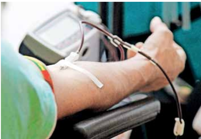
KORK Kokrica uporablja sredstva, zbrana s članarinami in prostovoljnimi prispevki, za enkratne pomoči krajanom v stiski, za organizacijo krvodajalskih akcij ...