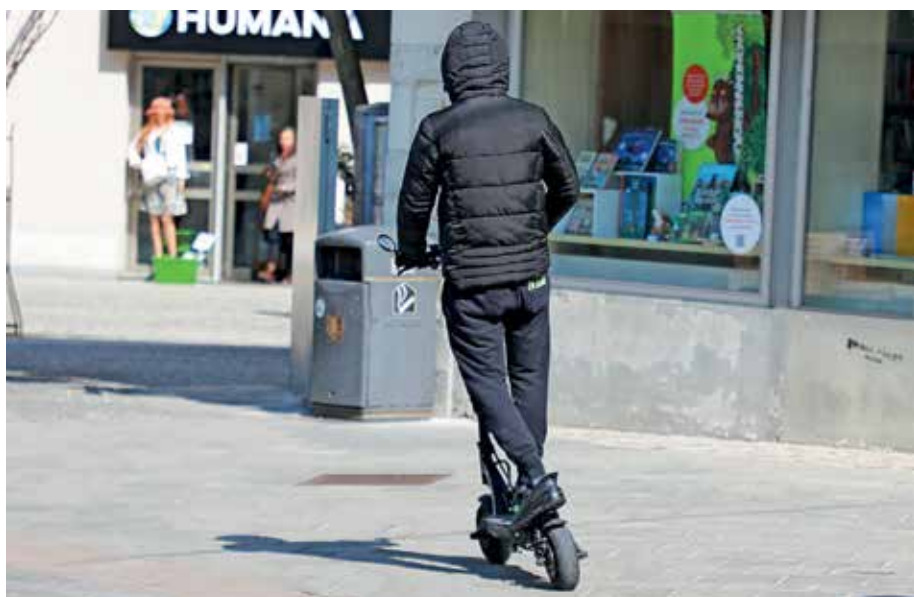
Za voznike e-skirojev in drugih lahkih motornih vozil se smiselno uporabljajo pravila, ki veljajo za kolesarje.

Primož Skumavec, pomočnik načelnika PP Kranj