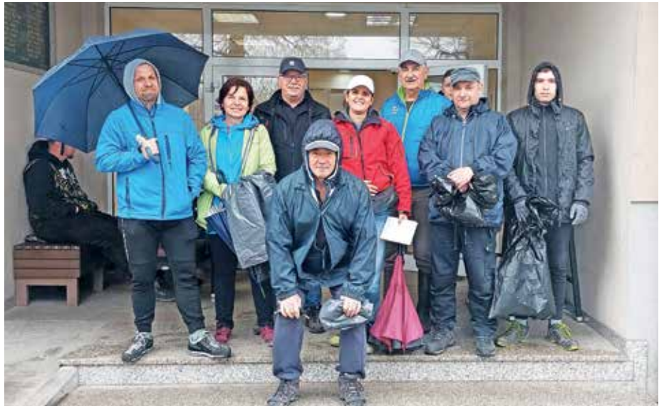
Na čistilni akciji nas je na deževno soboto sodelovalo deset krajanov.

Prvotni načrt čiščenja po rajonih je bilo treba spremeniti zaradi nizke udeležbe in tako se je ekipa razdelila le na dve skupini. Ena skupina je čistila na Bobovku ob ograji posestva Brdo, drugi del prostovoljcev pa se je odpravil na območje tako imenovane pasje poti ob avtocesti. Čistili smo tudi na območju, ki ne spada več v KS Kokrica, v gozdličku med Kokrico in Rupo, saj to vsako leto ostane neočiščeno, je pa lahko dostopno in ga nekateri žal uporabljajo za divje odlagališče odpadkov. Do kosti premočeni smo se odpravili na zahodni del KS, kjer smo čistili ob »kolesarski poti« čez avtocesto ter ob levi strani povezovalne ceste Kokrica–Polica.