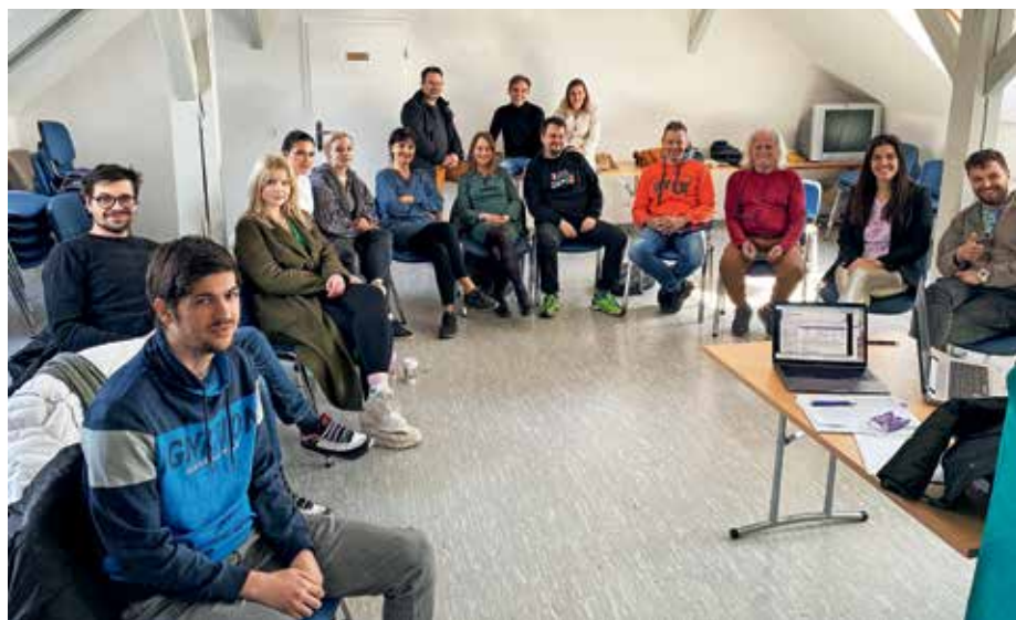
Z zadnjega srečanja Gledališko-filmskega laboratorija