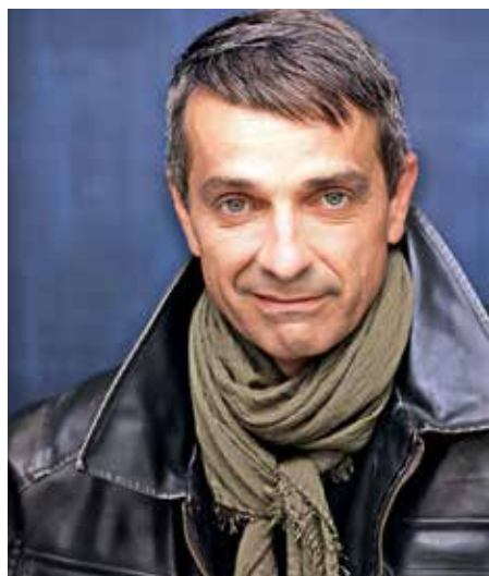
Igor Korošec / Foto: arhiv SNG Kranj

Na svojih srečanjih, ki potekajo dvakrat mesečno v KD Kokrica, trenutno razvijamo kar nekaj različnih scenarijev za filme (o Udin borštu, komično nanizanko ter komični resničnostni šov, ki bo povezoval mlade in starejše v naši skupnosti). Premiere filmov predvidevamo za letošnjo jesen. Poleg tega pa pripravljamo tudi dva gledališka abonmaja: otroškega in odraslega. Oba naj bi se odvijala v Kulturnem domu na Kokrici. Predstave otroškega abonmaja bodo predvidoma vsako prvo soboto v mesecu (začenši septembra 2023 in vse do junija 2024). Našo prvo sezono bo vseboval deset predstav, ki bodo tako domače kot gostujoče.