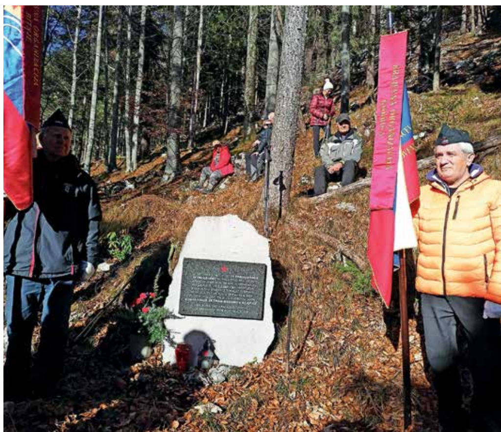
Praporščaka ob spomeniku v dolini Lobnice