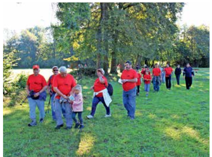
V juniju organiziramo tradicionalni Pohod po mamutovi deželi.

Prijazno vabljeni člani društva in vsi krajanje Kokrice z okolico, da se udeležite naših dogodkov, s tem bosta naše prostovoljno delo in trud do-