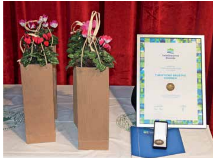
Ob 50. obletnici ustanovitve je Turistično društvo Kokrica prejelo priznanje Turistične zveze Slovenije.

Spomnili smo se vseh predsednikov turističnega društva, vse od nastanka. Vsak izmed njih je dodal številne kamenčke v mozaik danes