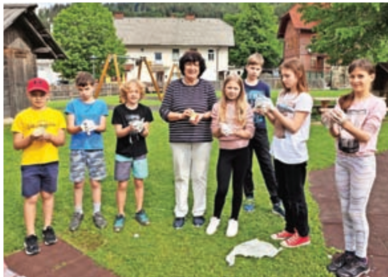
Ustvarjanje na prostem

Kmalu smo imeli kosilo. Po njem so učenci šole Kokra odšli nazaj. Ta športni dan mi je bil zelo všeč. Polona Rogelj, 4. r