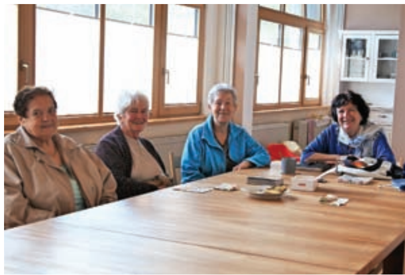
Srečanja se imenujejo Zapišimo spomine