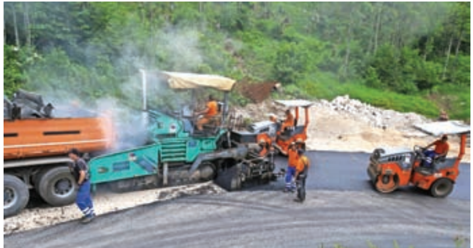
Prizor je z asfaltiranja t. i. prve ride na cesti proti Jezerskemu vrhu.

V tem času so v občini preplastili še dve cesti: ena gre čez Gaštej, druga je na začetku doline Komatevre. Asfaltiranje ceste čez Gaštej je bilo načrtovano že dolgo. Na novo asfaltirana cesta je pri-