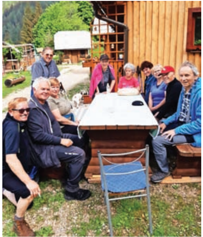
Na Murnovem

Pot nas je potem vodila v Šentjurij pri Mirni Peči, kjer se je rodil nam dobro znani pesnik in vsestranski kulturni delavec Tone Pavček. Obiskali smo muzej, posvečen njegovemu delu, ki nam ga je zelo slikovito predstavila tamkajšnja kustosinja