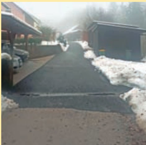
Asfaltirana cesta Na Dobravah

Na Trati so bile postavljene tri svetilke javne razsvetljave. Na Dobravah je bila na novo asfaltirana cesta, pokrpanih je bilo več kot dvesto kvadratnih metrov cestišč, bankin in gozdnih poti. Problematični klanec v Podrovniku je Komunala Kranj preplastila s protizdrsno prevleko, ki ob sneženju in nizkih temperaturah zagotavlja večjo varnost vozilom, pešcem in prebivalcem ob cesti. V prihodnjem letu bo izdelan projekt za predstavitev ceste v Zgornji Besnici pri cerkvi. Izvedba naj bi sledila v letu 2022. Prav tako bo v prihodnjem letu izdelan projekt za pločnik, ki bo povezoval Spodnjo in Zgornjo Besnico. Podali smo predlog za preplastitev najslabših delov glavne ceste.