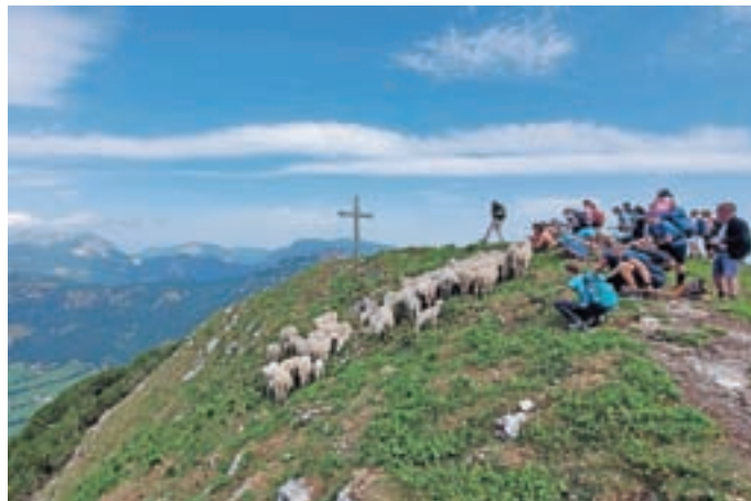
Soljenje ovc v planini