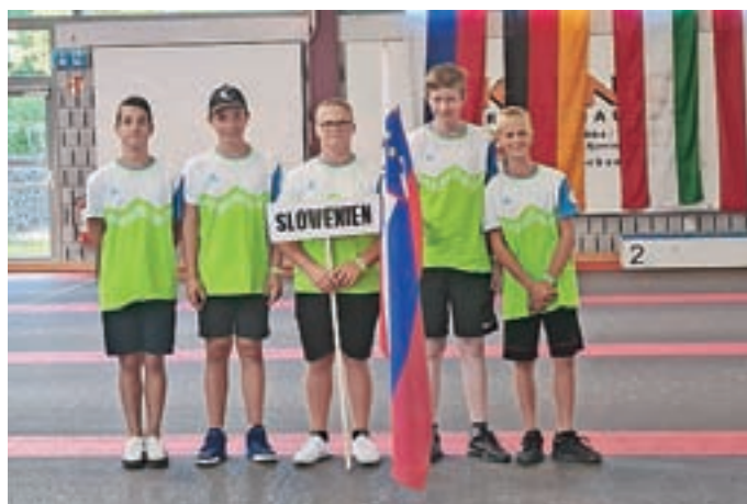
Na mednarodnem tekmovanju v kegljanju na asfaltu v Celovcu