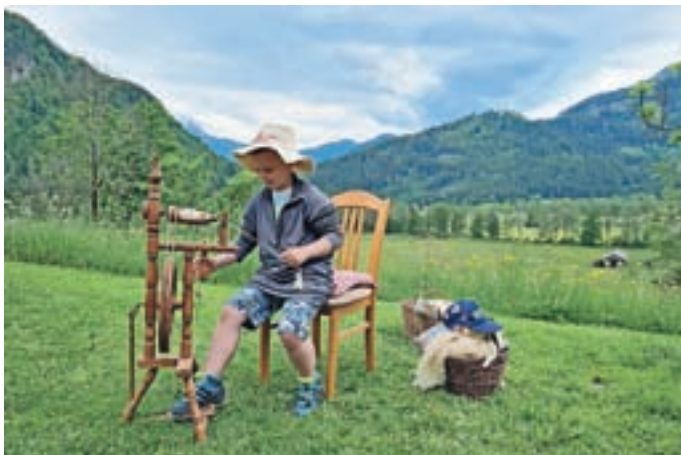
Fant s kolovratom