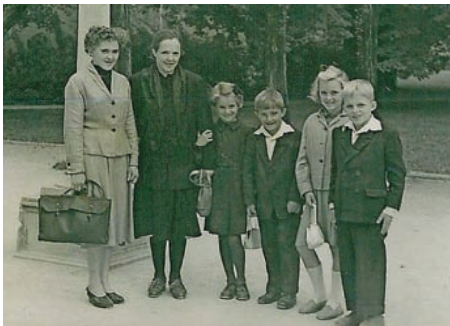
Družina Katrce Košir

Tisti, ki se vsak dan vozite v službo z Jezerškega v Ljubljano, in tudi druga mladina, si ne morete misliti, kako smo včasih potovali v Ljubljano. Avtomobili