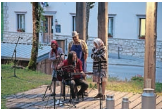
Glasbeni večer v Županovem kotu