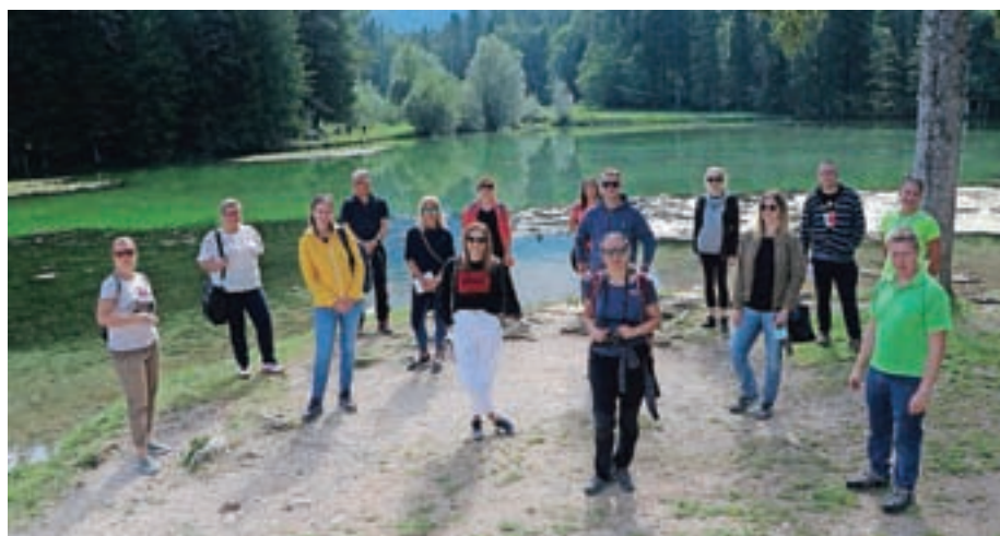
Slovenska turistična organizacija je med drugim pripravila tudi obisk turističnih novinarjev na Jezerskem.

Domači gostje so tudi s pomočjo turističnih bonov odkrivali Slovenijo in opažamo, da je veliko Slovencev letos prvič obiskalo naš kraj. Predvsem v prvem poletnem mesecu, ko praktično še ni bilo šolskih počitnic, smo imeli pri nas večinoma slovenske goste. V juliju in avgustu pa se je statistika po zasedenosti kapacitet le obrnila na stran tujih gostov, ki so ustvarili večino nastanitev. Prizadevanje turističnih ponudnikov in občine po uspešni in kvalitetni turistični destinaciji so opazili tudi zunaj meja naše občine in tako smo prejeli kar dve priznanji: Turistična zveza Slovenije nas