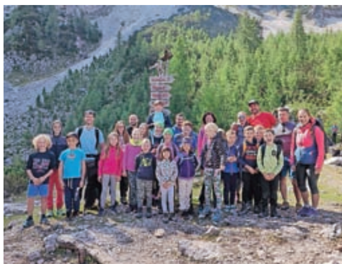
Mladi planinski orli

razredov matične in podružnične šole. Vreme nam je bilo naklonjeno, morje je bilo res še toplo in učenci so uživali v vseh dejavnostih ter predvsem nadgradili svoje plavalno znanje. Za nami je tudi že prvi športni dan. Učenci od prvega do četrtega razreda so se odpravili na tematsko orientacijsko pot Skrivnost preddvorskkih štokelj. Ob tem so spoznali okoliške vrhove, živali, rastline, se seznanili z različnimi markacijami, osvežili znanje o primerni obutvi in opreми, ki jo potrebujemo v hribih v različnih vremenskih razmerah, ob zanimivih nalogah pa spoznali nagajivega vrana Frana, ki je uročil grofa in grofico.