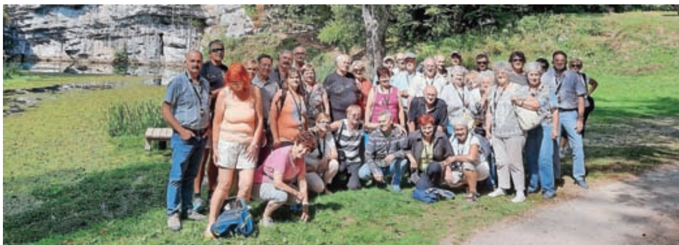
Na izletu v Beli krajini