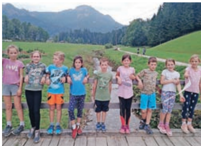
Tek za junake 3. nadstropja

Želim, da bi se veliko naučili in da bi znali računati račune. Gaja Ančimer Karničar, 2. r.