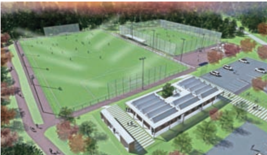
Kako bo videti športni park / Skica: Hafner Arhitekti, d. o. o.

Ker nam v vsej šestdesetletni zgodovini najmnogičnejšega športnega društva v občini optimizma ni nikoli zmanjkalo, še vedno upamo na ugoden razplet in začetek gradnje velikega nogometnega igrišča v športnem parku najkasneje letošnjo jesen.