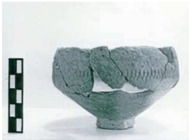
Značilno okrašeni del lonca z najdišča Vrtničnik nad Tupaličami iz starejše železne dobe (Gorenjski muzej, foto: D. Holynski)

Na višinsko naselbino Vrtničnik se domnevno navezuje starejše železnodobno gomilno grobišče (8.–7. stoletje pr. Kr.) na nižji ledini Vrtničnjak (537 m n. m.) pod Možjanco v smeri Olševka. V eni od gomil poravnanih vrhov, ki so v obrisih na terenu še vidne, so pod nasutjem našli 16 žganih pokopov ožje družine dveh generacij. V sredini gomile je stala kamnita grobna kamra s stranskim vhodom ter z visoko keramično žaro v notranjosti. Okoli kamre so bile v krogu razporejene ovalne grobne jame. V nekaterih so bile keramične žare, zapolnjene z ilovnato zemljo in žganino, v druge je bila žganina nasuta neposredno na dno jame. Kot grobni dodatki so bili v gomili najdeni bronast in železen obročasti nakit, bronasti igli in več bronastih okrasnih gumbov, različno keramično posodje, vključno z amforo in situlama, keramična vretenca, ki so jih ženske uporabljale pri preji, ter keramični uteži piramidne oblike z vtisom, podobnim obesku z naselbine na Vrtničniku. Ostale gomile še niso raziskane, bilo naj bi jih več kot 38. Večinoma so precej poraščene, nekatere sedaj zaradi razgibanega terena služijo gorskemu kolesarjenju. V okolici Preddvora so bili iz obdobja starejše železne dobe odkriti gomilni grobovi še na Črničcu pri Mošnjah in Sorškem polju, istodobnim knežjim gomilnim grobovom z bogatimi pridatki na Dolenjskem pa pripisujejo arheologi evropski pomen.