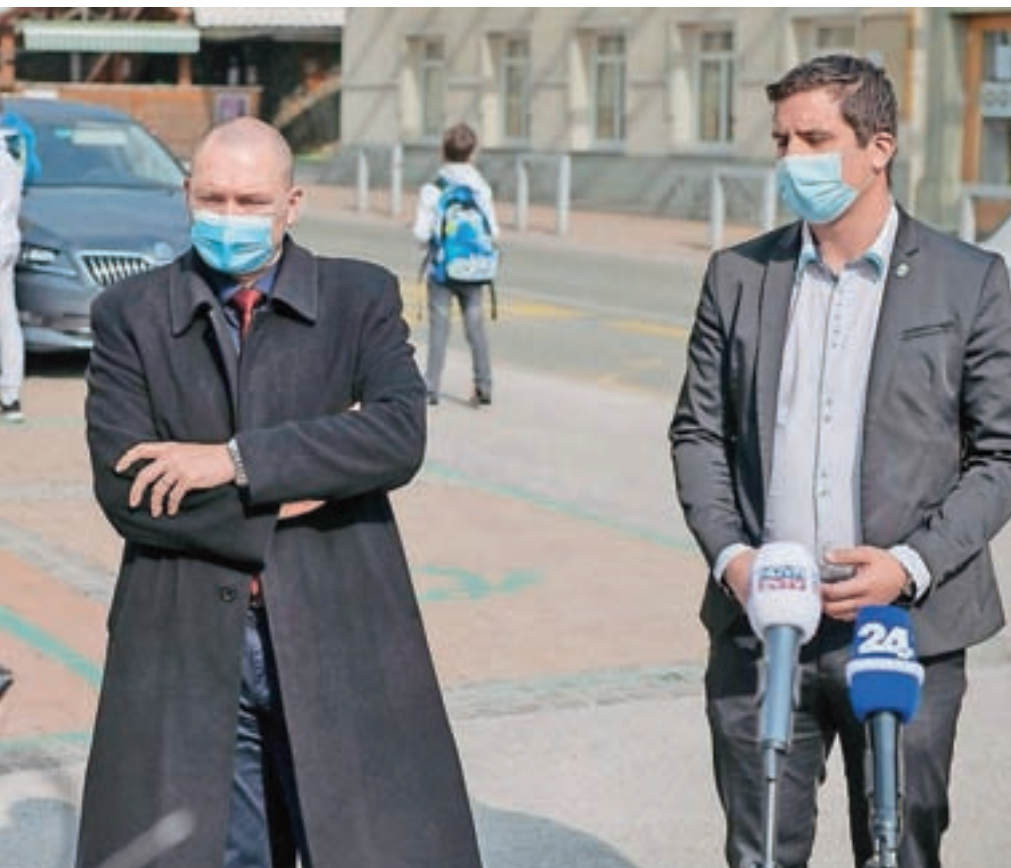
Minister Jože Podgoršek (levo) in preddvorski župan Rok Roblek

V preddvorski občini so ministru ob obisku predstavili nekatere kmetijske probleme – težave, ki jih imajo z divjadjo in zvermi, neurejenost glede plačila komunalnega prispevka za gradnjo kmetijskih objektov na državni ravni, pa tudi nekatere razvojne načrte s področja kmetijstva, gozdarstva, lovstva in ribištva, med drugim sodelovanje v projektu Turizem ribjih doživetij. Župan Rok Roblek je opozoril na problem prostorsko utesnenih kmetij, ki bi se za razvoj in širitev morale preseliti iz vasi na drugo lokacijo, pa tudi na problematiko javnih razpisov za ukrepe kmetijske politike, pri katerih so gorenjske kmetije zaradi razvitosti regije na slabšem kot kmetije iz manj razvitih regij. »Ne smemo se deliti na razvite in nerazvite, oboji potrebujejo finančno pomoč za vlaganja,« je dejal Roblek in poudaril, da je treba vlagati tudi v razvojno najboljše kmetije. Minister Podgoršek je dejal, da v sedanjem programskem obdobju ni finančnih podpor za preselitev kmetij, vključno s stanovanjskim delom, na novo lokacijo. Pri pripravi ukrepov za novo programsko obdobje bodo razpravljali tudi o podpori za preselitev kmetij, vendar bo pred ministrstvom in drugimi deležniki težka naloga, da bodo iz nabora želja za 18 milijard evrov izbrali ukrepe za 1,8 milijarde evrov, kolikor bo na voljo denarja.