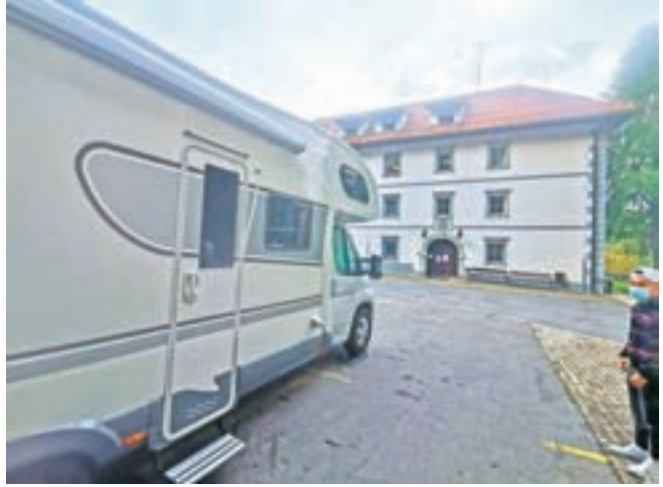
Avtodom za pomoč zaposlenim v DSO Preddvor

Na vrhuncu epidemije, ko so bili zlasti na udaru domovi upokojencev, se je najbolj izkazala tudi družbena solidarnost. Tudi Dom starejših občanov Preddvor je bil v tem času deležen različnih oblik pomoči, od prostovoljcev iz lokalnega okolja, ki so osebju priskočili na pomoč pri oskrbi stanovalcev, do gostincev, ki so občasno pošiljali priboljške za preobremenjene zaposlene. V drugem valu epidemije pa je dom dobil v uporabo tudi dva avtodoma, ki ju je za štiri mesece odstopila Hiša na kolesih. Ta se ukvarja z izposojavo avtodomov, prodajo in servisom; v sezoni oddajajo 75 vozil, epidemija, ki je močno zamajala turizem, pa je njihovo dejavnost okrnila za več mesecev.