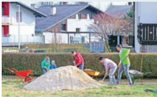
S sobotne delovne akcije