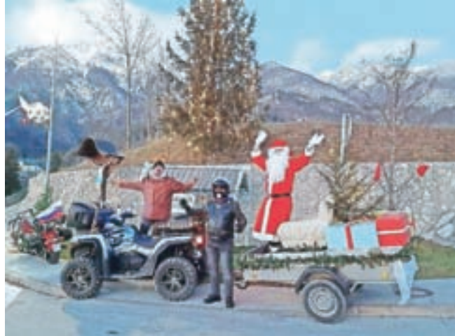
Bašljanski Božiček na poti z darili

Pomočniki skratje so pred obiskom Božička, ko so otroci gledali igrico, razdelili darila pred vrata hiš. Ta so vsa pri-