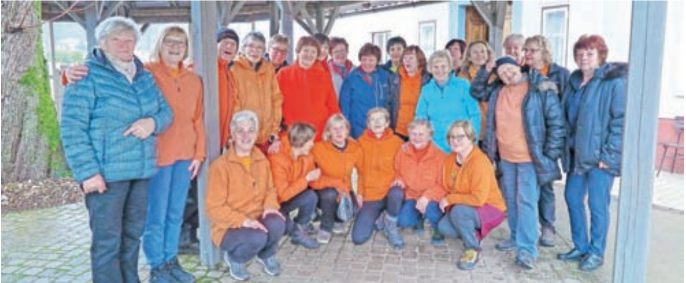
Lani, ko je vadba še potekala »v živo«