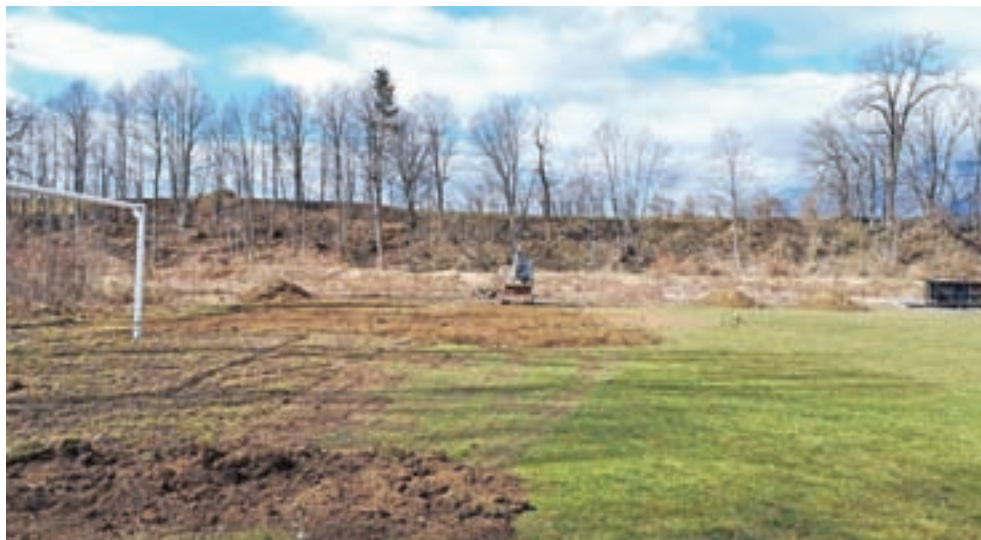
Nujna vzdrževana dela na nogometnem igrišču Za žago

Upali smo vsaj na izvedbo tradicionalnega smučarskega tečaja med letošnjimi zimskimi počitnicami, vendar so nam epidemiološke razmere in sprejeti ukrepi tudi to preprečili. Prav tako se je spet zavlekel postopek pridobi-