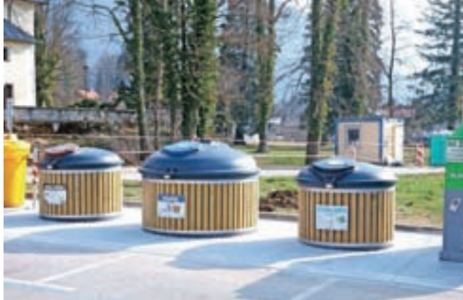
Nov, lepši ekološki otok