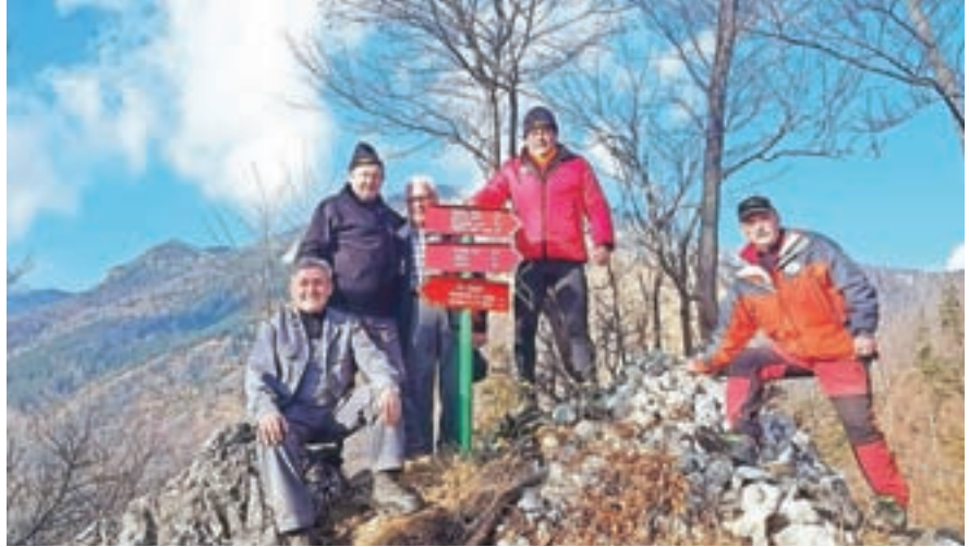
Člani PD Preddvor so na sedlu pri Sv. Jakobu postavili nove planinske table.

Od 1. marca kočna na Sv. Jakobu neposredno upravlja Planinsko društvo Preddvor. Društvo namreč kočne ni več moglo oddajati v podnajem in je prekinilo pogodbo s podjetjem Posek. S sklepom upravnega odbora je bila izbrana nova oskrbnica, ki bo tako kot v Zavetišču v Hudičevem borštu delo izvajala pod okriljem planinskega društva. V skladu z ukrepi za preprečevanje okužb z novim koronavirusom prodaja v njej poteka po sistemu »za s sabo«, delo v koči pa se izvaja na podlagi dogovorov o prostovoljskem delu.