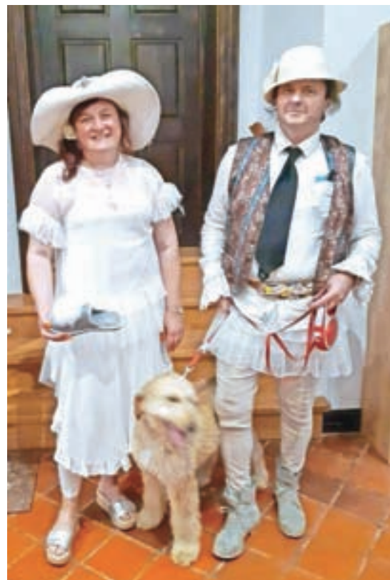
Najemnika v svoji grofovski opravi