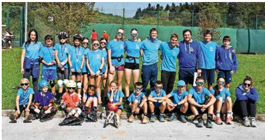
Člani NŠD Medvode na krilih poletnih uspehov že težko pričakujejo začetek zimske sezone.