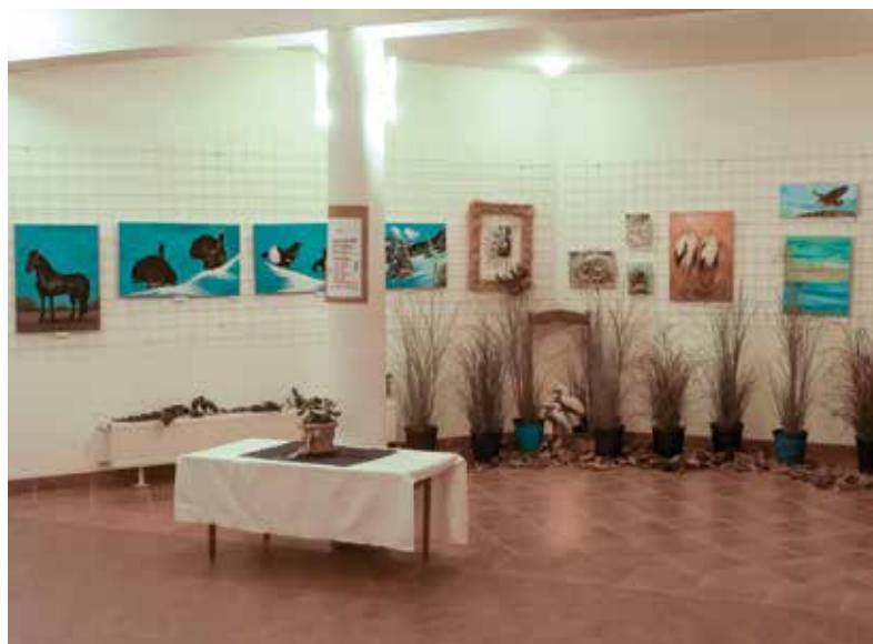
Na ogled je 38 likovnih del.