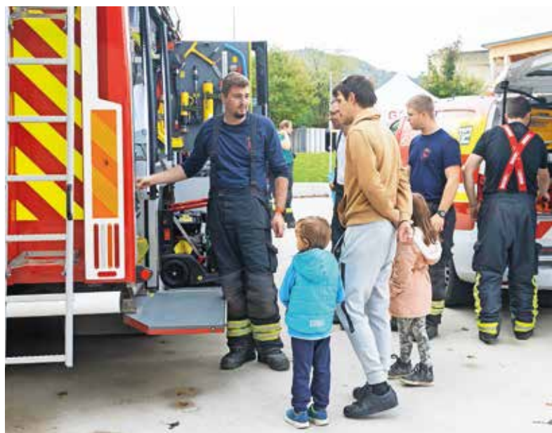
Na preventivnem dnevu PGD Preska - Medvode občani lahko od bližje spoznajo gasilce in njihovo opremo.