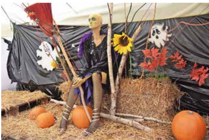
Čarovnica, ki je priletela na kmetijo Jakopič v Spodnjih Pirničah, je privabila številne obiskovalce. Na posebej pripravljenem in okrašenem prostoru so imeli na voljo pestro izbiro okrasnih in jedilnih buč. M. B.