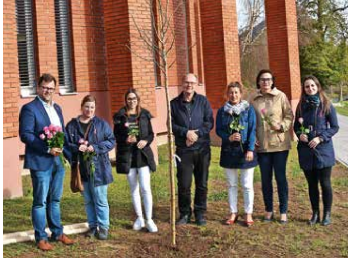
Pri knjižnici so zasadili »rožnato« drevo, ki bo opozarjalo na pomen skrbi za zdravje.