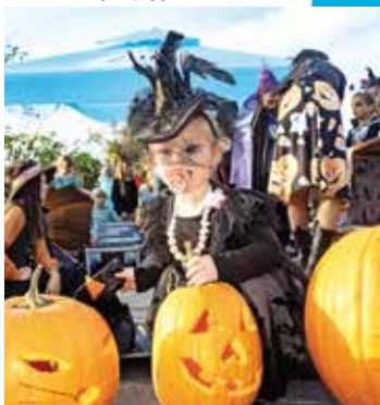
Noč čarovnic na Starem gradu Smlednik