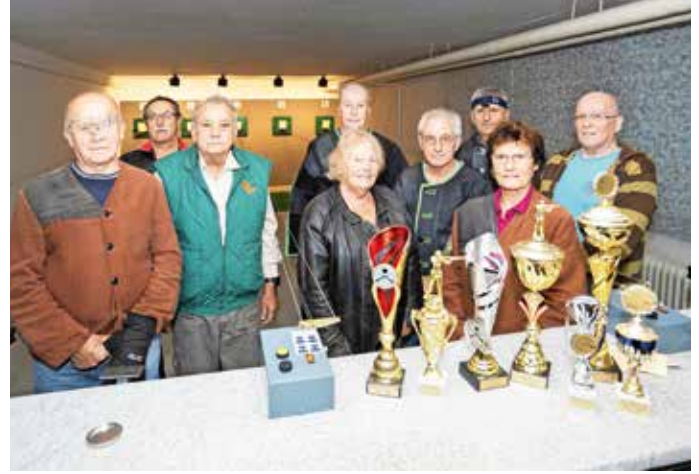
Člani strelske sekcije DU Medvode se lahko pohvalijo že s številnimi uspehi. Trenirajo na strelišču pod kegljiščem pri hidroelektrarni Medvode.