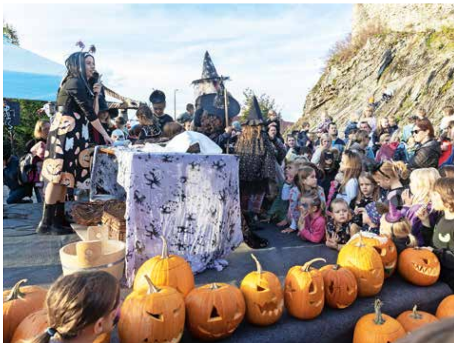
Že prva Noč čarovnic na Starem gradu je bila dobro obiskana, letos pa je bilo obiskovalcev še več.

Tako je nastala ideja za Noč čarovnic. Menim, da bi bilo mogoče izpeljati tudi kakšno zimsko predstavo ali dogodek,« o odločitvi za organizacijo Noči čarovnic pravi organizatorica Suzana Grabec.