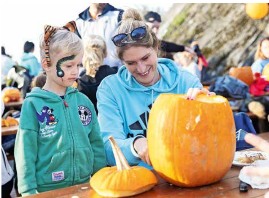
Izrezovanje buč je bilo zabavno tako za starše kot za otroke.

V oktobrski številki Sotočja je bil na strani 25 objavljen članek z naslovom Jesen pod Černetovim toplarjem. V zadnjem stavku je bilo napačno navedeno, da je prireditev popestril Mešani pevski zbor Smleški žarek iz KUD Smlednik. Pravilno je, da je na dogodku nastopil pevski zbor Srebrne zvezde Društva upokojencev Pirniče. Za nenamerano napako se opravičujemo. Uredništvo