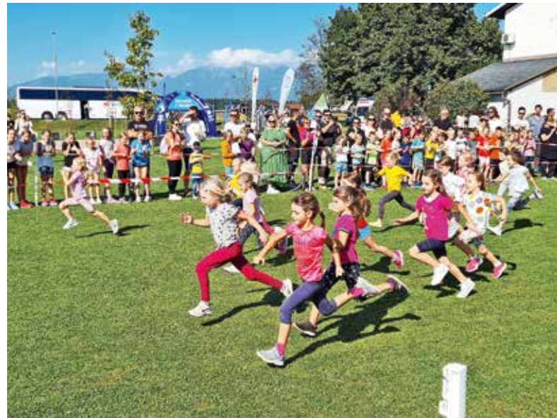
Na občinskem šolskem krosu se je pomerilo 376 učenk in učencev.