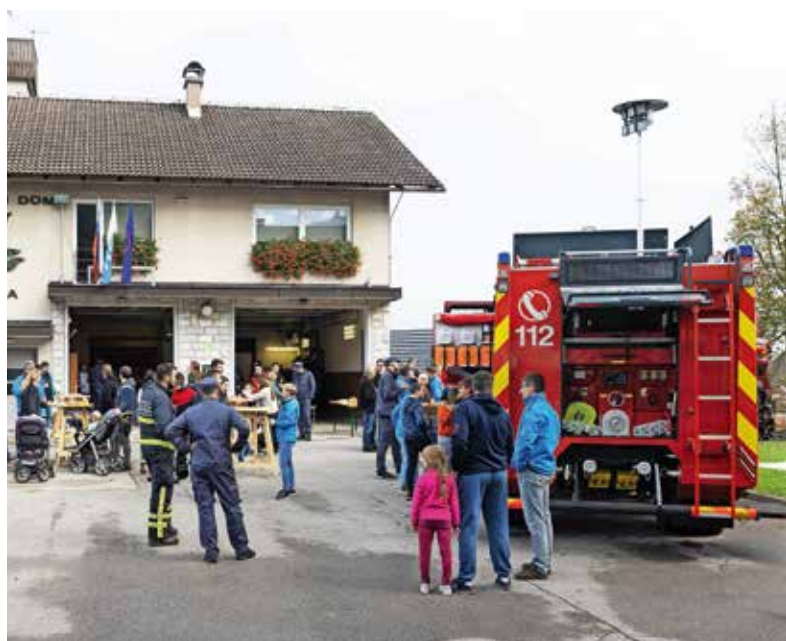
Dnevi odprtih vrat so namenjeni tudi druženju. Na fotografiji je dogajanje pred gasilskim domom v Sori.

Voda je bila umazana, ponekod polna fekalij in naftnih derivatov, česar se ne da vedno očistiti,« je povedal Kralj in dodal, da oblačenje operativnega gasilca od nog do glave stane več kot dva tisočaka. Kljub vsemu društvo v prihodnost gleda z optimizmom.