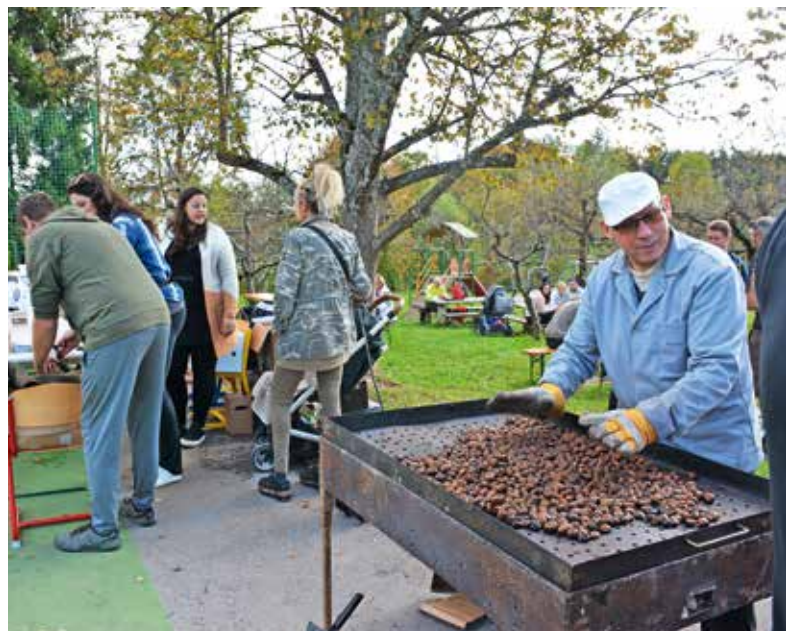
Spekli so okrog sto kilogramov kostanja.