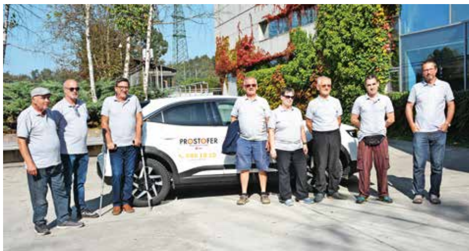
Aktivnih voznikov »prostoferjev« je osem. Letos so do konca oktobra opravili že 321 prevozov.