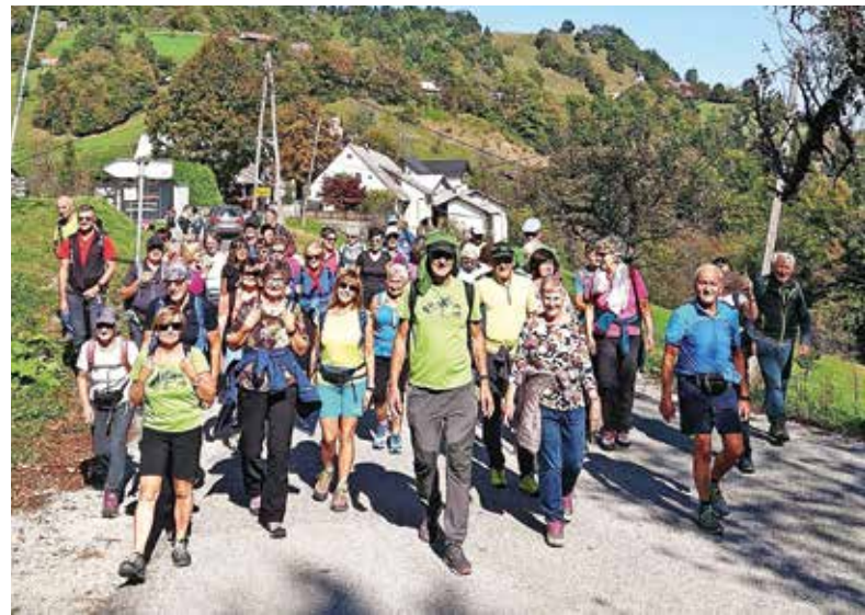
Planinci iz Južne Tirolske so v Polhograjskih preživeli lepo popoldne.

Za člani PD Medvode je sicer pestro poletje. Avgustovsko deževje je na planinskih poteh v Polhograjskih povzročilo precej škode. »Pot od Rusa proti Osolniku po Mavškem grabnu je uničena. Trenutno je zaprta in bo taka tudi ostala, ker je od brvi do doline Ločnice vse uničeno. Pot je zasuta, ogromno je naplavin in skal,« pravi Šturm in dodaja, da je erozija poškodovala tudi nekaj drugih poti, ki jih bo v prihodnje treba popraviti.