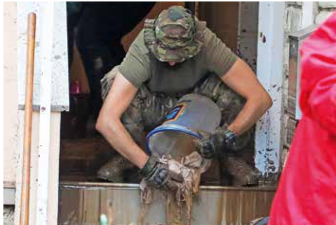
Prizadeti v poplavah bodo lahko uveljavljali celotno ali delno vračilo plačanega NUSZ.

S predlaganim sklepom želijo lastnike stanovanjskih objektov, ki so bili poplavljeni, v celoti ali polovično razbremeniti NUSZ za leto 2023.