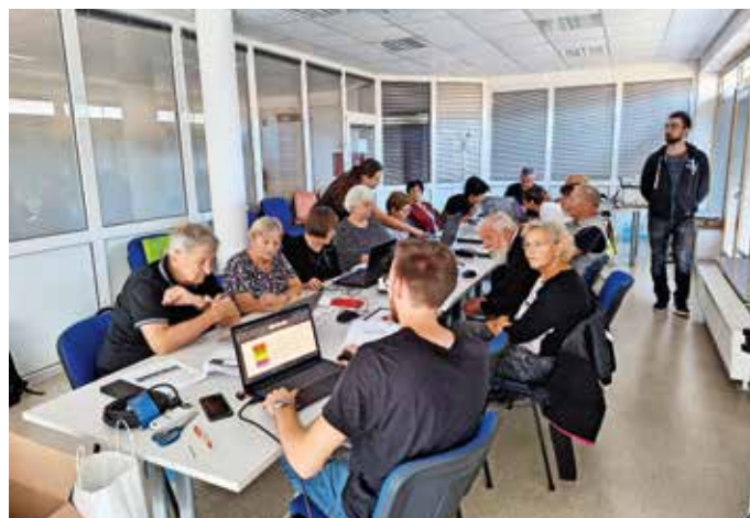
Člani DU Pirniče se računalniško izobražujejo.

V Društvu upokoencev Pirniče nadaljujejo izobraževanje svojih članov na področju uporabe računalnika. V treh terminih so ga v septembru in v začetku oktobra izvedli trije sodelavci podjetja Neutron. Pirniškim upokoencem so predali obilo znanja in jim predstavili več kot le osnove. »Imeli smo dovolj priložnosti, da smo dobili odgovore na vprašanja, tudi glede posameznih primerov in težav pri delu z računalnikom in uporabi mobilnega telefona. Prejeli smo tudi obsežno knjižno gradivo z vsemi postopki in razlagami za delo. Gradivo je pregledno, kakovostno in uporabno,« so zapisali v Društvu upokoencev Pirniče. V novembru nadaljujejo računalniško opismenjevanje s skupino Simbioza. M. B.