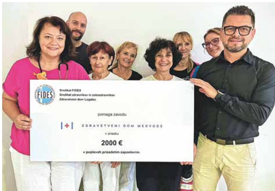
Predaja bona Zdravstvenega doma Logatec Zdravstvenemu domu Medvode – za njihove zaposlene, ki so utrpeli škodo v poplavah

V Zdravstvenem domu Medvode so se pred kratkim razveselili tudi informacije, da je projekt gradnje prizidka pripravljen za oddajo za pridobitev