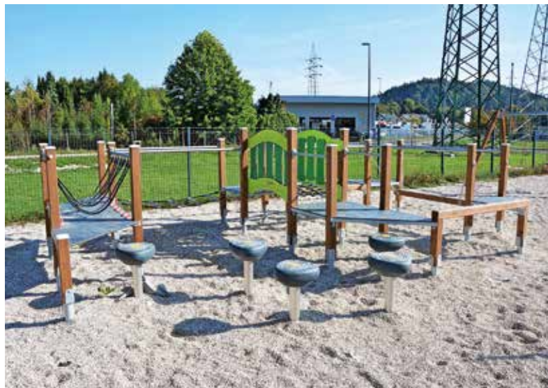
Med že izvedenimi projekti participativnega proračuna v novem ciklu je tudi dopolnitev igral na otroškem igrišču pri Športni dvorani Medvode.

hiša, naša mladost (Sv. Marjeta), Ureditev okolice pri taboriški hiški Rodu dveh rek Medvode, Povečanje varnosti udeležencev v prometu (Seničica–Golo Brdo), Dopolnitev igral na otroškem igrišču Sniček (KS Senica) in Rekonstrukcija poškodovane asfaltne prevleke (Tehovec). V letu 2024 so načrtovani