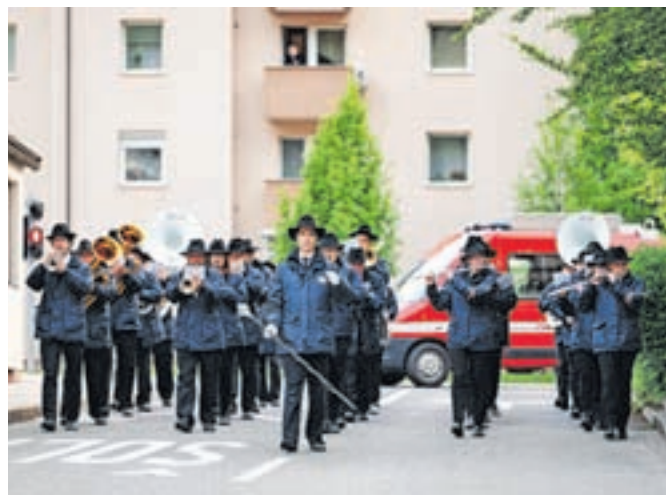
Jeseniški godbeniki na prvomajsko jutro pričarajo praznično vzdušje.

Slaščičarne Metuljček do stavbe okrajnega sodišča. Izkušnje kažejo, da je odziv ljudi na prvih lokacijah nekoliko skromnejši, razmišljajo, da bi v prihodnje Hrušico opustili. Popolnoma drugače je potem na od lani novi lokaciji Podmežakla in pri upokojencih na Slovenskem Javor-