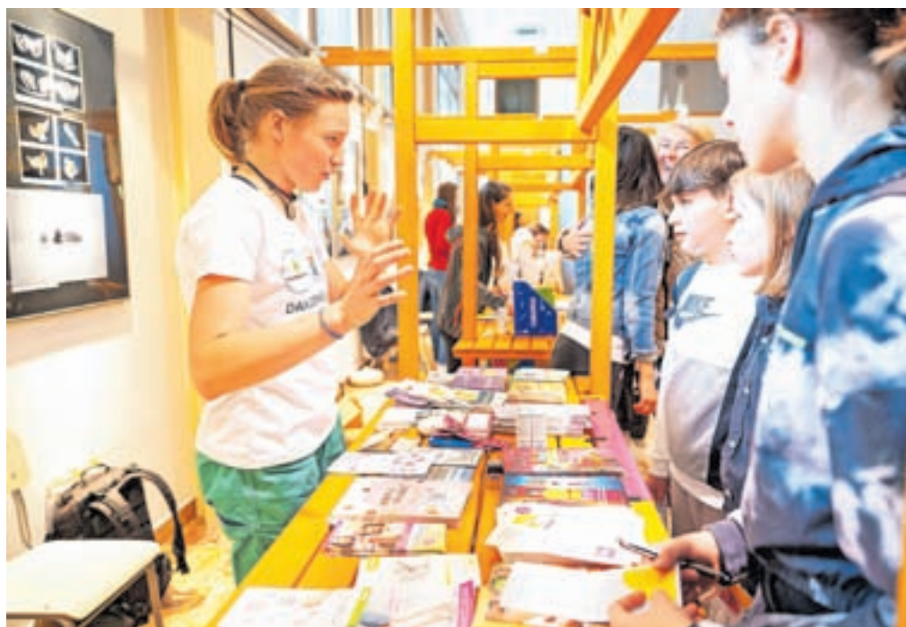
Veliko ljudi je izkazalo zanimanje za različna svetovanja, preventivne programe in vse drugo, kar so jim ponudili na 7. Dnevu zdravja.

s preventivo, ki je tek na dolge proge, lahko to bistveno popravi. »Vse stvari, ki jih predstavljamo, so zelo pomembne za Jesenice. V primerjavi s Slovenijo imamo slabši odziv na programe Sviti in Zora, slabšo telesno