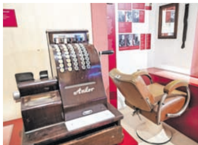
Blagajna in frizerski salon iz okrog leta 1930