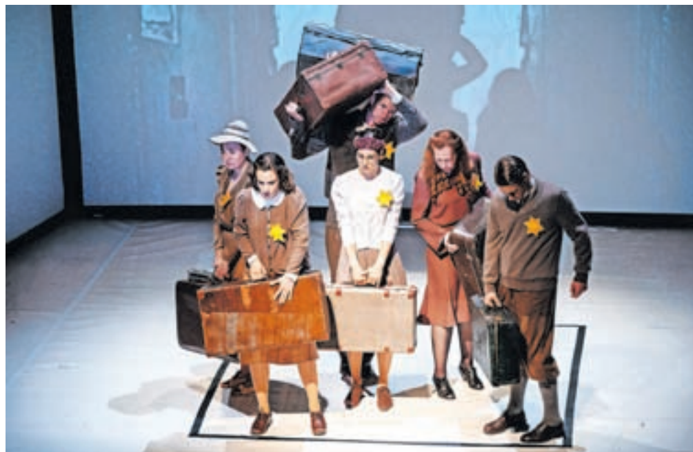
Odrska izvedba Dnevnika Ane Frank, ki so jo uprizorili igralci Mini teatra, nikogar ni pustila ravnodušnega.

Spomnil je na oborožen spopad Cankarjeve čete na Mežakli, na pomembno vlogo partizanske bolnišnice v bližini Zakopov in na osvoboditev delavskega taborišča Podmežakla. »Občina Jesenice vseskozi ohranja spoštljiv odnos do dogodkov preteklosti, saj je zelo pomembno, da častimo spomin na tiste, ki so osvobodili naše kraje,« je poudaril in pozornost namenil tudi trenutnim konfliktom v svetu. Kot je dejal, svet še vedno ni doumel, kako krhka sta mir in blagostanje ter kako hitro lahko zagorijo nova gorišča, za njimi pa ostajajo pogorišča, bolečina in osiromašenje. »Vojne na področju naše