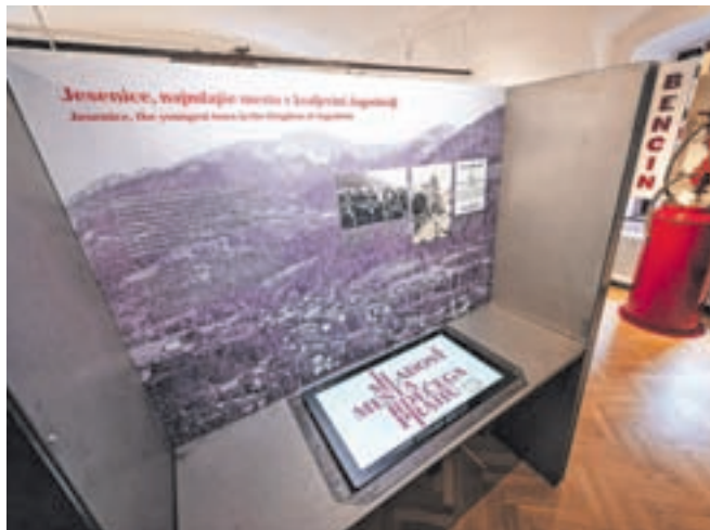
Vpeti so moderni pristopi z digitalnimi vsebinami, posebej z igro Zaklad Jesenic bo vsak lahko na zabavnejši način spoznaval zgodovino mesta. / FOTO: NIK BERTONCELI

Za kulturni program so poskrbeli člani Kvinteta Vintgar. Že množičen obisk na odprtju je nakazal, da bo za razstavo kar nekaj časa vladalo veliko zanimanje med Jeseničani in okoličani.