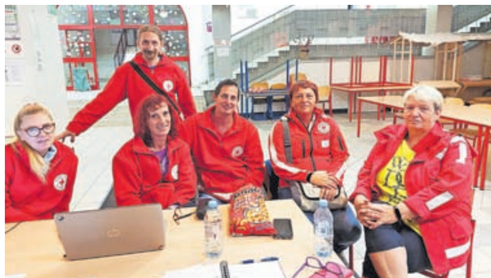
V lanskem letu se je združenje izkazalo tudi ob grožnji plazu nad Koroško Belo, saj so skrbeli za namestitve in oskrbo v evakuacijskem centru v Osnovni šoli Prežihovega Voranca, vključili pa so se tudi v zbiranje pomoči za prizadeve v poplavah.

V sklopu združenja imajo tudi skladišče za rabljenimi oblačili, za katero se res trudijo, da je urejeno in da imajo na voljo lepa, čista oblačila. »Prosimo, naj bodo oblačila, ki jih ljudje prinesejo, čista in nosljiva. Vsa-