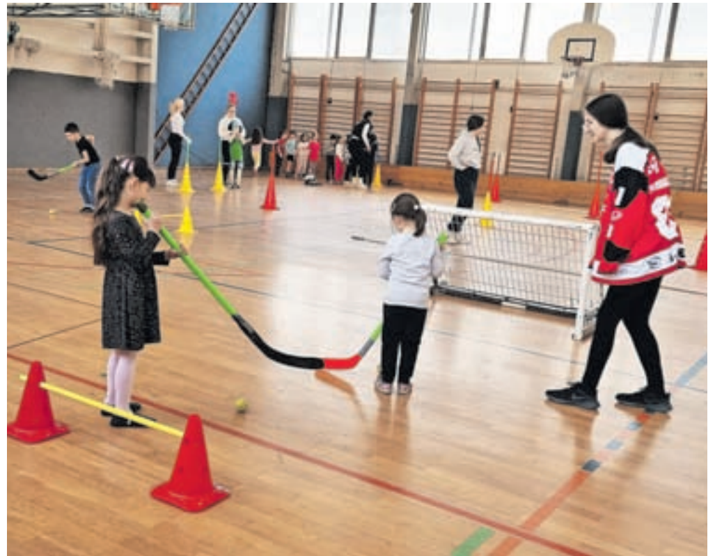
Najmlajši na gibalnih uricah na zabaven način spoznavajo različne športe, tudi hokej. Zabijali so gole kot Anže Kopitar.