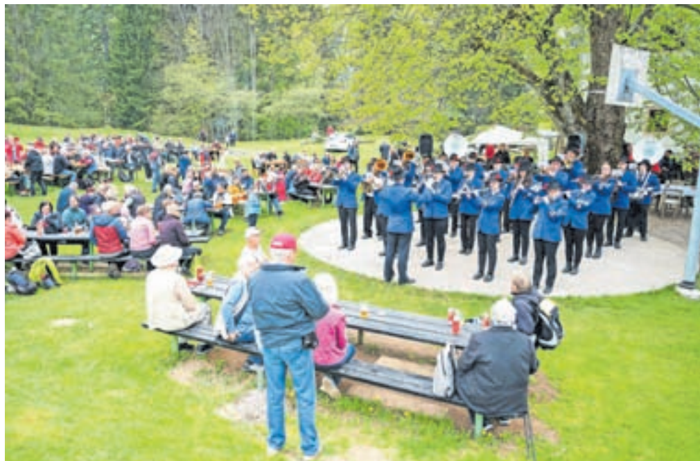
Tudi letos je Dom Pristava predstavljal zadnjo postajo prvomajske budnice Pihalnega orkestra Jesenice - Kranjska Gora.