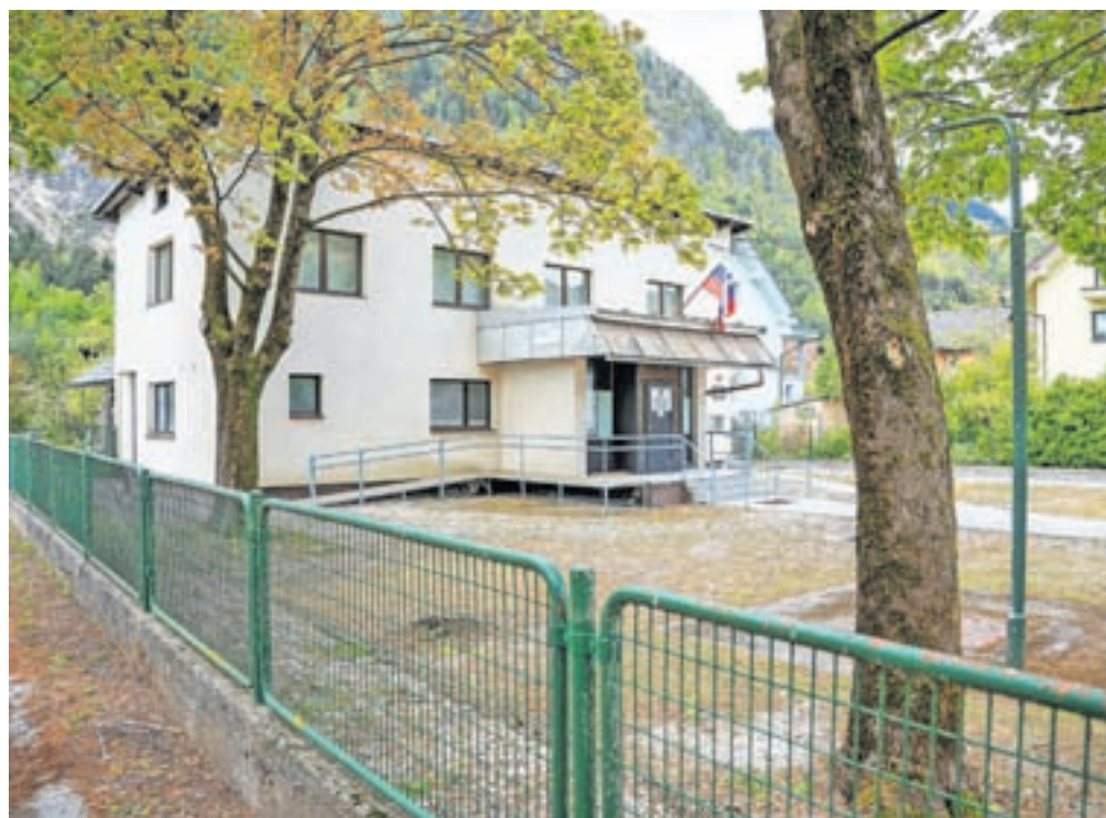
Prostori v Podmežakli, kjer je nekoč že deloval vrtec, so ena od možnih rešitev.

dnega vpisa. A prijave prihajajo tudi še po rednem vpisu, ti naknadno vpisani otroci so uvrščeni na konec seznama, po podatkih s konca aprila je bilo takšnih še vsaj dvanajst. Skupaj bi tako jeseni brez mesta v vrtcu lahko ostalo več kot sedemdeset otrok. Da se to vendarle ne bo zgodilo, so na Občini Jesenice