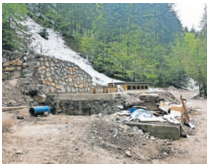
Na vodnem viru Peričnik poteka vgradnja UV dezinfektorja.

na dodatna ureditev trase novozgrajenega cevovoda od zajetja v smeri proti Mojstrani v dolžini približno 500 metrov. Gradbena dela bodo tako zaključena do konca maja, so povedali na Občini Jesenice. Objekt naj bi bil v uporabo predan junija. Ko