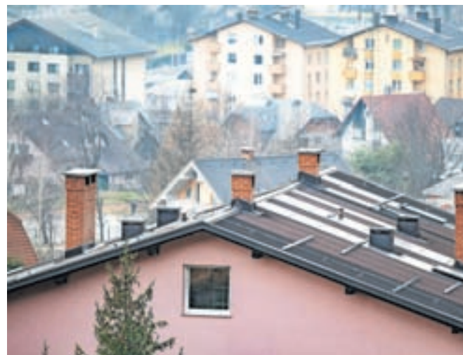
Bi bila rešitev, da bi distribucijo toplote v sistemu daljinskega ogrevanja spet prevzelo javno komunalno podjetje Jeko?

Skubic je na seji pojasnil podrobnosti, kako je bila oskrba z daljinskim ogrevanjem urejena pred sklenitvijo koncesije. Sprva je za oskrbo skrbel občina sama oz. z njo javno komunalno podjetje Jeko-IN. V letu 2013 so nato sprejeli odlok o koncesiji, ki je bil podlaga za kasnejšo sklenitev koncesije z družbo Enos, d. d., leta 2014. Skubic je nato izčrpno razložil, da je na podlagi prejete dokumentacije in podanih pojasnil Ob-