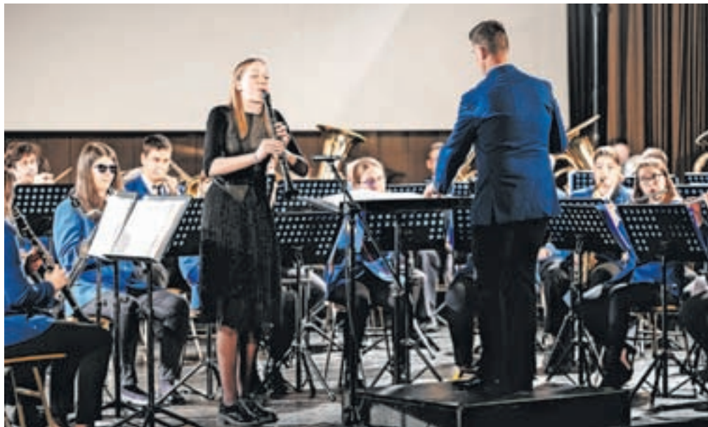
Na spomladanskem koncertu pihalnega orkestra so kot gostje nastopili učenci Glasbene šole Jesenice.

vedbo skladb prejeli velik aplavz, ki jim bo zagotovo spodbuda na njihovi nadaljnji glasbeni poti. Nadarjenost in velika ljubezen do glasbe se že odražata z osvojenimi zlatimi plaketami, nagradami in drugimi priznanji na različnih domačih in mednarodnih tekmovanjih.