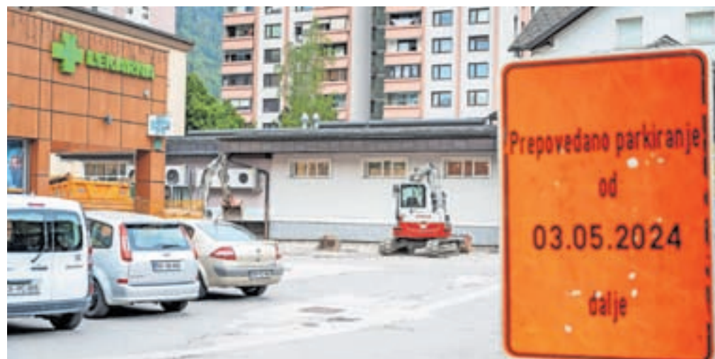
Območje med lekarno in trgovino, kjer so začeli urejati Trg prijateljstva

Občina Jesenice je začela izvedbo projekta Trg prijateljstva – Ureditev urbanih površin na Plavžu, s katerim bo preoblikovala središče Plavža v sodobno in prijetno okolje za srečevanje in druženje. Glavna značilnost prenove bo novo tlakovanje trga, poleg tega pa bodo prostor opremili z novo urbano opremo in kakovostno razsvetlavo, zasadili zelene površine ter postavili skulpturo prijateljstva. Kot so sporočili z občine, je cilj prenove ustvariti prijeten in prepoznaven ambient, ki bo prispeval k višji kakovosti življenja prebivalcev v tem delu Jesenic, vsi dostopi na trg pa bodo prilagojeni gibal-