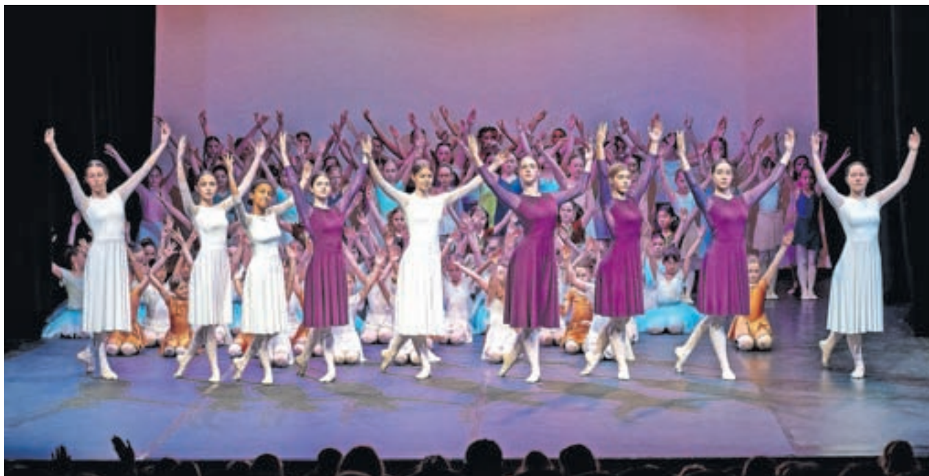
Zaključni poklon na odru Gledališča Toneta Čufarja / FOTO: GREGOR VIDMAR

strana, Žirovnica in Jesenice, zvečer pa drugo občinstvo. Ob tem pa v Glasbeni šoli Jesenice vabijo k vpisu v program plesa za šolsko leto 2024/25.