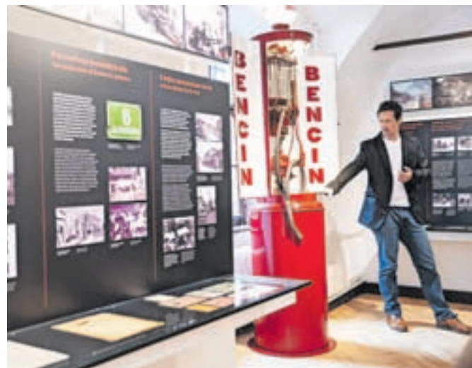
Prva jeseniška bencinska črpalka

ko so bile Jesenice najmlajše mesto v Kraljevini Jugoslaviji. Zajeta so obdobja razvoja na številnih področjih, urbanističnem, zdravstvenem, šolskem, kulturnem, športnem in drugih. Del razstave zajema najbolj mračno in težko obdobje druge svetovne vojne z bombardiranjem mesta 1. marca 1945 in povojno obnovo. Obnovljena zaporniška celica gestapa v Kosovi graščini je prežeta s pieteto do takratnih zapornikov. Vpeti so moderni pris-