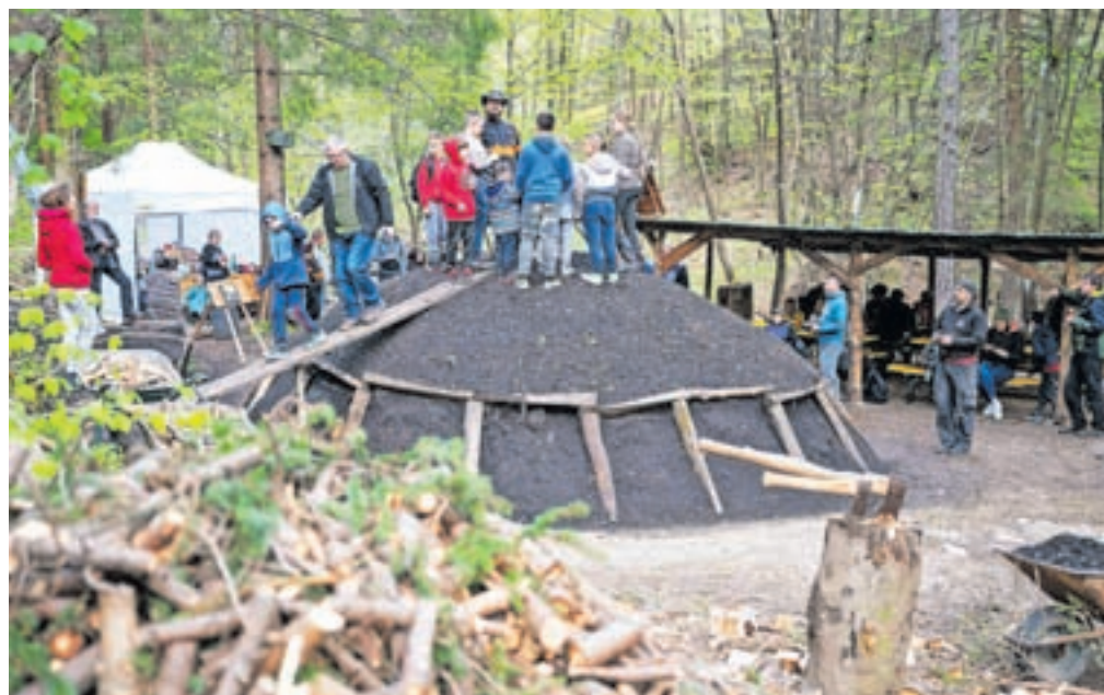
Za letošnjo kopo so uporabili sedemnajst kubičnih metrov lesa.

nil,« je dodal Laharnar. Nekdaj je bilo po Sloveniji veliko krajev, kjer so kuhali oglje, danes pa se le redki ukvarjajo s to dejavnostjo, čeprav je ogljarstvo še vedno pomemben del naše kulturne dediščine.