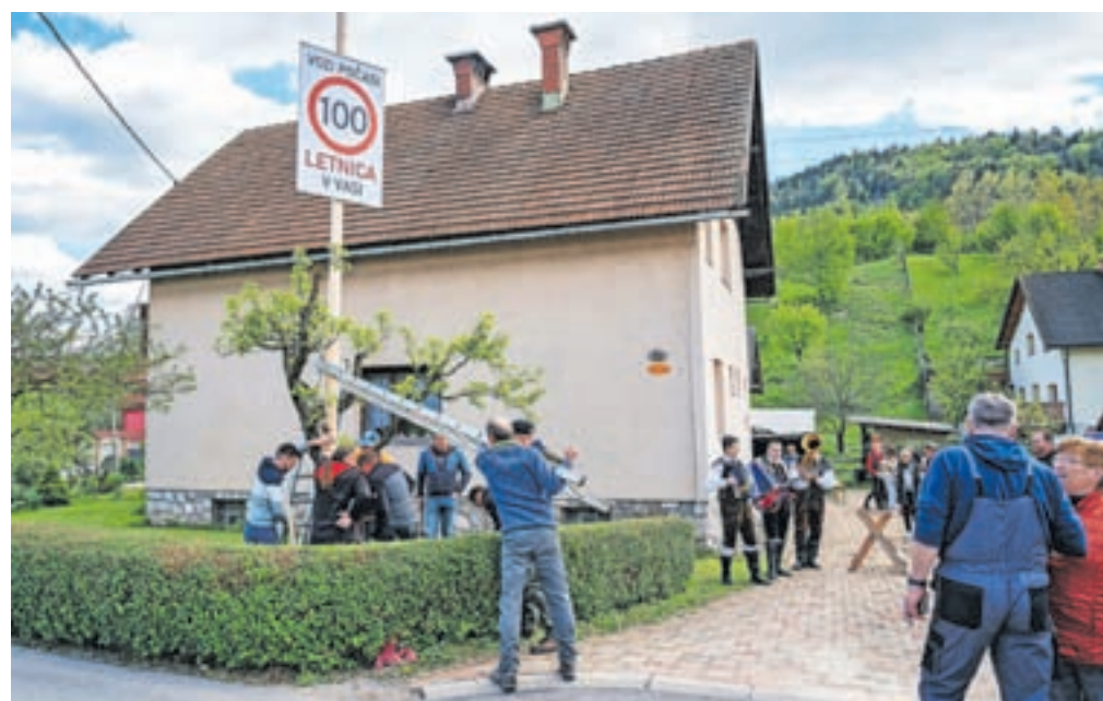
Postavljanje mlaja ob hiši v Lipcah

otrok. Uspešno je vzgajala gorenjske nageljne, za kar je bila tudi nagrajena. Imela je