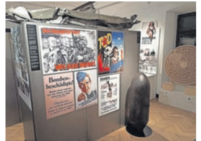
Na ogled je tudi ena od 94 bomb, ki so 1. marca 1945 razdejale mesto, in del krila bombnika, ki je strmoglavil na sedlo Suha.