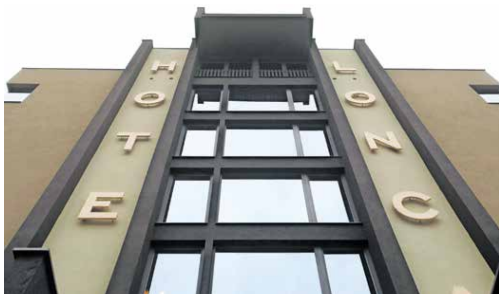
Hotel Lonca je prve goste sprejel v drugem tednu novembra.

Škofja Loka – Mesto na točju Selške in Poljanske Sore od zaprtja Hotela Transturist leta 2005 ni imelo večjega hotela. Zato je Lonca za mesto še toliko večja pridobitev. Trizvezdični Hotel Lonca, katerega ime izvira iz prvega poimenovanja Škofje Loke iz leta 973, ima 42 standardnih sob, pa tudi družinske sobe in suite. Nudijo nočitev z zajtrkom. V hotelu sta tudi velnes s finsko in bio finsko savno ter fitness. Med drugim ima Lonca konferenčno sobo, ki omogoča izvedbo poslovnih dogodkov. Prve goste so sprejeli v drugem tednu novembra. V prvih tednih delovanja so z obiskom zadovoljni, prav tako tudi z rezervacijami.