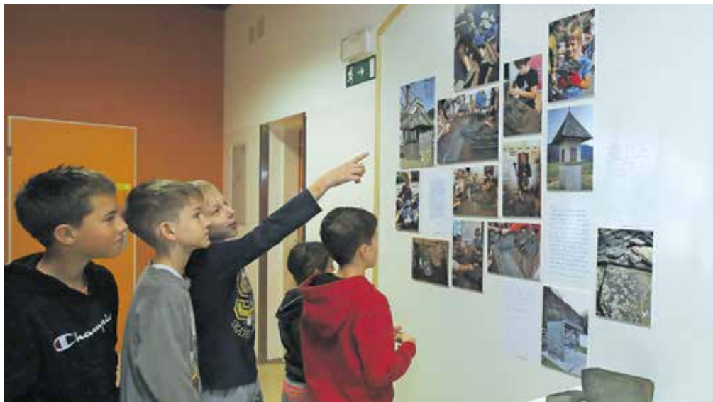
Prostor so prejšnji terek odprli z razstavo, ki nosi naslov Tlak in škrlj, razstavili pa so tudi slike z delavnic.