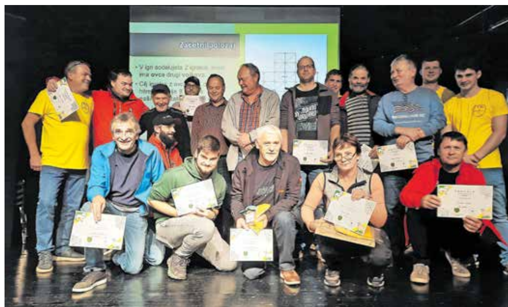
Tekmovalci in člani komisije

bljanskem zvonu, po katerih se je njegova ustvarjalna pot le še vzpenjala, dokler ni dosegel zrelosti klasičnega realizma ter v Cvetju v jeseni in Visoški kroniki »v izčiščenem in zrelem izrazu zapel poslednji pesem duhovni obliki ljubezni, ki je (najbrž) tudi najvišja oblika ljubezni«, so zapisali v predstavitvi knjige. »Ivan Tavčar preišča in piše, vrže na valove življenja, ki ga nosijo in zibajo, visoko dvigajo in globoko spuščajo, ki glasno hrumijo in tihotno šumijo, da bi se naposled izlili v literarne besede,« so še zapisali ob knjigi.