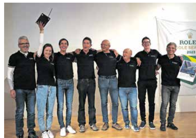
Ekipa Karpo na odru Sokolskega doma