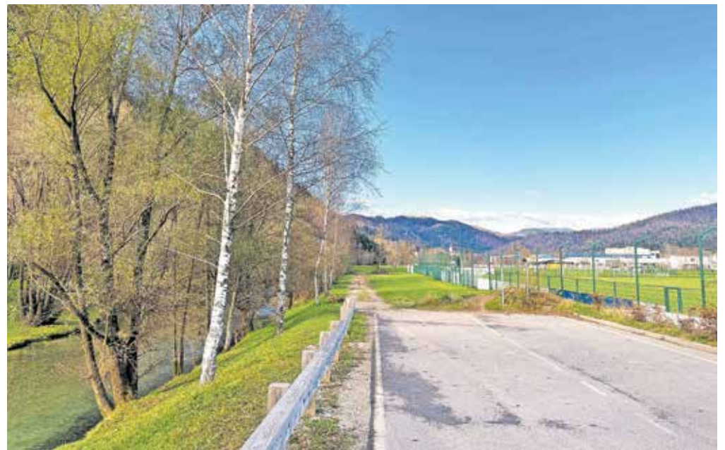
Z novim prostorskim načrtom v prostor umeščajo tudi severni del žirovske obvoznice.

tudi nekaj zemljišč za gradnjo stanovanjskih objektov. Po županovem mnenju se je sicer sprostilo premalo novih stavbnih zemljišč, saj potrebe po gradnji ta čas presega-