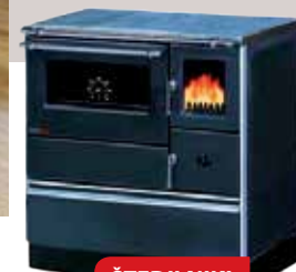
ŠTEDILNIKI ALFA PLAM

ZAKAJ IZBRATI KAMINSKE PEČI LOKATERM: • Estetska dovršenost • Enostavna uporaba • Dolgoročna investicija