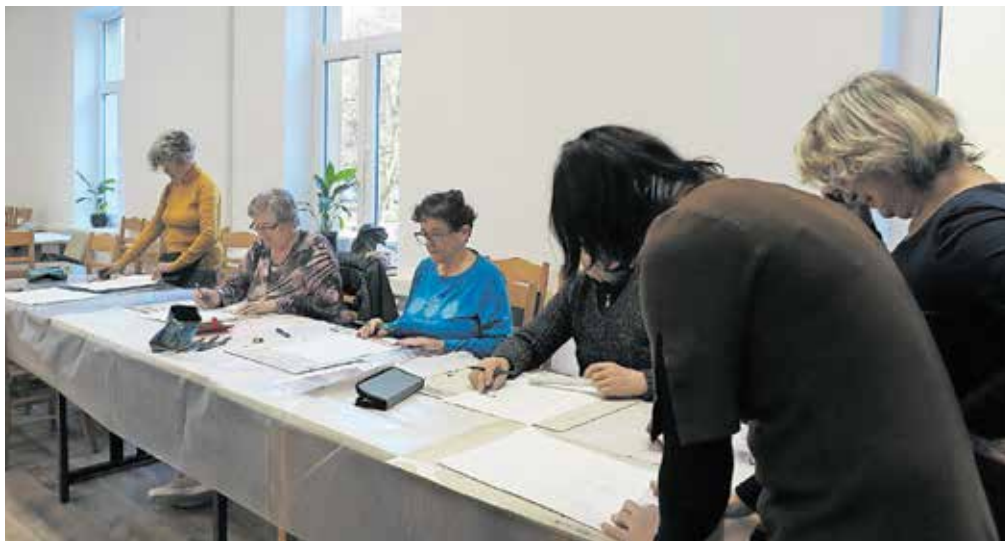
V novi večnamenski dvorani že potekajo različne dejavnosti.