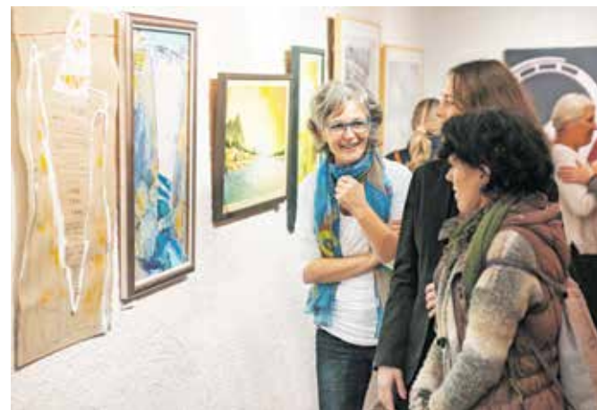
V galeriji muzeja si je do 3. decembra možno ogledati slikarsko razstavo Puštuci u Železnikih.

Železniki – V nedeljo, 3. decembra, med 10. in 13. uro bo v Muzeju Železniki prost vstop, s čimer se pridružujejo vseslovenski akciji Ta veseli dan kulture, v sklopu katere kulturne ustanove ob obletnici rojstva Franceta Prešerna brezplačno odprejo vrata. Vodstvo po zbirkah bo ob 11. uri. V galeriji muzeja si bo možno ogledati slikarsko razstavo Puštuci u Železnikih, ki je na ogled še do 3. decembra. Razstavlja deset likovnih ustvarjalcev, povezanih s Puštalom, s svojimi deli pa se jim pridružuje še pet učencev Osnovne šole Škofja Loka – Mesto, ki živijo v Puštalu. V galeriji muzeja bodo nato v petek, 8. decembra, ob 19. uri odprli razstavo Vizualni Krawal skozi čas, ki so jo ob letošnjem 30. festivalu Krawal pripravili v Kulturnem društvu Rov. Odprtje bo z glasbo popestril Niko Novak, nato pa bo razstava tam na ogled vse do marca.