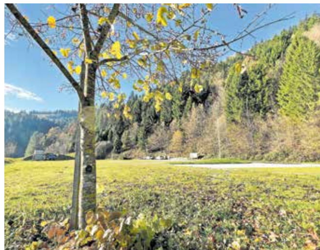
Na območju Pustotnika želita žirovska podjetnika urediti tudi objekte za glamping in manjši hotel.

Kot sta Biljali in Oblak poudarila v dopisu, ki sta ga naslovila na občino, se zave-data, da občina potrebuje razvoj na področju turizma in športa. »Območje bi razvijali postopoma, tako da bi nadgrajevali ponudbo in vsebino.« Najprej imata v načrtu gradnjo gostinskega objekta, sledila bi postavitev objektov za glamping, nazadnje pa bi zgradila še na-