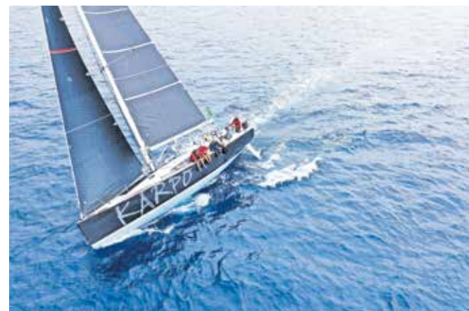
Jadrnica Elan 450, ki je popeljala ekipo do zmage