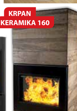
KRPAN KERAMIKA 160