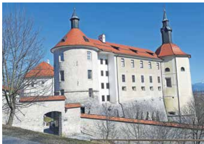
... je leta 2022 ponovila Ophélie Chapuis.