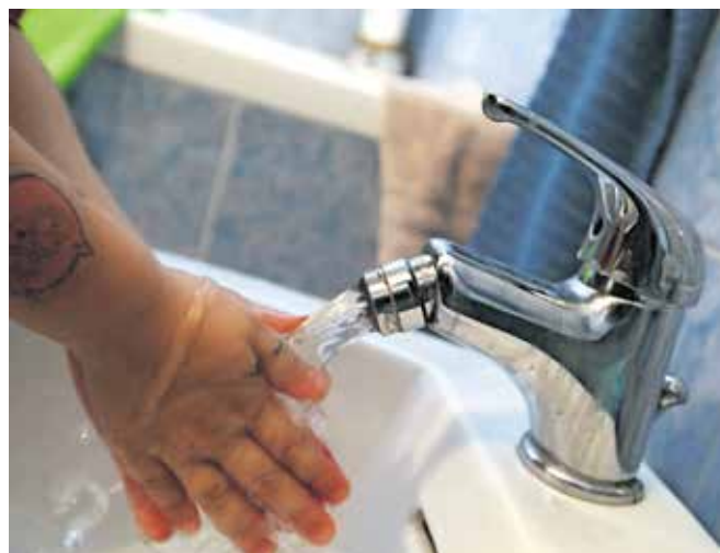
Popis vodomerov poteka ta mesec.

Občinski svet Občine Škofja Loka je na zadnji izredni seji sprejel sklep, da se gospodinjstvom uporabnikom oziroma uporabnicam iz naselij, ki so jih prizadele poplave in ki so nastalo škodo iz poplav in plazov prijavili v sistem Ajda, iz občinskega proračuna pokrije vrednost storitev, povezanih s prekomerno porabo pitne vode v avgustu. Gospodinjstvom uporabnikom iz naselij: Demšarjeva cesta, Fužinska ulica, Gosteče, Hosta, Log nad Škofjo Loko, Na Logu, Podpulfrcu, Pungert, Puštal, Sorška cesta, Stara cesta, Stara Loka, Studenec, Virlog, Visoko pri Poljanah in Zminec bodo zaposleni