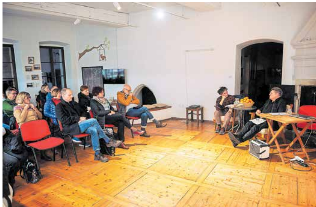
Film War Memorial – Spomenik vojni je pritegnil pozornost obiskovalcev.

Posnetke, del njih je Hawley uporabil v filmu, so našli v arhivu v Manchesteru. Filmi so dolgi od pet do sedem minut, vrteli so jih v lokalnih kinematografih v Veliki Britaniji, večinoma svojcem. Poleg filma je nastala tudi knjiga. »Ne gre le za film, ampak za cel raziskovalni projekt, iskali so preživle vojaške in dva tudi naši. Preživelih je bilo malo, žrtev je bilo ogromno,« je pojasnil Soklič. Kot že večkrat zapisano, posnetki ganejo. »Nekateri sploh niso mogli govoriti, so 'zablokirali', nekateri so pozdravili domače, ženo, otroke, nekateri prijatelje v lokalnem pubu, nekaterim je bilo zelo nerodno.« Spomenik vojni tako predstavlja drugačen pristop k tem ne navadnim in čustvenim filmom, kjer se sporočila umaknejo v ozadje, da bi pokazali drugačen pogled na pomirjujoče in pogumne obraze moških, poudarjajoč namesto tega tišino, dvom in negotovost.