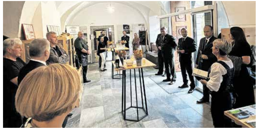
Lovski praznik na Visokem