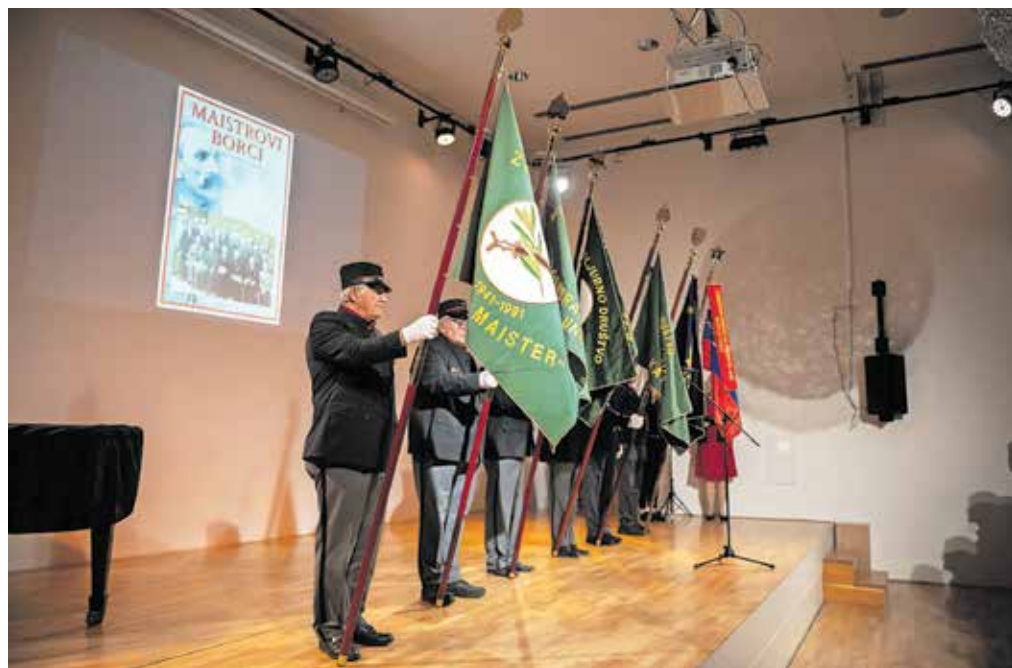
Blaznikov večer so tokrat posvetili Maistrovim borcem z območja občine Škofja Loka.

močja Štajerske in Koroške prišel pod slovensko upravo. »Ponosni smo, da so bili v teh vrstah tudi možje iz naših krajev.« V nekaj tednih je namreč Maister zbral več kot štiri tisoč mož in nastala je prva redna slovenska vojska s slovenskimi častniki in slovenskim poveljevanjem. Med njimi je bilo okrog dvesto fantov in mož s Škofjeloškega.