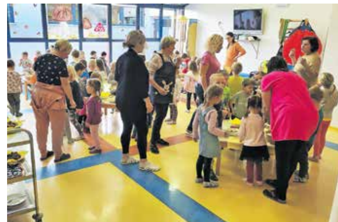
Tradicionalni slovenski zajtrk v žirovskem vrtcu