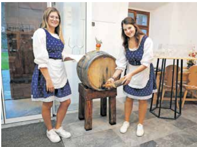
Martinovanje v Dvorcu Visoko