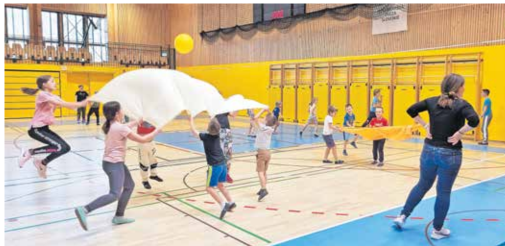
Za razgiban dan so poskrbeli z zanimivo igro z žogo v šolski telovadnici.