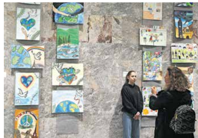
Učenke in učenci so znova pokazali, kako ustvarjalni so.