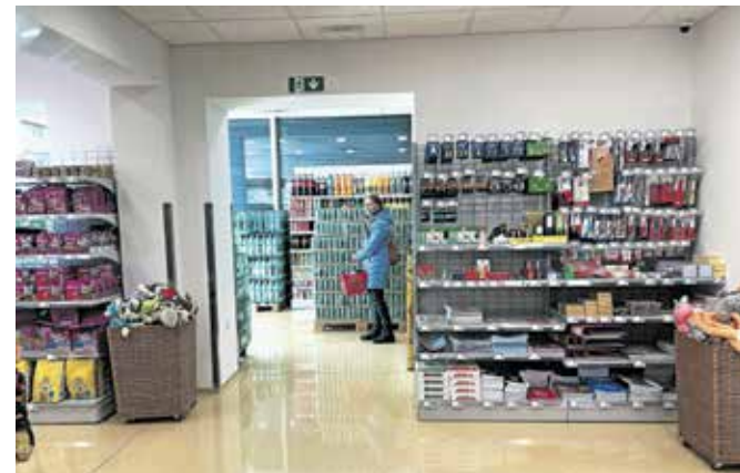
Prenovljeni prostori trgovine Spar v Zadružnem domu

tudi obstoječe prostore trgovine, ki se po novem razprostira na skoraj šeststo kvadratnih metrih površin. V obnovo je podjetje M Sora vložilo okrog 150 tisoč evrov, pri financiranju obnove pa jim je na pomoč