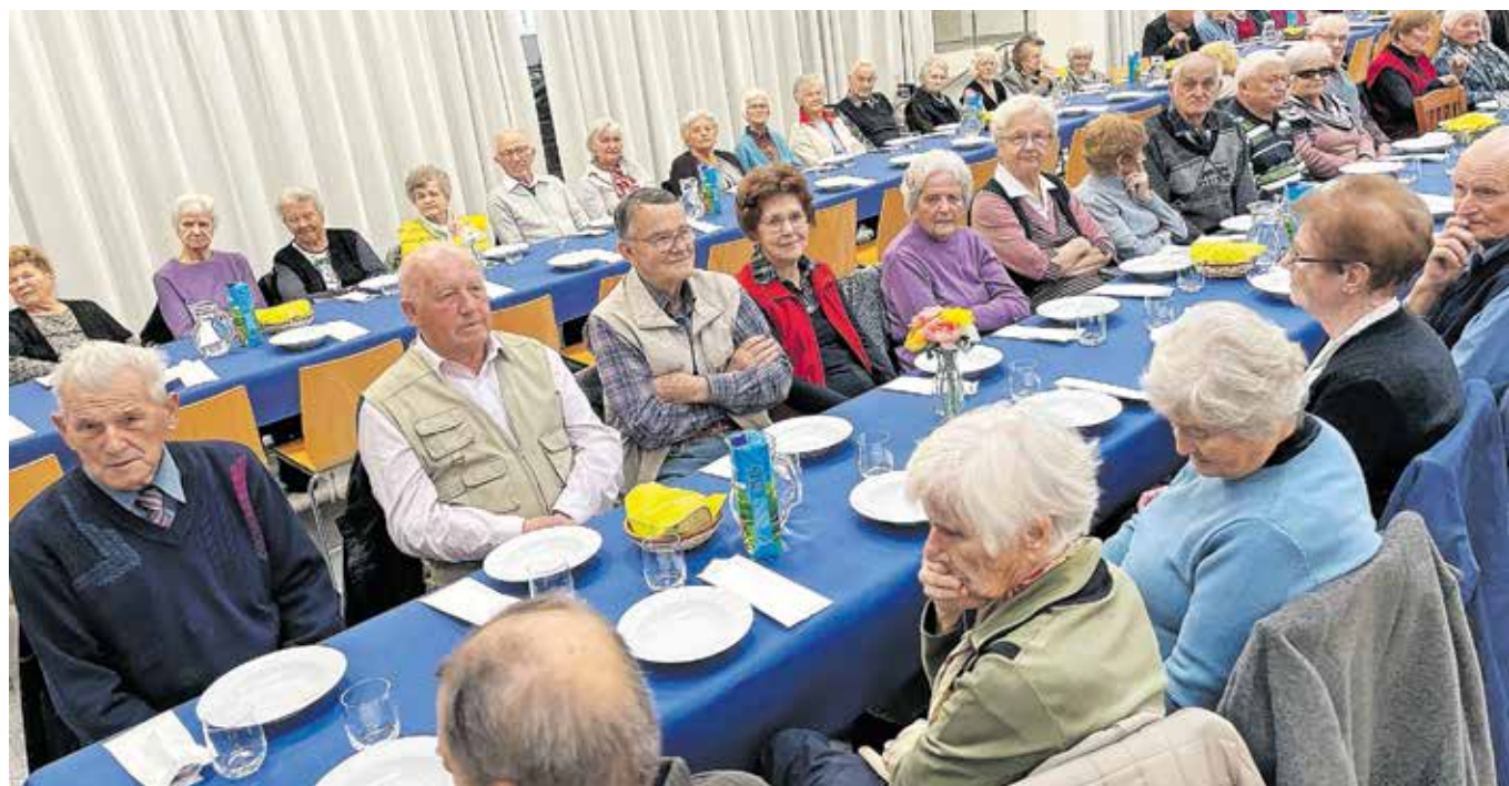
Srečanje starejših v Žireh