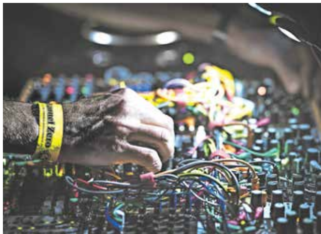
Modularni sintetizator

Tudi pri nas se vedno več govori o »modularcih«.