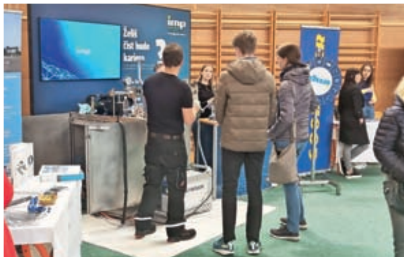
V Šolskem centru Škofja Loka so sredi aprila pripravili karierni sejem pod naslovom Skupaj gradimo kariere.