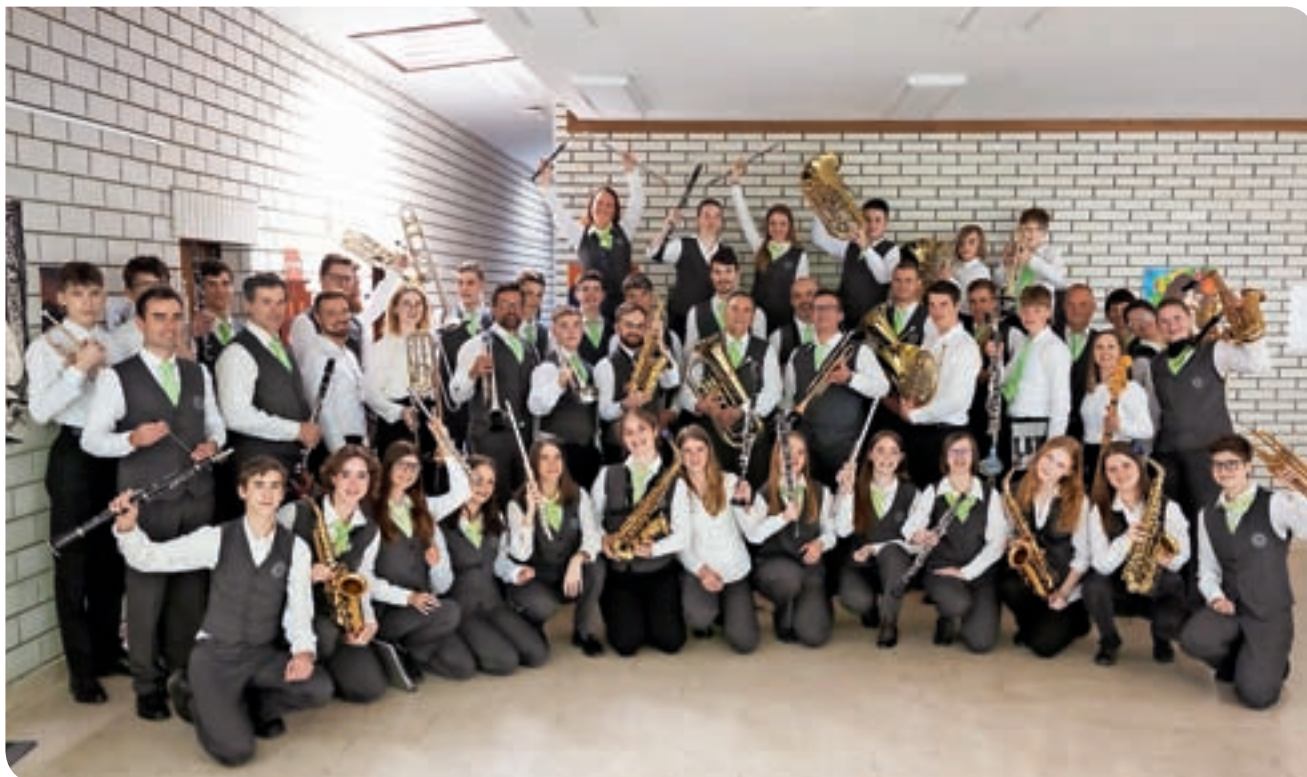
Kar priznajte, da je prav lepo videti vesele in razposajene članice in člane Mestnega pihalnega orkestra Škofja. Ne brez razloga – orkester je na 42. tekmovanju slovenskih godb v Velenju osvojil zlato plaketo s pohvalo, kar pomeni tudi, da se je iz tretje težavnostne kategorije uvrstil v višji rang, v drugo kategorijo. Čestitamo. I. K.