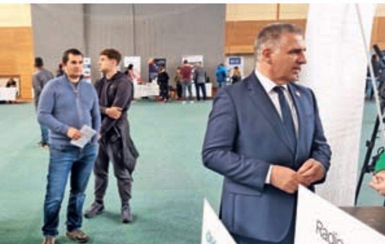
Sejem si je ogledal tudi predsednik državnega sveta Marko Lotrič.

V Šolskem centru Škofja Loka se je sredi aprila pod naslovom Skupaj gradimo kariere odvijal karierni sejem, na katerem so lahko dijaki navezali stike s predstavniki podjetij tako s Škofjeloškega kot celotne regije.