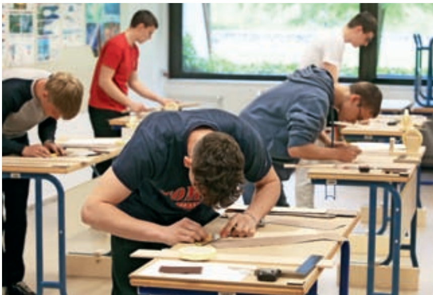
Dijaki pri izdelavi intarzije

Kot so poudarili organizatorji, tovrstna tekmovanja pomenijo preizkus večšin, obenem pa predvsem priložnost za izmenjavo izkušenj in gradnjo mostov med šolami.