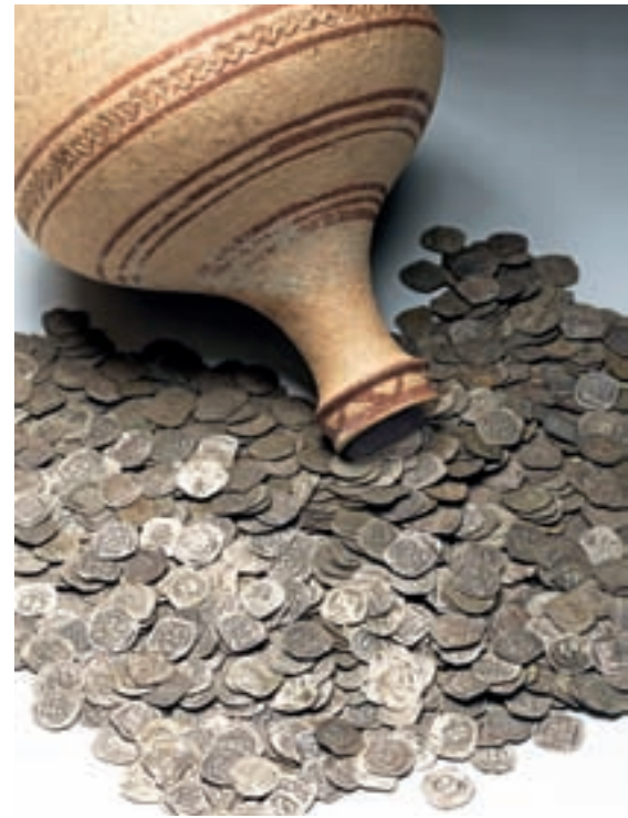
Srebrniki, najdeni v glinenem vrču z rdečerjavo poslikavo, 14.–15. stoletje

in že zato dragocenega. Spet drugi pričajo o razvedrilu v prostem času, npr. koščen igralni žeton, ali o otroški igri, posebej glinena konjička, značilna za srednjeevropski prostor. O glasbi lahko nekaj sklepamo po primerku železnih drumlic, preproste ga instrumenta, a z bogato kulturno