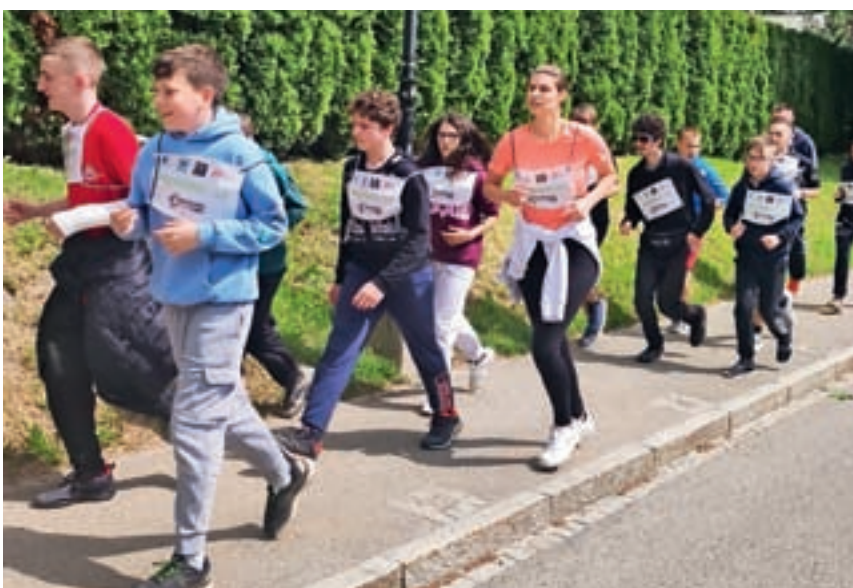
S štafetnim tekom so »nabirali kilometre« za planet.