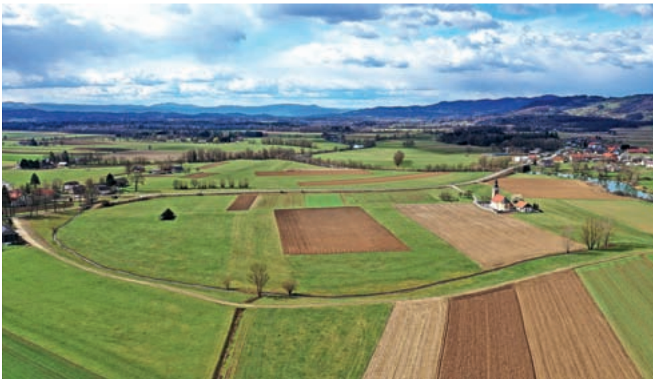
Arheološko najdišče Otok pri Dobravi s ptičje perspektive

Gutenwerd je nemško ime za današnji Otok pri Dobravi, nekdanji freisinški trg, srednjeveško naselje, ki je nastalo v bližini Kostanjevice na Krki, pri današnjem naselju Drama pri Šentjerneju.