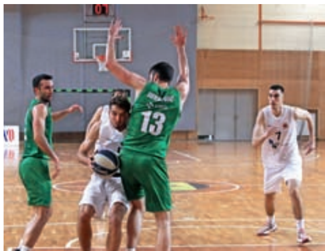
Košarkarji LTH Castingsa so s porazom v četrtfinalu proti Krki zaključili letošnjo sezono.