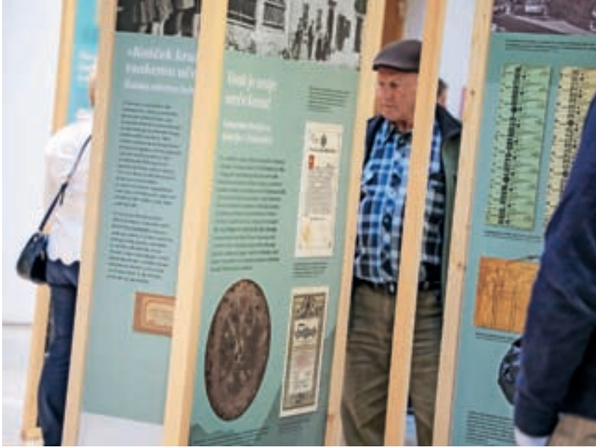
Zanimivo razstavo si je ogledalo veliko obiskovalcev.

čujoči razstavi so namreč sledi časa, sledi življenja in dela naših prednikov, sledi pomembnih ali povsem vsakdanjih dogodkov. Nekateri izvirajo iz še ne tako oddaljene preteklosti, ki se je morda še spominjamo, drugi so mnogo starejši – iz obdobj, do katerih lahko dostopamo samo s pomočjo arhivskih virov ter nujno potrebnim jezikovnim in strokov-