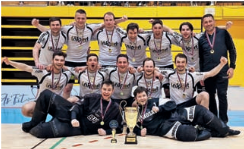
Ekipa Insport Škofja Loka – A se je ob zaključku sezone znova veselila naslova državnih prvakov.

»Po petem zaporednem naslovu mednarodnega prvaka je A ekipa Insporta postala še petič zapored državni prvak v članski konkuren-