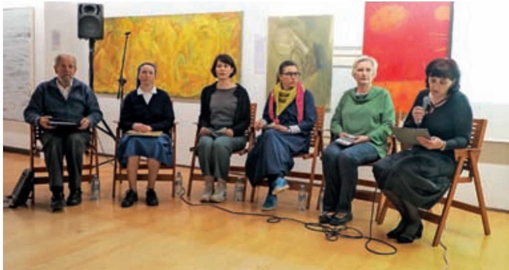
Zanimiv aprilski pogovorni večer v Galeriji Franceta Miheliča v Kašči je bil namenjen predvsem znamenitim Ločankam.

»Najpomembnejše se mi zdi sporočilo, da tudi mi stojimo na ramenih velikanov in da mlade spomnimo, da nismo prvi, ki smo v našem kraju kaj naredili, ampak so bili tudi pred