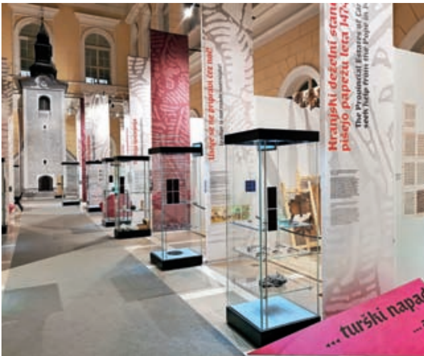
Pogled v razstavni prostor

Razstavo, ki je na ogled v atriju Narodnega muzeja Slovenije, poleg raznovrstnih arheoloških najdb, zgodovinskih dokumentov in upodobitev iz sočasnih likovnih virov dopolnjujejo tudi replike predmetov in rekonstrukcije obrtnih delavnic lončarja, kovača, usnarja in peka ter dveh tržnih stojnic, s čimer so skušali poustvariti pristen srednjeveški ambient. Pri projektu sodeluje tudi Loški muzej, saj smo za potrebe razstave posodili najlepše predmete z opuščenega gradu na Kranclju nad Škofjo Loko. Razstavo si lahko ogledate vse do 3. novembra.