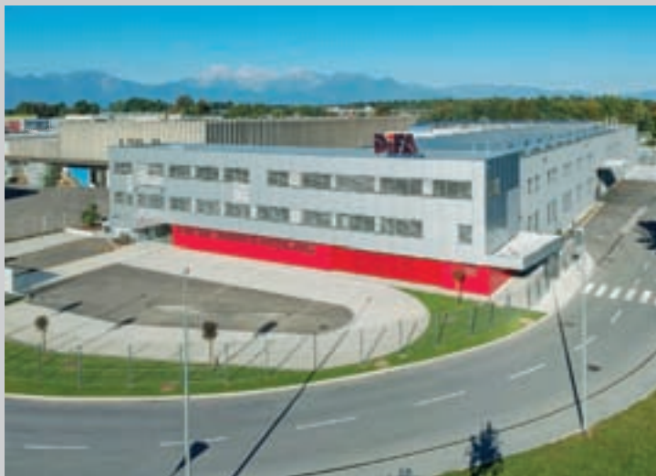
DIFA, D.O.O., ŠKOFJA LOKA, KIDRIČEVA CESTA 91, ŠKOFJA LOKA