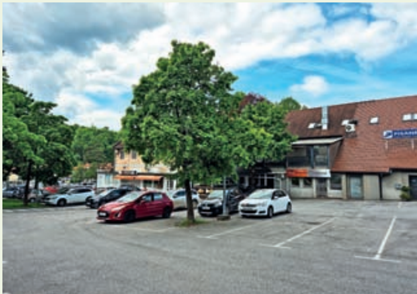
V Škofji Loki je na voljo 6800 parkirnih mest, ki so ob različnih dnevih in urah različno zasedena.

Tistim, ki se bodo do središča Škofje Loke želeli malce sprehoditi, ne bo treba plačati parkirnine. Na bolj oddaljenih parkiriščih, ki so manj zasedena (Puštal, nekdanja vojašnica), bi lahko parkirali zaposleni in drugi, ki želijo parkirati za dlje časa in do mesta lahko gredo peš. Plačljivo parkiranje je v središču