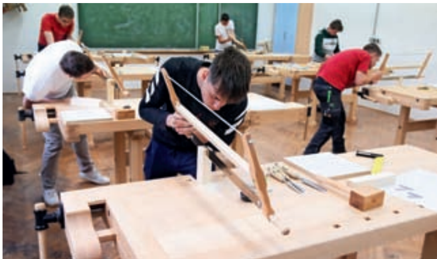
Preizkusili so se tudi v ročni obdelavi lesa.

Na šestih prizoriščih so tekmovalci prikazali svoje znanje, iznajdljivost in strokovnost. Dijaki so se pomerili v ročni obdelavi lesa, izdelavi intarzije, risanju lesnih vezi v programu ACAD, lesarskih dru-