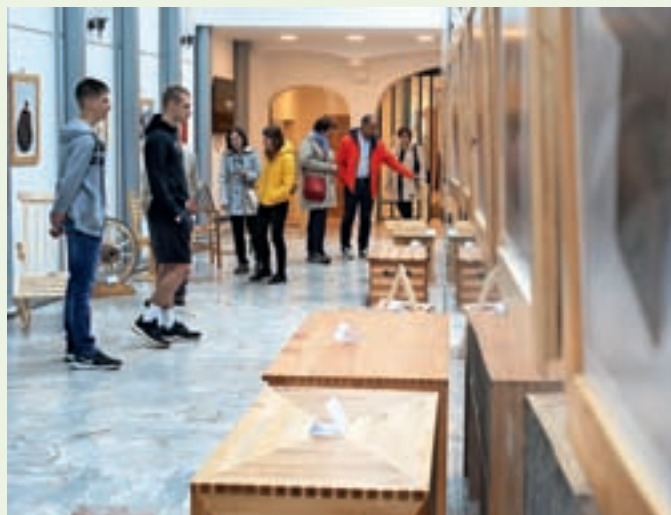
Razstava dijakov v Sokolskem domu ob Tednu obrti in podjetništva na Loškem vedno navduši.

Dogodki ob Tednu obrti in podjetništva so se začeli včeraj z delavnicama o obdavčitvi nepotenih delavcev ter kulturi oblačenja, danes ob 18. uri pa bo v veliki predavalnici OOZ Škofja Loka potekala delavnica s predstavitvijo novosti v obračunu omrežnine za električno energijo. Jutri ob 10. uri je po spletu na sporedu delavnica o tem, kako nam ChatGPT in druga orodja lahko pomagajo pri trženju na družbenih omrežjih, kot vsako leto pa bo ob 18. uri v Sokolskem domu razstava in podelitev nagrad Ustvarjalnost, kreativnost in inovativnost dijakov Šolskega centra Škofja Loka. V četrtek bo sledil obisk gospodarske cone v Žireh, prav tako v četrtek pa bo oddaja na Radiu Sora o mladih v svetu podjetništva.