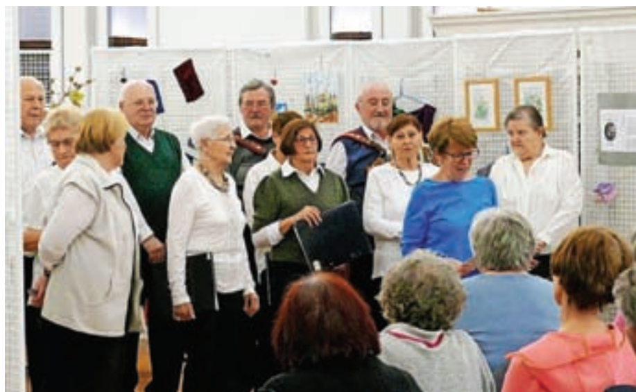
Utrinek z odprtja razstave

»Tema letošnje razstave je Konec zime. Že naslov pove, da se ročnim delom največ posvetimo čez zimo, ko ni dela na vrtu in je manj možnosti za zunanje aktivnosti. Marec pomeni konec zime in zato lahko sedaj pokažemo, kaj smo naredile. Ljubiteljice pletenja in kvačkanja so spletle in skvačkale lepe in