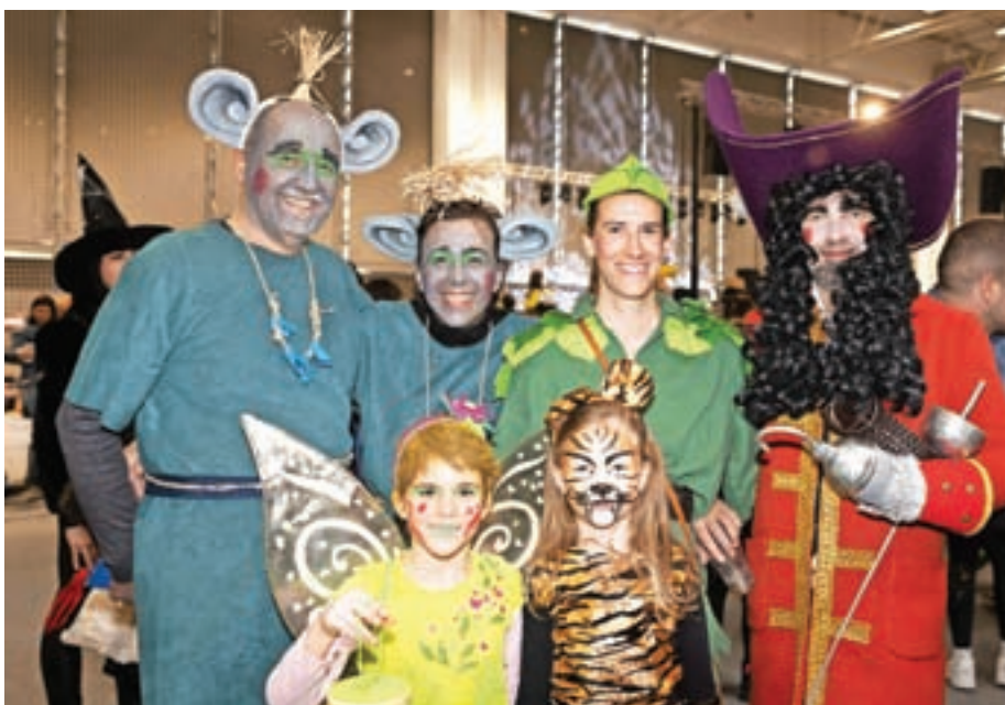
Peter Pan, kapitan Kljuka, Zvončica, tiger in trola iz Medvod