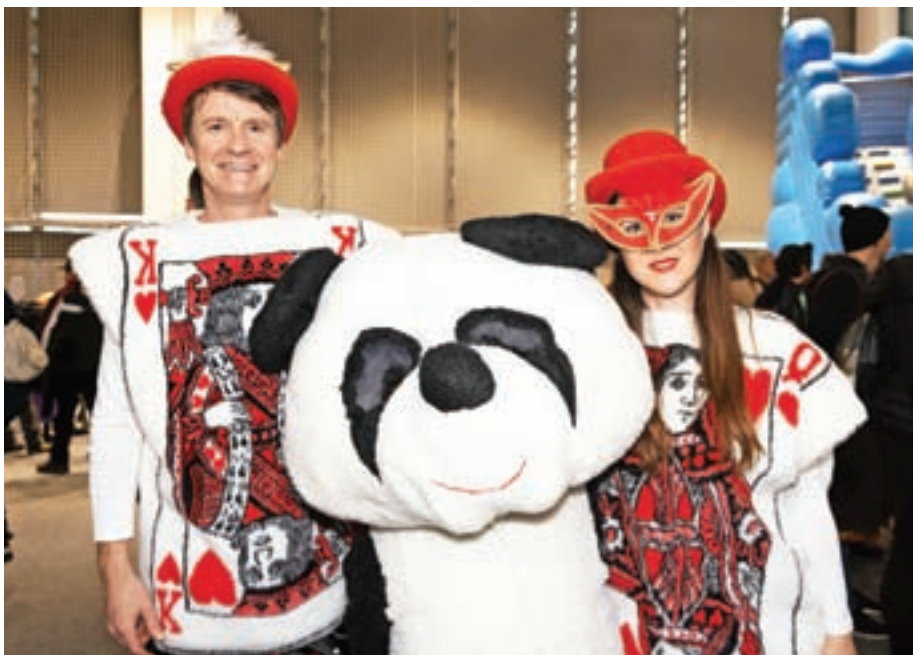
Veliki panda in igralni karti iz Zbilj