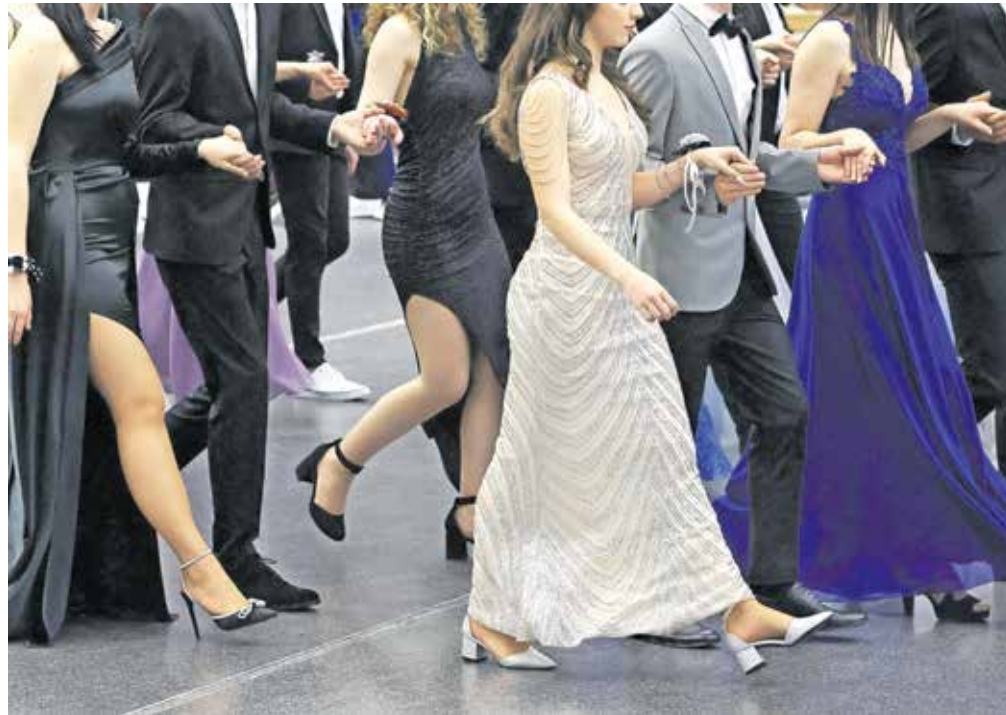
Maturantski ples predstavlja pomemben večer, ki oznanja zaključek srednješolskega obdobja. Kljub čustvenemu naboju in veselju, ki ga prinaša, pa se mnogi sprašujejo, koliko bo ta nepozaben večer dejansko stal.

Če ste pred leti za vstopnico odšteli med 30 in 40 evrov, so cene trenutno precej višje. Najnižjo vstopnico bodo plačali dijaki Gimnazije Kranj, ki bodo na osebo odšteli 55 evrov, cene pa so odvisne tudi od števila maturantov. Manj kot jih je, višja je cena, ki krije stroške najema dvorane. Vstopnice na osebo so se tako že povzpeli na 76 evrov, kar v praksi pomeni, da za štiričlansko družino zgolj vstop na prizorišče stane okoli 300 evrov. Plesni večer seveda zajema tudi stroške plesnih vaj. Na tem področju so cene enotne, 50 evrov na dijaka, kar zajema deset plesnih vaj, ponavljalno vajo, generalko na dan dogodka in ponekod tudi plesne vaje za starše maturantov in vajo maturantov s profesorji. Vse šole