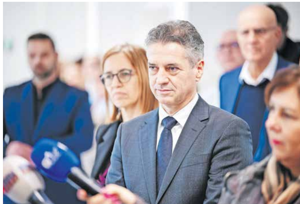
Po mnenju predsednika vlade Roberta Goloba stavka zdravnikov in zobozdravnikov traja že predolgo, kar večja stiske pacientov.