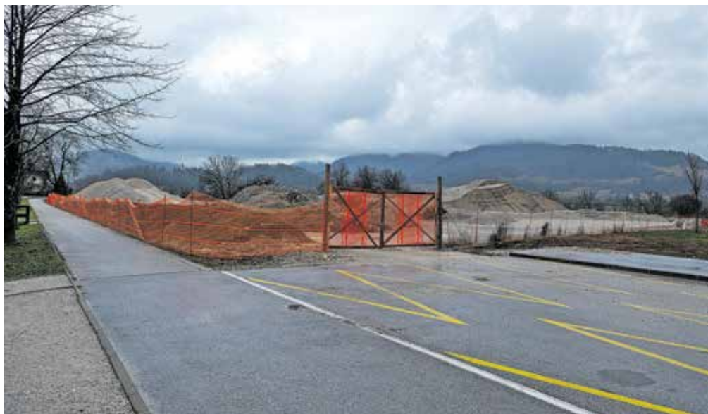
Občina Bled bo pod Blejskim gradom gradila parkirišče.

Letošnji sveženj sredstev so zagotovili iz različnih virov. Med drugim je 250 tisoč evrov prihodkov od Turističnega društva Gorje, 80 tisoč evrov iz naslova parkirnih in