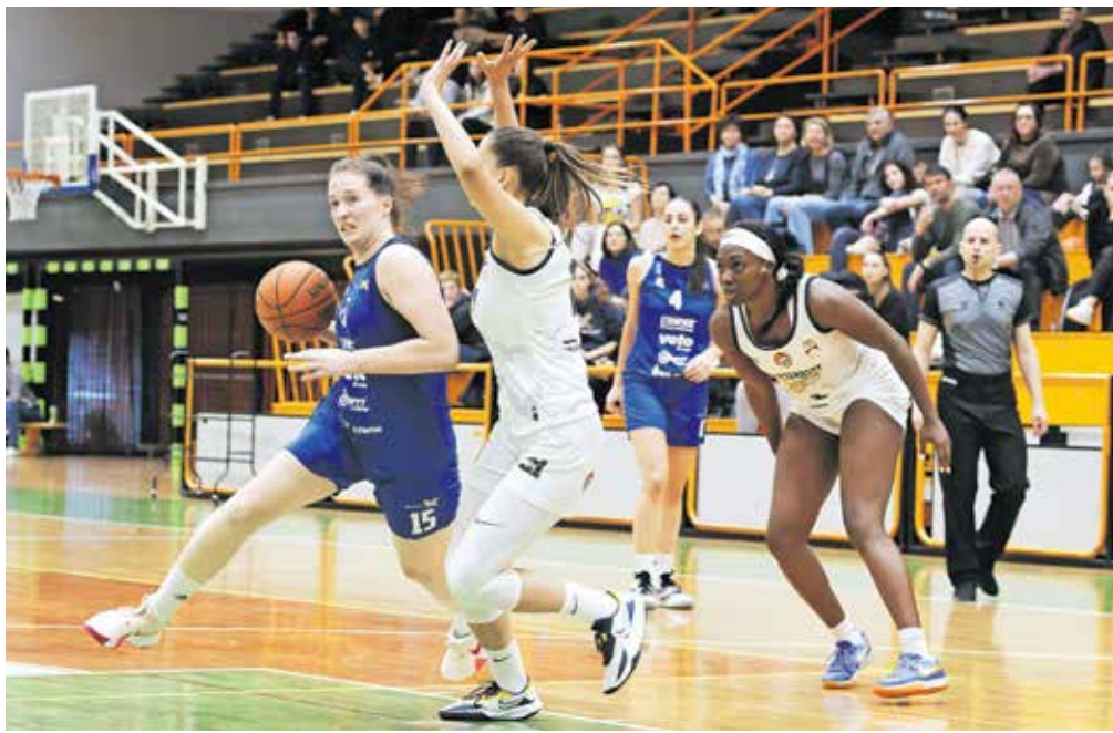
S požrtvovalno igro so si Kranjčanke (v modrih dresih) priigrale finale.

Na prvi nedeljski tekmi je Tršnjevka 2009 z rezultatom 90 : 80 premagala St. Pölten, v ogorčenem boju za nastop na finalnem turnirju lige pa je za konec Triglav ugnal Piešťanské Čajky z rezultatom 58 : 46.