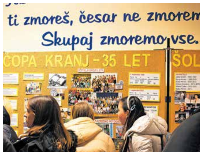
Ob vходу v šolo si je bilo mogoče ogledati razstavo s fotografijami učencev in učiteljev iz preteklih let.

V Osnovni šoli Matije Čopa Kranj so konec januarja pripravili prireditev ob 35. obletnici ustanovitve šole, na kateri so se vrnili v čas pesnika Franceta Prešerna in njegovega sodobnika Matije Čopa.