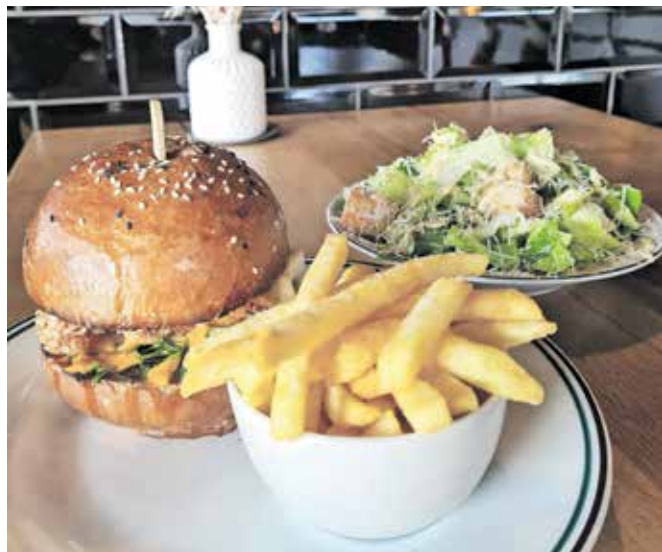
Slastni burger z ocvrtim piščancem, krompirček in cesarjeva solata

Ker je bila nedelja, sem najprej mislila, da se bom morala zadovoljiti s pico, potem pa sem se spomnila na kranjski Projekt burger. Letos pravzaprav praznuje desetletnico obstoja. Na začetku je bil lokal znan po izjemno okusnih burgerjih in glas o njih se je hitro razširil. Spletni portal Big 7 Travel ga je med petdesetimi najboljšimi uvrstil zelo visoko na lestvici priljubljenosti, obrazložitev pa je bila, da imajo odlične kla-