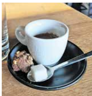
V Projektu burger je tudi espresso simpatično doživetje.

stripse«, to so panirani piščančji trakci, ki sta jih neumno pomakala v zraven postreženo sladko-kislo omako. Mimogrede smo še izvedeli, da je otroški meni v obliki pobarvanke in se tako otroci zamotijo ter barvajo, ko čakajo na hrano; ter da so bila tokratna naročila burgerjev prijetno presenečenje, saj stranke največkrat izberejo govedino, in ne piščanca.