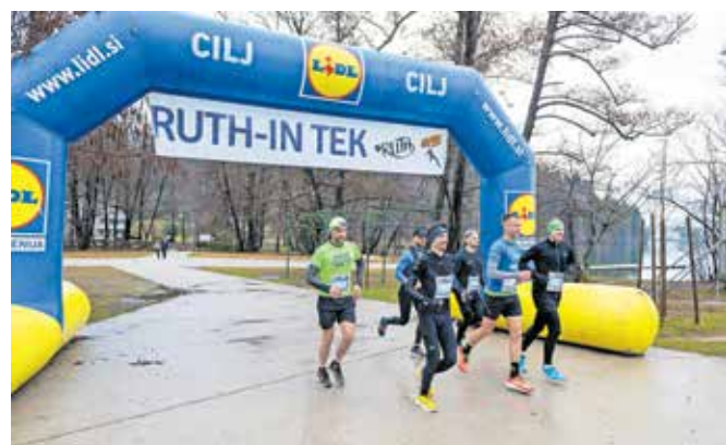
Letošnji Ruthin tek je bil jubilejen.