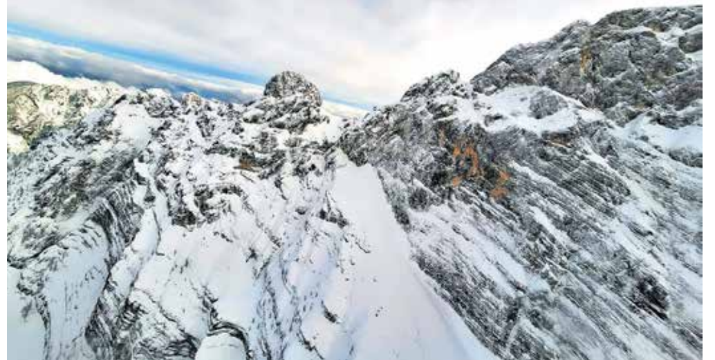
Truplo so našli na območju gore Kepa v občini Kranjska Gora.

Kot so navedli, okoliščine kažejo, da je pokojnik pri prečkanju manjše grape zdrsnil v globino. »Nesreča