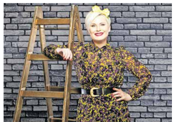
Ana Praznik / Foto: arhiv oddaje