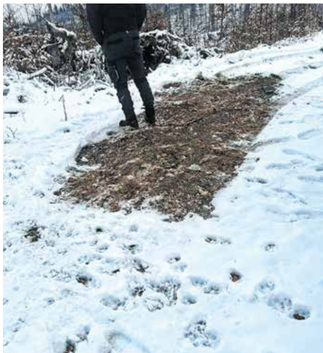
Slika kaže, kje naj bi bilo parkirano vozilo, iz katerega naj bi domnevno v naravo izpustili tri volke. Okoli je polno sledi – od psa, a tudi od volkov.

Problematiko domnevnega izpusta volkov v naravo je na izredni seji obravnavala