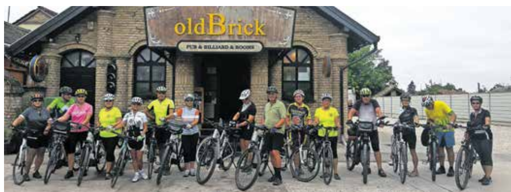
Sombor, skupinska slika pred odhodom

kolesarili po nasipu ob reki skozi kraj Labudnjača do cilja Bačko Novo Selo. Vreme tisti popoldan ni bilo preveč prijazno za kolesarjenje, saj nas je zadnjih deset kilometrov kar precej namakal dež. Prenočili smo v hotelu Bela vrba, ki stoji nekoliko zunaj iz naselja v bližini Donave. Pred večerjo smo opazovali še lep sončni zahod.