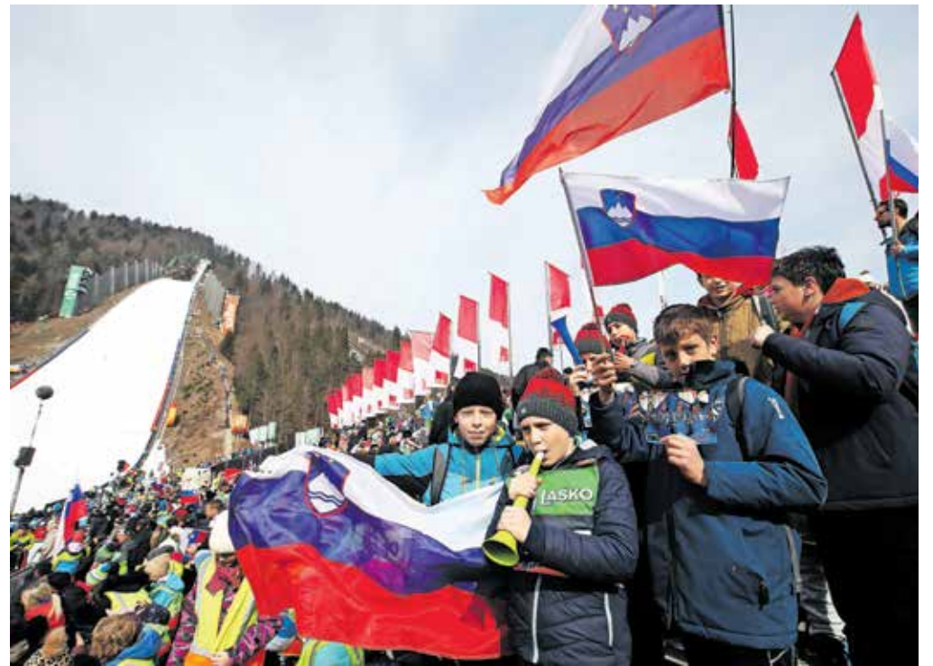
Letalnica bratov Gorišek bo gostila moške finalne tekme, na srednji skakalnici pa se bodo pomerile skakalke, ki prav tako na finalni tekmi upajo na izjemno vzdušje.

Ogled tekme smučarskih skakalk bo mogoč z istimi vstopnicami kot ogled četrtkovskega uradnega treninga in kvalifikacij skakalcev na Letalnici bratov Gorišek. Organizatorji in navijači verjamejo, da bo letošnja finalna tekma skakalk odprla tudi vrata k izvedbi finalne tekme skakalk na Letalnici bratov Gorišek v prihodnji sezoni.