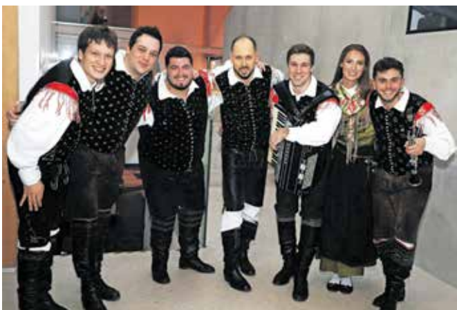
Ansambel Saša Avsenika

Seveda v Delovni akciji tudi brez presenečenj ne gre, lahko pa pričakujemo srečne konce manj srečnih zgodb. Delovna akcija se tako vrača na Pop TV ob nedeljah zvečer ob 20. uri.