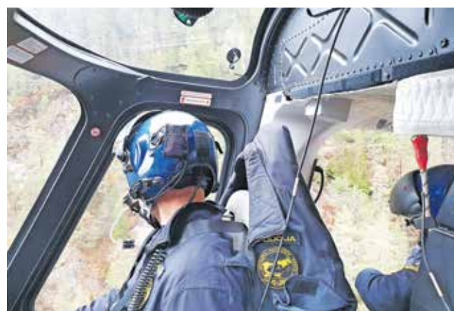
Policisti so v soboto med izvajanjem policijskih nalog s helikopterjem opazili truplo moškega.

ju leden, zato je nujna zimska gorniška oprema. »Posamezna območja so nevarna tudi zaradi opasti in kloži. Previdno ravajte tudi turni smučarji,« so dodali.