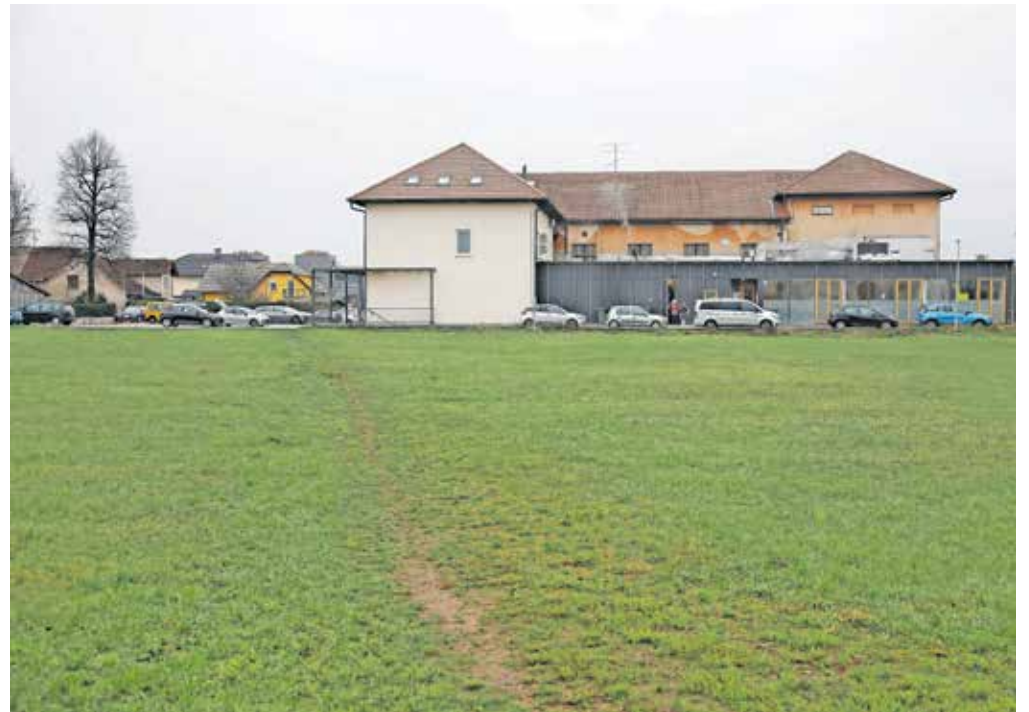
Sklad obrtnikov in podjetnikov je zaradi zemljišča na Primskovem vložil odškodninsko tožbo zoper Mestno občino Kranj.

Gre za zemljišče, ki je bilo predmet ustavne presoje. Sklad obrtnikov in podjetnikov, ki je na Primskovem želel graditi stanovanjske bloke, se je namreč na ustavno sodišče obrnil potem, ko je Mestna občina Kranj leta 2014 na pobudo civilne iniciative in Krajevne skupnosti Primskovo z novim občinskim prostorskim načrtom (OPN) namembnost zemljišča iz stavbnega spremenila v zelene parkovne površine. Ustavno sodišče je leta 2020 ugotovilo, da je OPN v tem delu neustaven, in določilo, da mora občina