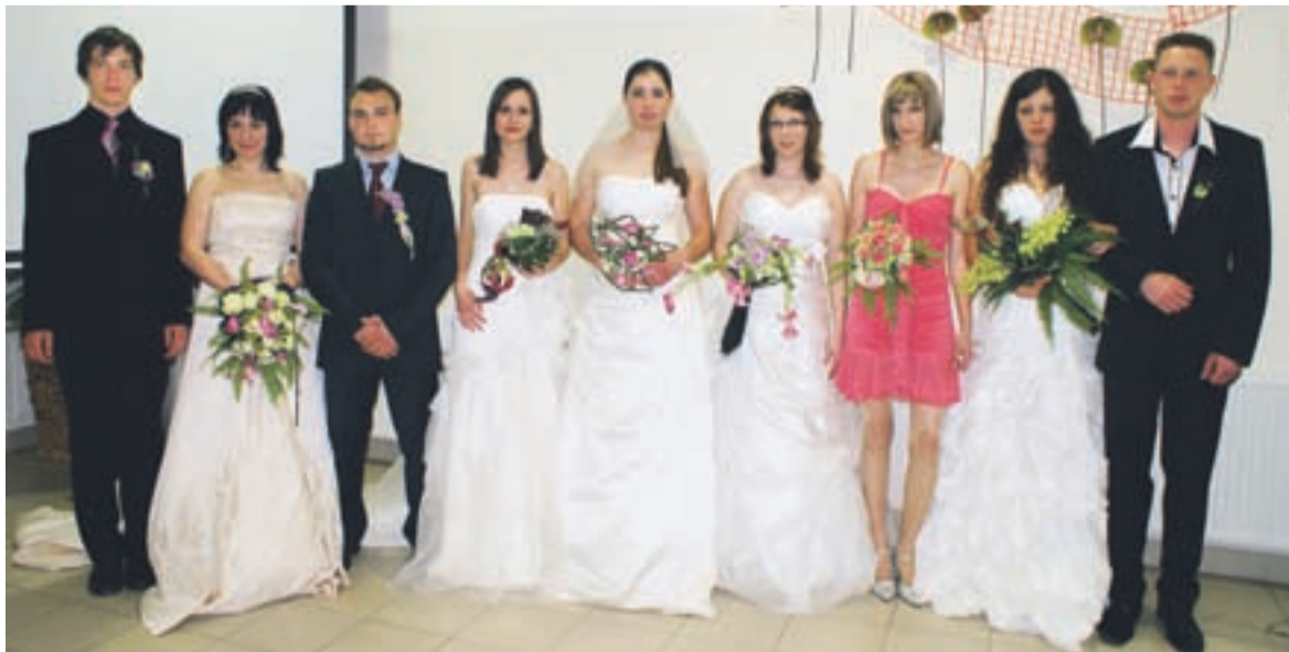
Dijaki in dijakinje s poročnimi šopki in korsaži.

Razstava, ki zelo plastično prikazuje njihovo znanje bo odprta v sredo, 23. junija 2010, od 13. do 20. ure v prvem nadstropju Biotehniškega centra Naklo.