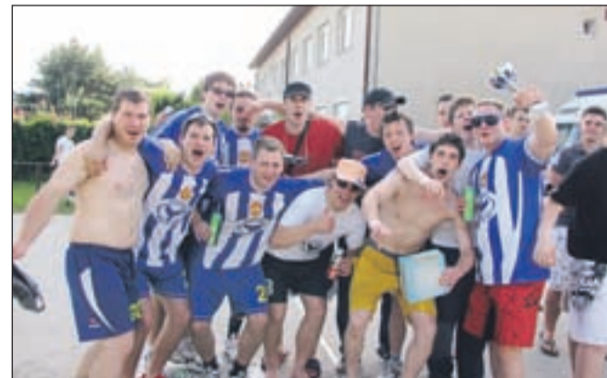
Dupljanski rokometiški so bili drugi.