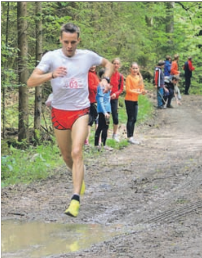
Proga je bila zaradi razmočene podlage nekoliko težja.