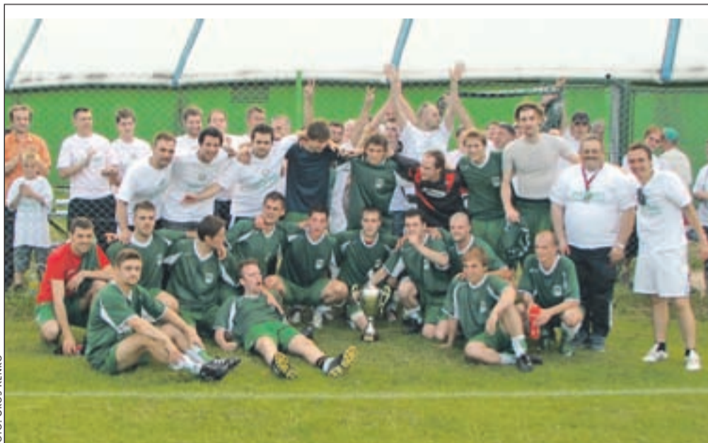
Veseli članske ekipe po osvojitvi naslova gorenjskih prvakov in uvrstitvi v tretjo slovensko ligo

Naklo - Potem ko je članska ekipa nogometašev Nogometnega kluba Naklo z odličnimi predstavami zasluženoma osvojila naslov prvakov v prvi gorenjski nogometni ligi, bo naslednja sezona v marsičem drugačna. Prvič bodo namreč zaigrali v tretji slovenski ligi, to pa predstavlja precejšen zaloga tudi za vodstvo kluba. "Minuli teden smo na Nogometno zvezo Slovenije oddali uradno vlogo za licenciranje in prosili odgovorne na zvezi, da bi se čim prej oglasili pri nas na ogled