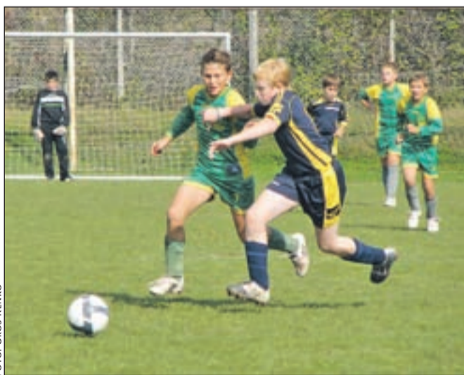
Tudi borbeni igralci v otroških in mladinskih selekcijah na tekmah dosegajo lepe uspehe.