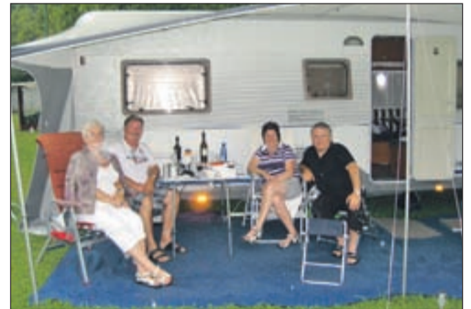
Turisti z Nizozemske so odločeni, da se prihodnje leto spet vrnejo.