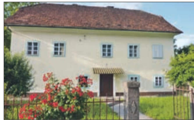
Župnišče v Spodnjih Dupljah načenjajo leta.