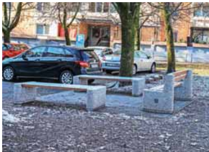
Novo klopi v Ulici Janeza Puharja