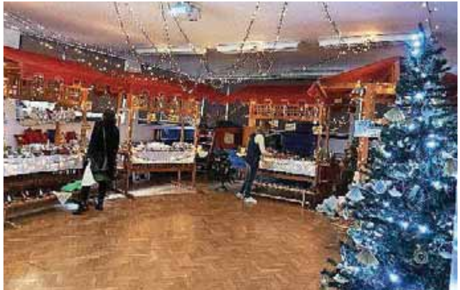
Utrinek s prazničnega bazarja v enoti Mojca

Po vrtcu je zadišalo po cimetu, sveže pečenih piškotih, postavili pa so tudi smrečice. Te so unikatne, okrašene pa z okraski, ki so jih ustvarili malčki. Vsako leto si pričarajo prav posebno in čarobno predpraznično čajanko. Na njej so se jim v vrtcu Sonček pridružili tudi babice in dedki.