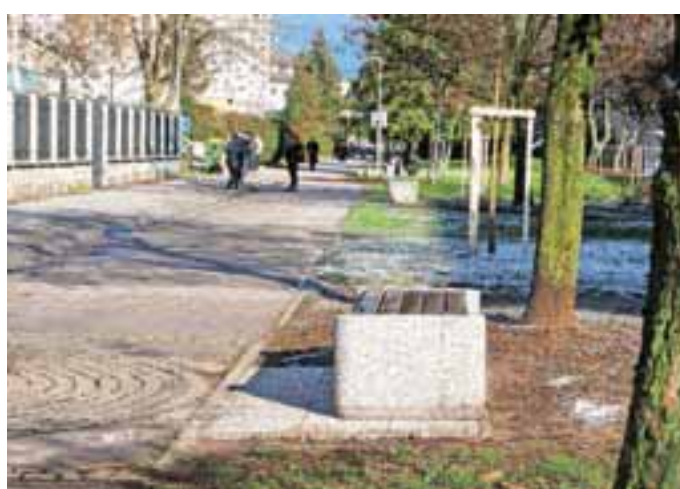
Še več novih klopi / Foto: Tina Dokl, tekst Suzana P. Kovačič