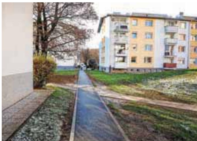
Novoasfaltirana pot v Ulici Gorenjskega odreda