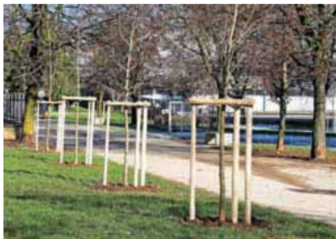
Nova zasaditev v drevoredu v Ulici Gorenjskega odreda