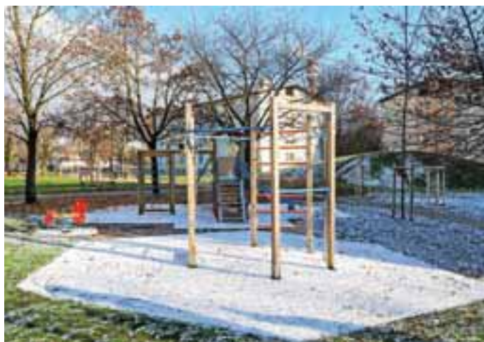
Novo otroško igralo v Ulici Gorenjskega odreda