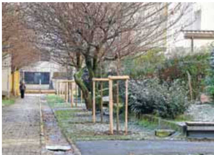
Novo zasaditve v drevoredu v Gogalovi ulici

Del sredstev iz letošnjega proračuna Mestne občine Kranj je bil namenjen investicijam, investicijskemu vzdrževanju, ki se na osnovi sklepa Sveta krajevne skupnosti zagotovijo v posebnem delu proračuna in načrtu razvojnih programov. H kakovosti življenja v KS Planina in KS Huje prispevajo tudi zadnje pridobitve.