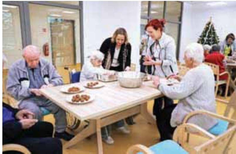
Peka piškotov v kranjskem dnevnem centru za starejše

Kot je še pojasnila Gantarjeva, so cilji doma izvajanje kakovostne oskrbe za starejše, nudenje dodatnih in že obstoječih storitev, kot so dnevno varstvo, začasno varstvo in razvoz kosil. »Še naprej želimo razvijati storitve v domačem okolju, saj je pred nami izvajanje zakona o dolgotrajni oskrbi, ki predvideva ravno prenos storitev v domače okolje,« je dodala, ob tem pa še pojasnila, da z lokalno skupnostjo dobro sodelujejo. Dom namreč obiščejo člani različnih društev, ki s svojimi