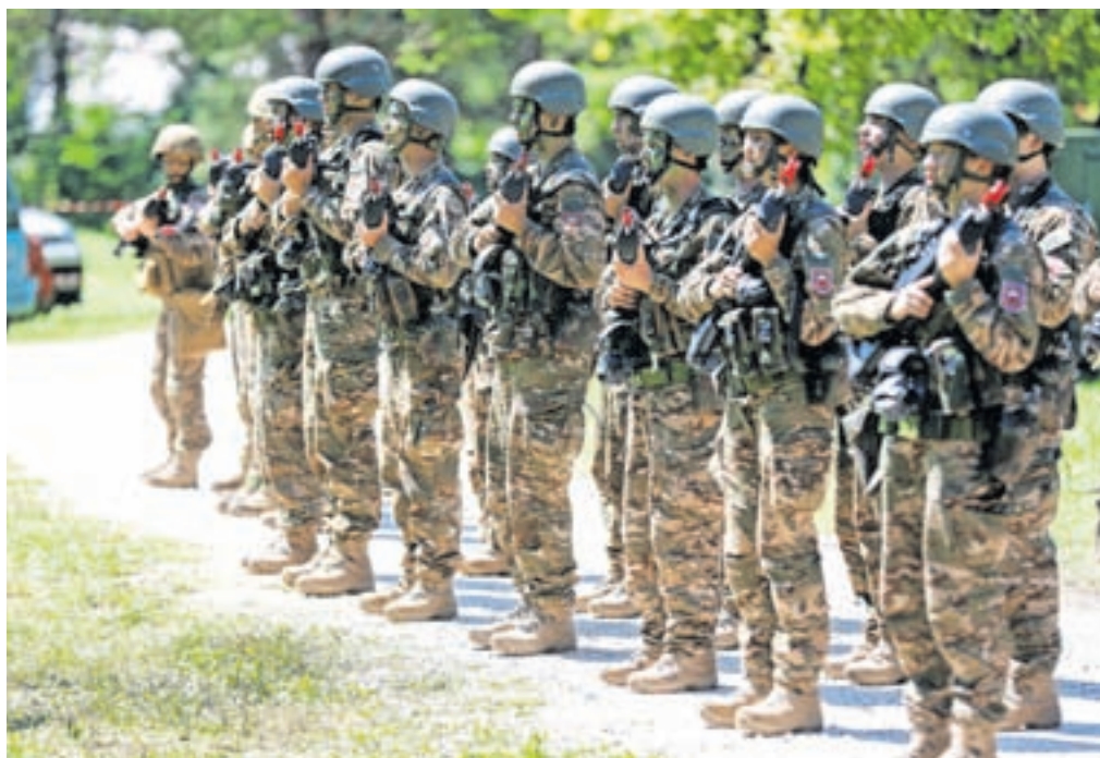
Vojaškega tabora na Bohinjski Beli so se udeležili 104 mladi, ki so želeli spoznati življenje v vojaški uniformi.

liko novih prijateljev, jaz pa sem našla sebe in svojo karierno pot, saj je vojaško življenje postalo moj cilj.«