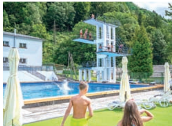
Desetmetrski stolp, ki deluje še naprej, je pa odslej odprt le ob določenih urah, ko za dodatno varnost skrbi reditelj oziroma reševalec iz vode.