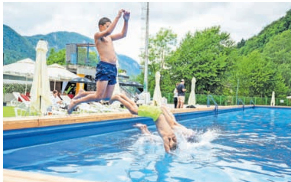
V sredo, 2. avgusta, ob 10. uri so se v prenovljeni bazen pognali prvi najbolj navdušeni mladi kopalci.

Voda v bazenu ima 22 stopinj Celzija, župan pa upa, da bo kopalcem naklonjeno tudi vreme, saj načrtujejo, da bodo kopalno sezono podaljšali do sredine sep-