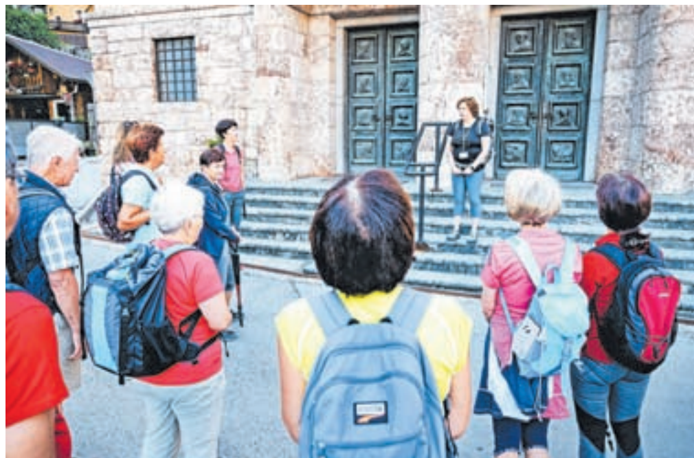
Krožna poletna pot, ki so jo zasnovali letos poleti, se začne in zaključuje na Jesenicah, pohod pa traja približno štiri ure.

prijetne izlete, vsako leto pa pripravijo tudi več brezplačnih vodnih izletov. Letos so