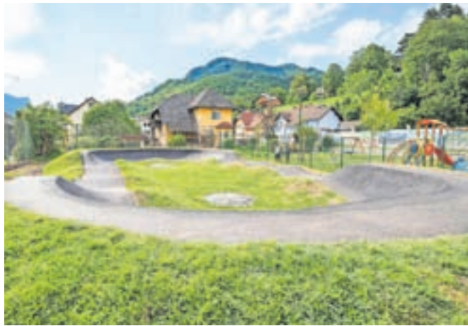
Grbinasti kolesarski poligon še ni dokončno urejen, zato uporaba za zdaj še ni dovoljena.

Uradno odprtje skupaj s projektnimi partnerji načrtujejo konec avgusta oziroma v začetku septembra.