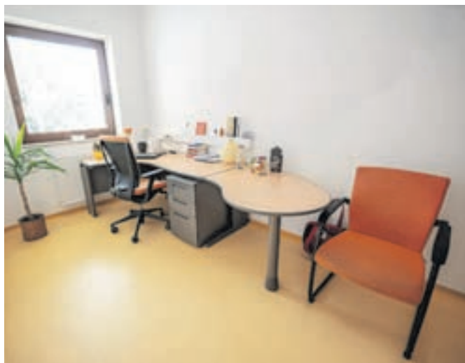
V sklopu projekta bodo ponudili po štiri brezplačna svetovalna srečanja, na katerih bodo mladi dobili pomoč pri premagovanju psihične stiske.