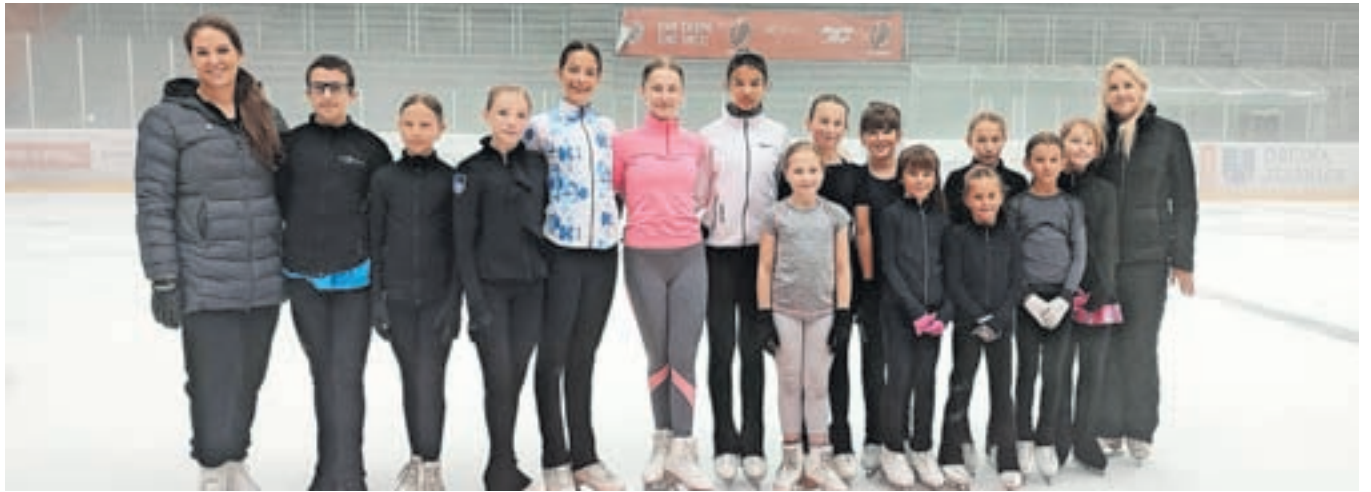
Člani Drsalnega kluba Jesenice na poletnem kampu na jeseniški ledeni ploskvi