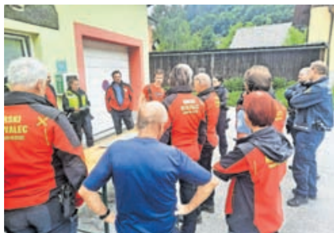
V akciji so sodelovali člani Civilne zaščite, gasilci, gorski reševalci, policisti ...

bi jih izvedli do leta 2025, stali pa naj bi dobrih pet milijonov evrov. Iz študije izhaja, da je treba prioriteto izvesti pregrado ali razbijač na vršaju Koroške Bele, regulacijo in dreniranje izvirske vode, lovilno mrežno pregrado na strugi Čikle in sidranje apnenčaste bloka na plazu Čikla, hkrati pa tudi načrtovanje varovalne vloge gozda. Župan Bohinec je ob tem povedal, da bodo že v tem tednu na vlado naslovili pobudo, naj zagotovi sredstva za čim hitrejšo izvedbo omenjenih ukrepov. Tako bi tudi ob morebitni sprožitvi plazu material uspeli zadržati zadrževalniki nad vasjo.