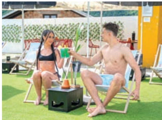
»Plaža« ob bazenu. Z razpisom so izbrali najemnika gostinskega lokala, to je Kavarna Stara Sava, kjer skrbijo za napitke in tudi prigrizke.