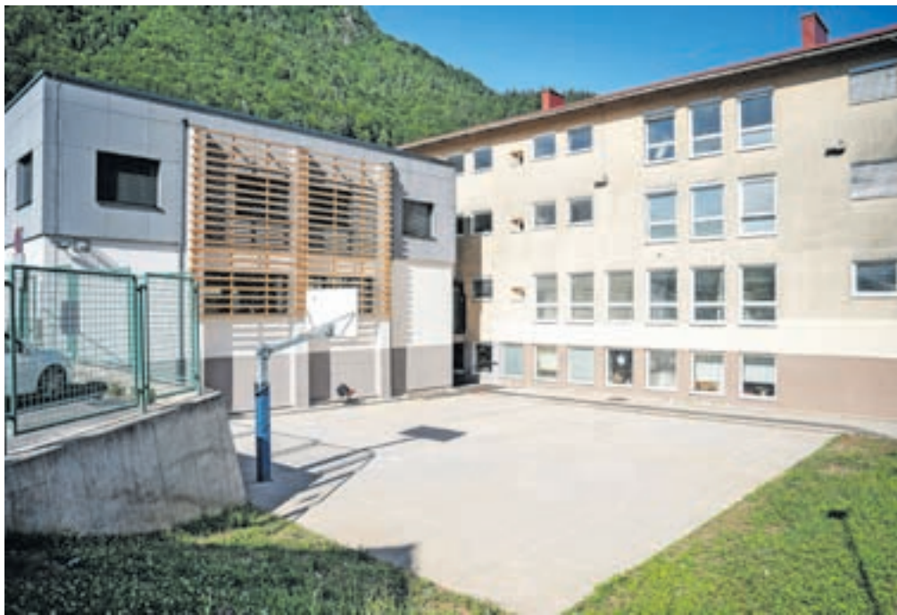
Šola je dobila povsem prenovljeno telovadnico, v nadzidku pa so novi prostori uprave. Ta čas poteka še obnova pritličja same šole. / FOTO: NIK BERTONCEJ

Z začetkom letošnjih šolskih počitnic pa so začeli urejati še pritličje starega dela šole, in sicer učilnice, knjižnico, dnevni prostor, razdelilno kuhinjo z jedilnico, garderobe za zaposlene