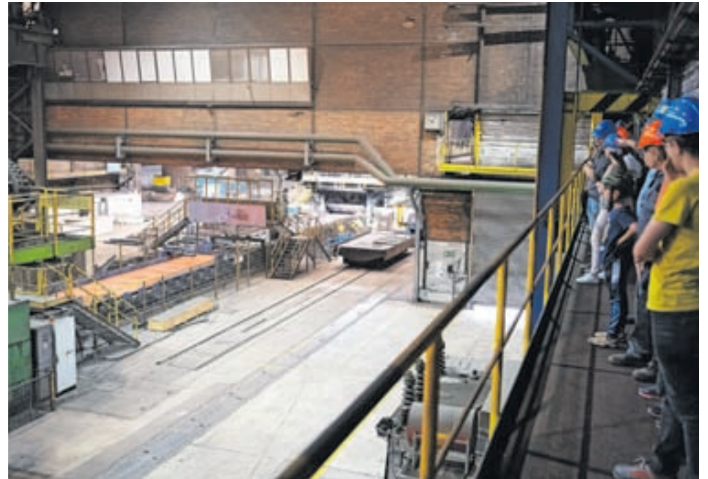
Del proizvodnje bo zaradi poškodbe valjalnega orodja v vroči valjarni tri mesece ustavljen. Fotografija je simbolična.

poškodovan noben delavec, pomemben del proizvodnje ustavljen za predvidoma tri mesece. Dogodek bo povzročil večjo gospodarsko škodo v poslovanju, so povedali. SIJ Acroni in Skupina SIJ imata sicer sklenjeno ustrezno zavarovanje za tovrstna tveganja. Odpuščanje zaposlenih ni predvideno, so zagotovili. »Glede na visoko razpoložljiva likvidna sredstva ter