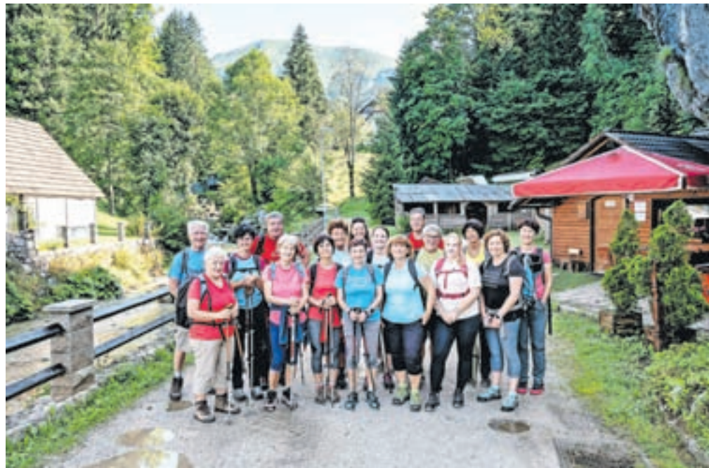
Pohodniki so preživeli aktivno julijsko dopoldne v naravi. V avgustu in septembru bosta potekala še dva brezplačna vodena izleta.