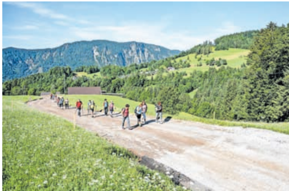
Pot je speljana po Stari rudni poti do Prihodov in Planine pod Golico, od tam v Plavški Rovt, vrnitev na Jesenice pa poteka po Trim stezi Žerjavec.