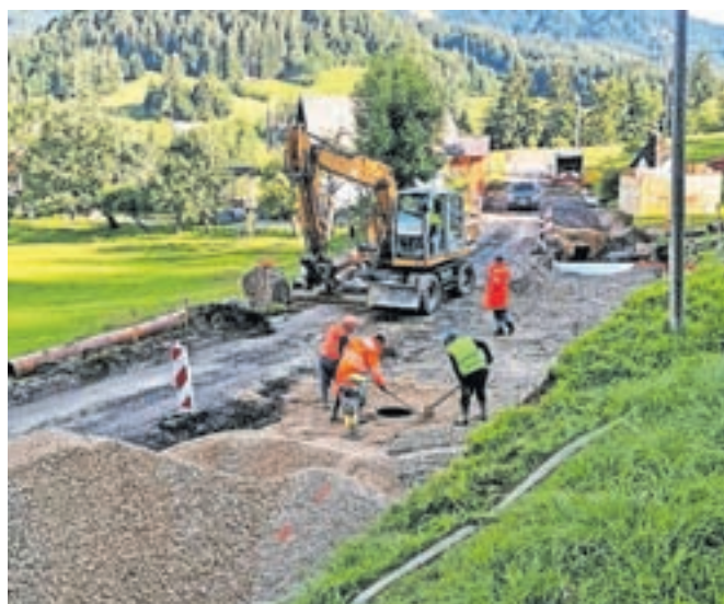
Obnova cesta na Prihodih

razsvetljavo. Projekt pa se letos nadaljuje, v začetku avgusta so začeli obnovo še preostalega dela ceste v dolžini 540 metrov od naselja Prihodi v smeri proti Planini pod Golico do že rekonstruirane ceste. Poleg ceste bosta posodobljeni oz. razširjeni avtobusni postaji ob naselju Prihodi, so pojasnili na Občini Jesenice.