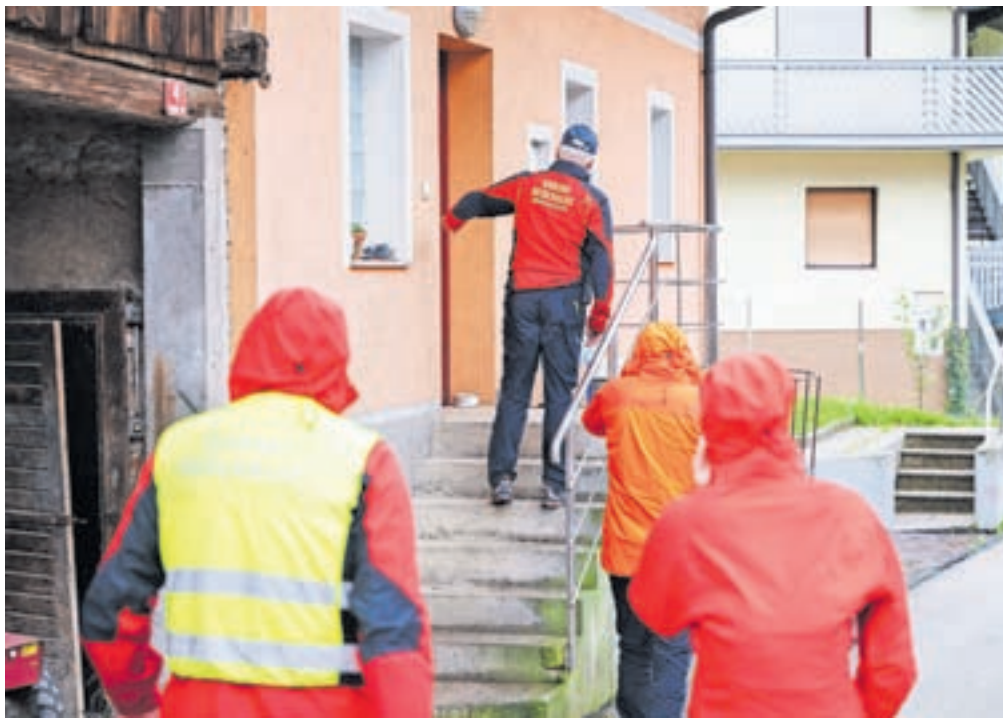
Pri evakuaciji vasi so sodelovale različne službe, med drugim Civilna zaščita, gorski reševalci, gasilci ...

Na predlog krajanov so postavili dodatno mobilno alarmno napravo pri OŠ Koroška Bela, prav tako pa so uredili cesto »mimo hrasta« prek »črnega mostu« za potrebe morebitne evakuacije. Odpravljen je bil ukrep namestitve občanov Koroške