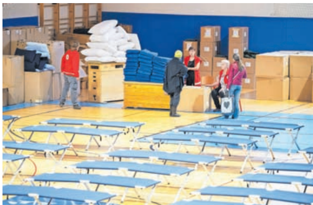
V telovadnici Osnovne šole Prežihovega Voranca so uredili namestitveno točko, v kateri je tri noči preživelo okrog dvajset vaščanov Koroške Bele. Večina je sicer prenočila pri sorodnikih in prijateljih.