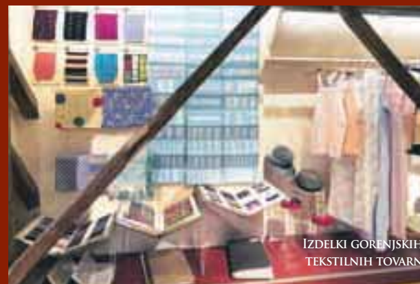
IZDELKI GORENJSKIH TEKSTILNIH TOVARN

NOVA STALNA RAZSTAVA V GRADU KHISLSTEIN V KRANJU