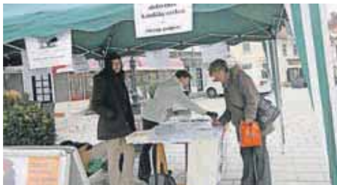
Tudi Kranjčani so se pridružili več kot 17 tisoč podpisnikom, ki so za popolno obdavčitev katoliške cerkve.

Sredi meseca so člani tako imenovane Koalicije za ločitev države in cerkve tudi v Kranju zbirali podpise za petico za popolno obdavčitev katoliške cerkve. Na stojnici, ki so jo postavili nasproti Mlečne restavracije, so pripravili različne materiale, med njimi tudi časopis Razmisli in sodeluj, ki so ga pomenovali časopis za ljudi, ki iščejo resnico. "Odziv v Kranju je bil dober. V dveh dneh smo na stojnici dobili preko petsto podpisov, povečalo pa se je tudi podpisovanje petici-