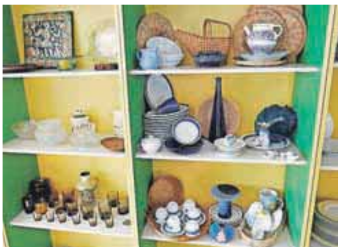
Na vrtu v Pristavi imajo že trgovino z obnovljenimi izdelki, podobno nameravajo odpreti v središču Kranja, prav tako pripravljajo tudi spletno trgovino.

Socialno podjetje v Domu Vincenca Drakslerja v Pristavi pri Trziču je tako imenovani »reuse« center, saj se ukvarjajo z obnavljanjem rabljenih predmetov, poleg tega pa v podjetju izdelujejo tudi nove predmete.