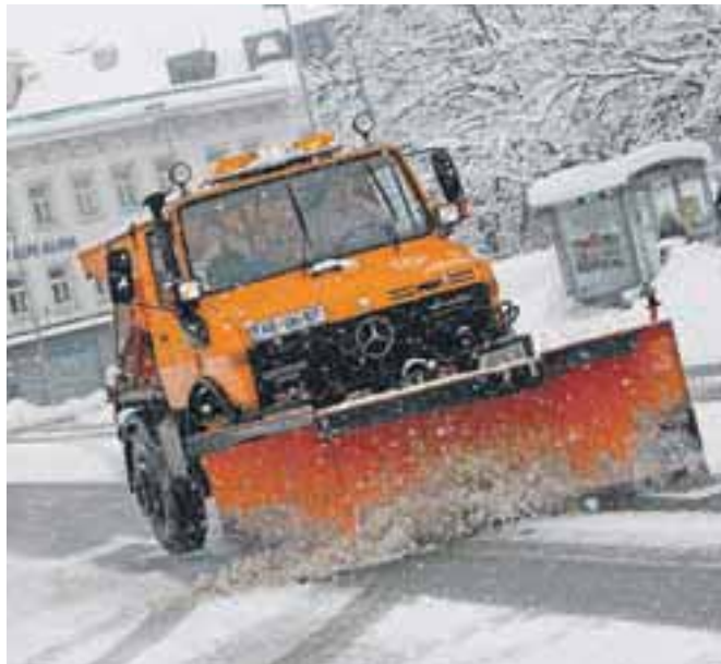
Pri Komunali Kranj so v tej zimi plužili večkrat kot v obeh prejšnjih skupaj.