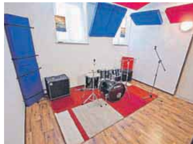
Na starem Bazenu je zaživela sodobno opremljena Glasbena soba.

tov ter ostalih kulturnih prireditev. Vsi ljubitelji rocka bodo tako prišli na svoj račun v soboto, 30. marca, ko na Bazenu prihaja legendarna skupina Big Foot Mama, za energično atmosfero pa bosta poskrbela tudi lokalna benda Applesauce Lorraine ter The Vast Blasts. 13. aprila bo uspešnice liverpoolske četverice predstavila skupina Help! A Beatles Tribute, za trde tehno ritme pa bo 19. aprila poskrbel nizozemski DJ Ritz Lee. V četrti izdaji Bazena smeha bodo 20. aprila občinstvo v dobro voljo spravljali Perica Jerković, Admir Baltič in Uroš Kuzman.