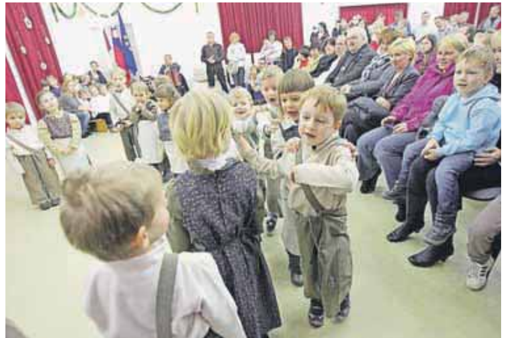
Otroci so se z nastopom pod mentorstvom strokovnih delavk več kot izkazali, predvsem pa dobili veliko bogatega znanja iz zakladnice ljudskega izročila.