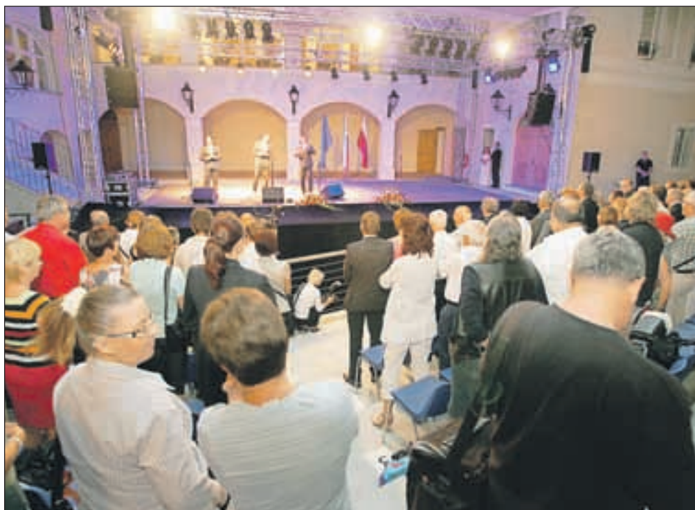
Letno gledališče že živi s prireditvami, ob slovesnem odprtju pa je obiskovalce z nastopom razveselil trio Eroika.

Sicer pa je vrednost del pri obnovi gradu Khislstein nekaj več kot 8,7 milijona evrov (od tega 2,8 nepovratnih evropskih sredstev), investicija v projekt, imenovan Trije stolpi, pa je nekaj več kot 2,1 milijona evrov, od tega je bila v višini nekaj