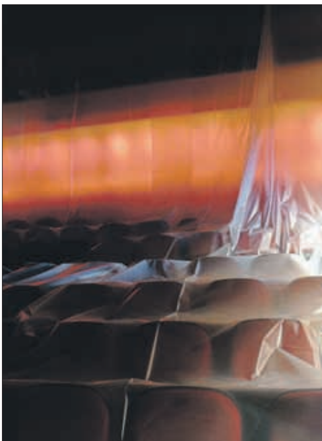
Nekoliko nevsakdanji pogled v dvorano Prešernovega gledališča ponujajo z zaščitno folijo prekrite sedeži, v delu je namreč prenova odrskih vlakov.