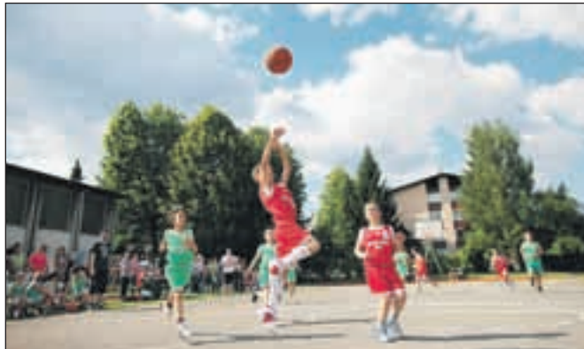
V košarki so tekmovali šolarji iz OŠ Simona Jenka in OŠ Franceta Prešerna.