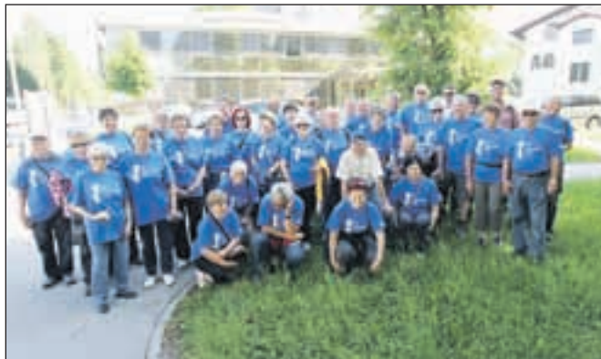
Udeleženci dopoldanskega pohoda po krajevni skupnosti Vodovodni stolp