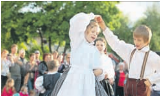
Obiskovalci so si lahko ogledali tudi kulturno-zabavni program.