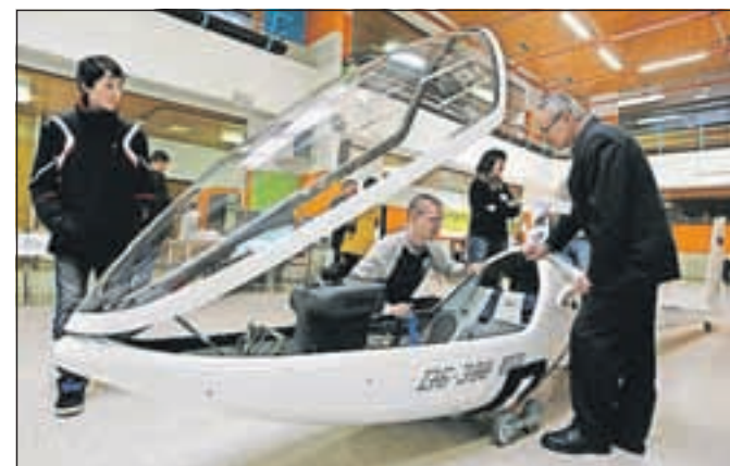
Informativni dan v Tehniškem šolskem centru Kranj