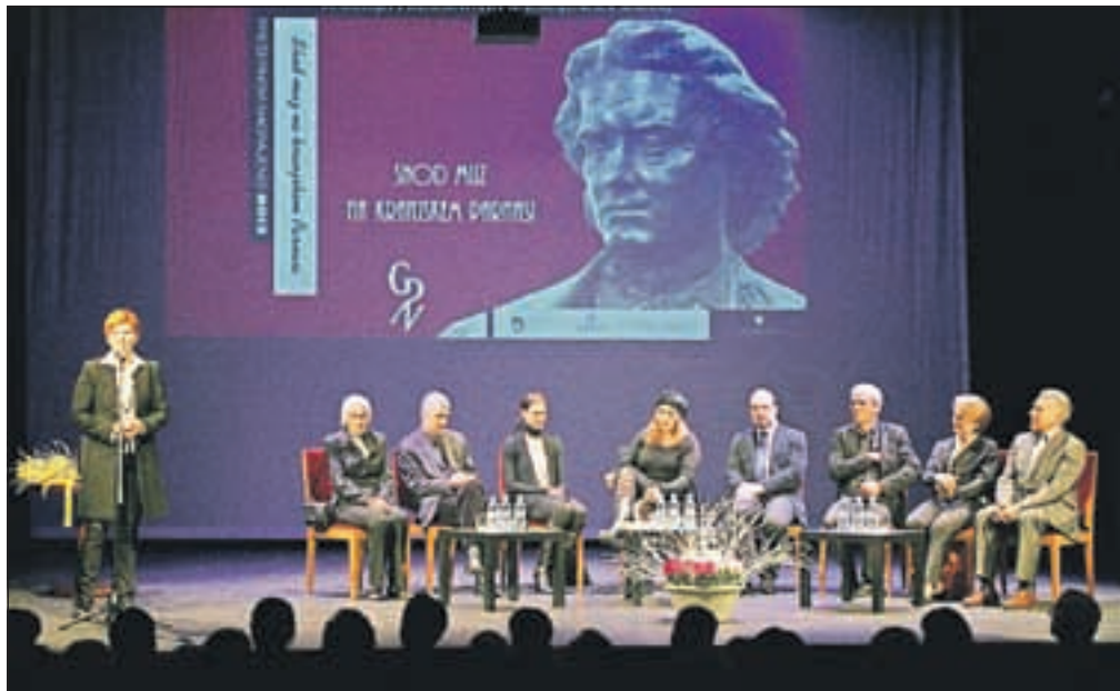
Tretji po vrsti "shod muz" se je letos prvič odvijal v eni osrednjih kranjskih kulturnih ustanov Prešernovem gledališču.

Voditeljica pogovora je uvodoma prebrala poslanici obeh dobitnikov velike Prešernove nagrade za življenjsko delo ilustratorke Marlenke Stupice in pisatelja Zorka Simčiča , ki se srečanja nista mogla udeležiti. Slednji je med drugim povedal, da ima, vse odkar se je vrnil v Slovenijo, na steni uokvirjeno Prešernovo pesem Pevcu in vse nagrajence označi za iskalce resnice, kar vsak počne na svoj način, skozi glas, gib, na filmsko platno prevod ali pisanje. »Ni iluzija, če rečem, da pričakujem, da se bodo vremena Kranjcem zjasnila.« Za Marlenko Stupico ima Kranj poseben pomen, saj je njen stari oče tu delal kot gradbenik, je zapisala in dodala, da je v otroštvu imela dve hrepenenji, tako veliki, da se spominja, kako jo je bolela duša. Prvo je bila želja, da bi v nedogled listala knjige s slikami, druga pa risanje in slikanje. In ti sta se ji na neki način kasneje uresničili. Naj bo večer šegav, saj umetnost ne sme biti preveč smrtno resna.