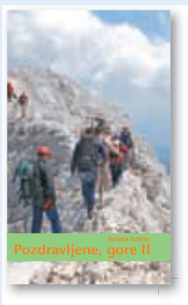
ali knjiga Pozdravljene gore II