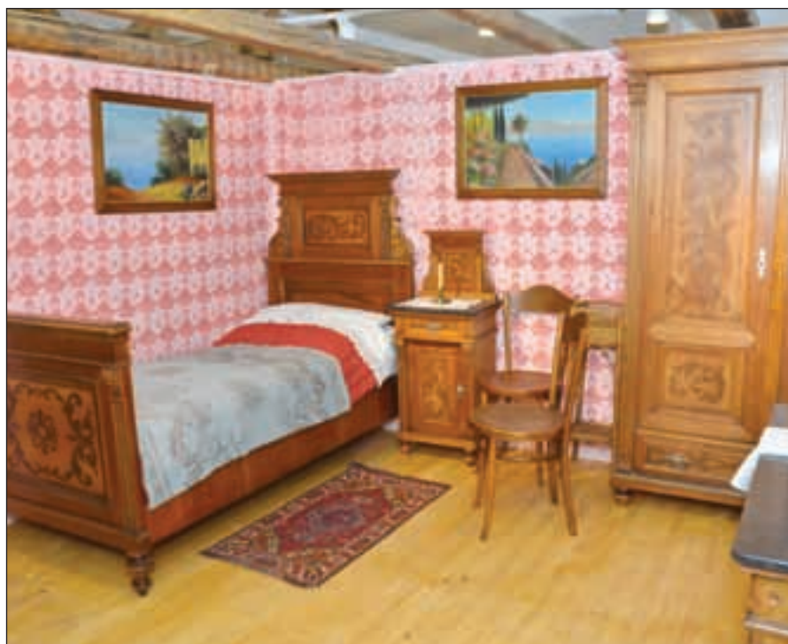
Oprema tujske sobe, ki jo je turistom oddajala družina Budkovič v Bohinjski Bistrici na začetku 20. stoletja.

pridobili kot prve muzejske predmete za naš muzej. Praznovanje naše obletnice bomo začeli 1. marca z etnološko razstavo: Spominjamo se lubenskih čipinarjev.