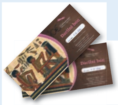
ali darilni bon za refleksoterapijo v vrednosti 20 EUR