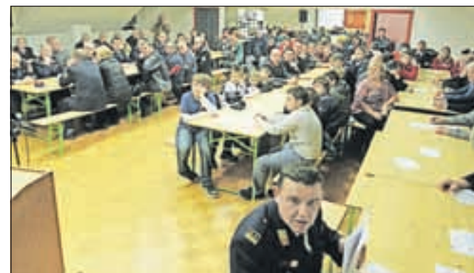
Občinska gasilska zveza je še posebej pohvalila uspešno mentorsko delo v PGD Kranj – Primskovo.