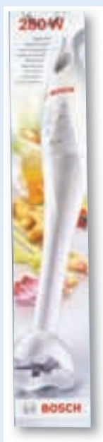
ali palični mešalnik BOSCH