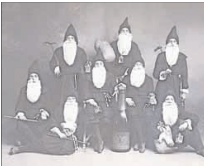
Člani kranjske meščanske družine Sajovic pripravljeni za maškarado najbrž okrog leta 1920