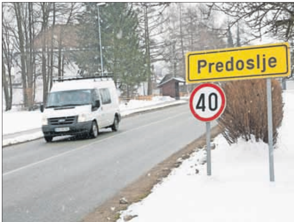
Predoslje svojega imena niso dobile po naključju.

Homoljskem pogorju, ki je prejela svoje ime po tamkajšnjih prerastih. Tudi krajevno ime Perast v Boki Kotorski je dokaj verjetno nastalo z polastnoimenjenjem občnega imena perast, čeprav se ime Perast tradicionalno povezuje z imenom ilirskega plemena