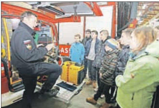
Kranjski poklicni gasilci so pokazali svojo opremo.

Ob nesrečah nikakor ne zganjati panike, ampak se je potrebno umiriti ter skušati pomagati sebi in drugim, je še razložil Skrinjar. »Ko pokličemo na 112, operaterju povemo, kaj in kdaj se je zgodilo, koliko je poškodovanih, kje je lokacija nesreče, pa tudi kdo kliče,« je pojasnil. V kranjskem centru za obveščanje sicer na dan sprejmejo 250 do 260 klicev, intervencije pa so potrebne približno v tretjini