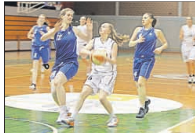
Košarkarice Triglava (v belih dresih) so se po porazu s Celjankami poslovile od pokalnega tekmovanja, sedaj pa jih čaka boj za naslov državnih prvakinj.