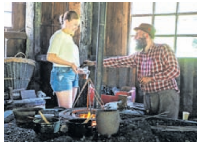
Kako so se nekdanji kovali žeblički, je zanimalo mnoge obiskovalce, ki so prišli spoznavat kroparsko življenje.

Vsi, ki so se ta dan mudili v Kropi, so se lahko spoznali z življenjem, ki so ga nekdanji živeli Kroparji. Svoja vrata so na široko odprle Fovšaritnica, Kovaški muzej, vigenjca Vice, tovarna Novi Plamen, tovarna UKO, Galerija mozaikov, na voljo je bila kovaška malica, tako da je bilo mogoče začutiti pravi utrip kroparskega življenja. V vigenj-