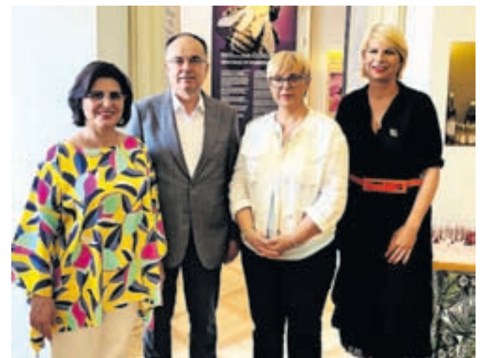
Čebelarški muzej si je ob obisku Slovenije, kjer ga je gostila predsednica države Nataša Pirc Musar, sredi julija ogledal albanski predsednik Bajram Begaj z delegacijo.