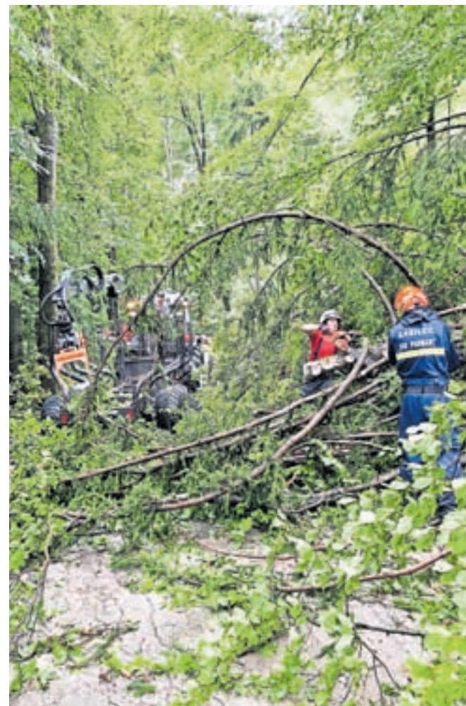
Neurje je prejšnji teden največ škode povzročilo v Lipniški dolini.

Tudi Koselj posebej opozarja, da je podrtih dreves po gozdovih še veliko in da vseh zagotovo še niso niti našli niti odstranili, zato poudarja, da se je treba v gozd tudi v prihodnjih tednih odpraviti zelo previdno. Posebej previdni naj bodo pohodniki in kolesarji.