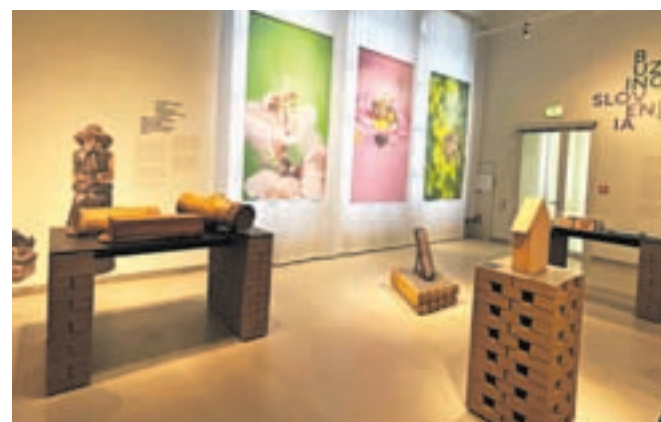
Razstava Buzzer Slovenia v Muzeju evropskih kultur v Berlinu prikazuje tako tradicijo slovenskega čebelarstva kot inovacije s področja urbanega čebelarjenja in trajnostnega oblikovanja.