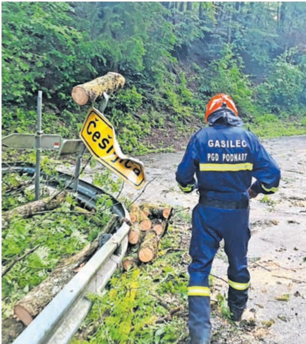
Najbolj je neurje prizadelo območje vasi okoli Podnarta.