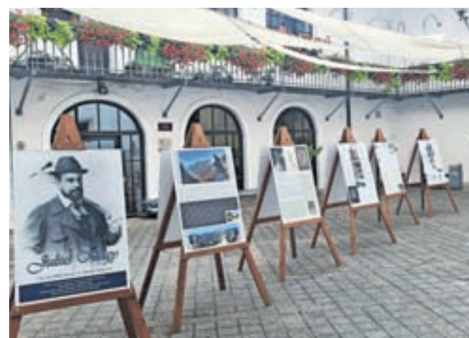
Razstava, posvečena obletnici rojstva Juliusa Kugyja, bo v atriju radovljjskega župnišča na ogled še do sredine avgusta.

Film je bil na ogled v treh delih, prva dva prejšnji teden, zadnji pa v atriju župnišča na Linhartovem trgu danes, 25. julija, ob 20.30. Pri organizaciji sodeluje KUD LIK Naklo.