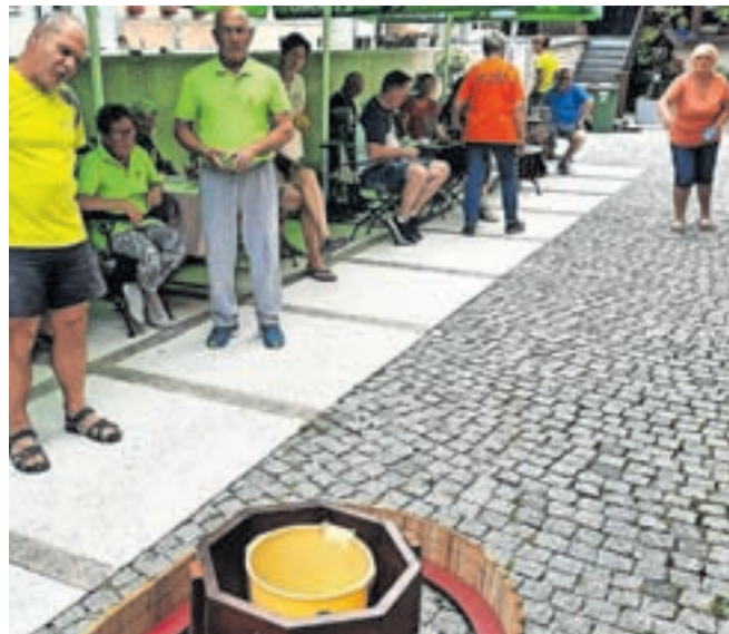
Med in po tekmovanju v prstometu je potekalo še zanimivo tekmovanje v metu v vedro.

V sklopu Kovaškega šmarna sta Društvo upokojencev (DU) Kropa in Prstometna organizacija Slovenije (POS) organizirala turnir mešanih dvojic v prstometu. Tekmovanja se je udeležilo 17 mešanih dvojic, torej skupno 34 tekmovalcev. Tekmovalci so bili razvrščeni v štiri predtekmovne skupine, najboljši štirje iz vsake skupine pa so nadaljevali tekmovanje v izločilnih bojih, je pojasnil Danilo Dornik, referent za šport pri DU Kropa. Razglasitev rezultatov s podelitvijo medalj in pogostitvijo je bila v gostilni Pr' Kovač v Kropi. Prvo mesto in zlato medaljo sta prejela Ani-