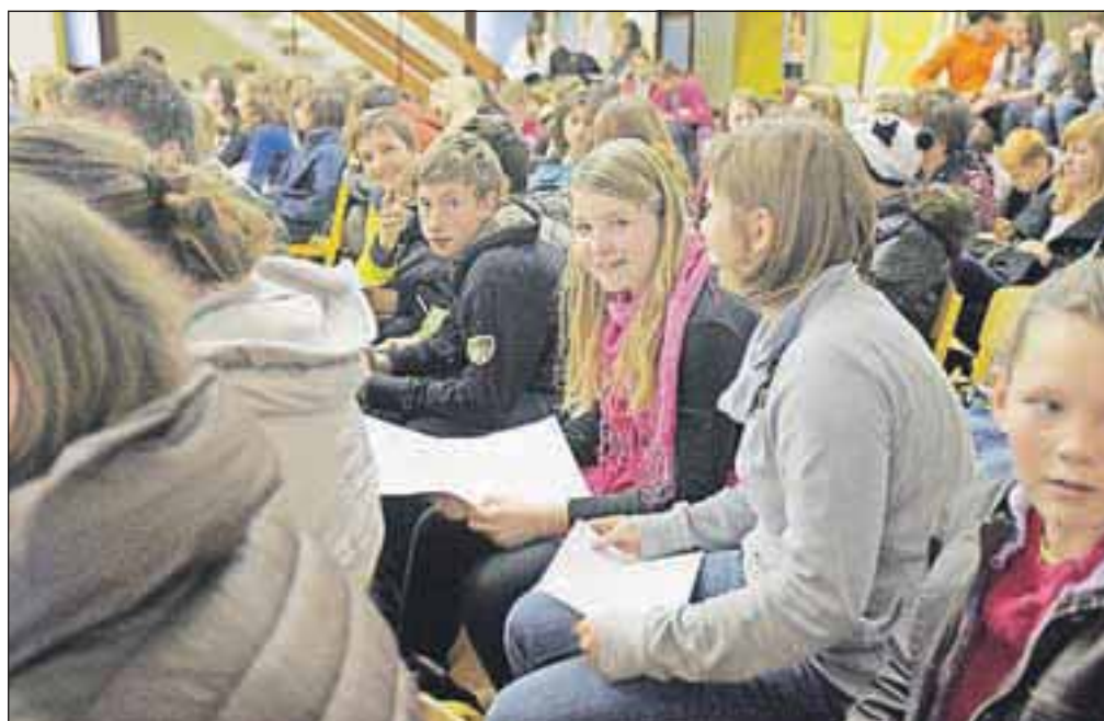
Državno tekmovanje iz biologije na OŠ Naklo