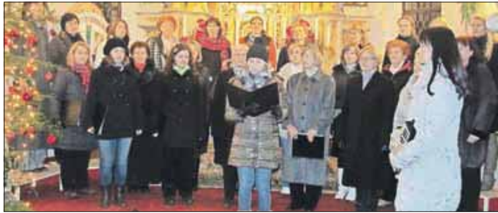
Dupljanske pevke na koncertu v domači farni cerkvi