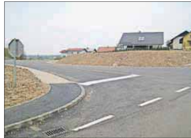
Urejen predel Cegelnice čaka še na igrišče.