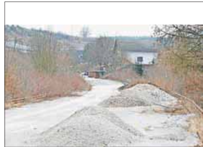
Tudi za območje stare hitre ceste na Bistrici je v načrtu sanacija.