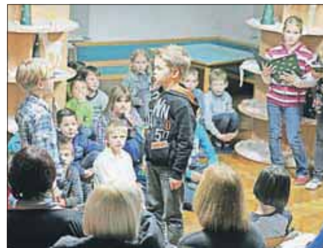
Nastopi učencev so pričarali zadovoljstvo in nasmeh v oči obiskovalcev.

ru zapeli nekaj pesmic, Zaž pa je zaigral na saksofon. Zaplesala so tudi dekleta iz plesne skupine Studio ritem. Program sta povezovali sošolki, Anita in Nika. Učiteljica Mateja Jarc pa je na koncu vsem zaželela lepe praznike in srečno novo leto. Ob koncu uspešne prireditve so nas pogostili s piškotki in bonboni. Ta prireditev je zame zadnja v podbreški šoli, saj jo bom drugo leto pričakala v centralni šoli, zato mi bo še posebej ostala v spominu.