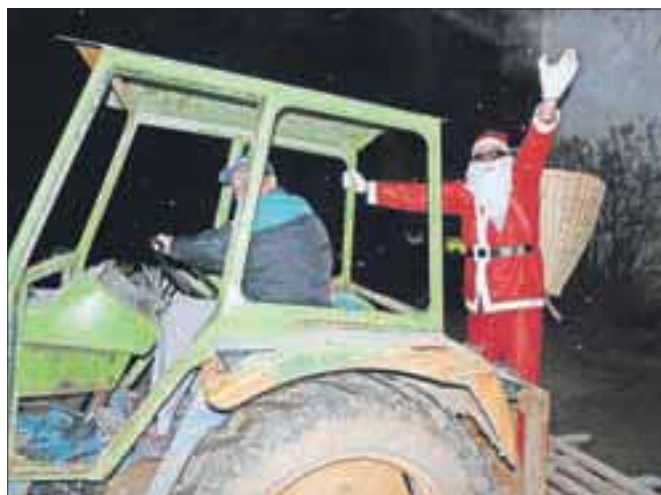
Božička je Frenk pripeljal s traktorjem.