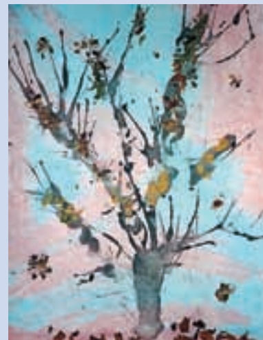
Alja, 1. c