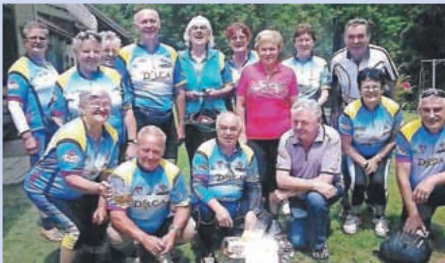
S srečanja kolesarjev v Komendi