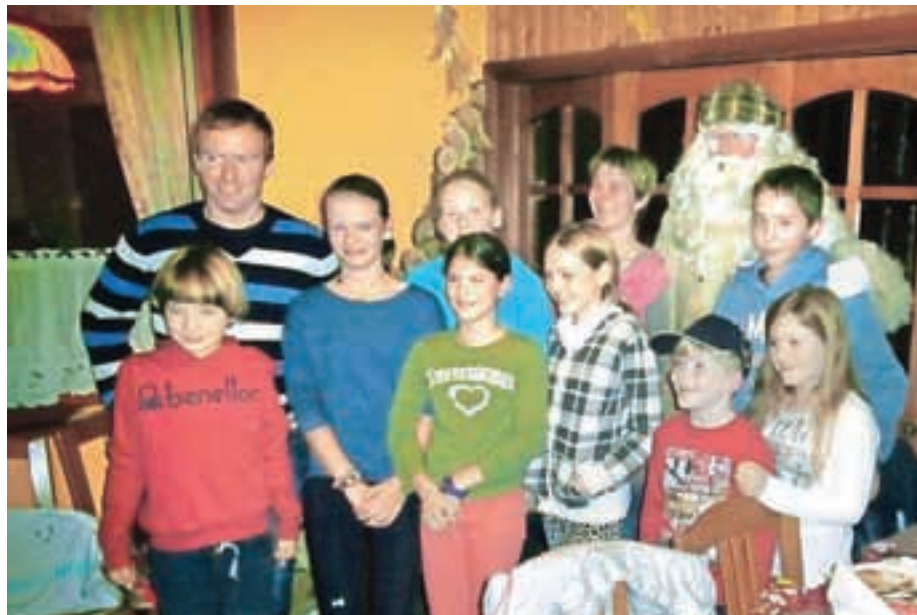
Prišel je dobi, stari Dedek Mraz.

V prvem decembrskem tednu je pretoplo vreme naredilo svoje. Kljub izjemnemu trudu vseh klubov in predvsem organizatorjev SP na Pokljuki je sneg namreč skopnel. To je prisililo organizatorja prve biatlonske tekme in tekme v teku na smučeh, ki naj bi bili prvi konec tedna v decembru, k odpovedi. V upanju na hladnejši december in vsaj nekaj pošiljk snega vsi tekmo-