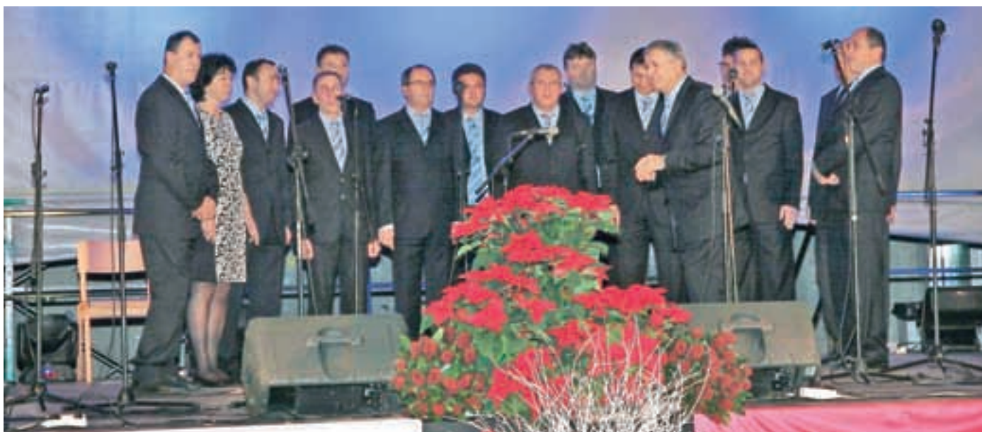
Po enoletnem premoru bodo Kokr'čani aprila 2015 spet pripravili Pevski večer na Kokrici.