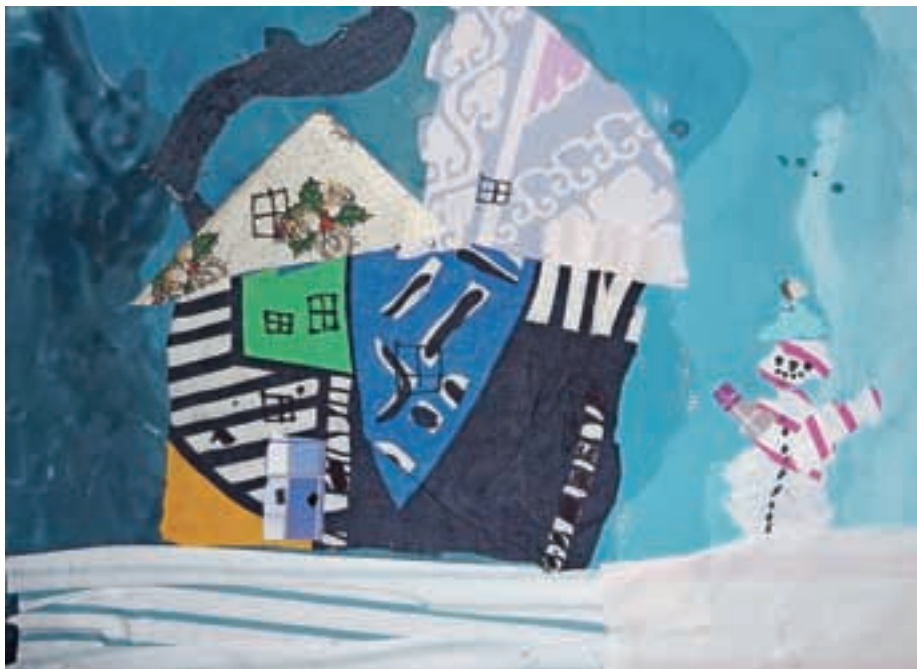
Tomaž, 2. c