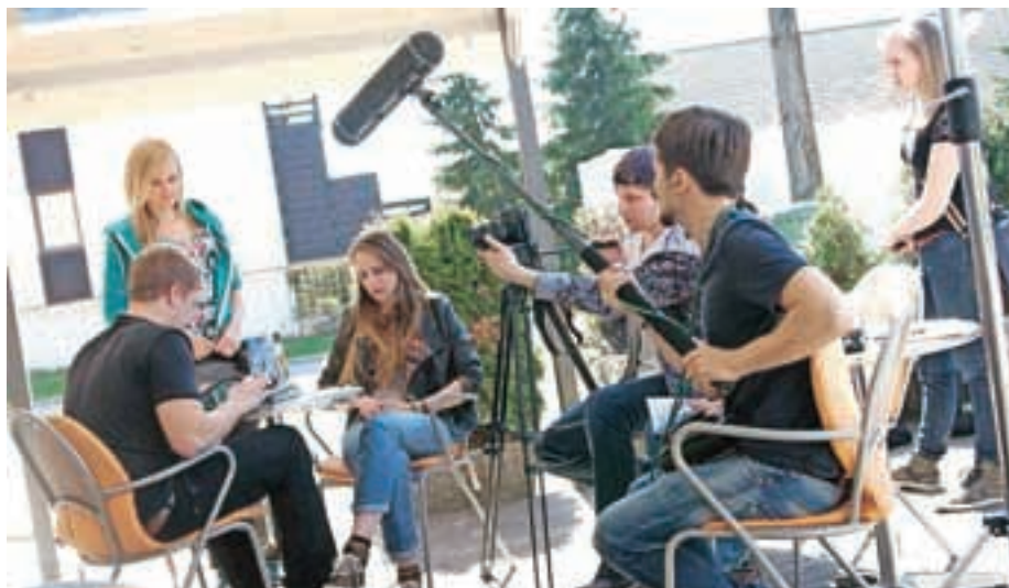
Snemanje na terasi Marocco bara

Zgodba zaplete šest naključnih ljudi različnih profilov in življenjskih filozofij. Hkrati se znajdejo v zaprti sobi. Eni so si bolj simpatični, spet drugi daleč od tega, prav vsi pa bodo morali za izhod iz zagate, tudi zavoljo svojega ponosa, združiti moči in odkriti, na kakšen način so njihove življenjske poti povezane in kako jim to lahko pomaga do svobode. Liki živijo, delajo in ustvarjajo v Kranju, zato so ustvarjalci snemanje postavili na ulice Kranja in okolice. Če imate pozorno oko, boste v seriji prepoznali prizor v lekarni, parkirišče pred Osnovno šolo Franceta Prešerna Kokrica, lokal Marocco bar pa tudi pisarno KS Kokrica. Ker si ustvarjalci radi postavljajo živahne izzive, so v projekt vpeljali poseben igralsko-režijski pristop. Pri-